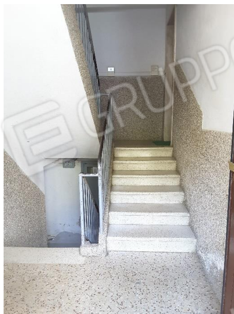
Vista scala comune condominiale per accedere all'appartamento (oggetto di pignoramento) posto al piano terzo del fabbricato condominiale