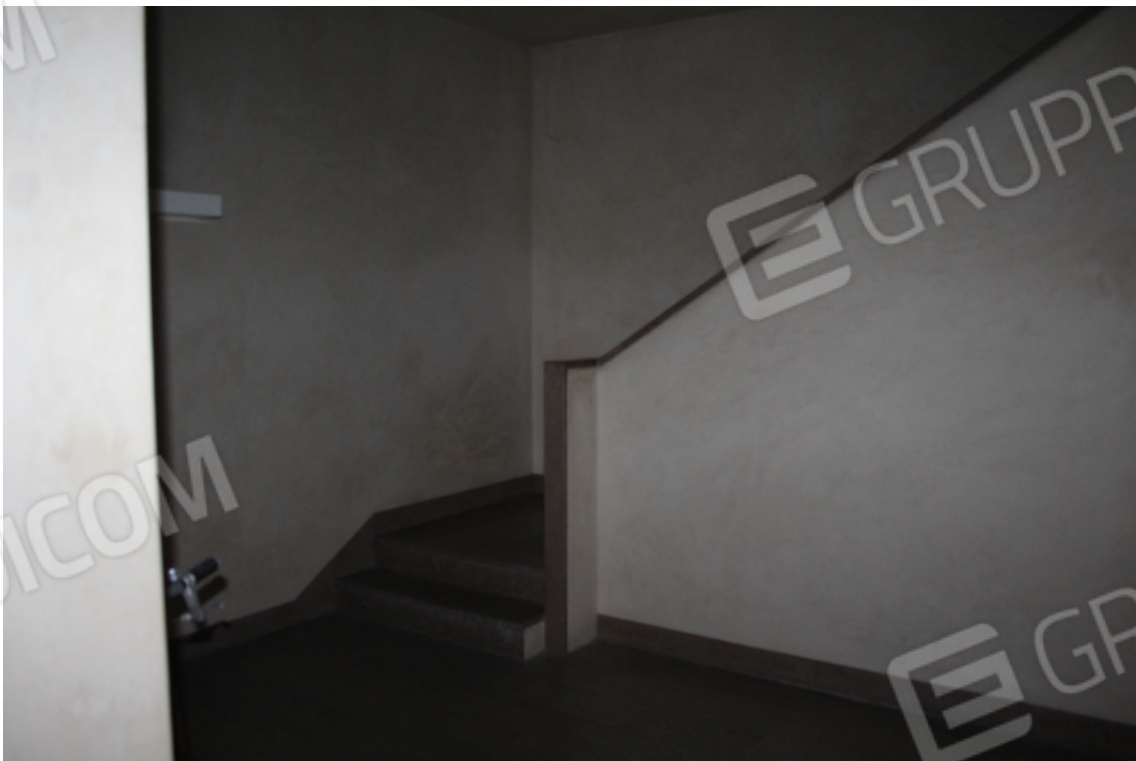
vano scala comune