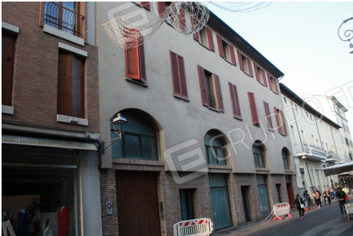
Vista esterna del fabbricato dalla pubblica Via delle Torri