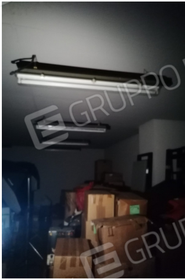
deposito piano seminterrato