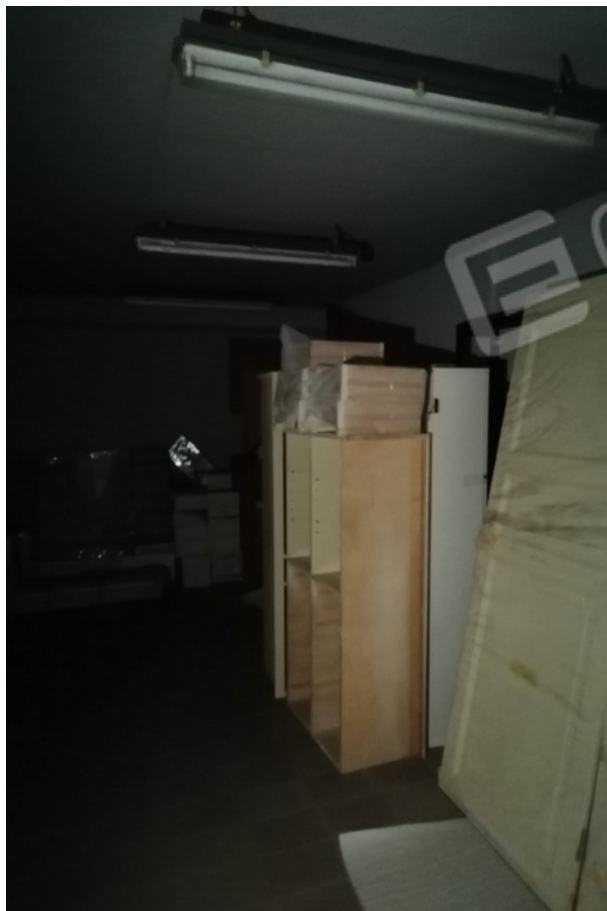
deposito piano seminterrato