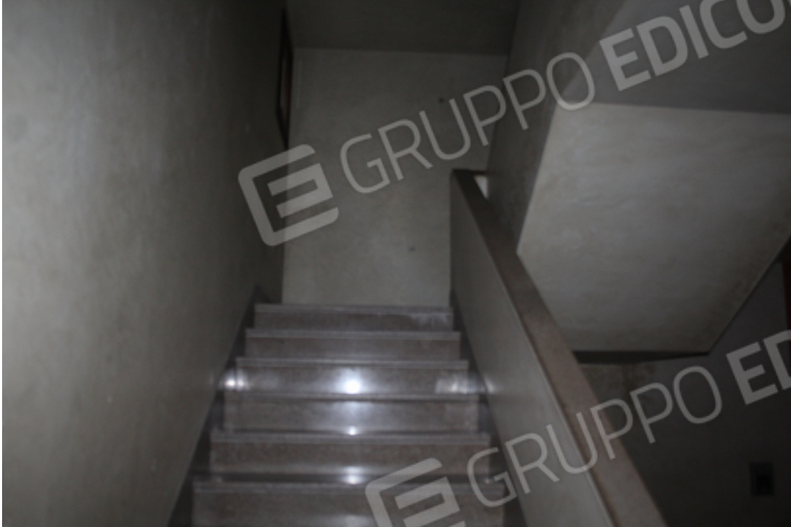
vano scala comune