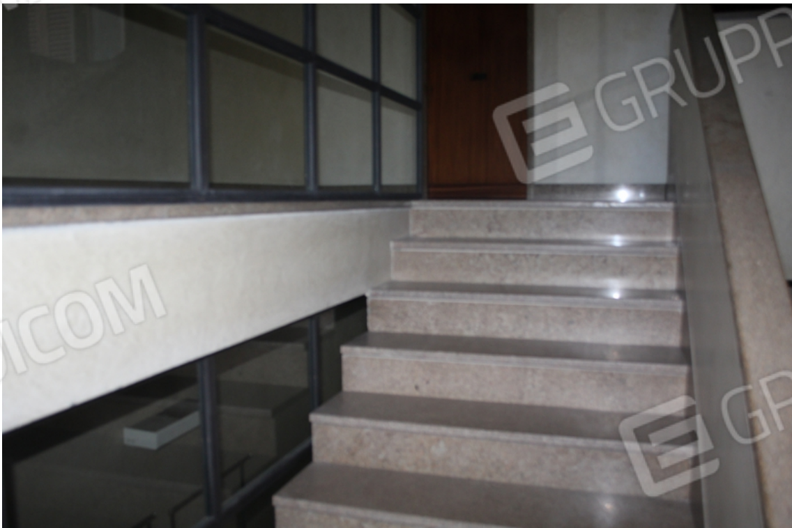
vano scala comune