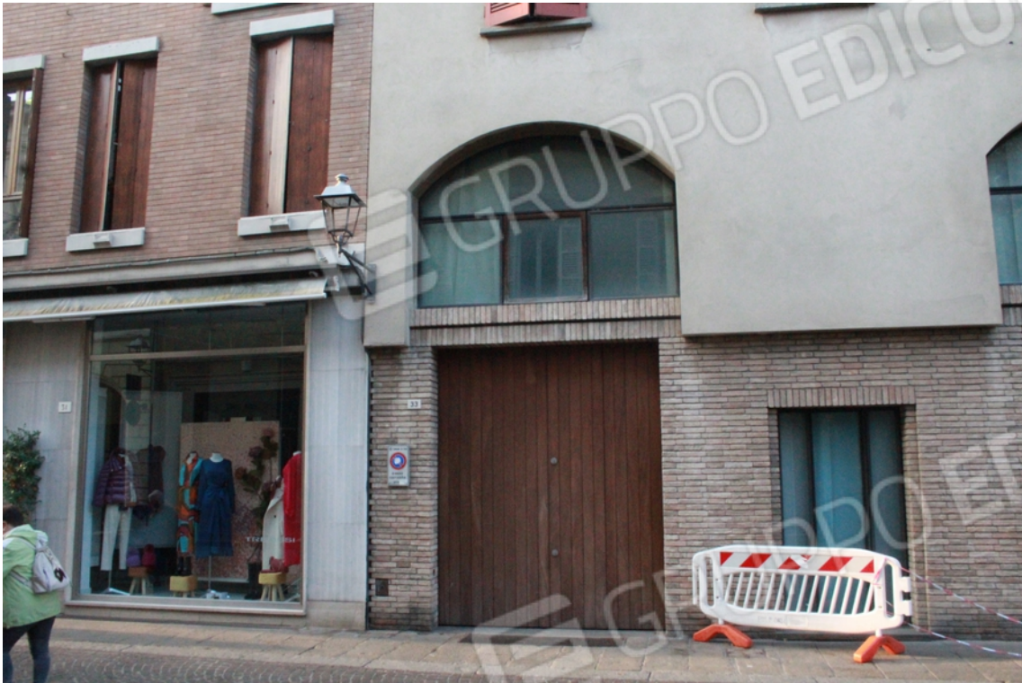
Ingresso del fabbricato dalla pubblica Via delle Torri