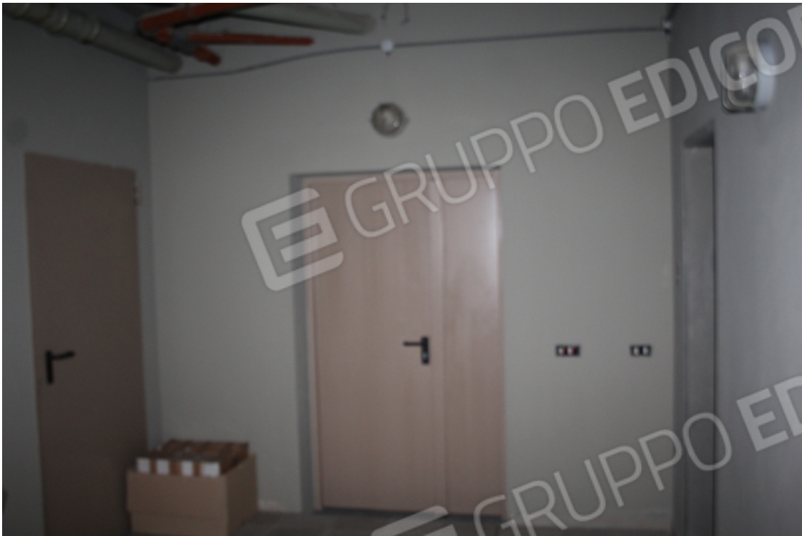
ingresso deposito piano seminterrato