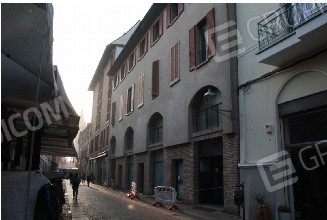
Vista esterna del fabbricato dalla pubblica Via delle Torri