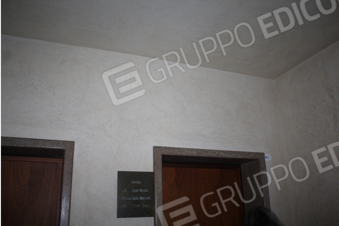
ingresso studio piano primo interno 3