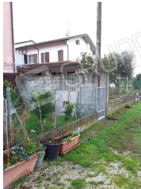
Vista accesso carrabile in confine con la particella 75; e vista accesso pedonale in confine con la particella 74