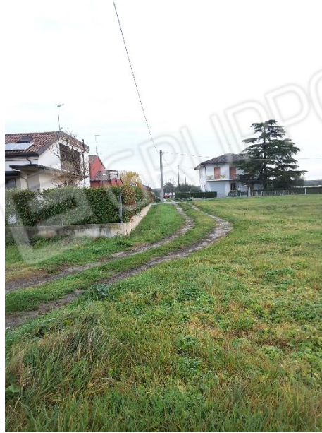
Vista delimitazioni del terreno sul lato in confine con la proprietà delle particelle 38, 957 e 958