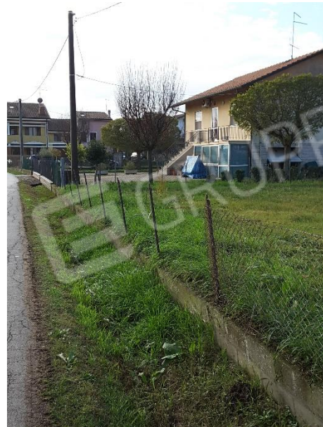
Vista delimitazioni del terreno su via Rino Bagnoli

-Geom. Galassi Giampiero- Via Giordano Bruno n° 160-Cesena (FC) Mail: geom.galassi@virgilio.it Pec: giampiero.galassi@geopec.it