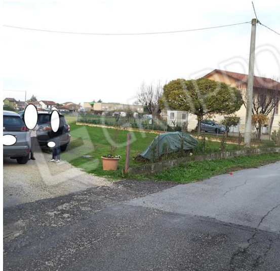
Vista accesso al terreno da via Rino Bagnoli