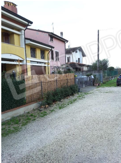
Vista delimitazioni del terreno sul lato in confine con le proprietà particelle 75, 74, 301 e 793