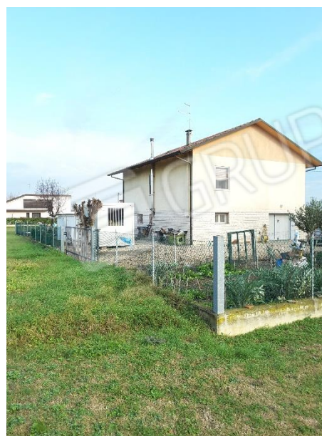
Vista delimitazioni sul lato interno a confine con la proprietà delle particelle 715 e 716