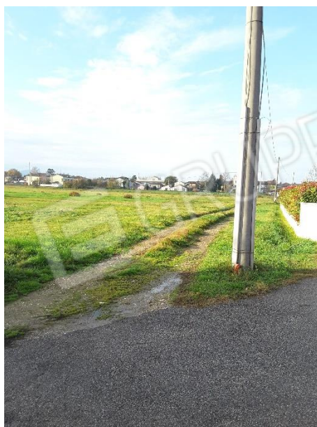
Vista di un palo in cemento per l'energia elettrica in corrispondenza della strada (via Susa) in confine al terreno