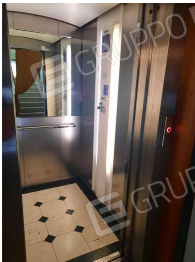
30 – P2 – VISTA ASCENSORE