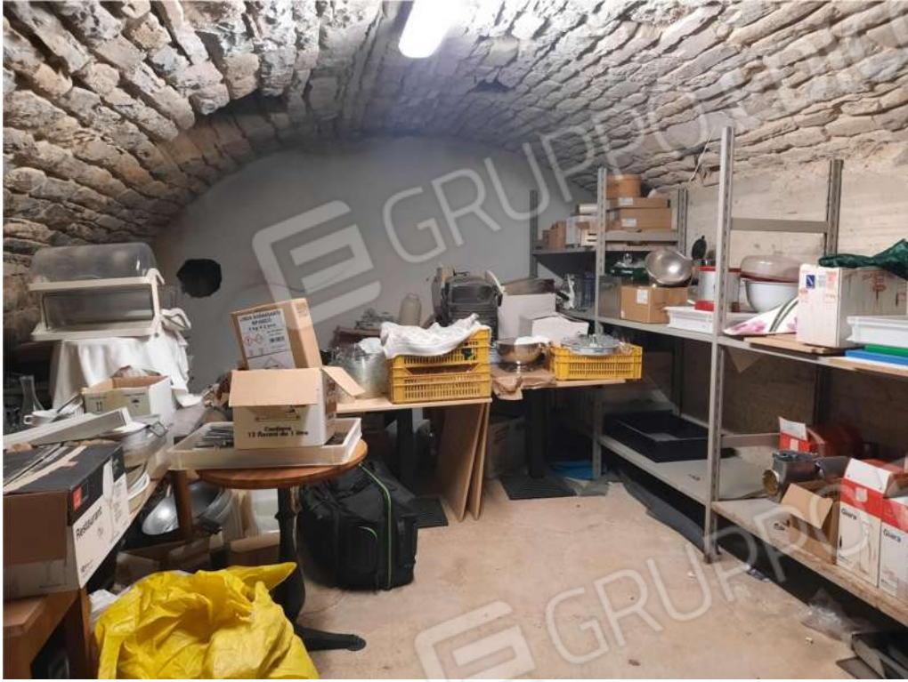
7- PS1 – RIPOSTIGLIO