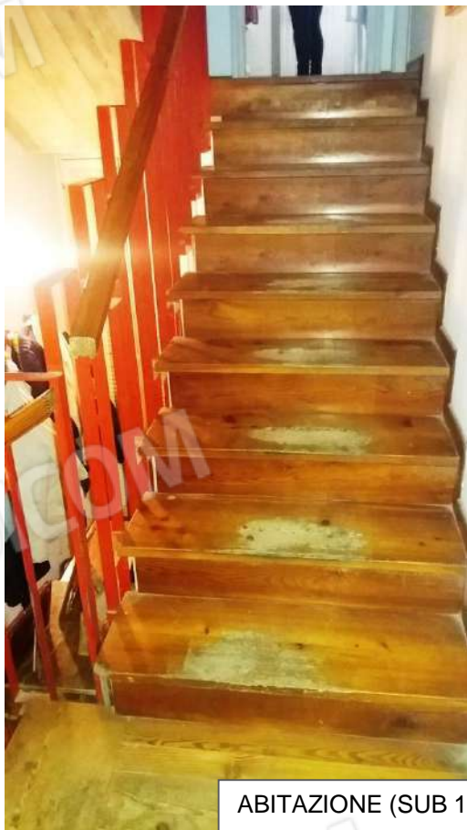
ABITAZIONE (SUB 1) SCALA - BAGNO PRIMO PIANO