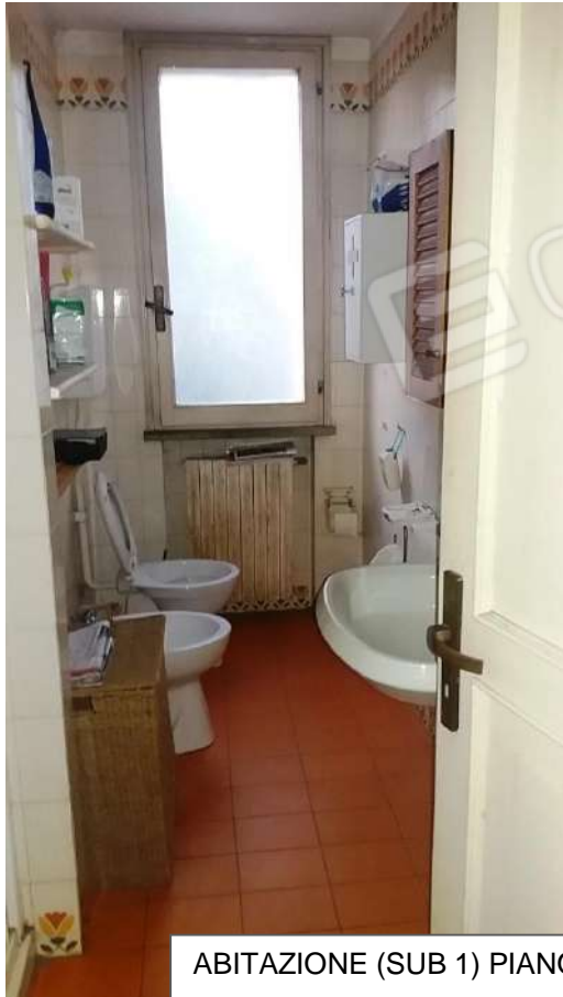
ABITAZIONE (SUB 1) PIANO TERRA: BAGNO E LAVANDERIA