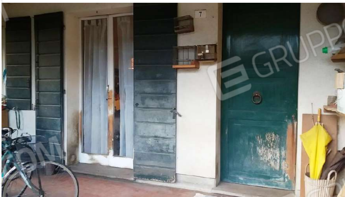
PORTICO E INGRESSO PRINCIPALE ABITAZIONE