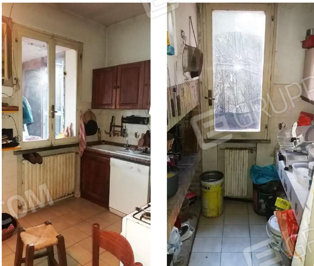
ABITAZIONE (SUB 1) PIANO TERRA – CUCINA/PRANZO E DISPENSA