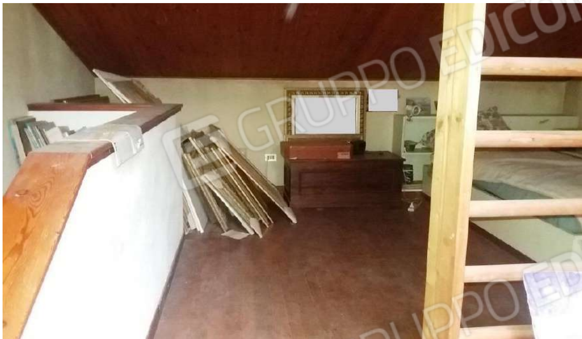
ABITAZIONE (SUB 1) PIANO PRIMO/AMMEZZATO: SOFFITTA/SGOMBERO CON SERVIZIO IGIENICO