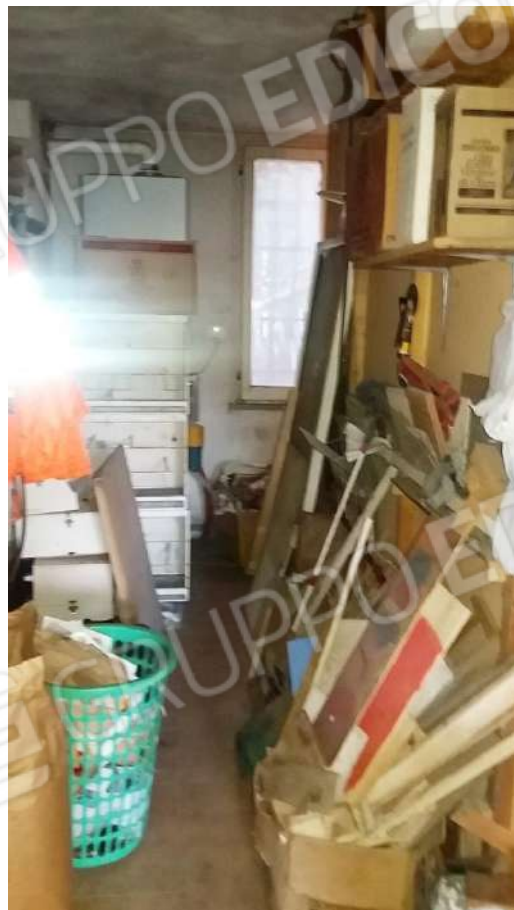
GARAGE (SUB 2) ESTERNO - LATO EST E VISTA INTERNA