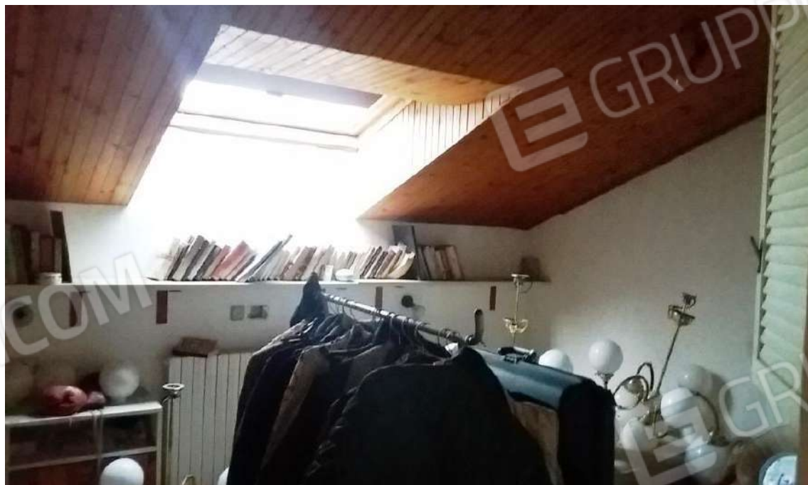
ABITAZIONE (SUB 1) PIANO PRIMO – CAMERA CON SOFFITTA