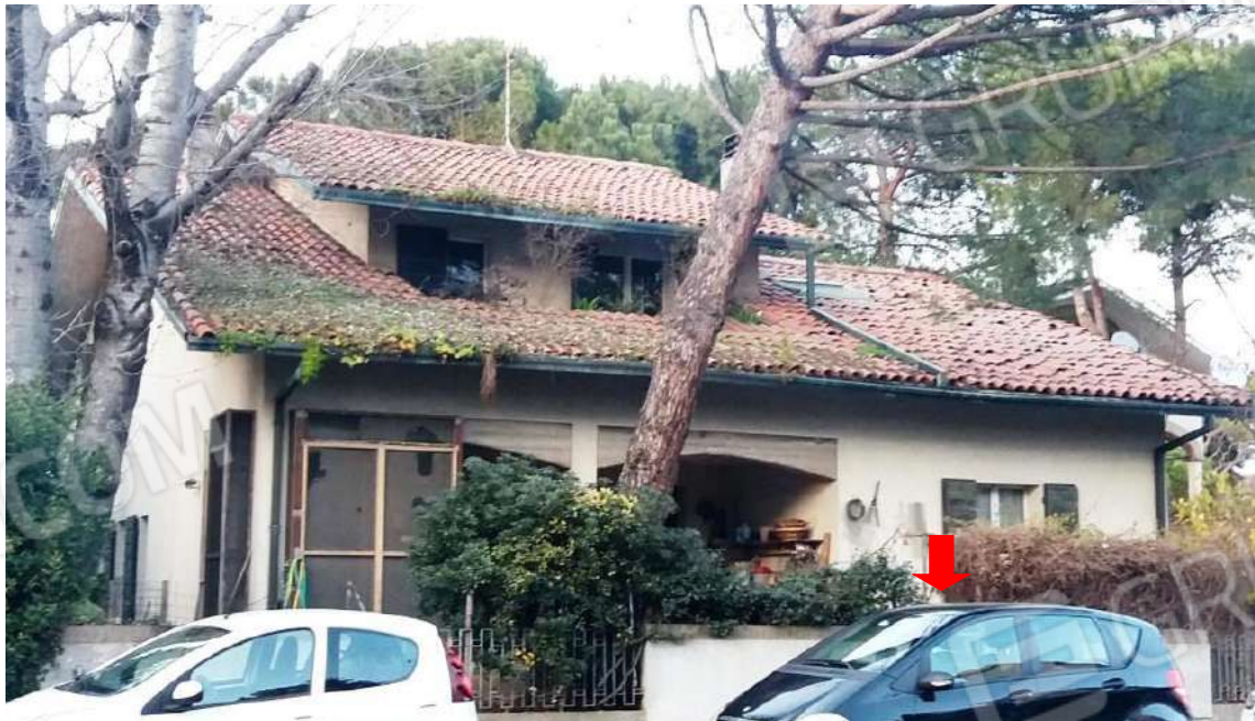
PROSPETTO LATO SUD – LATO INGRESSO PEDONALE