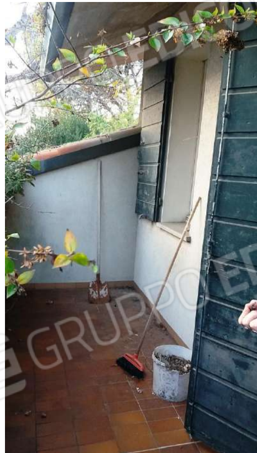
ABITAZIONE (SUB 1) PIANO PRIMO – CAMERA E BALCONE