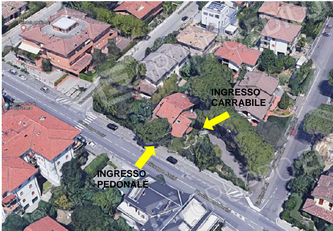
IMMAGINE SATELLITARE – INQUADRAMENTO – VISTA 3D UBICAZIONE DEL FABBRICATO: VIA G. BOVINI N. 7 (RA)