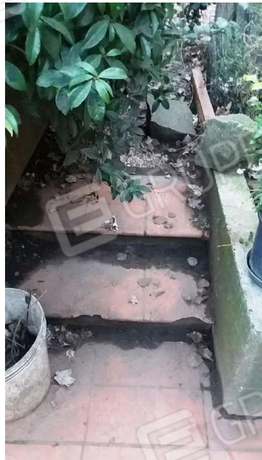
PARTICOLARI: PORTICO DI INGRESSO E VIALETTI NEL GIARDINO