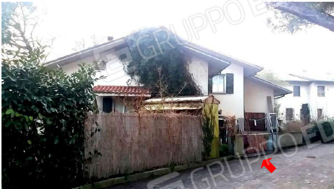
PROSPETTO LATO EST – LATO INGRESSO CARRABILE