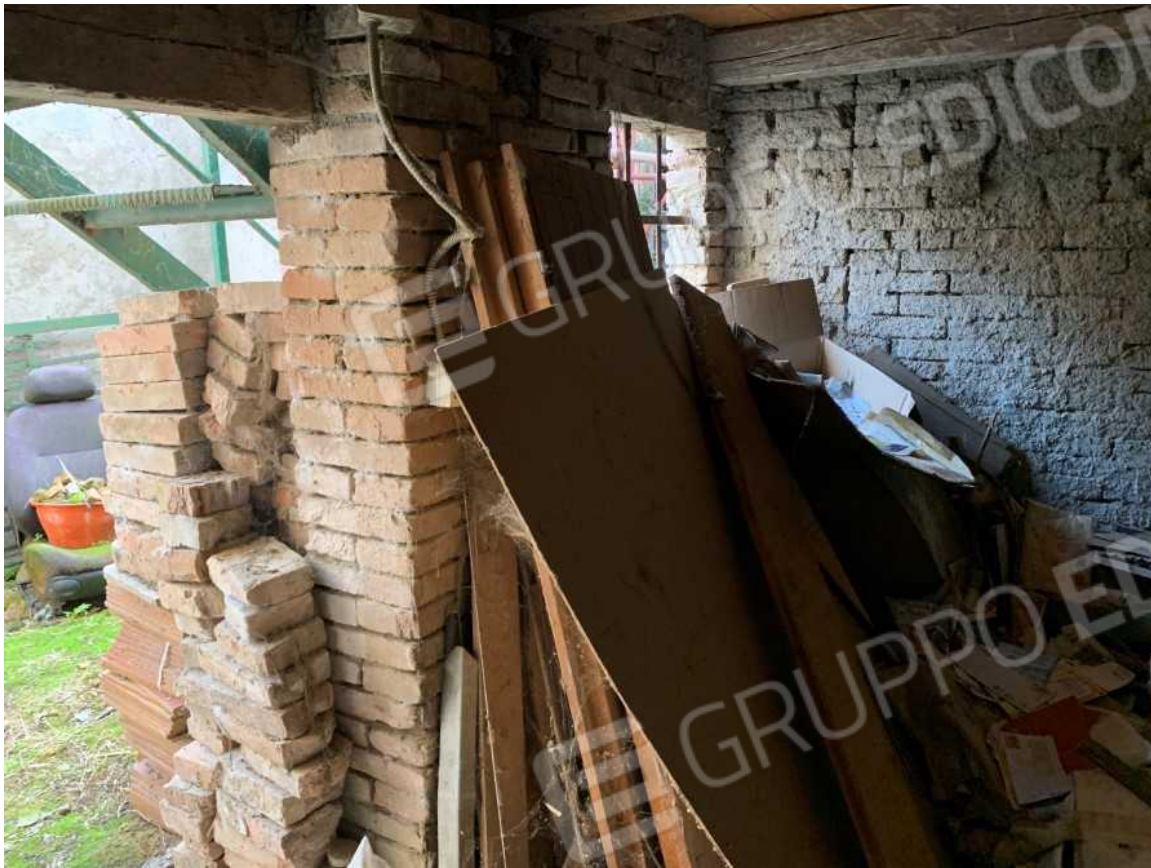
FABBRICATO A SERVIZI PIANO TERRA: PARTICOLARE