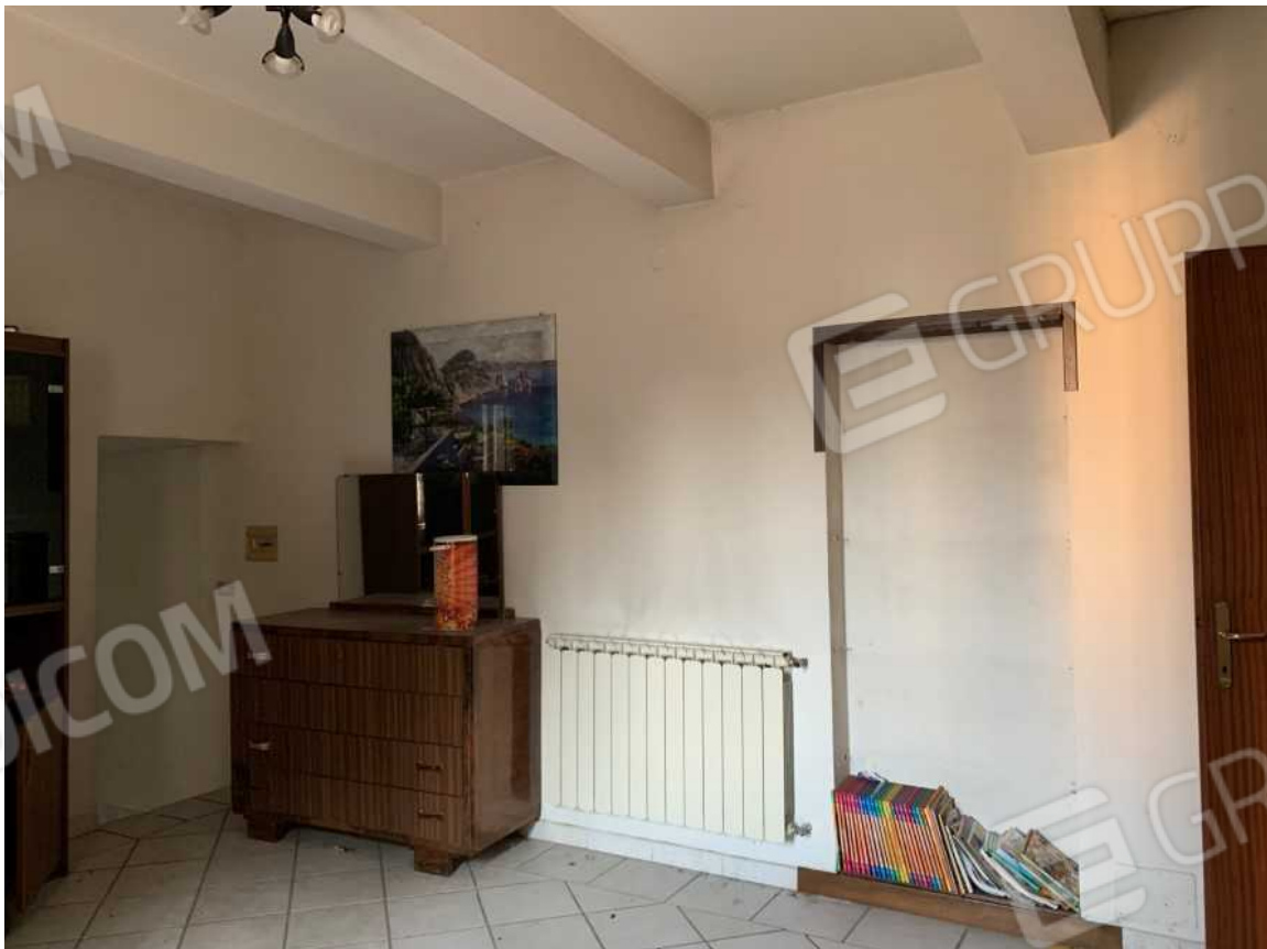
DISIMPEGNO PIANO PRIMO VISTA VERSO L'ACCESSO (ORA TAMPONATO) DAL VANO SCALA CONDOMINIALE