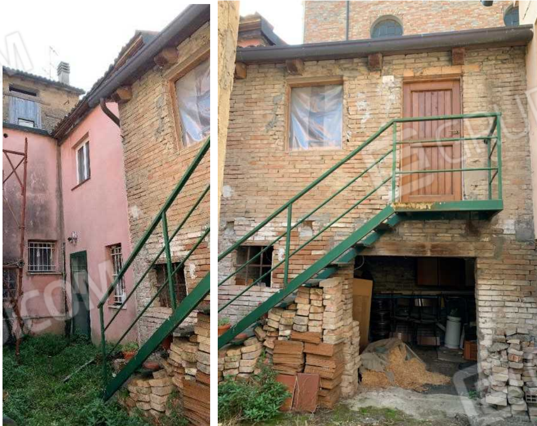
PARTICOLARE DEL FABBRICATO A SERVIZI CON ACCESSO ESTERNO DAL CORTILE COMUNE