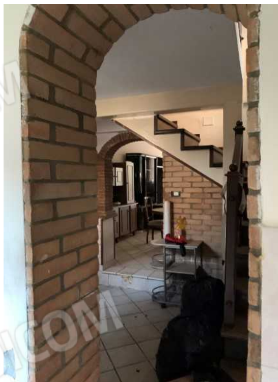
PARTICOLARI SCALA DI ACCESSO AL PIANO PRIMO