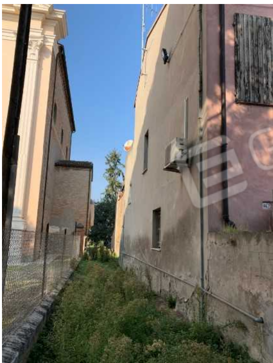
CONFINE CON TERRENO DI PROPRIETA' CHIESA IMMACOLATA CONCEZIONE DI COCCOLIA