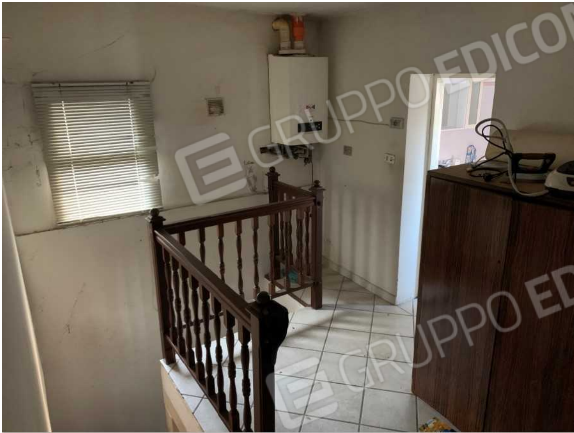
VANO SCALA PIANO PRIMO