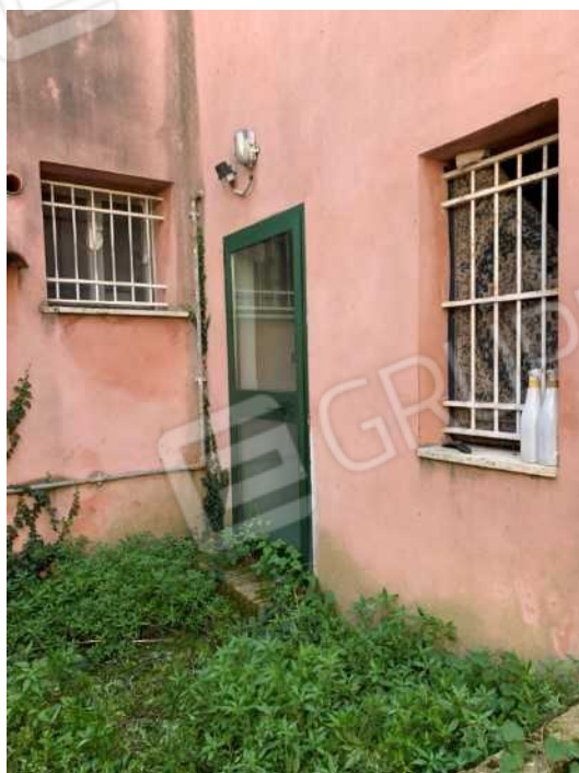
INGRESSO ALL'APPARTAMENTO DA VIA RAVEGNANA – INGRESSO DAL CORTILE COMUNE