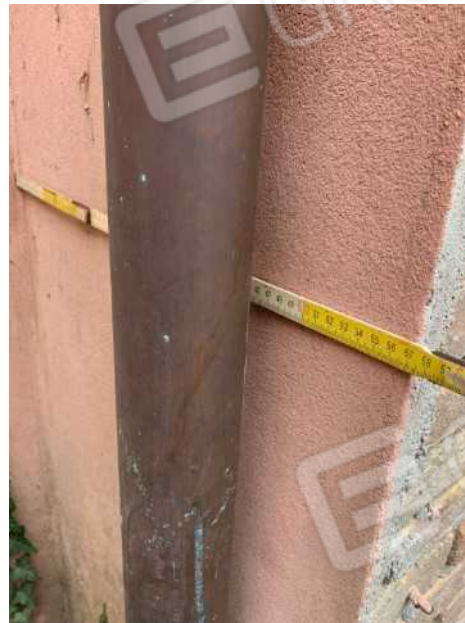
PARTICOLARE ANGOLO FABBRICATO A SERVIZI