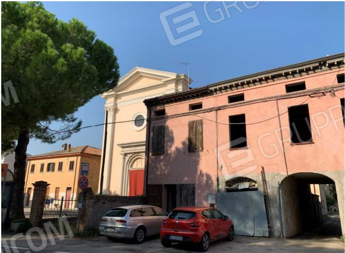
VICOLO IL BASTIONE PERPENDICOLARE A VIA RAVEGNANA