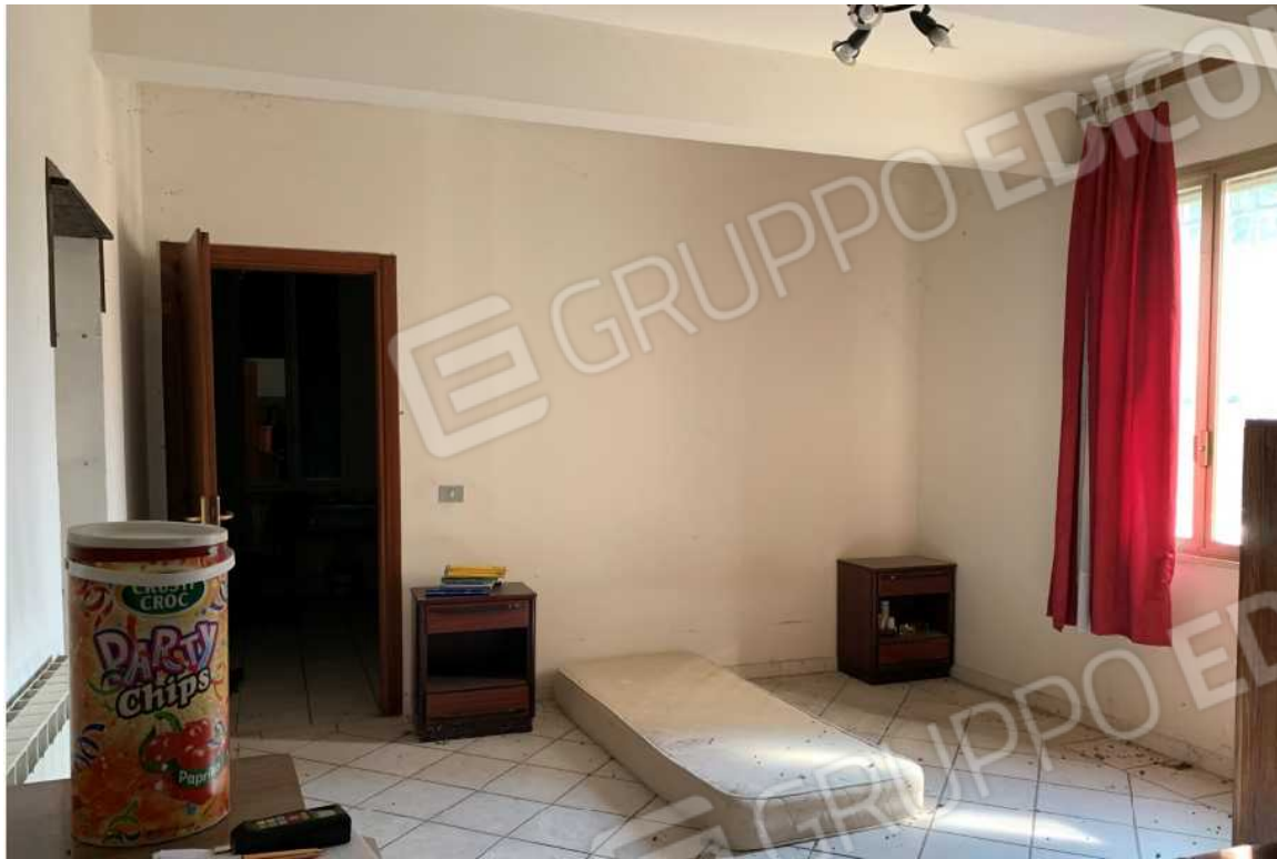
DISIMPEGNO PIANO PRIMO VISTA VERSO LA CAMERA