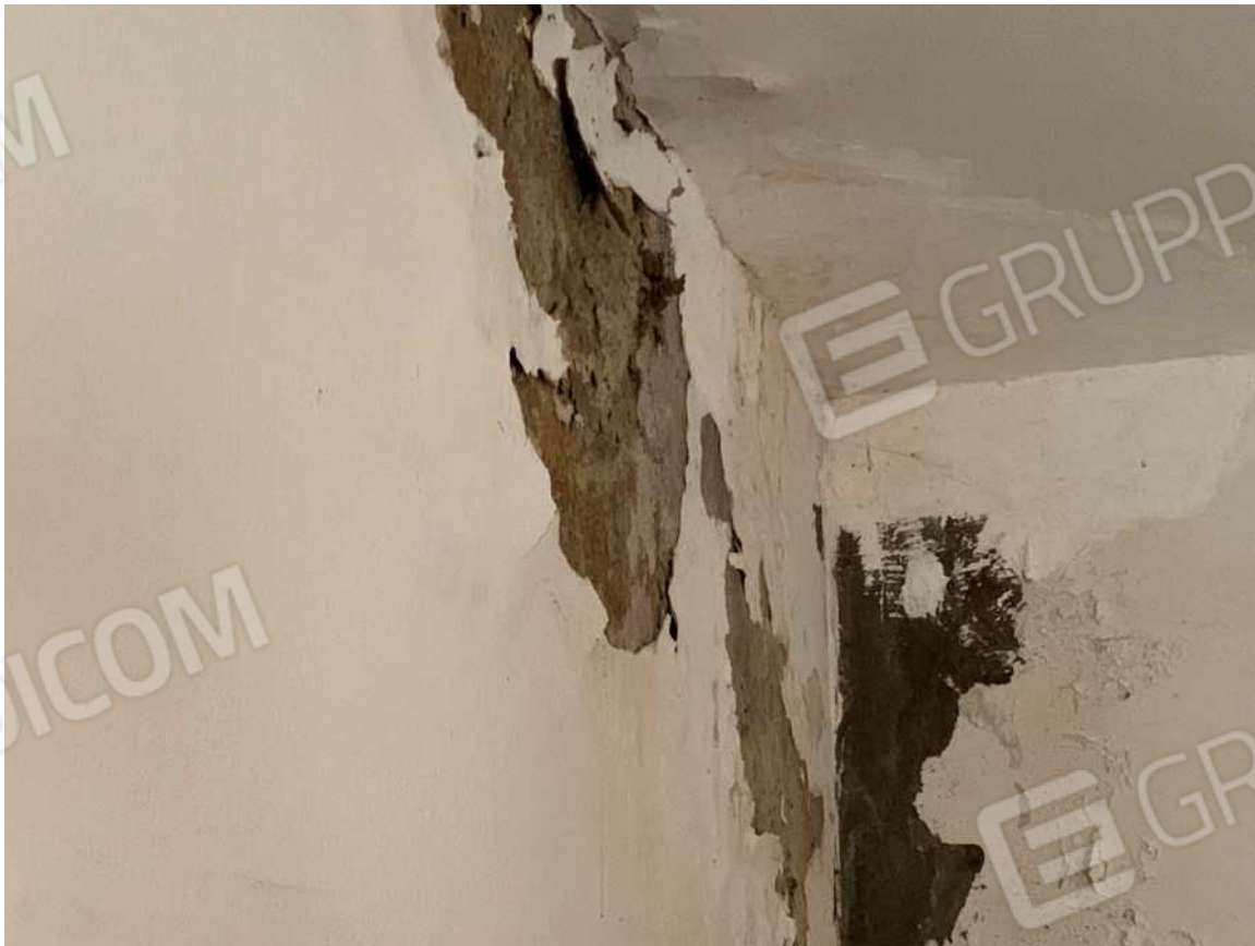
VANO SCALA PIANO PRIMO: PARTICOLARE DEGRADO INTONACO PER INFILTRAZIONI DALLA COPERTURA