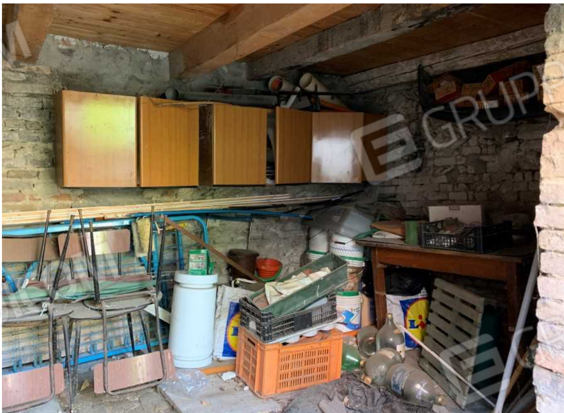
FABBRICATO A SERVIZI PIANO TERRA: PARTICOLARE