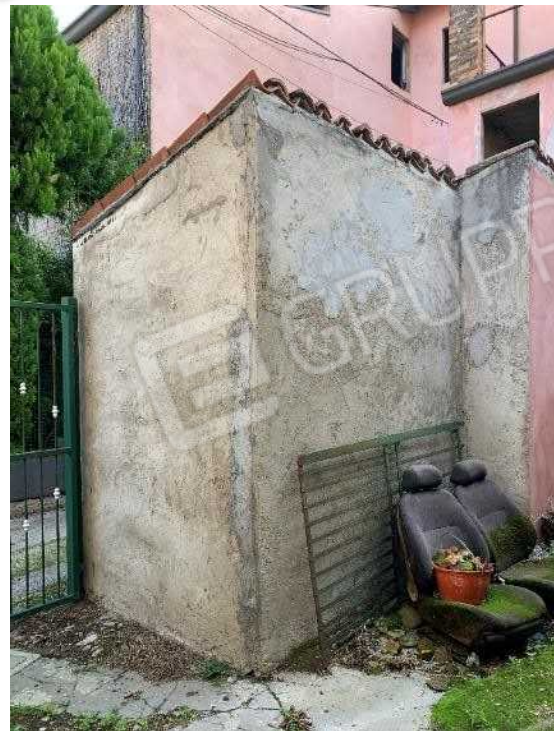
PARTICOLARE INGRESSO AL CORTILE COMUNE DAL CANCELLO SU VICOLO IL BASTIONE