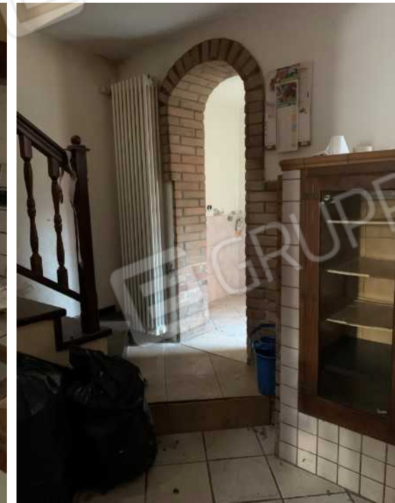
SCALA DI ACCESSO AL P.1