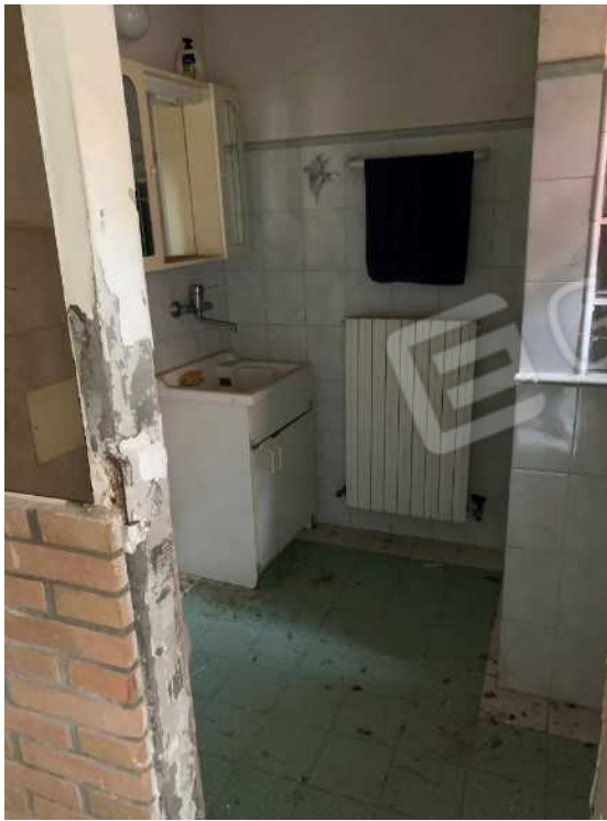
LAVANDERIA AL PIANO TERRA