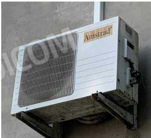
PARTICOLARI: SPLIT INTERNO ALLA CAMERA P.1 PER CONDIZIONAMENTO, UNITA' ESTERNA