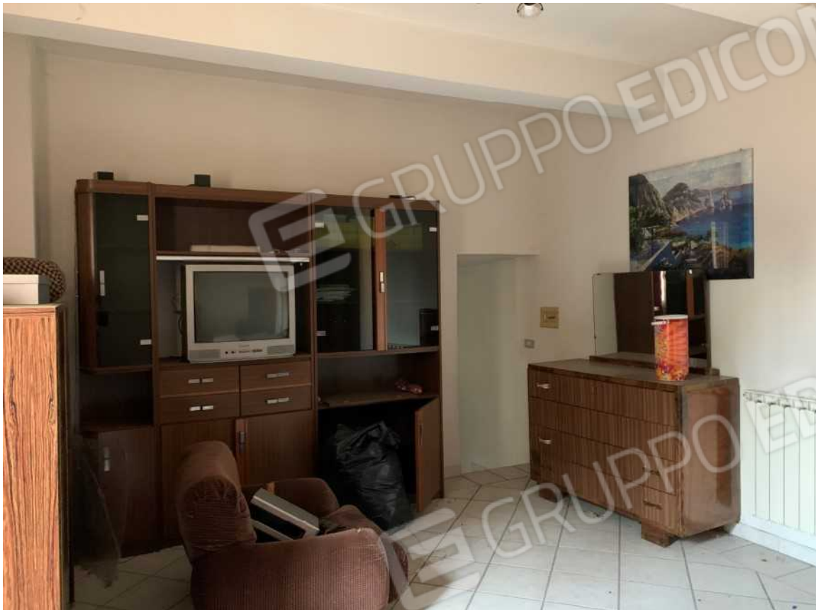
DISIMPEGNO PIANO PRIMO VISTA VERSO VANO SCALA