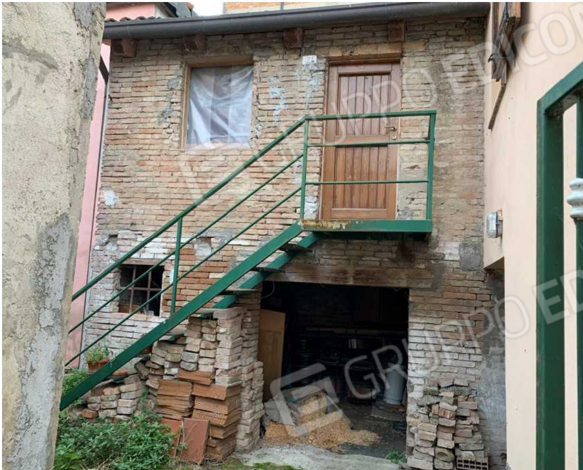
FABBRICATO A SERVIZI SU 2 LIVELLI CON INGRESSO ESTERNO DAL CORTILE COMUNE