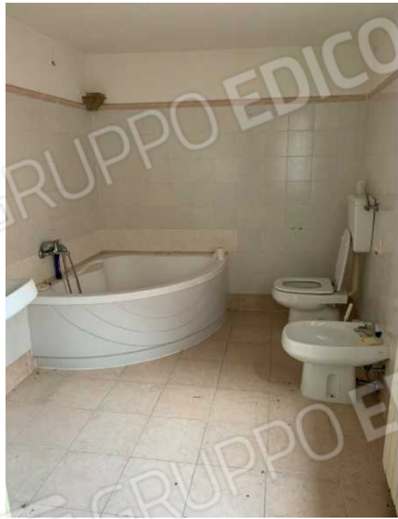
BAGNO PIANO PRIMO: PARTICOLARI