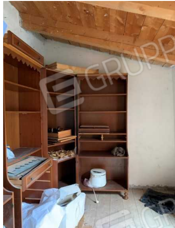
FABBRICATO A SERVIZI PIANO PRIMO: PARTICOLARI