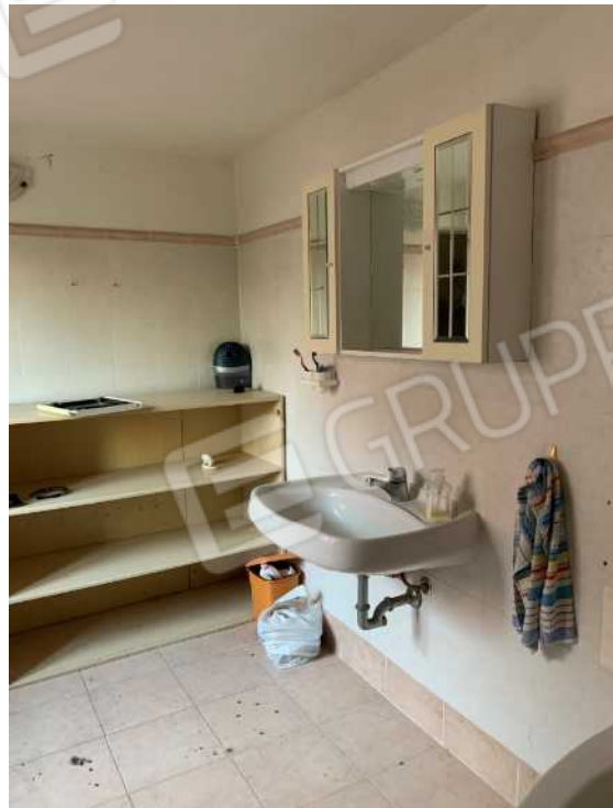
BAGNO PIANO PRIMO: PARTICOLARI