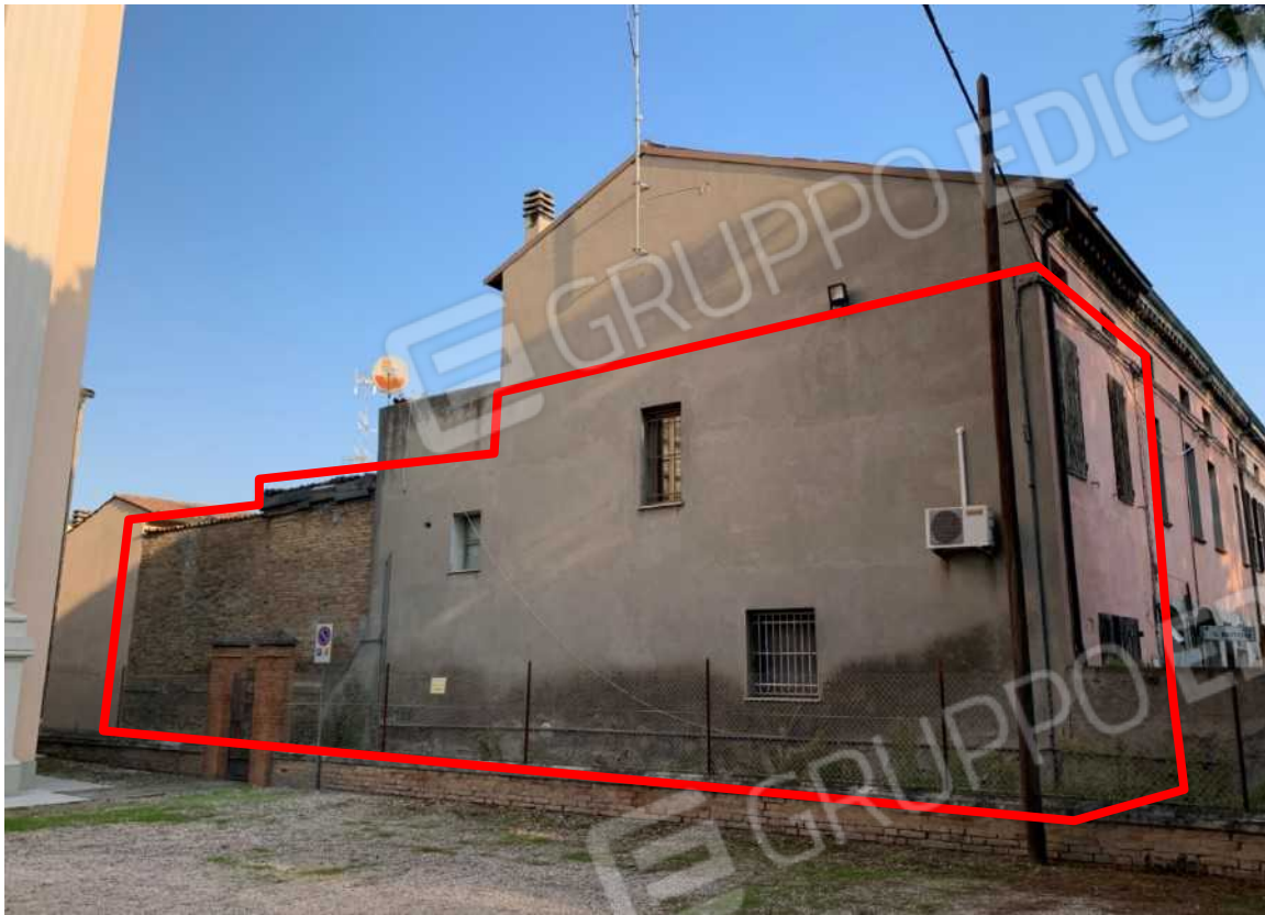
VISTA DAL PARCHEGGIO DELLA CHIESA IMMACOLATA CONCEZIONE DI COCCOLIA – INDIVIDUAZIONE DELLA PROPRIETA’