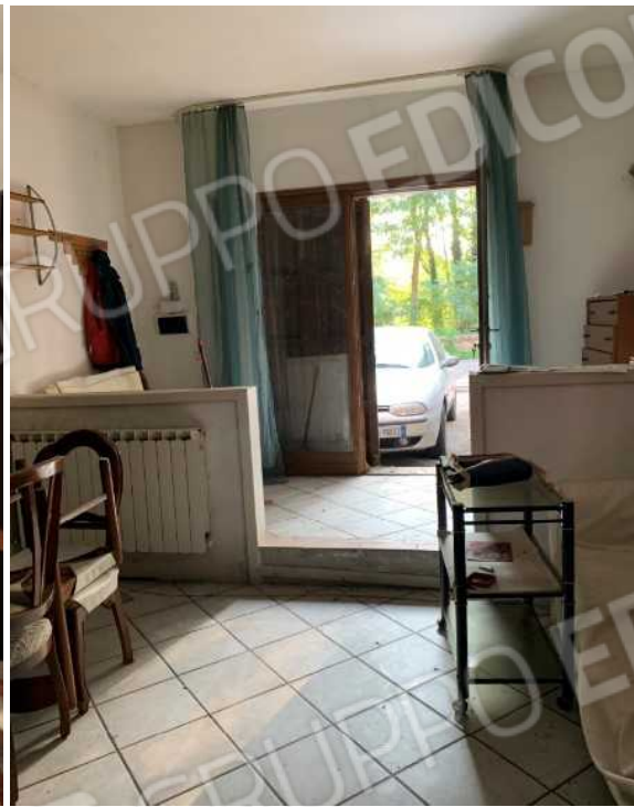
VISTA DEL SOGGIORNO VERSO IL DISIMPEGNO CON ANGOLO COTTURA E VERSO L'INGRESSO SU VIA RAVEGNANA