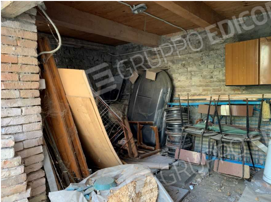
FABBRICATO A SERVIZI PIANO TERRA: PARTICOLARE