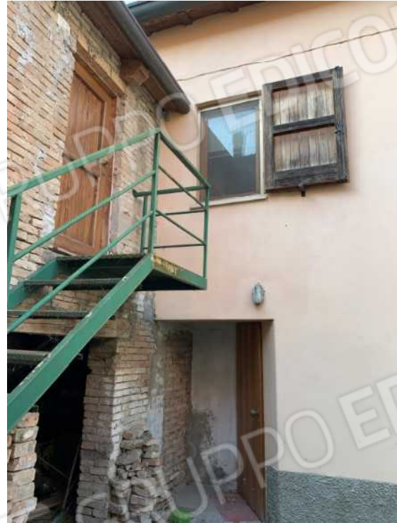
CORTILE COMUNE: VISTA VERSO PROPRIETA' GATTAMORTA E VISTA VERSO PROPRIETA' SEDIOLINI