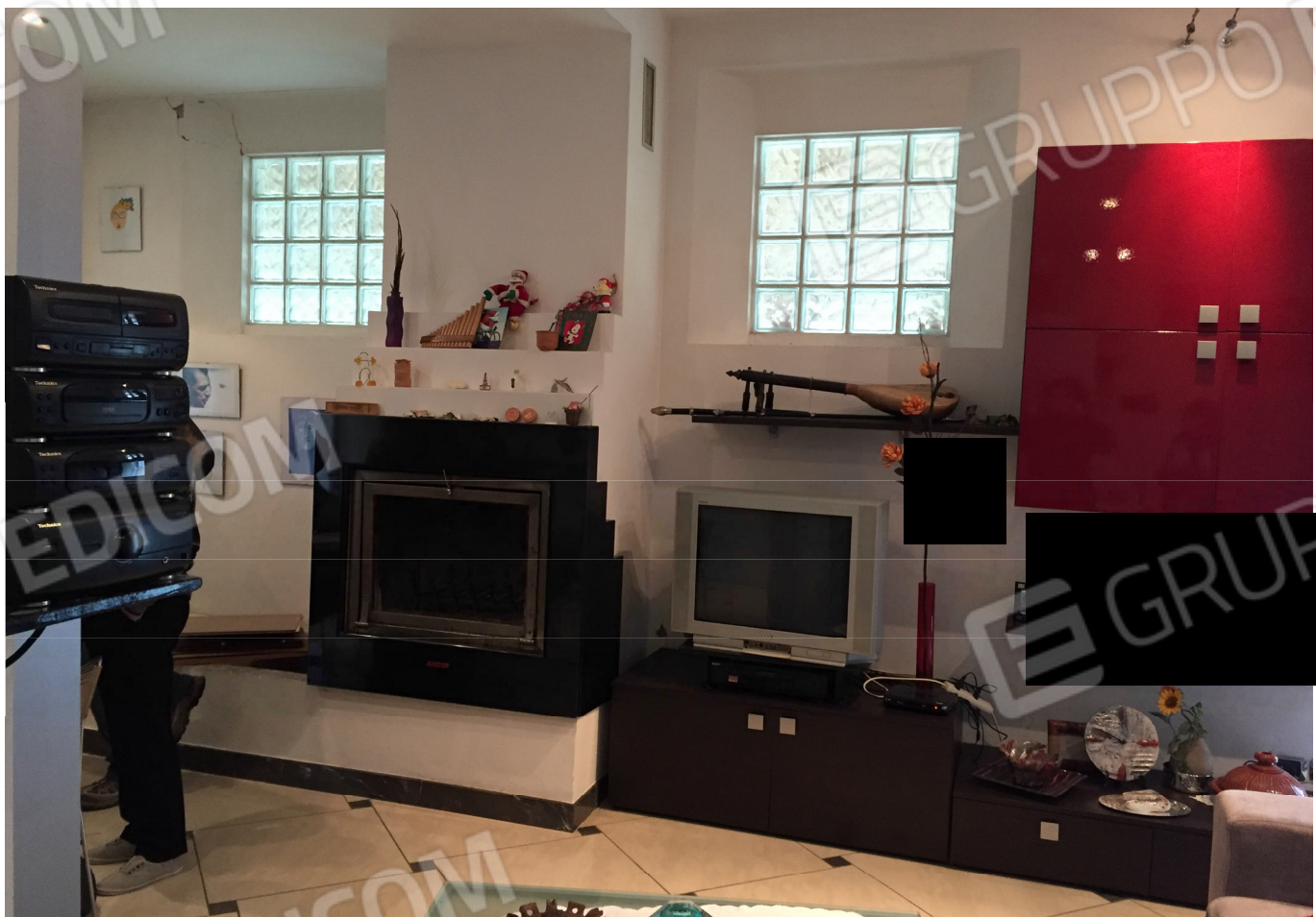
Foto 2 - Soggiorno