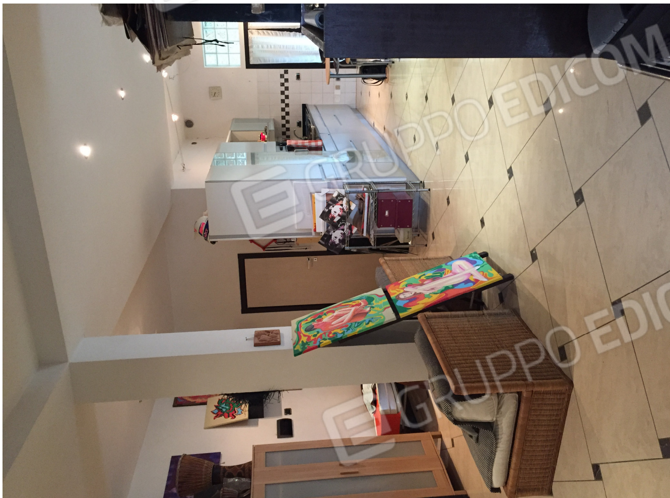
Foto 1 - Soggiorno