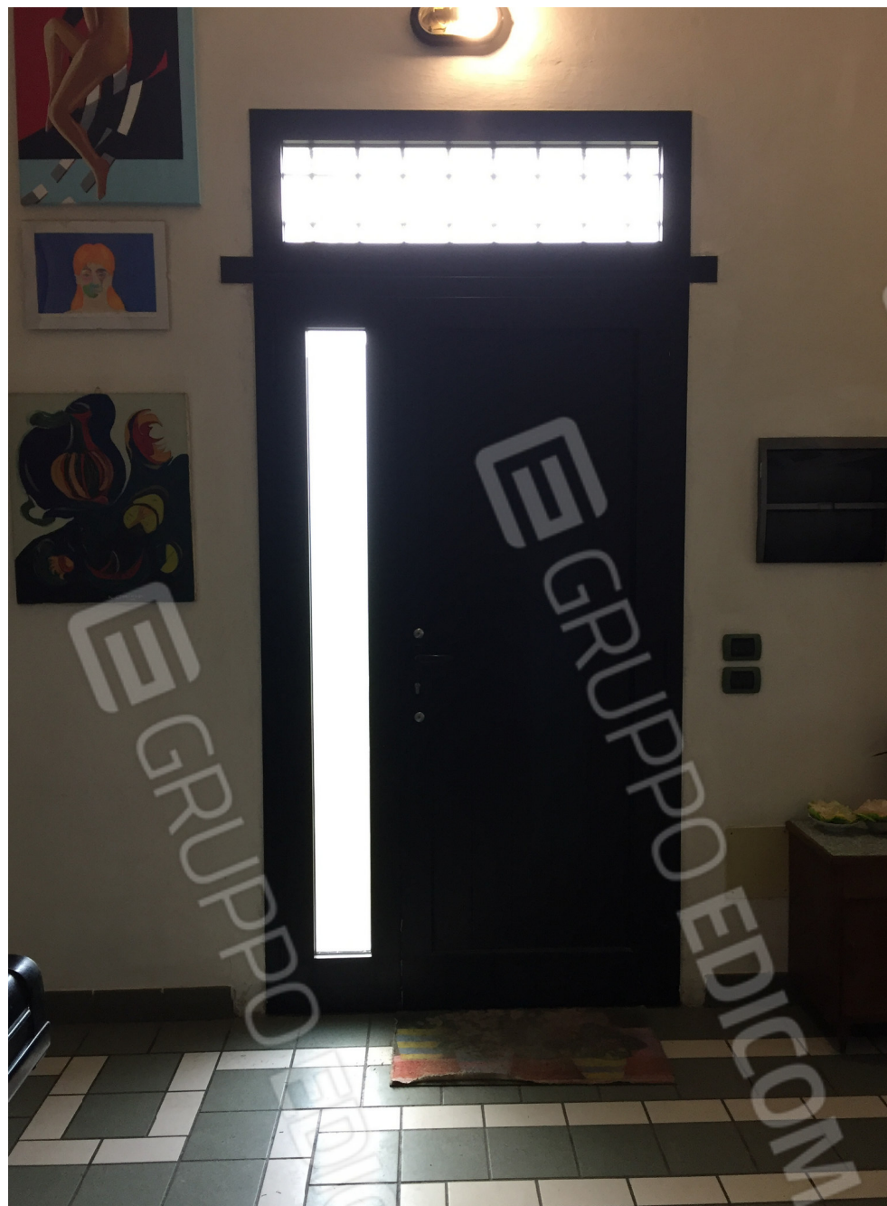
Foto 1 - Ingresso