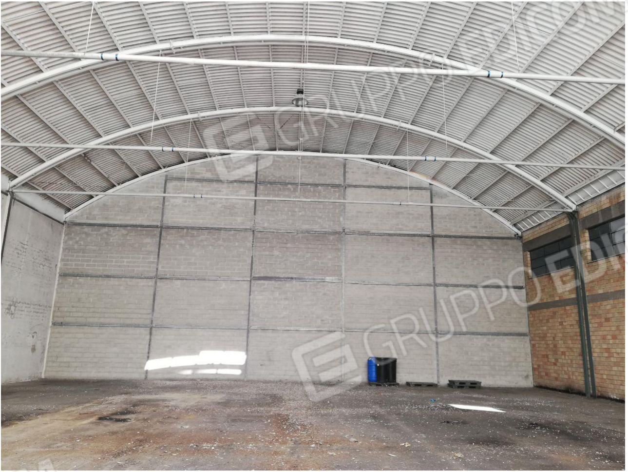
Figura 18 FOGLIO 103 MAPP. 257 SUB 7