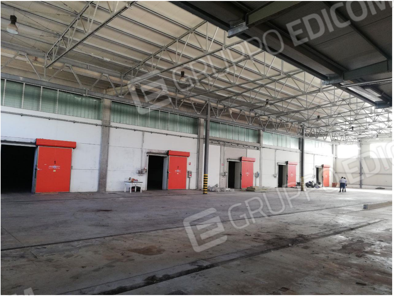
Figura 12 FOGLIO 103 MAPP. 257 SUB 4