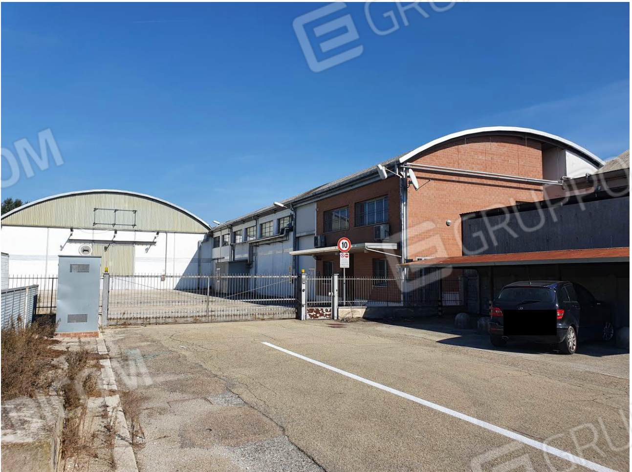
Figura 1 IL MAPPALE 257