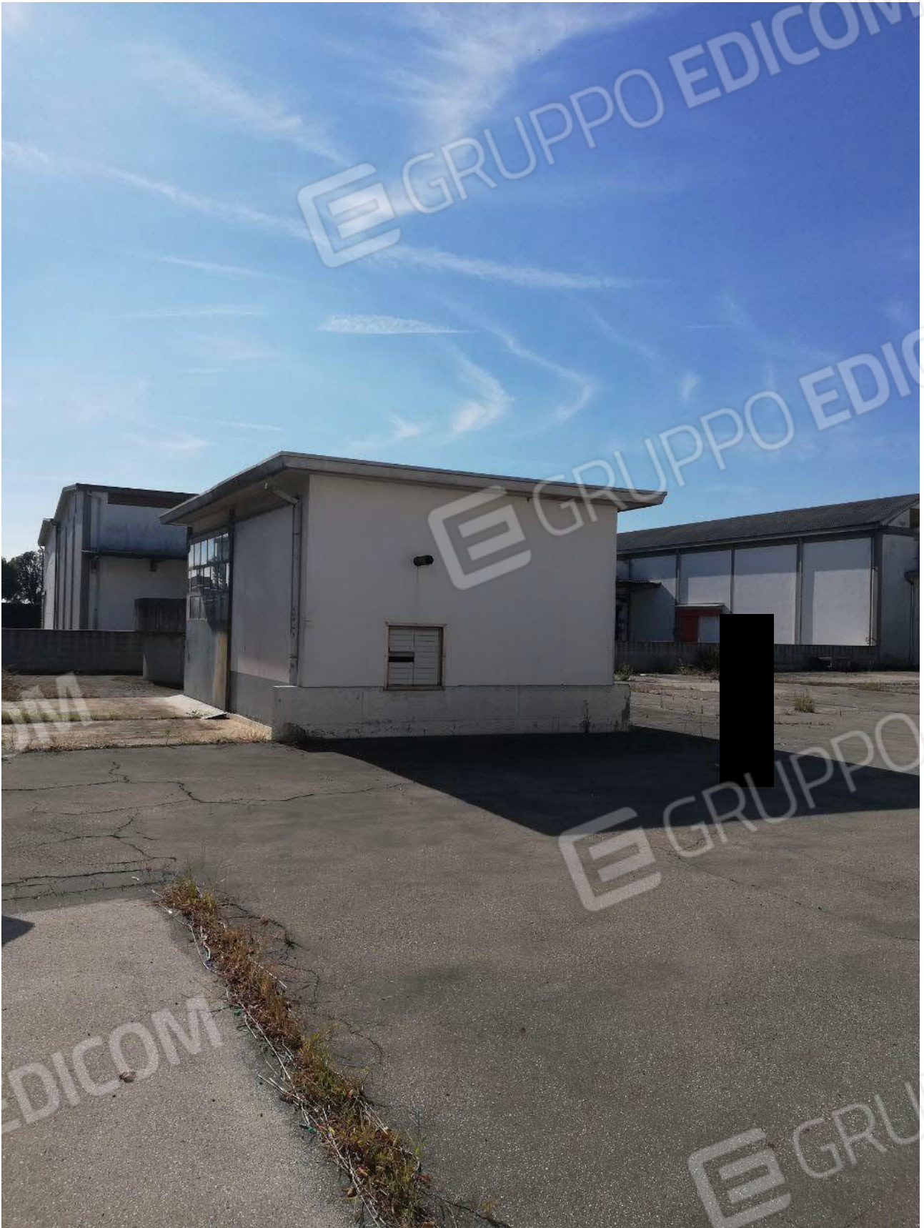
Figura 17 GRUPPO ELETTROGENO