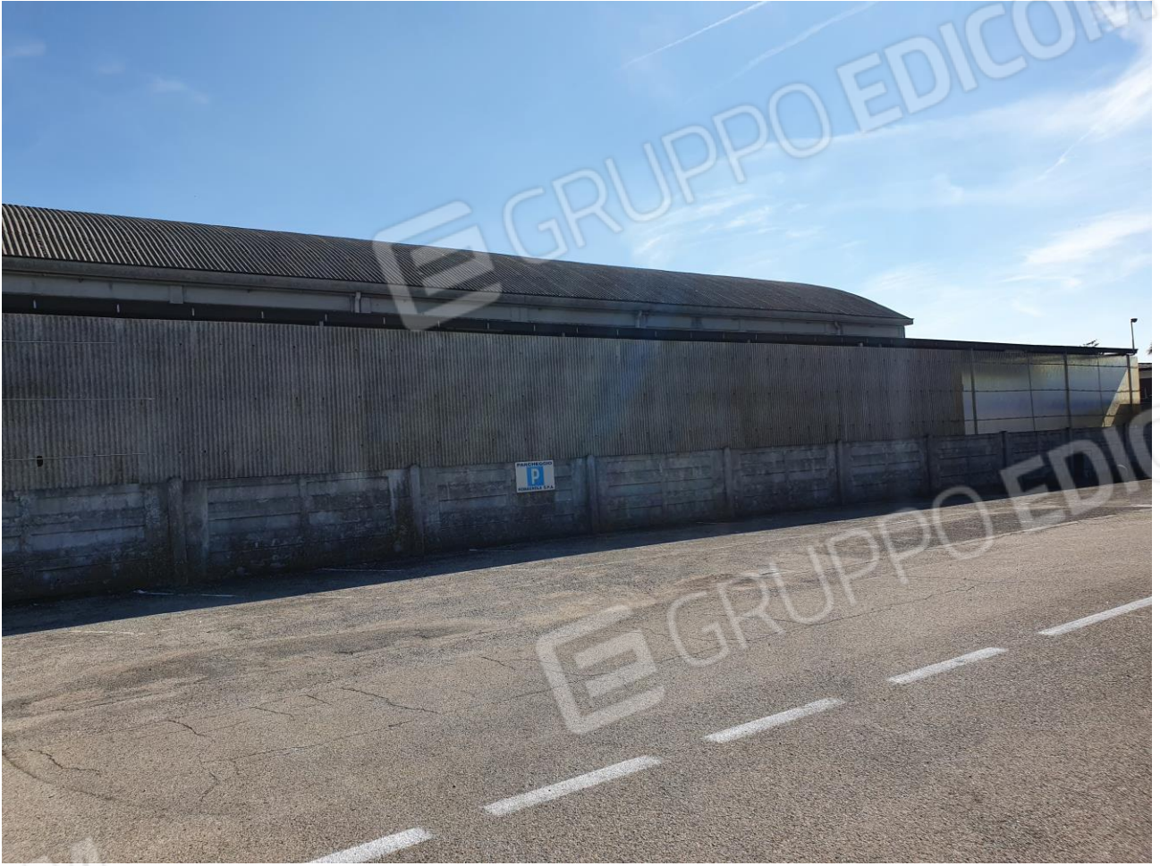
Figura 2 FIANCO FOGLIO 103 MAPP. 257 SUB 6/7