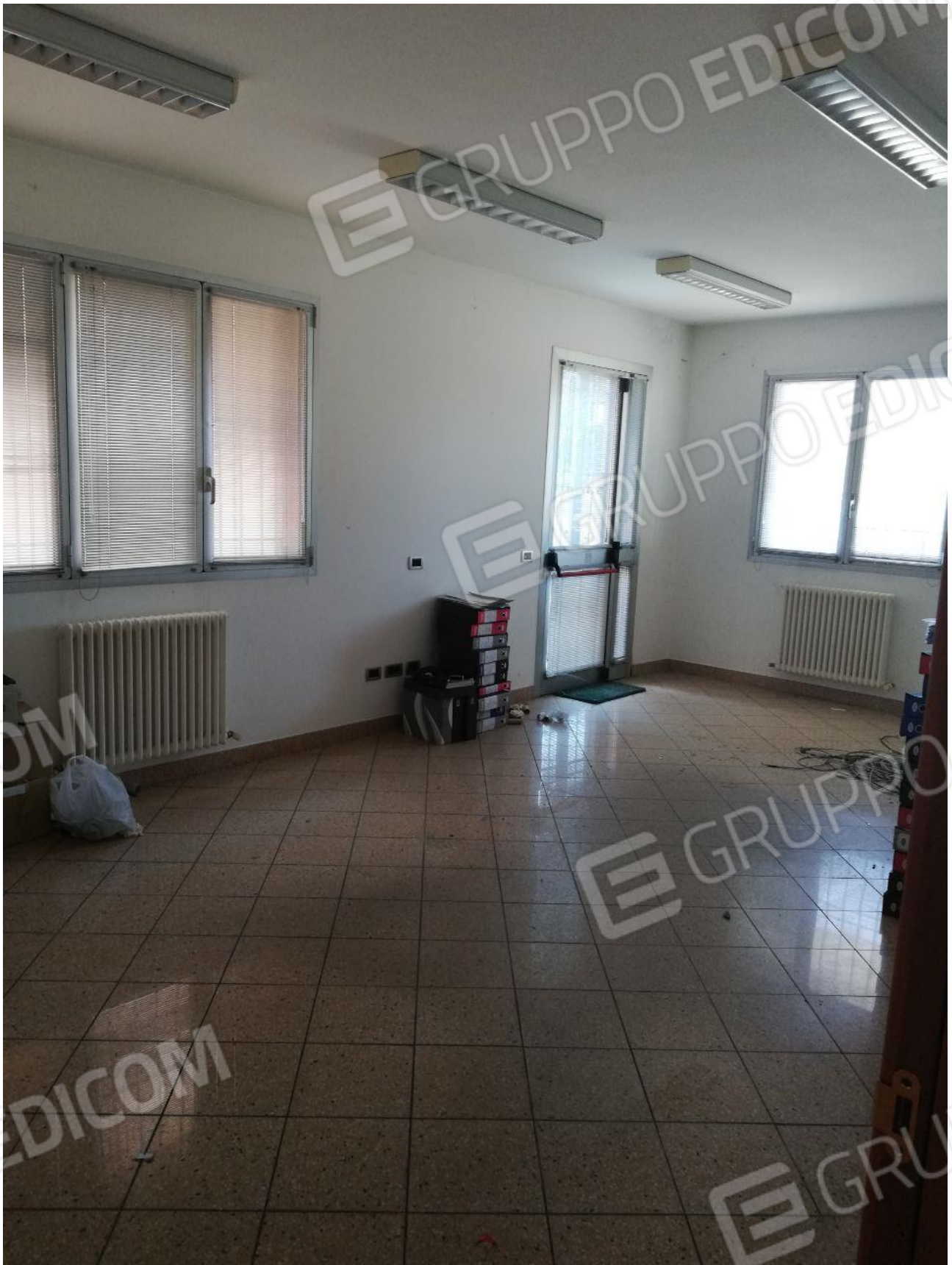
Figura 4 INTERNO FOGLIO 103 MAPP. 257 SUB 7 PT