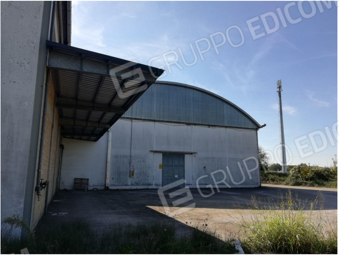
Figura 15 FOGLIO 103 MAPP. 257