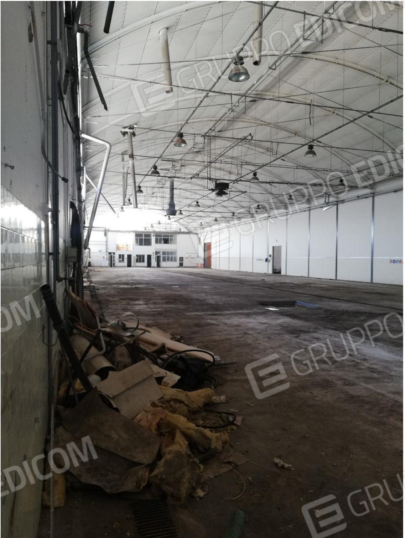
Figura 13 FOGLIO 103 MAPP. 257 SUB 6