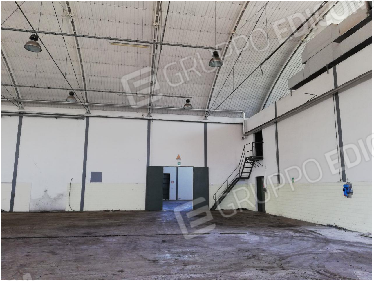
Figura 14 FOGLIO 103 MAPP 257 SUB 6