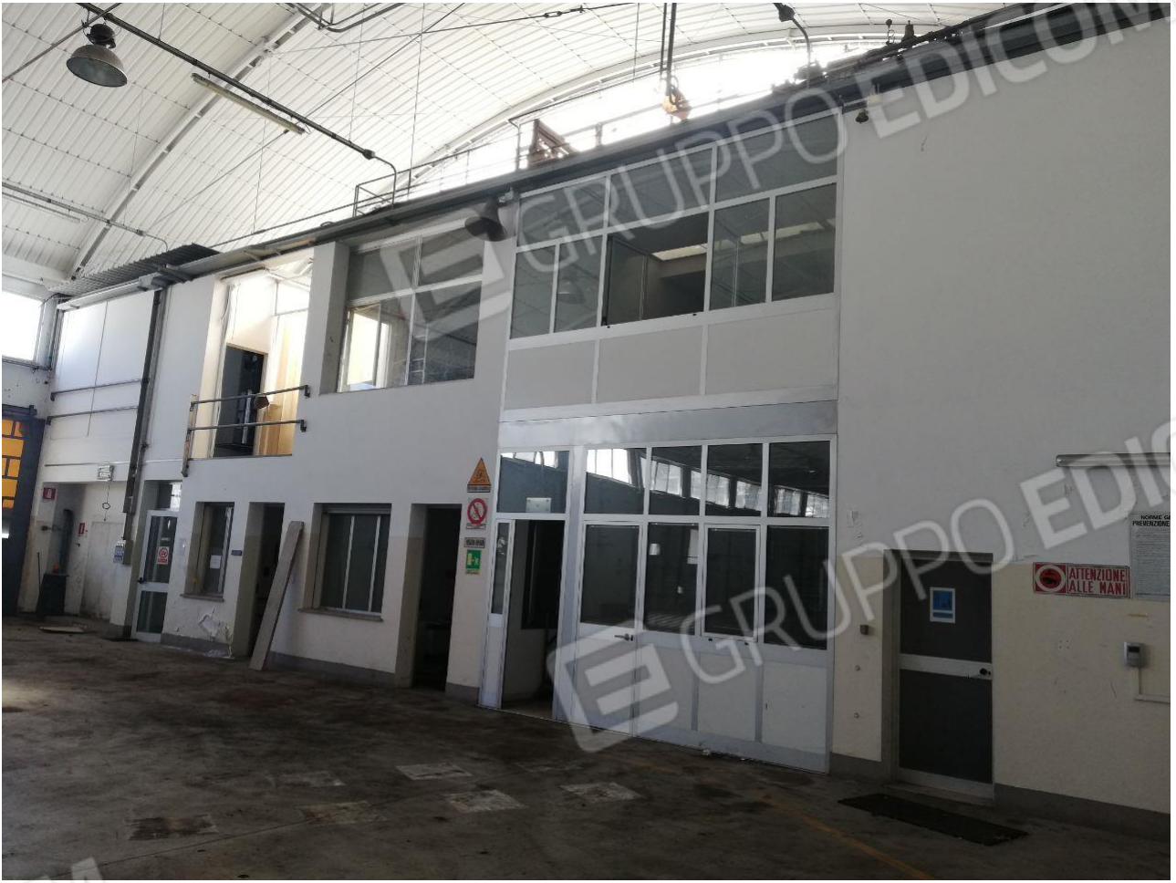
Figura 5 INTERNO FOGLIO 103 MAPP. 257 SUB 6 E VISAT SUB 7