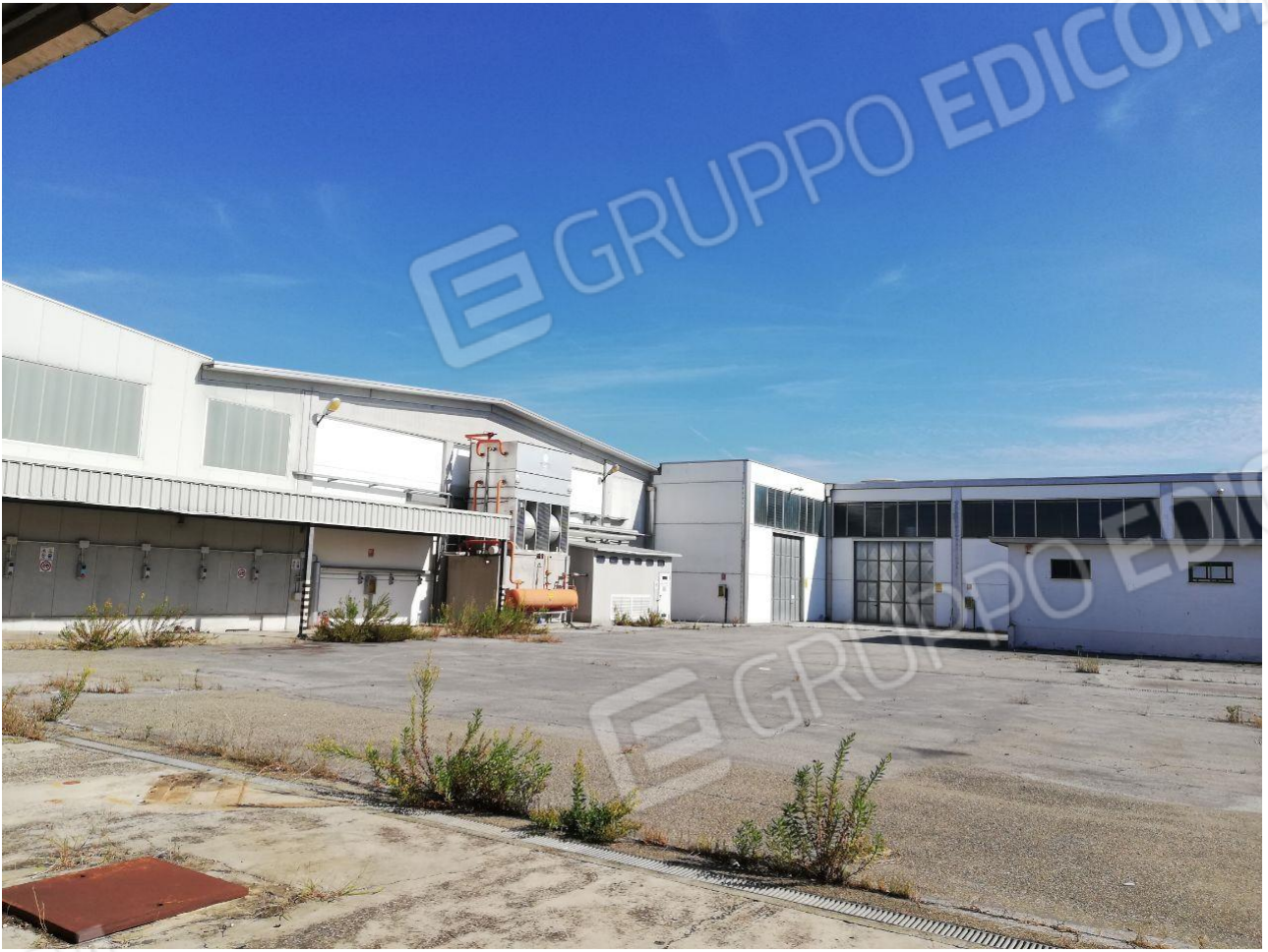
Figura 7 FOGLIO 103 MAPP. 257