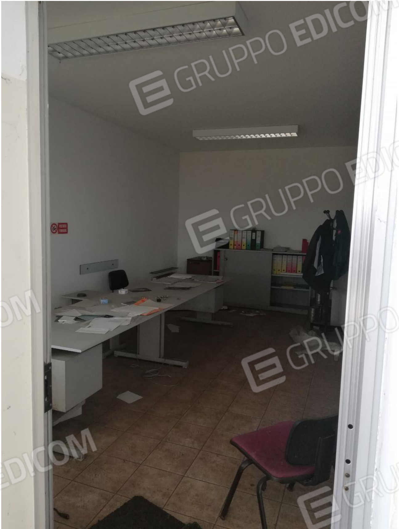
Figura 6 INTERNO FOGLIO 103 MAPP. 257 SUB 7