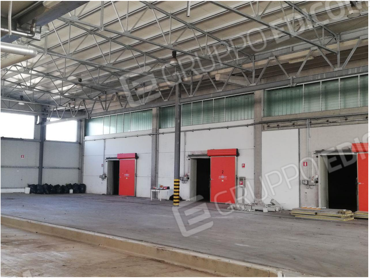
Figura 10 FOGLIO 103 MAPP. 257 SUB 4