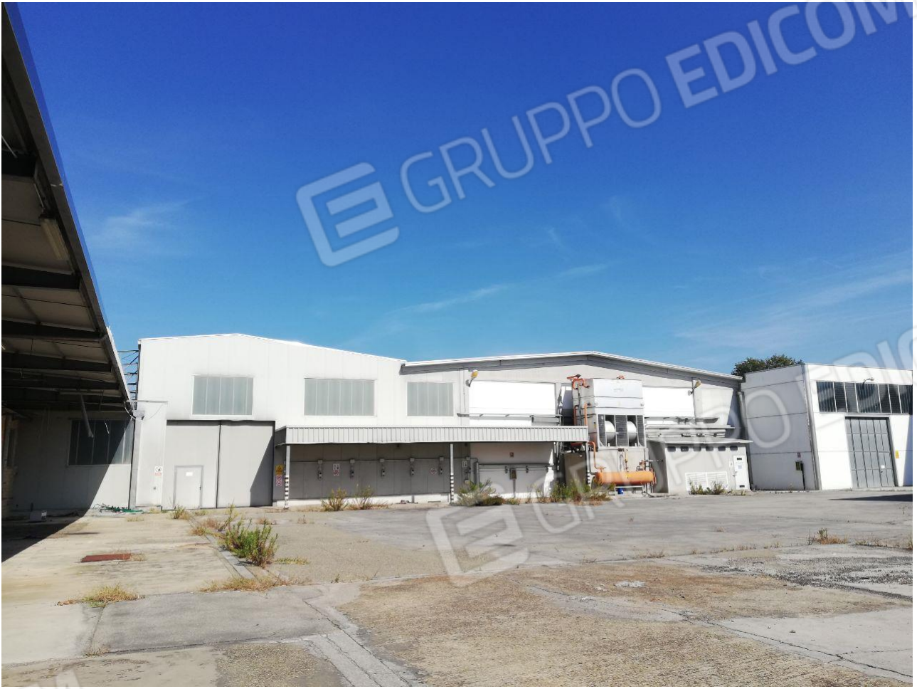
Figura 9 FOGLIO 103 MAPP. 257