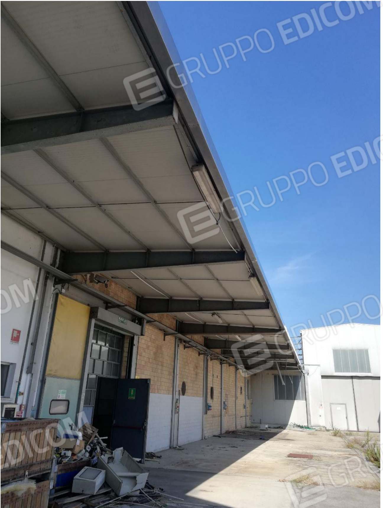
Figura 11 FOGLIO 103 MAPPALE 257