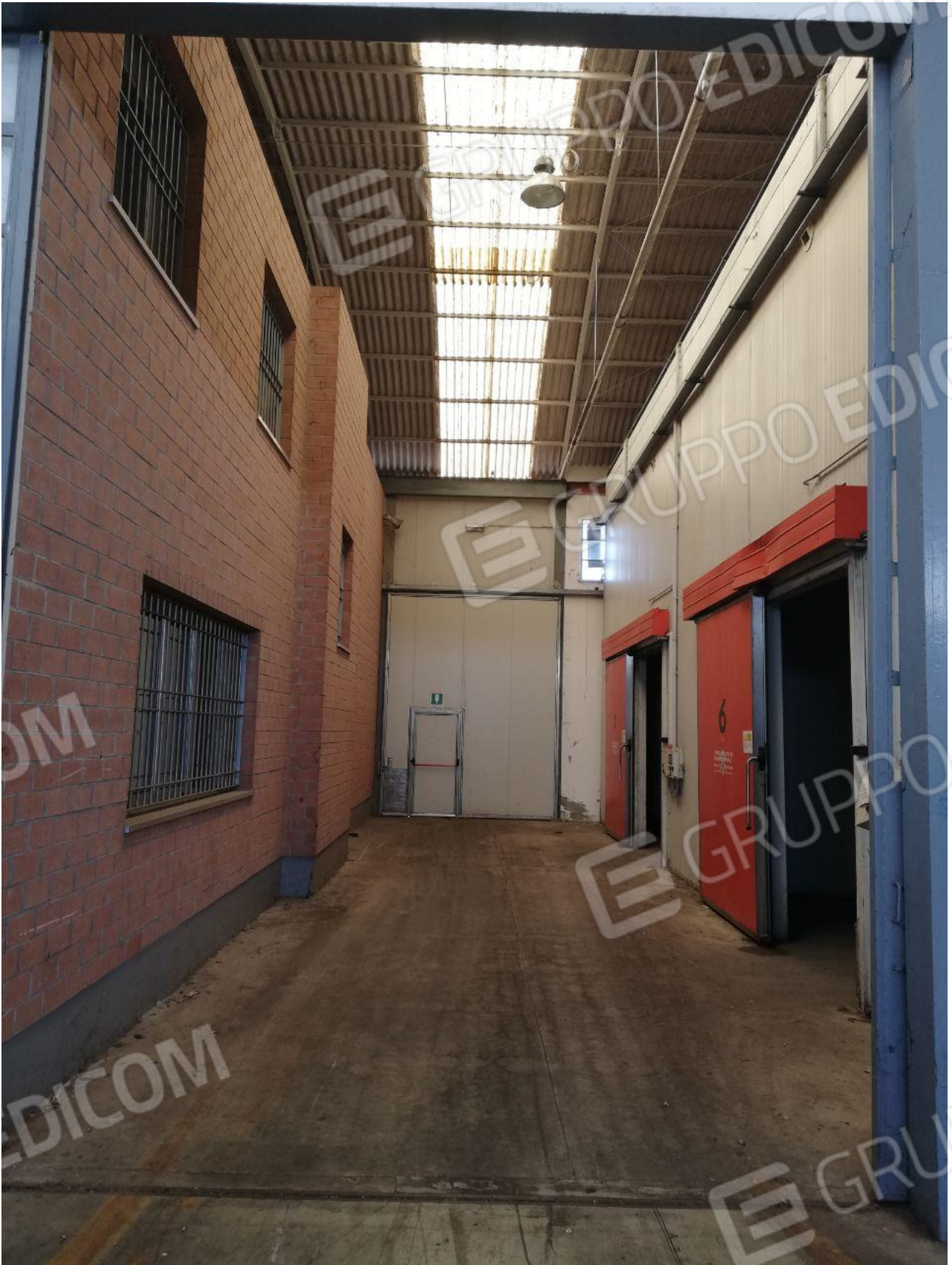
Figura 8 FOGLIO 103 MAPP. 257 SUB 6 CAPANNONE