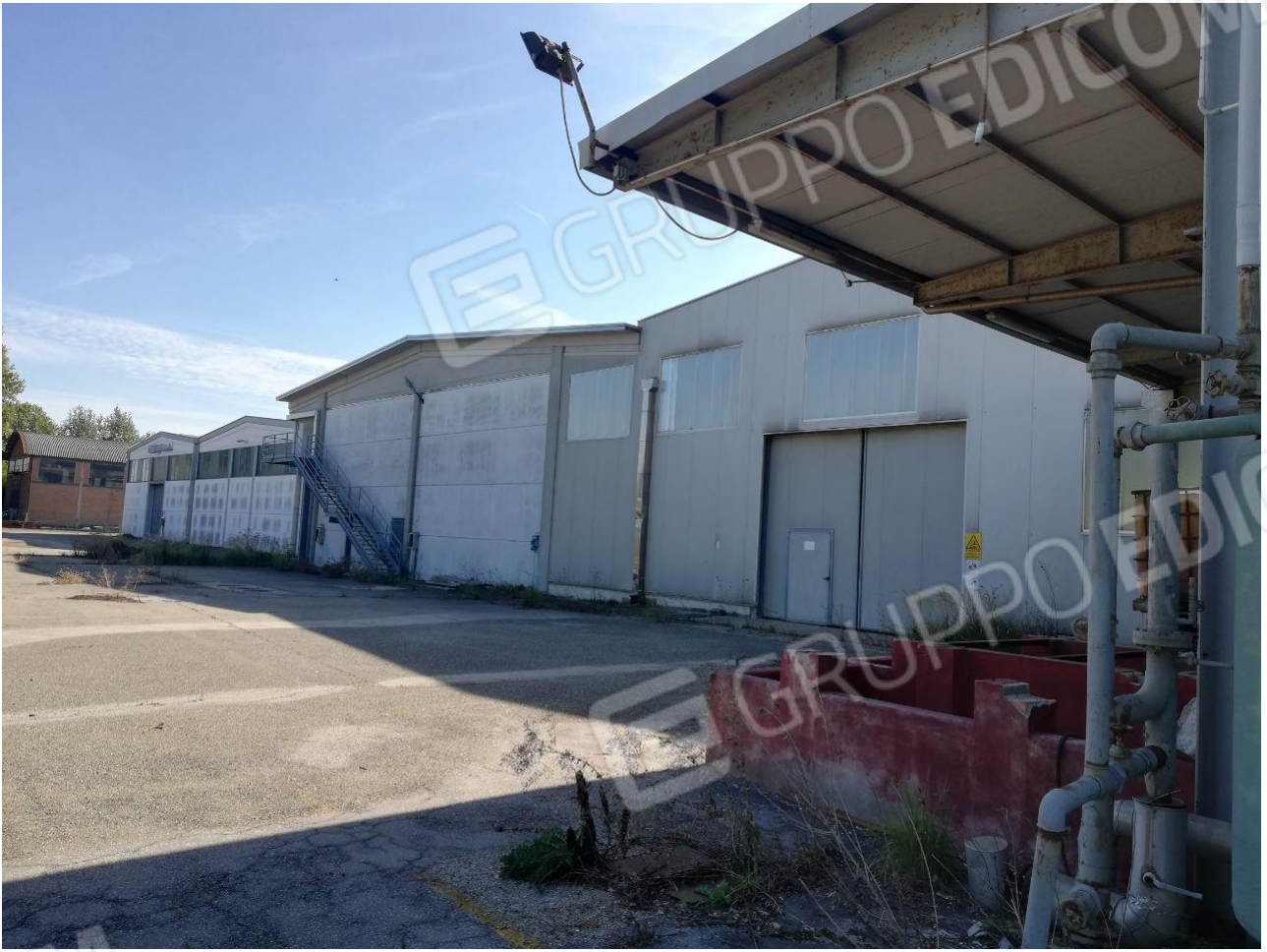
Figura 16 FOGLIO 103 MAPP. 257