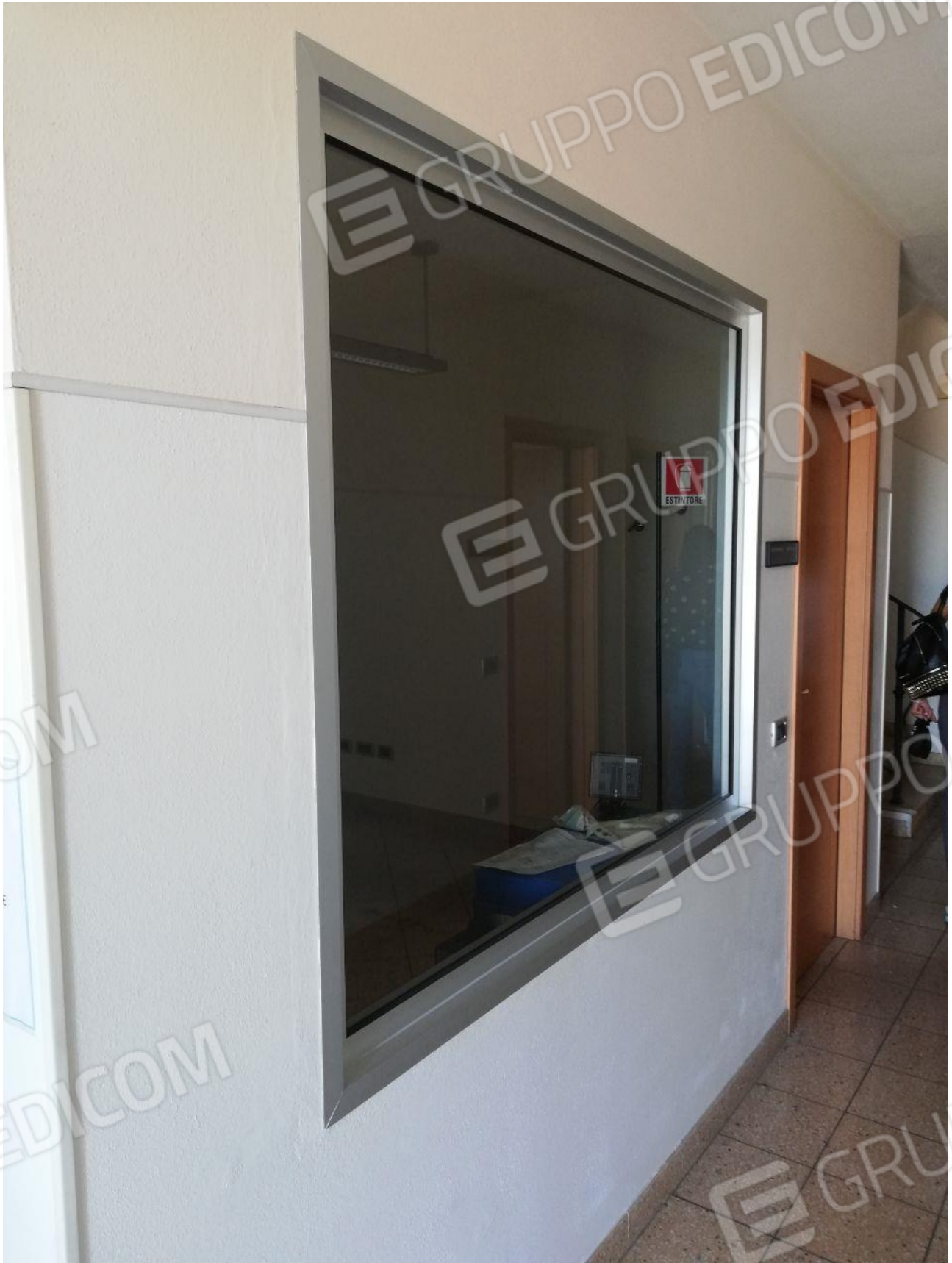
Figura 3 INTERNO FOGLIO 103 MAPP. 257 SUB 7 PT