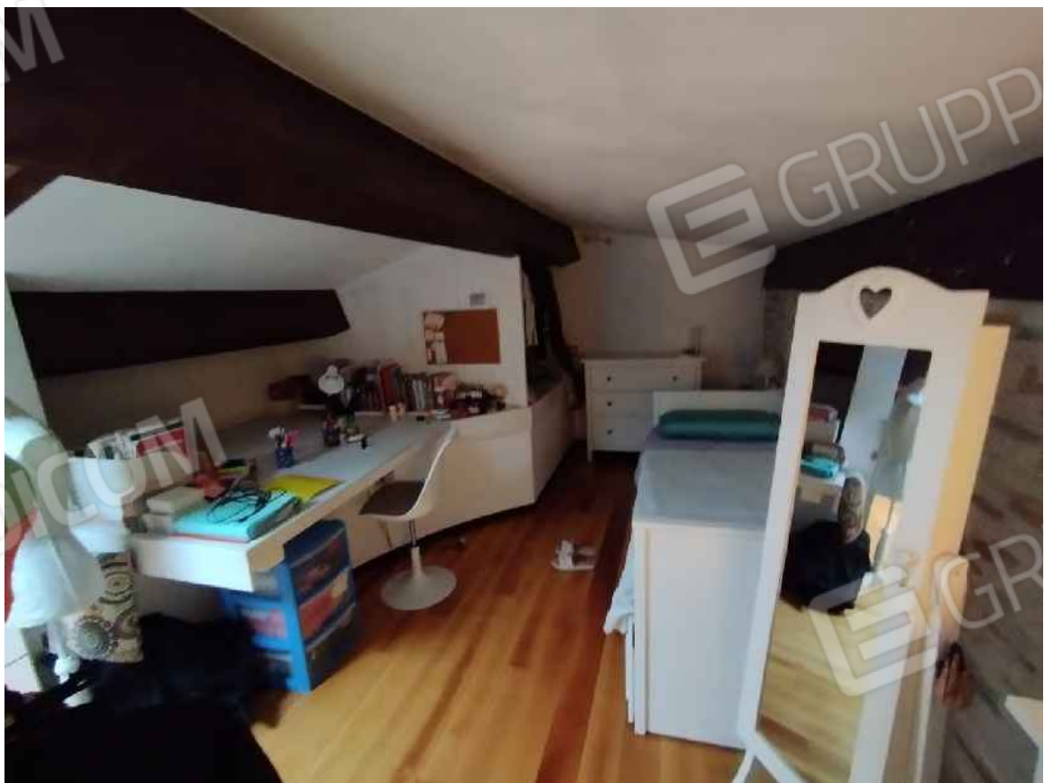
Sottotetto non autorizzato