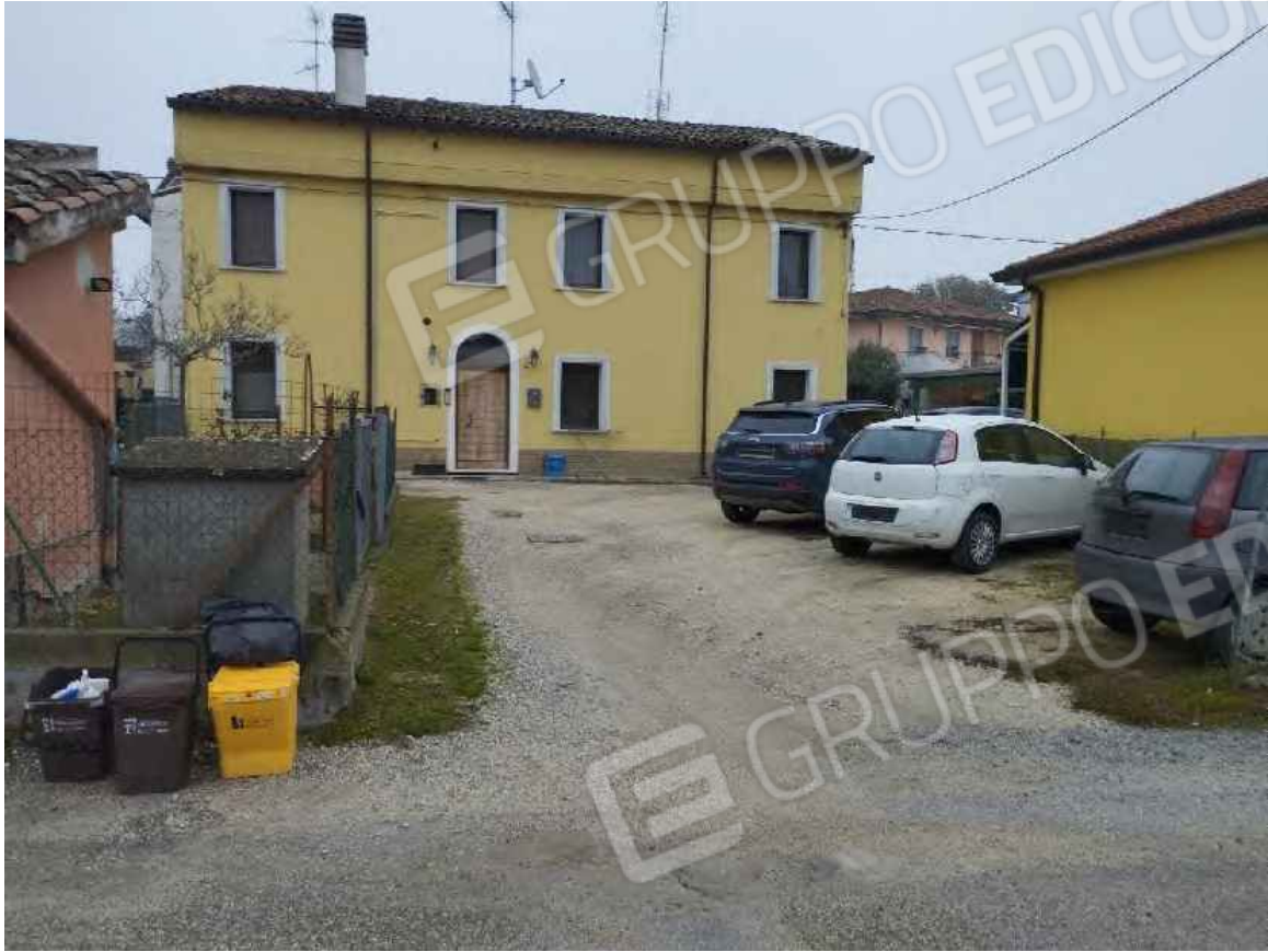
Vista del fronte della abitazione - da via Bassa Superiore