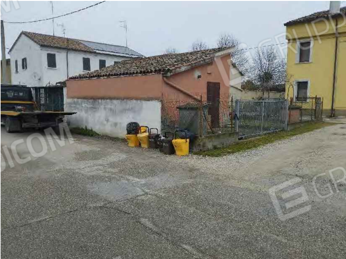
Vista del garage - da via Bassa Superiore