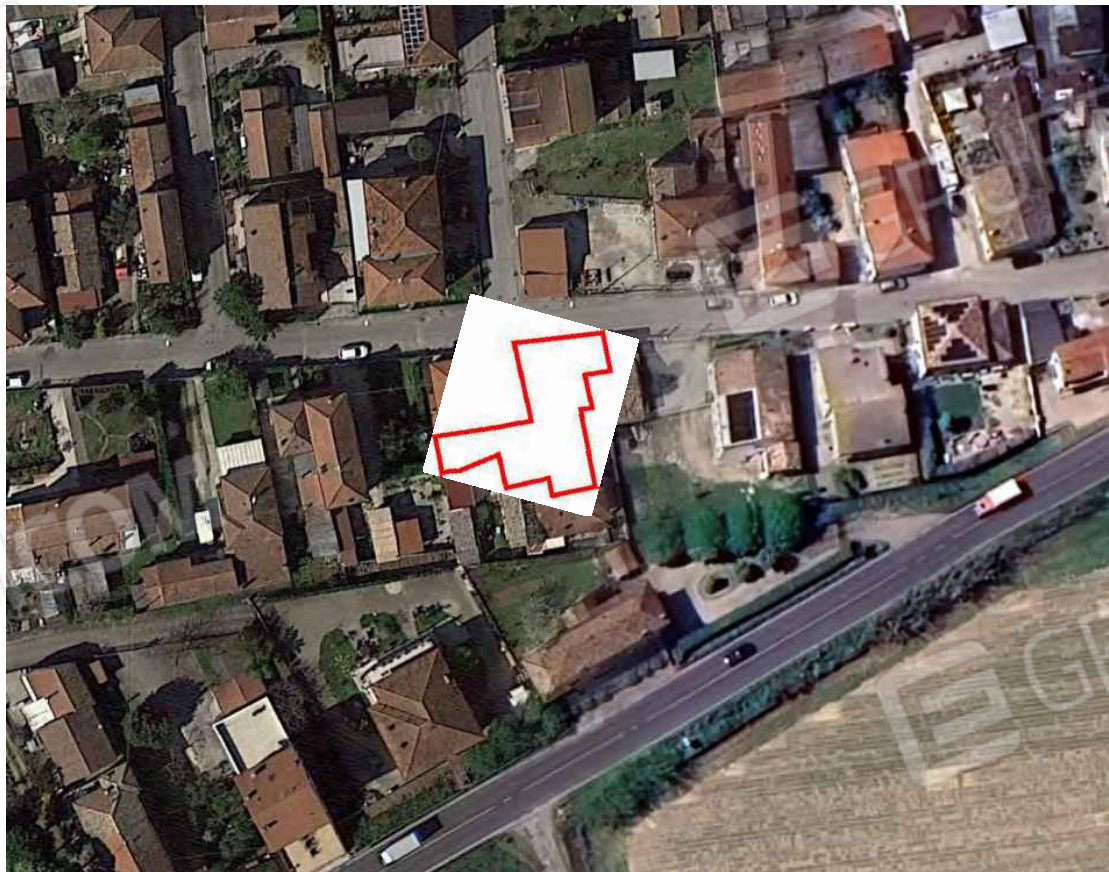
Vista satellitare con perimetrazione di interesse