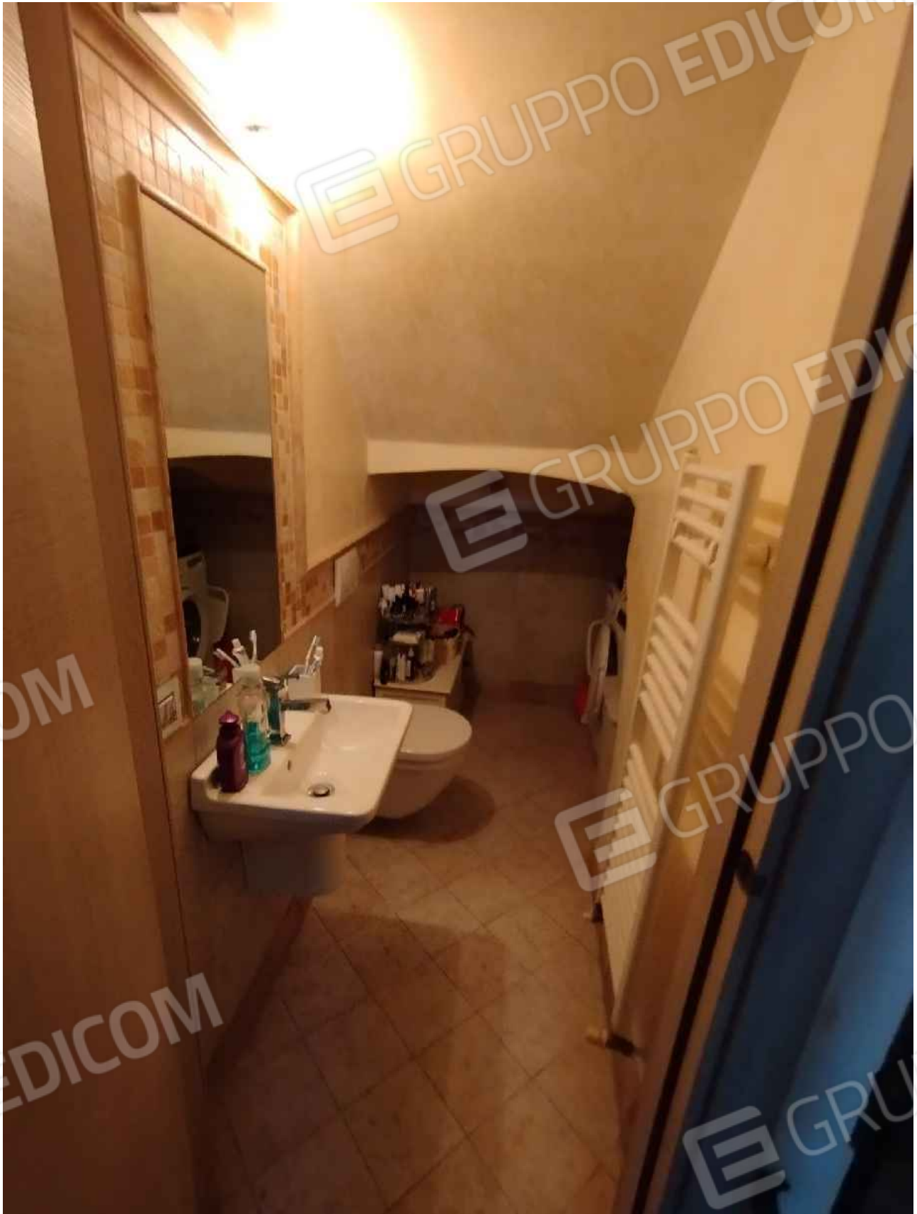
Bagno sotto scala