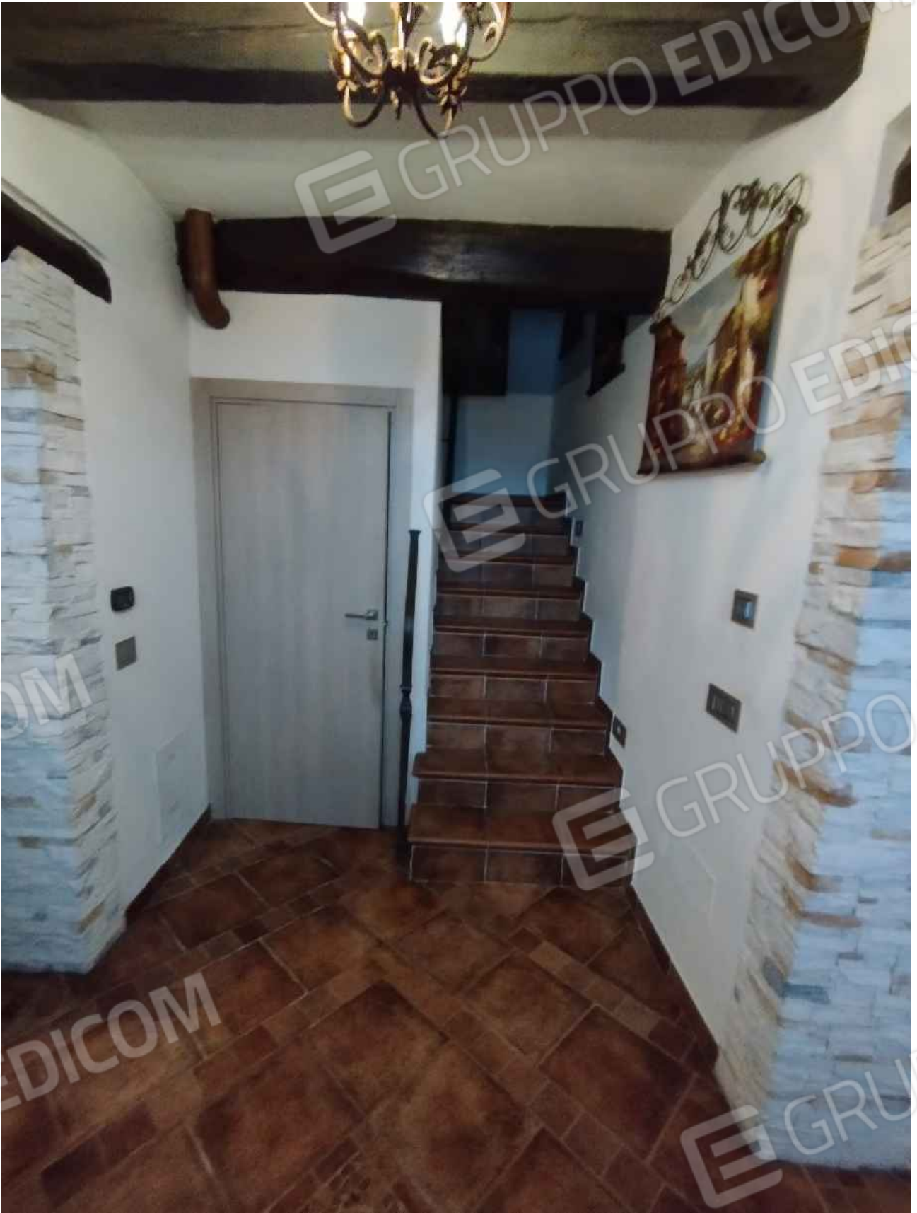
Vano scala che conduce al piano primo