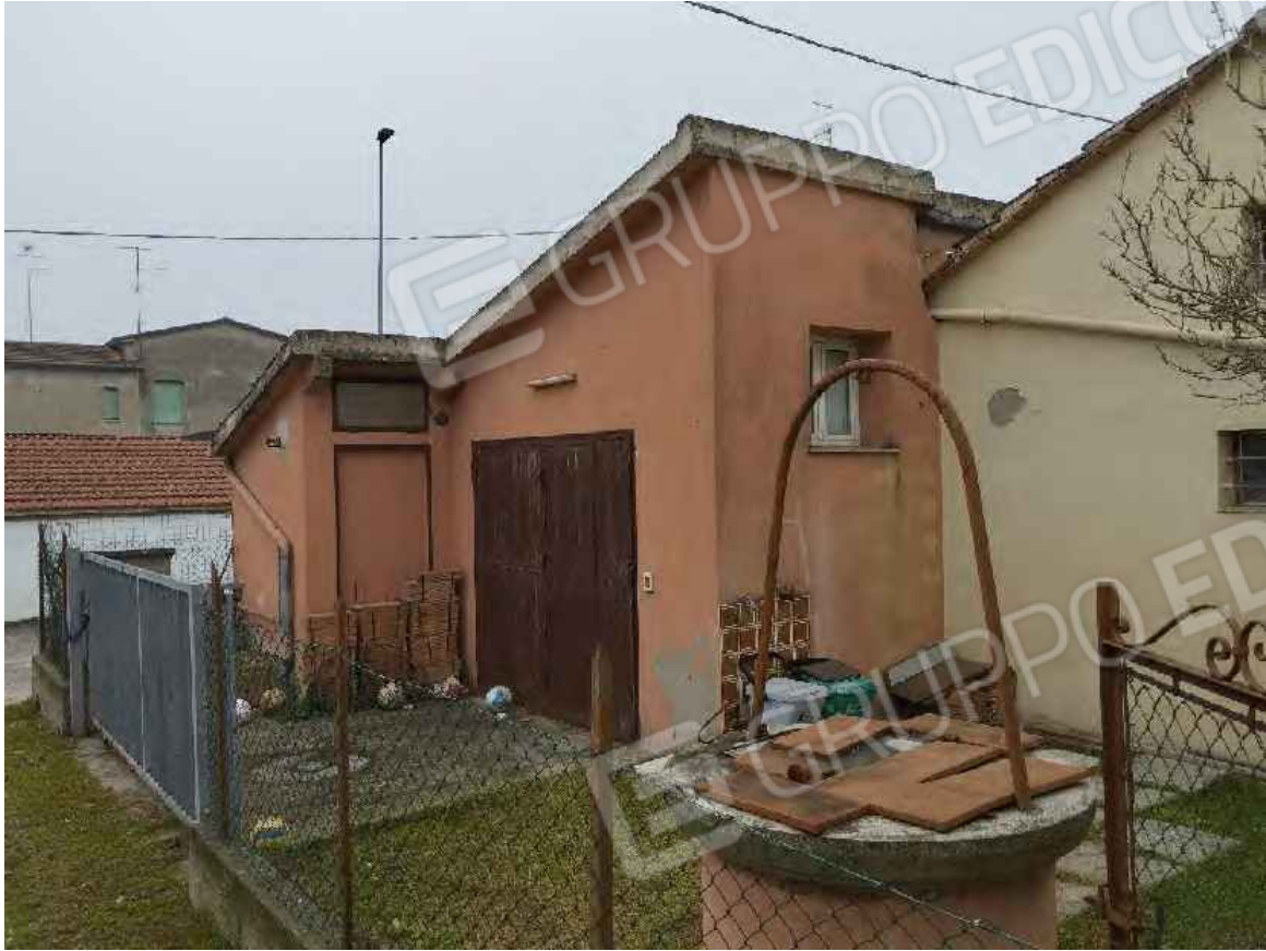
Vista del garage dal cortile