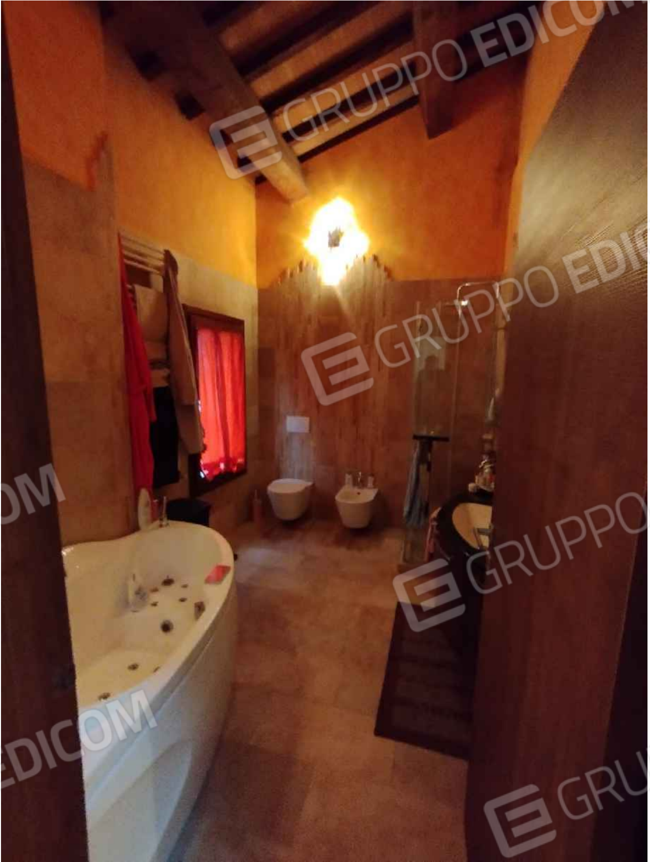
Bagno – P1