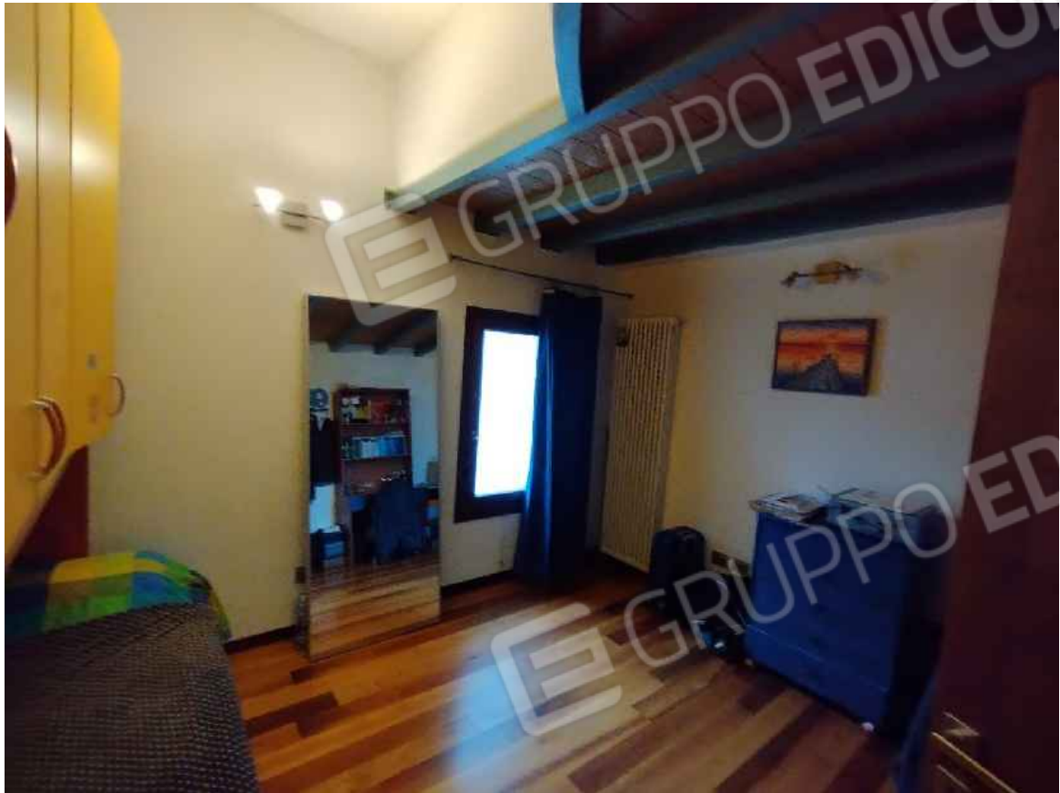
Camera da letto – P1