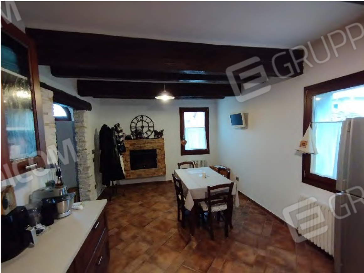
Zona pranzo PT