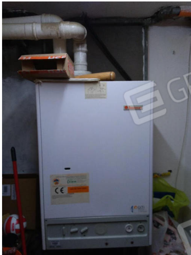
15. Caldaia murale tipo C