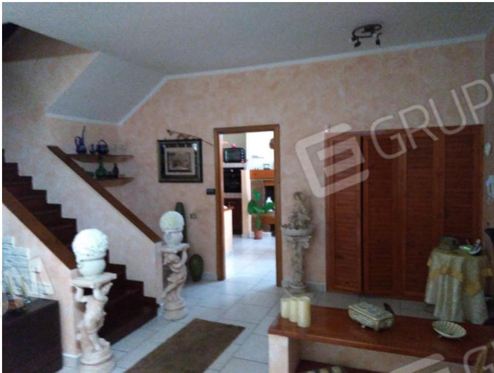
4- Sala ingresso