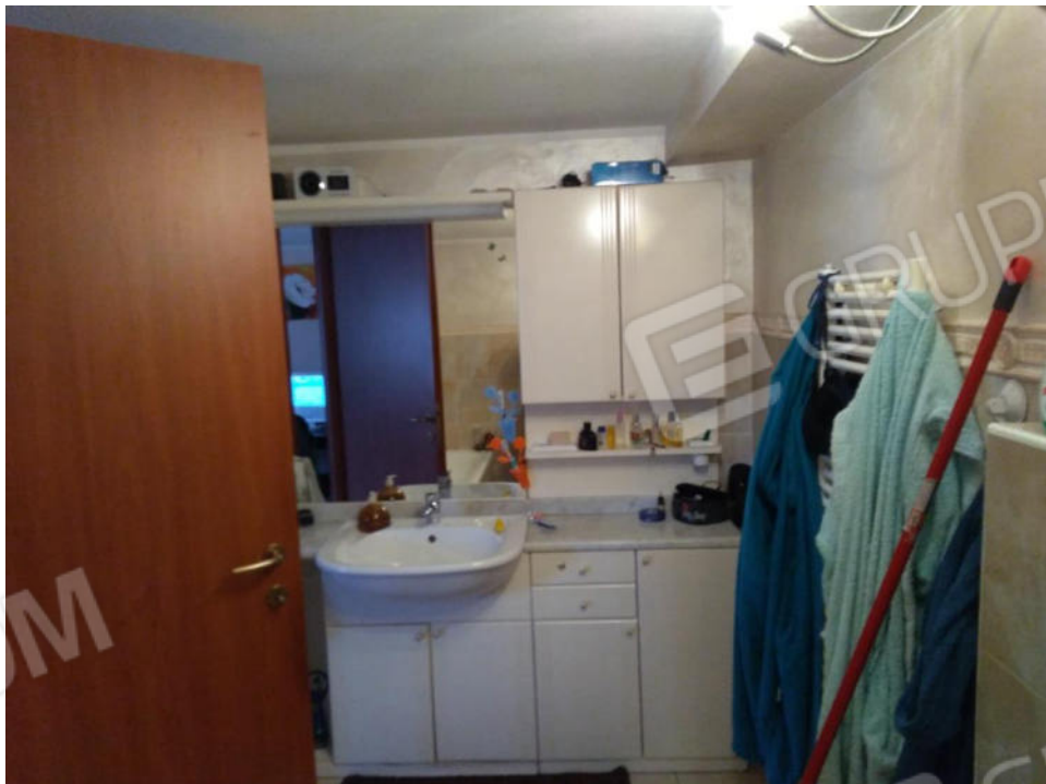
7. Lavanderia PT in ex Rimessa