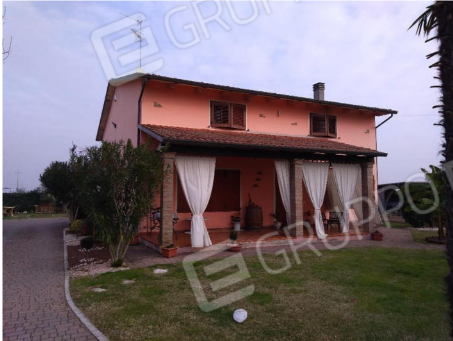
1 - Fronte principale edificio da Via Guberta