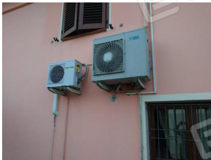
17. Unità esterne condizionatori