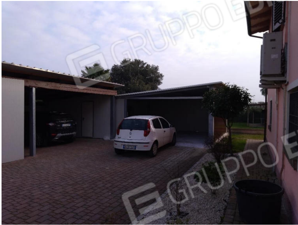
3- Volumi non autorizzati