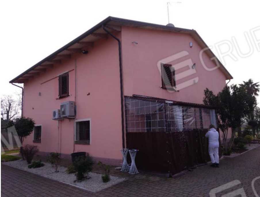
2- Retro edificio con tettoia da rimuovere