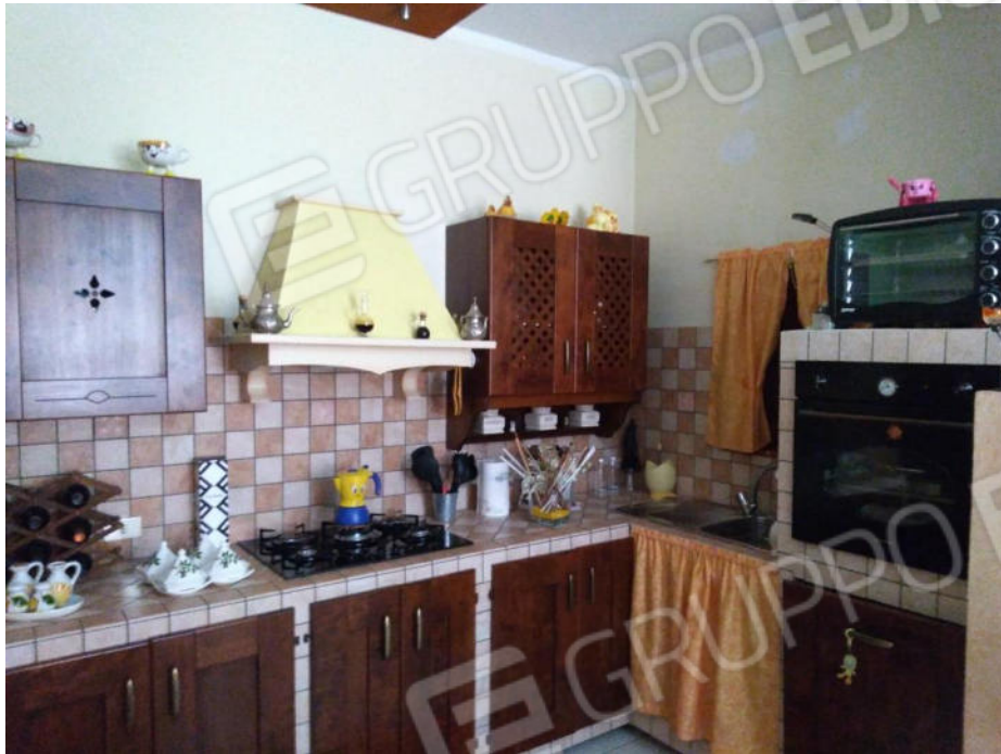
4- Cucina in muratura