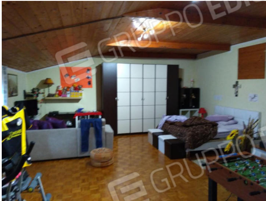
14. Soffitta abitabile