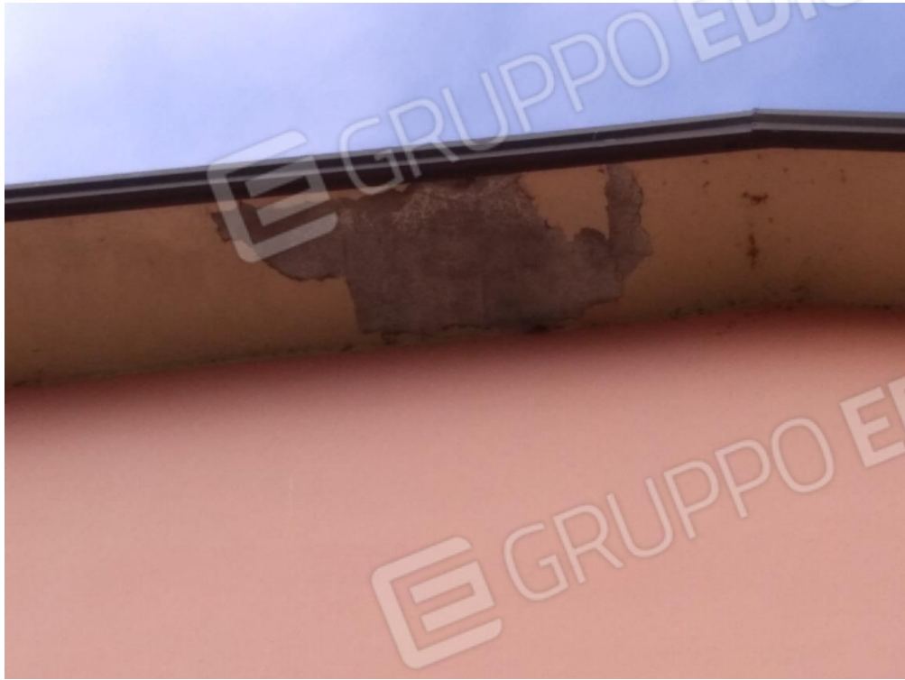
18. Segni di infiltrazioni in copertura, comunque esterne al perimetro.