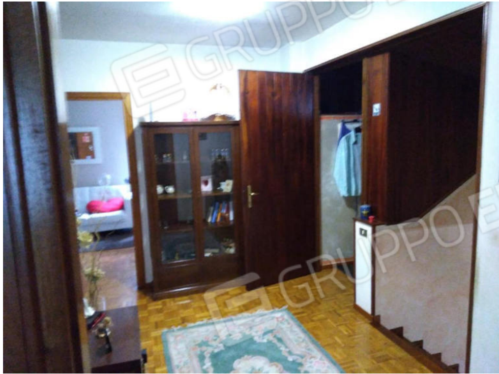
8. Disimpegno piano primo