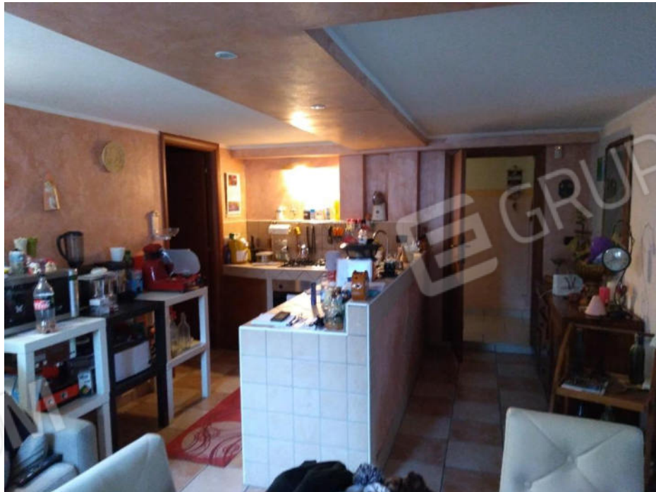
5.Ex autorimessa trasformata in taverna (da ripristinare)