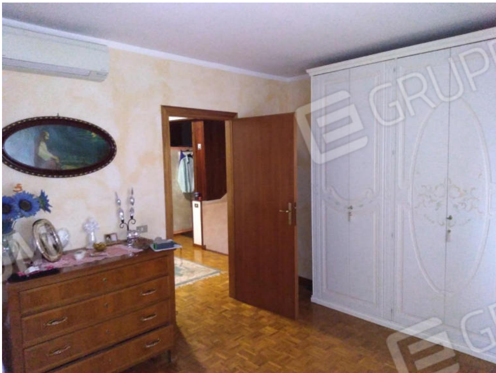
9. Letto matrimoniale