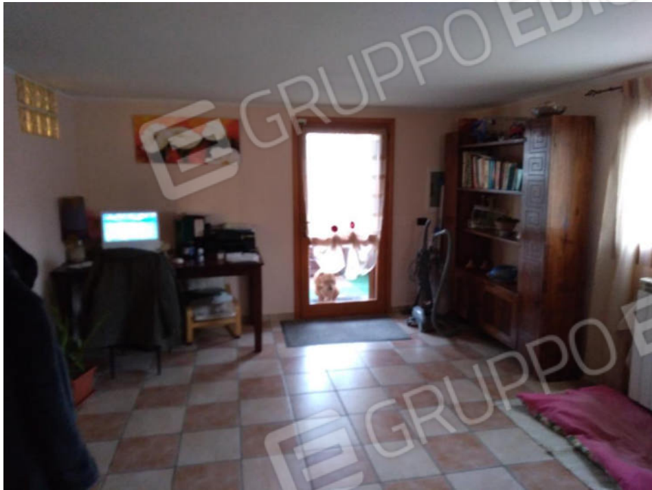
6. Ex autorimessa trasformata in taverna (da ripristinare)