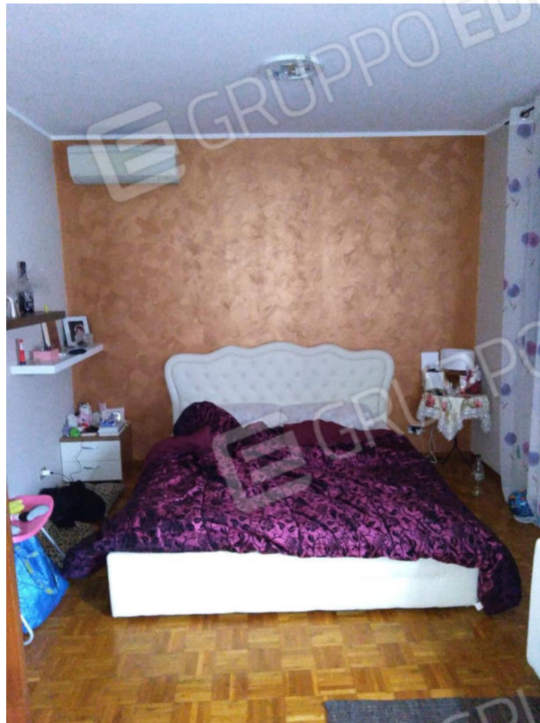
10. Seconda Letto matrimoniale