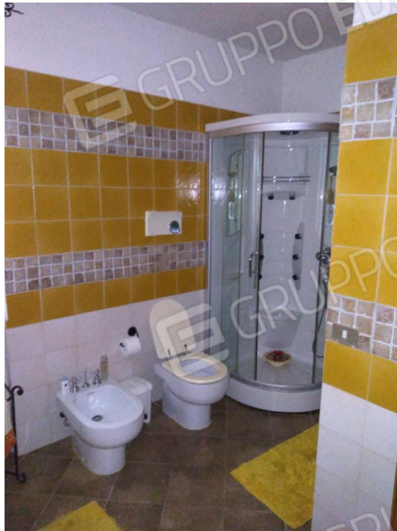
16. Bagno piano primo