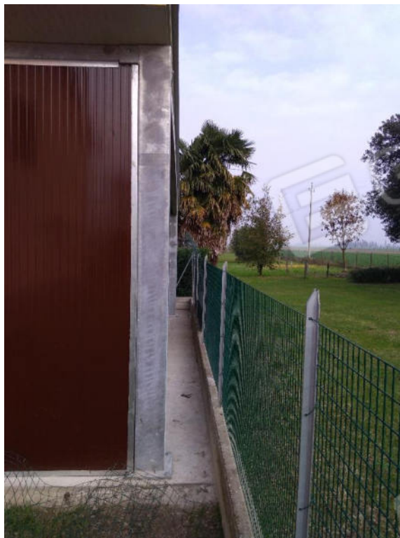
19. Struttura tettoie abusive