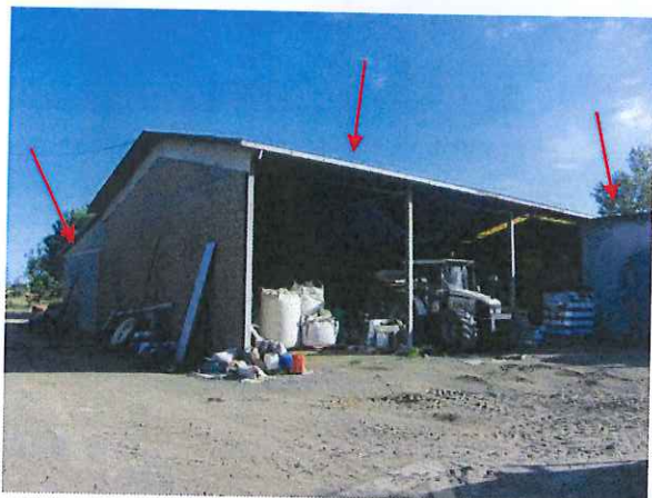
Fienile, cantina, ricovero attrezzi (sub. 3)