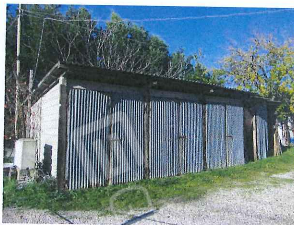
Ricovero attrezzi (sub. 3)