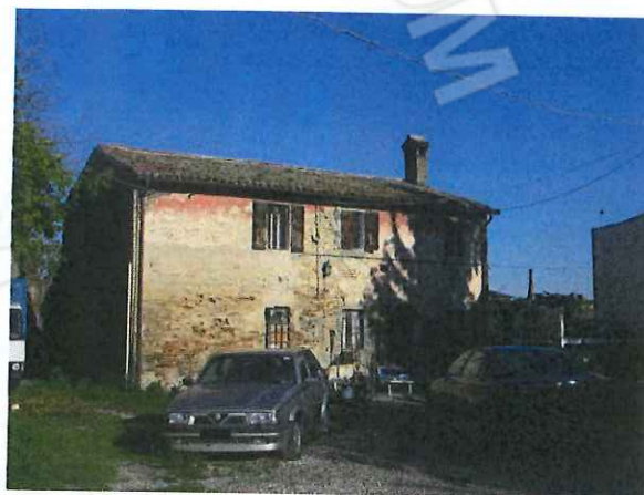
Abitazione (sub n. 2)