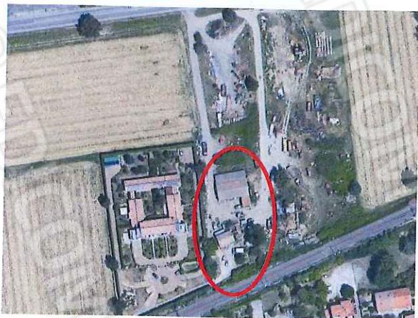
LOTTO A – satellite