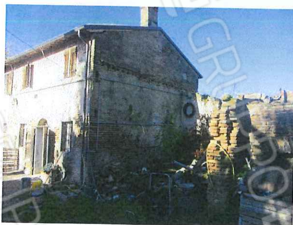
Unità collabente (sub. 4)