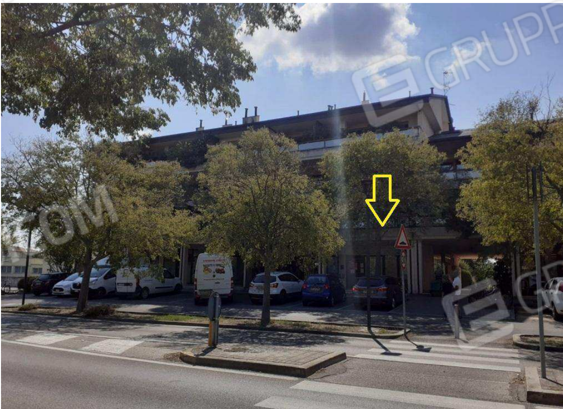
PROSPETTO NORD DEL FABBRICATO – UBICAZIONE U.I. SUB 160