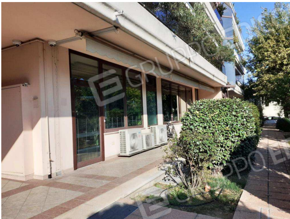
ESTERNI SUB 160 – LATO PORTICO SUD E PARTICOLARI FINITURE P. COMUNI