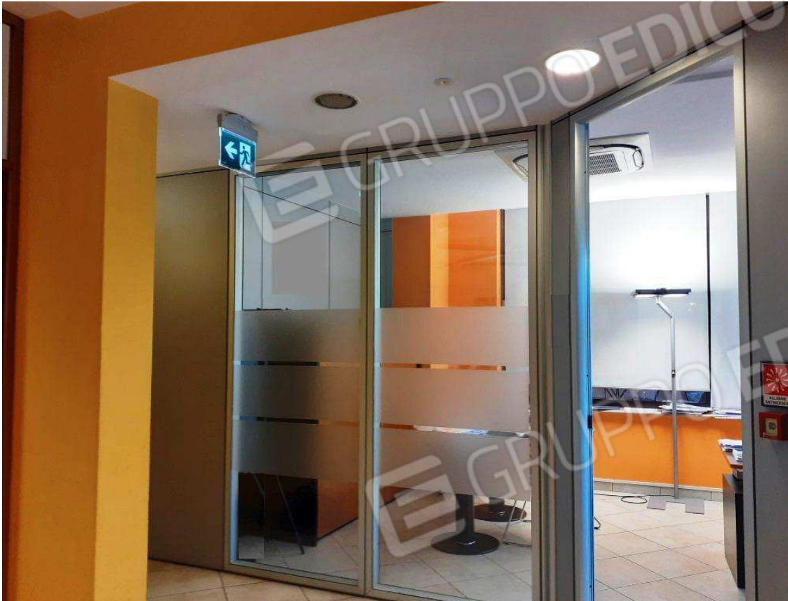
INTERNI SUB 160