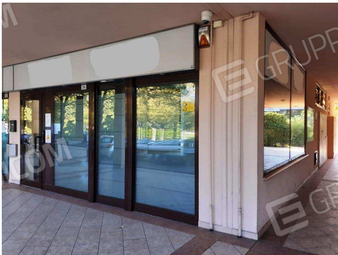
ESTERNI SUB 160 – LATI PORTICO NORD E OVEST