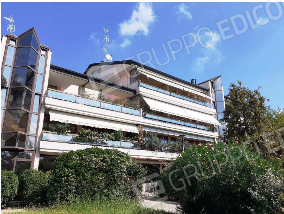
PROSPETTO SUD DEL FABBRICATO