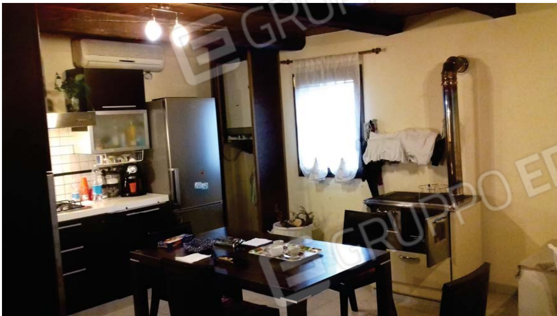
FOTO 13 ALLOGGIO PRINCIPALE SOGGIORNO CUCINA

Via M. D'Azeglio 38 48121 Ravenna www.stefanofocacciaarchitetti.it T +390544215210 F +390544246754 M. info@stefanofocacciaarchitetti.it C.F. FCCSFN66S10C553W P.I.V.A. 00599440393