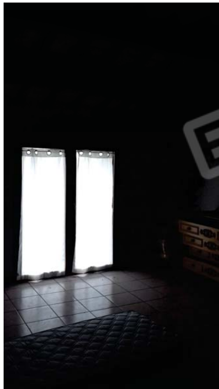
FOTO 12 STANZA DA LETTO UNITA' CON ACCESSO SUL RETRO