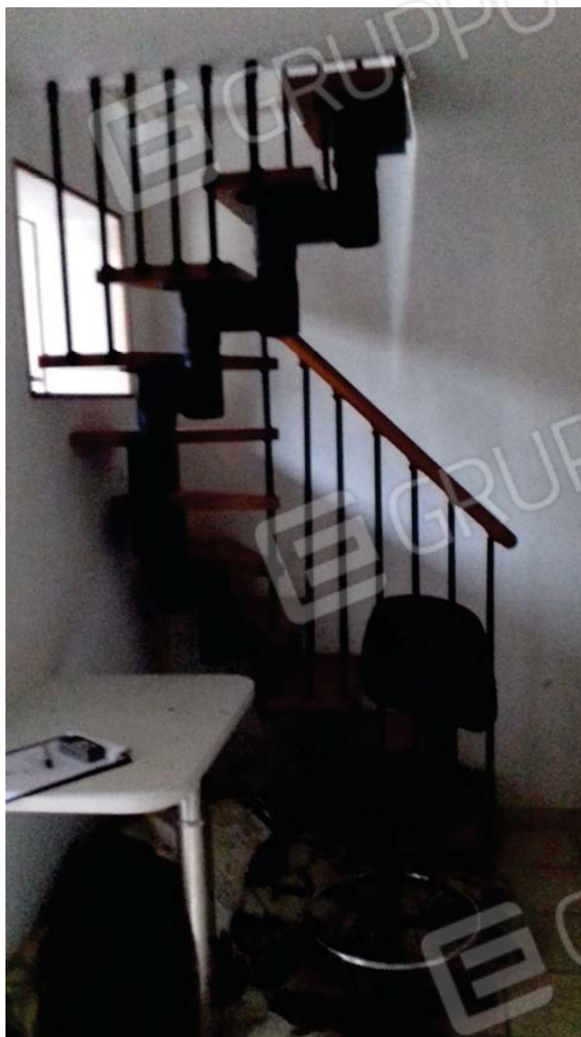
FOTO 9 SCALA DI ACCESSO AL PIANO PRIMO UNITA' SULRETRO

Via M. D'Azeglio 38 48121 Ravenna www.stefanofocacciaarchitetti.it T +390544215210 F +390544246754 M. info@stefanofocacciaarchitetti.it C.F. FCCSFN66S10C553W P.I.V.A. 00599440393