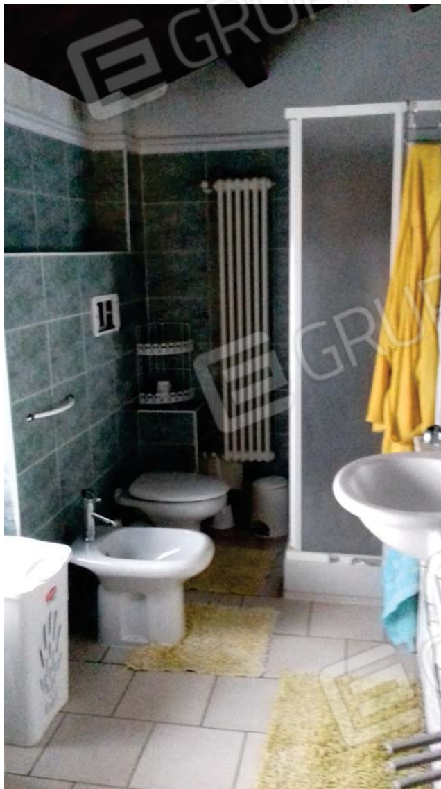
FOTO 15 ALLOGGIO PRINCIPALE BAGNO PRIMO PIANO

Via M. D'Azeglio 38 - 48121 Ravenna - www.stefanofocacciaarchitetti.it T +390544215210 F +390544246754 M. info@stefanofocacciaarchitetti.it C.F. FCCSFN66S10C553W P.I.V.A. 00599440393