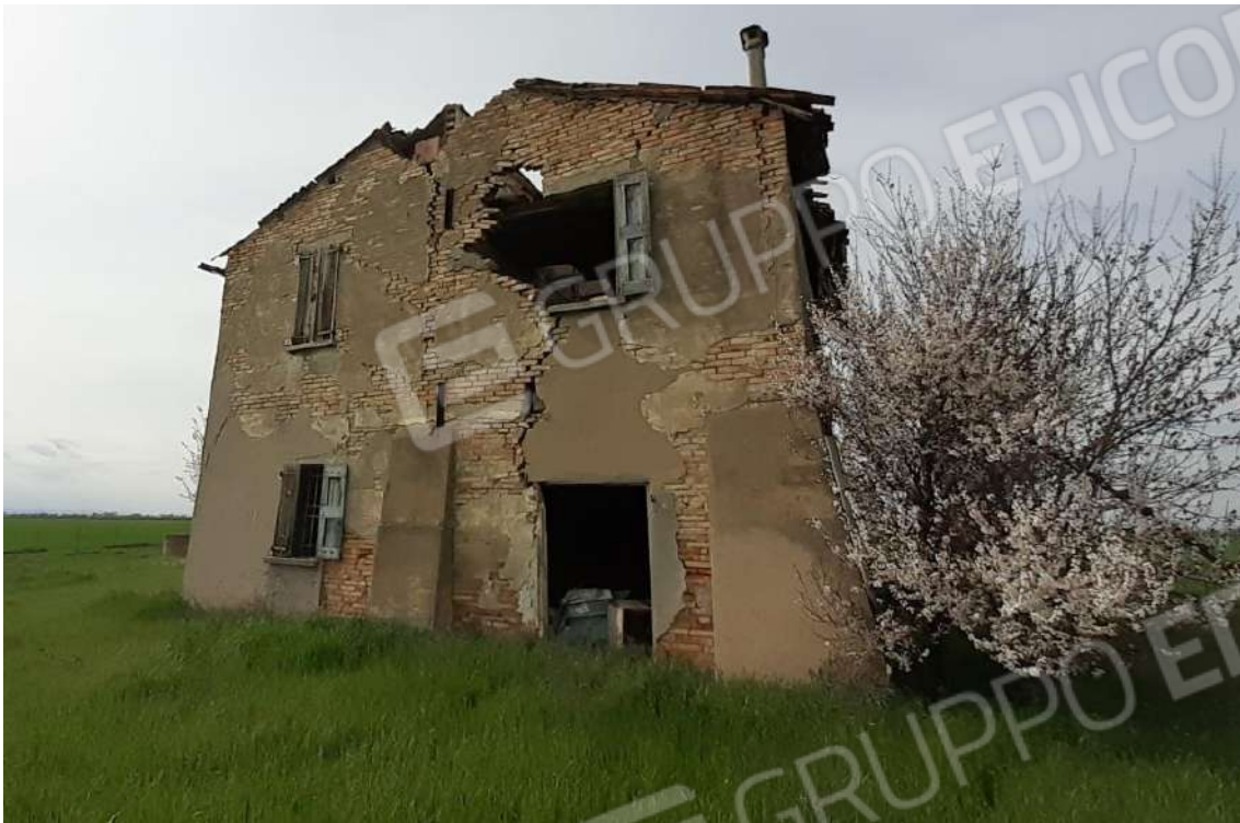
VISTA DEL PROSPETTO EST DELL' ABITAZIONE COLLABENTE