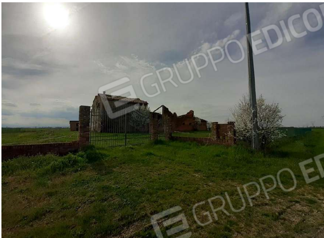
VISTA LATERALE DELLA CANCELLATA DI INGRESSO CON APERTURE CARRABILE E PEDONALE E VISTA GENERALE DEL COMPLESSO