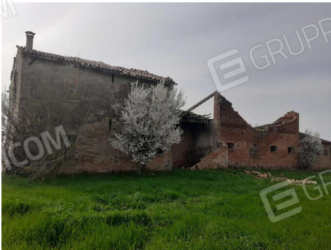
VISTA DEL PROSPETTO NORD DEL FABBRICATO ABITAZIONE CON STALLA COLLABENTE ADIACENTE