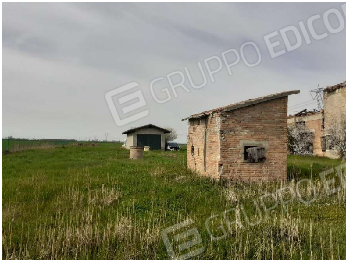
VISTA DEI PROSPETTI SUD - EST DELLA RIMESSA E DEL CORPO A DESTINAZIONE POLLAIO NELLA CORTE