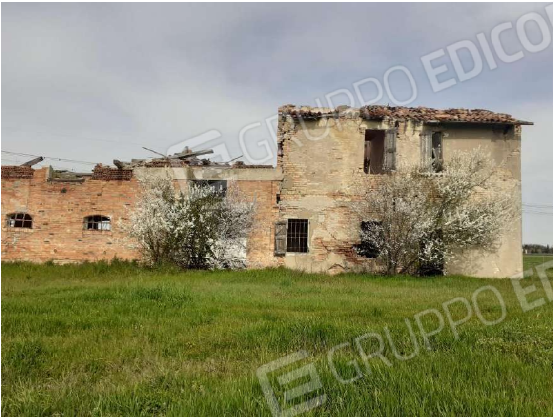
VISTA DEL PROSPETTO SUD DELL' ABITAZIONE COLLABENTE E DELLA STALLA/FIENILE ADIACENTE