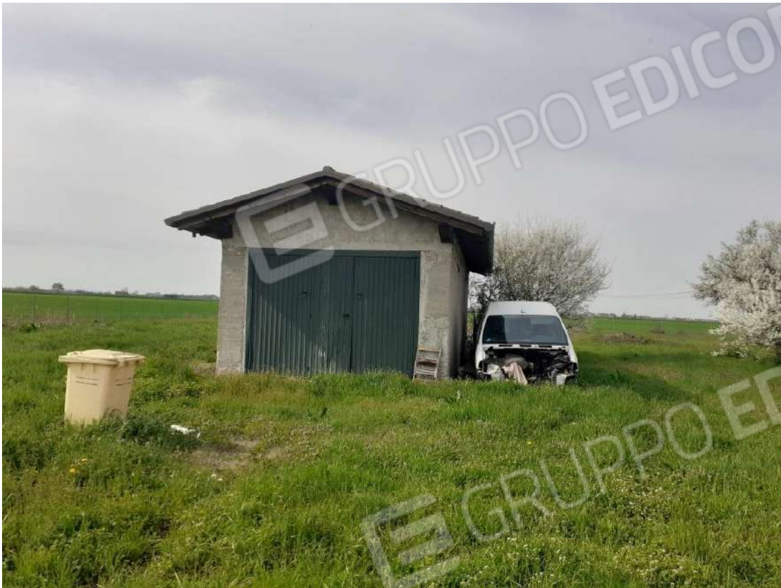
VISTA DEL PROSPETTO EST DELLA RIMESSA