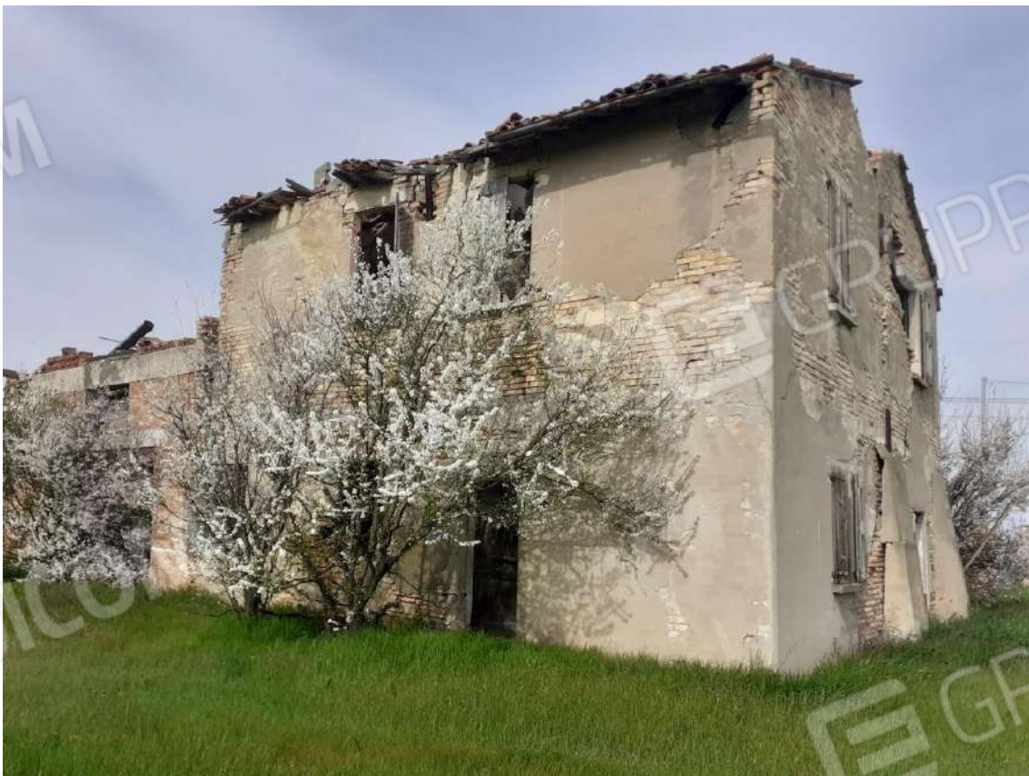
VISTA DEL PROSPETTO SUD DELL' ABITAZIONE COLLABENTE