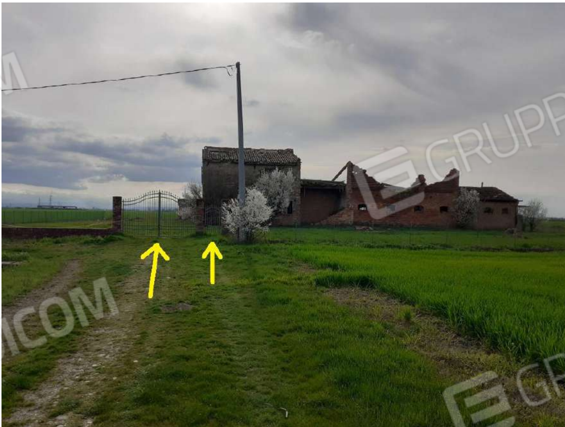
VISTA DELLA CANCELLATA DI INGRESSO CON APERTURA CARRABILE E CANCELLINO PEDONALE - VISTA GENERALE DEL COMPLESSO -