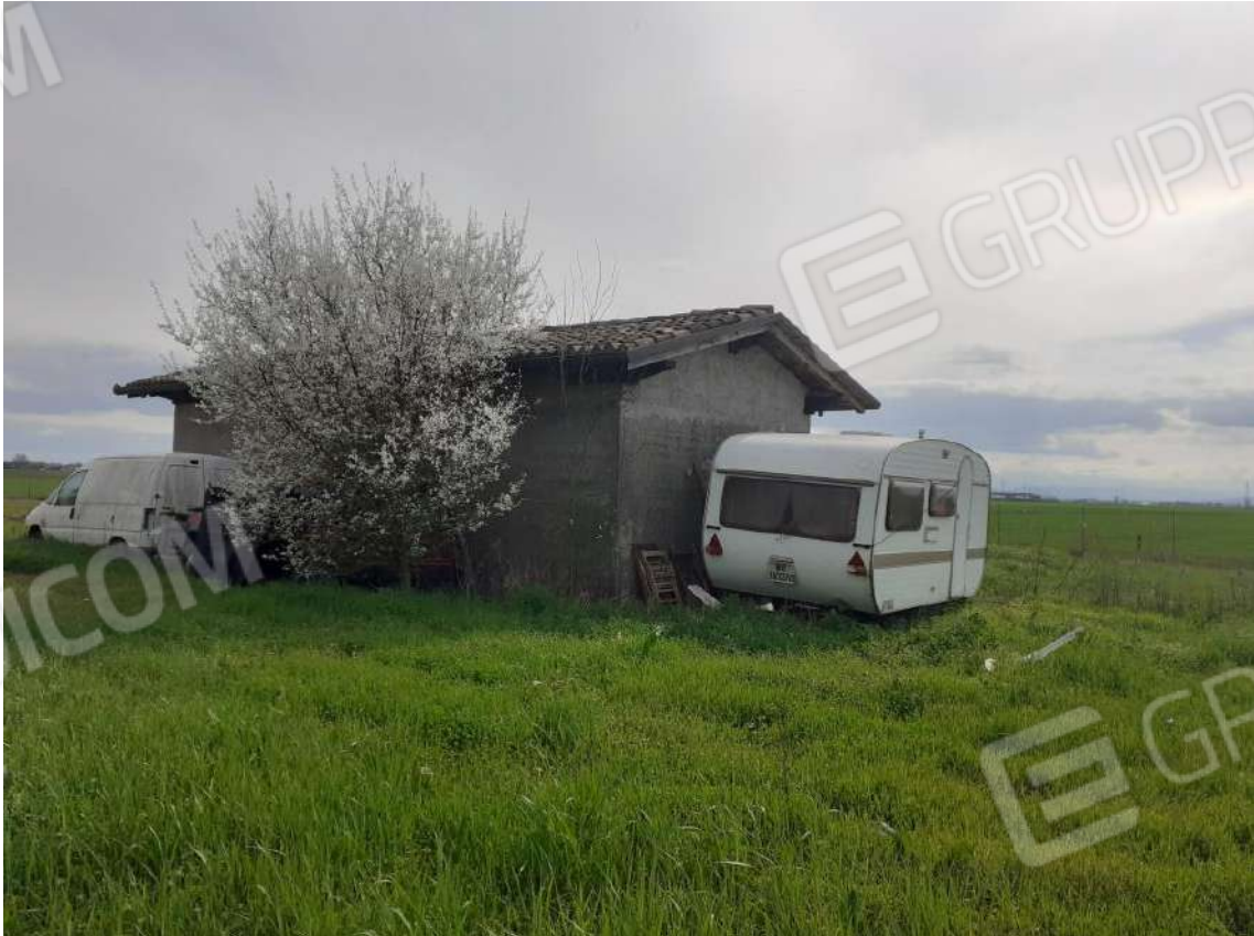
VISTA DEI PROSPETTI NORD E OVEST DELLA RIMESSA