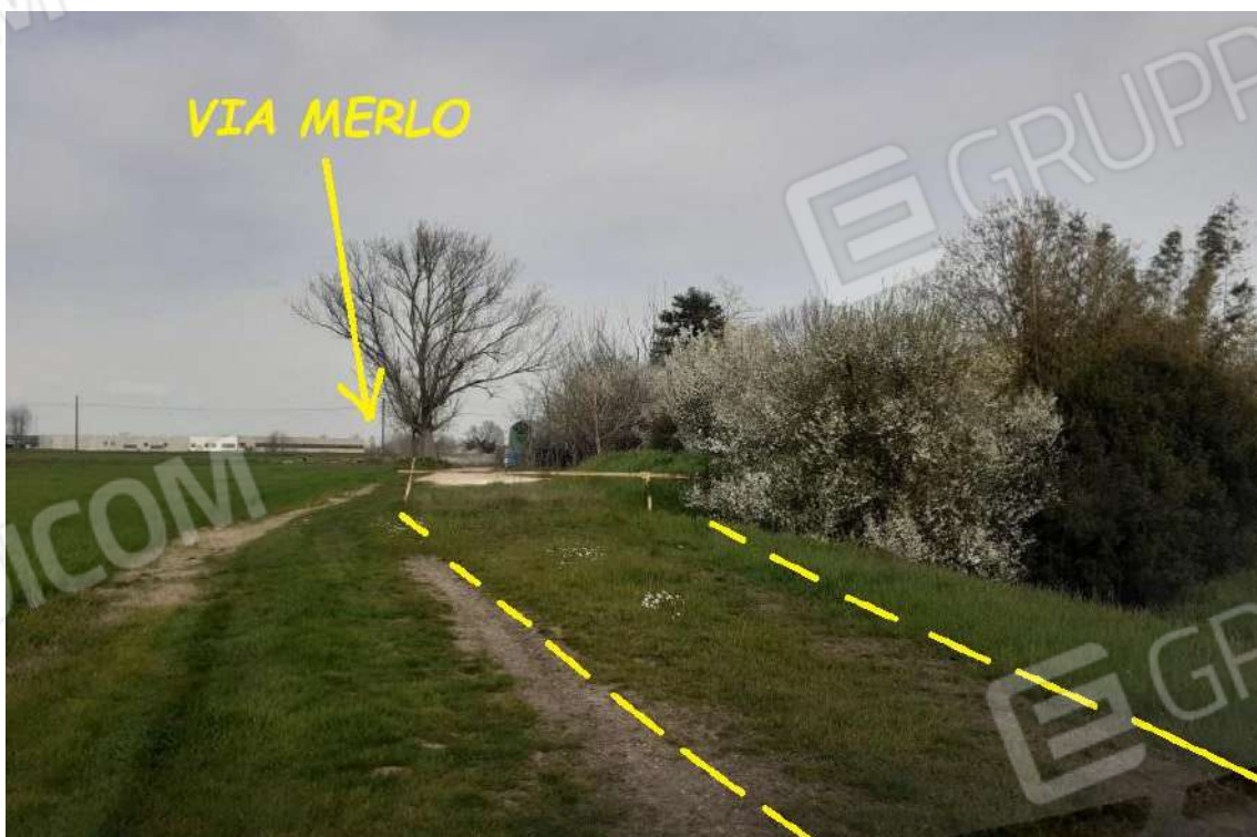
VISTA DELLO STRADELLO DI ACCESSO IN DIREZIONE VIA MERLO E DELLA SBARRA DI DELIMITAZIONE PER L'INGRESSO