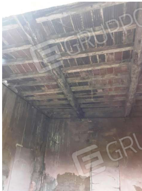
VISTA PROSPETTO NORD DEL POLLAIO E PARTICOLARE DEL SOLAIO DEL PIANO PRIMO DELL'ABITAZIONE