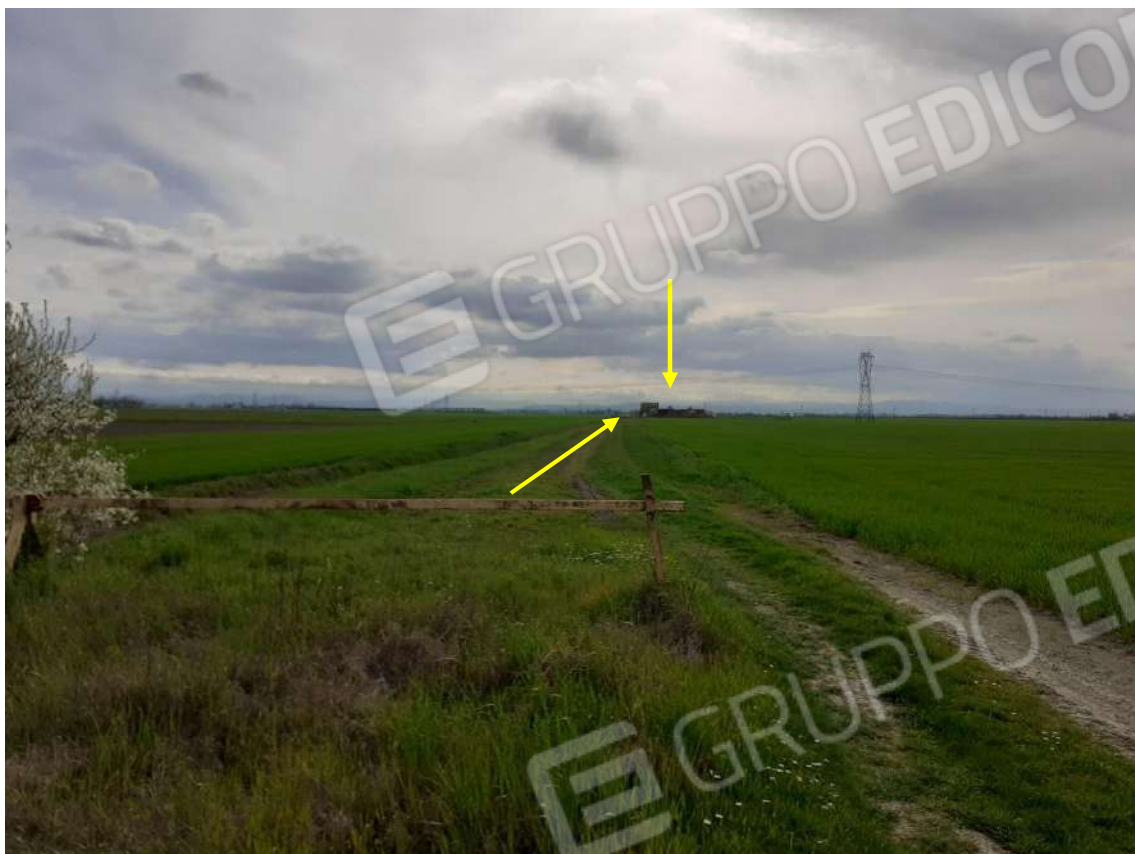
VISTA DELLO STRADELLO DI ACCESSO IN DIREZIONE DEL COMPLESSO E DELLA SBARRA DI DELIMITAZIONE D'INGRESSO