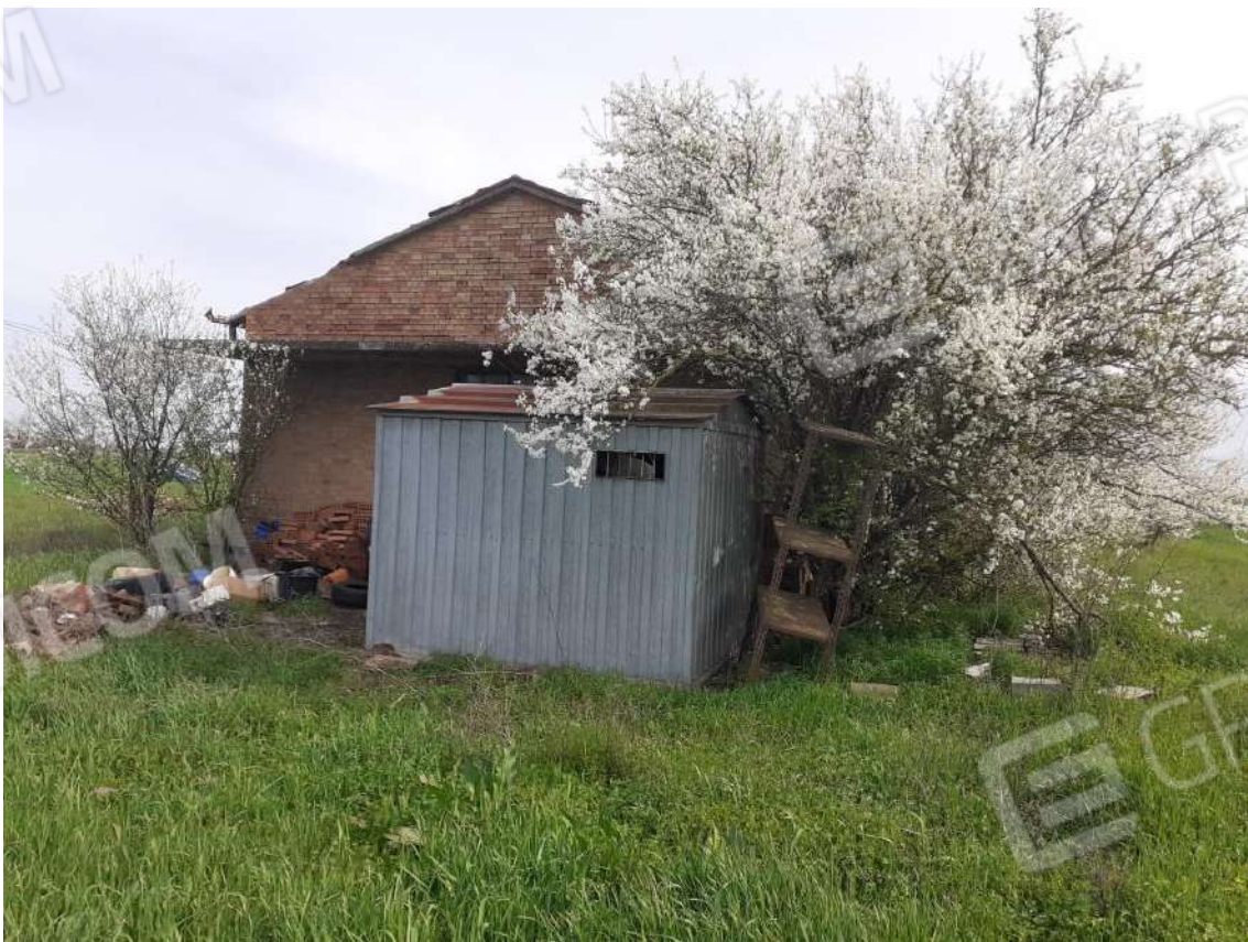
VISTA DEL PROSPETTO NORD – OVEST DELLA STALLA/FIENILE E BOX IN LAMIERA