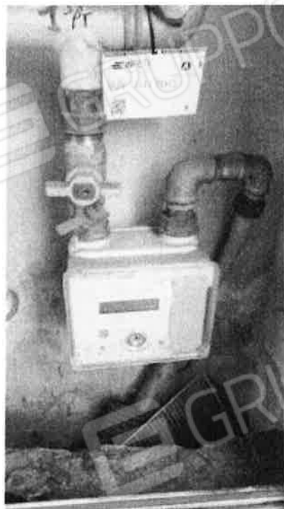
11. Contatore Gas Metano

Procedimento di esecuzione immobiliare n.88/2023 R.G.E.