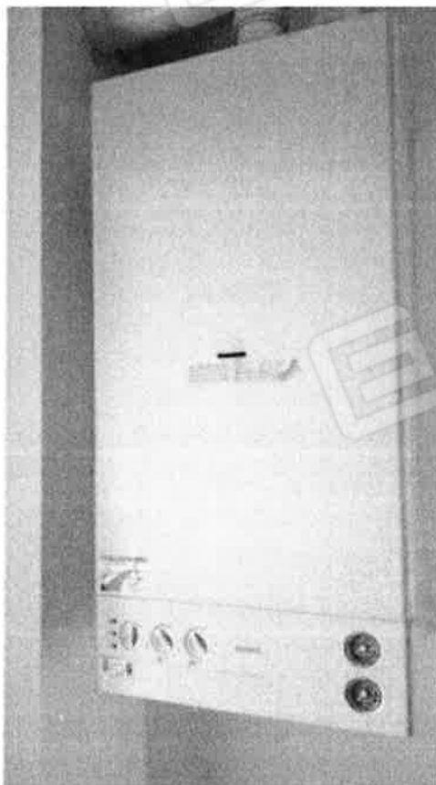
8. Disimpegno con caldaia

Procedimento di esecuzione immobiliare n.88/2023 R.G.E.