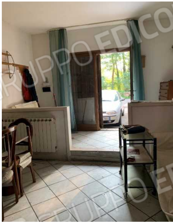
VISTA DEL SOGGIORNO VERSO IL DISIMPEGNO CON ANGOLO COTTURA E VERSO L'INGRESSO SU VIA RAVEGNANA