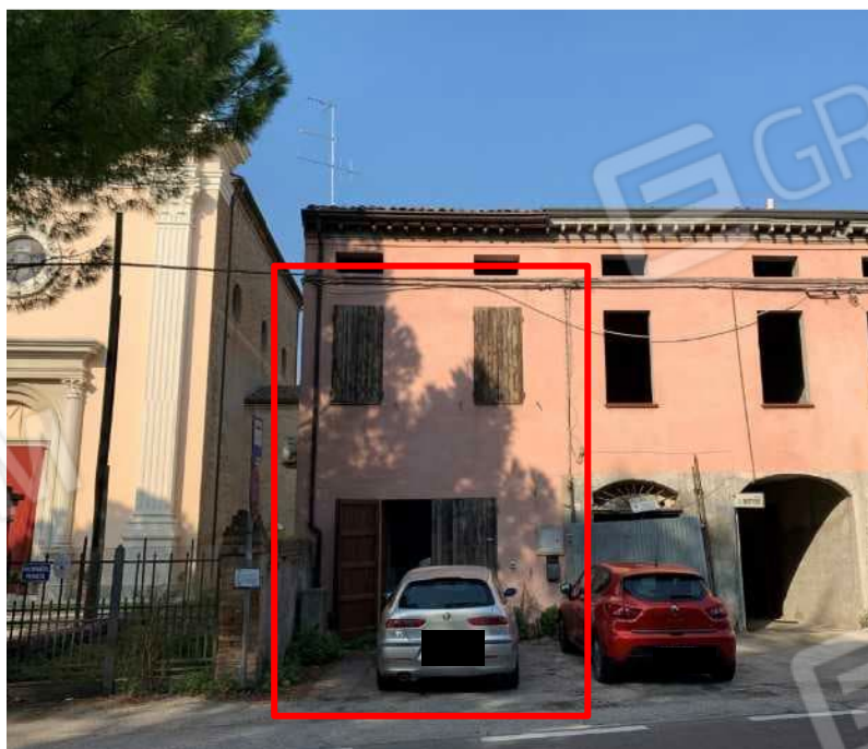
VISTA EDIFICIO PROSPETTO FRONTALE SU VIA RAVEGNANA (SS67) : INDIVIDUAZIONE DELLA PROPRIETA'