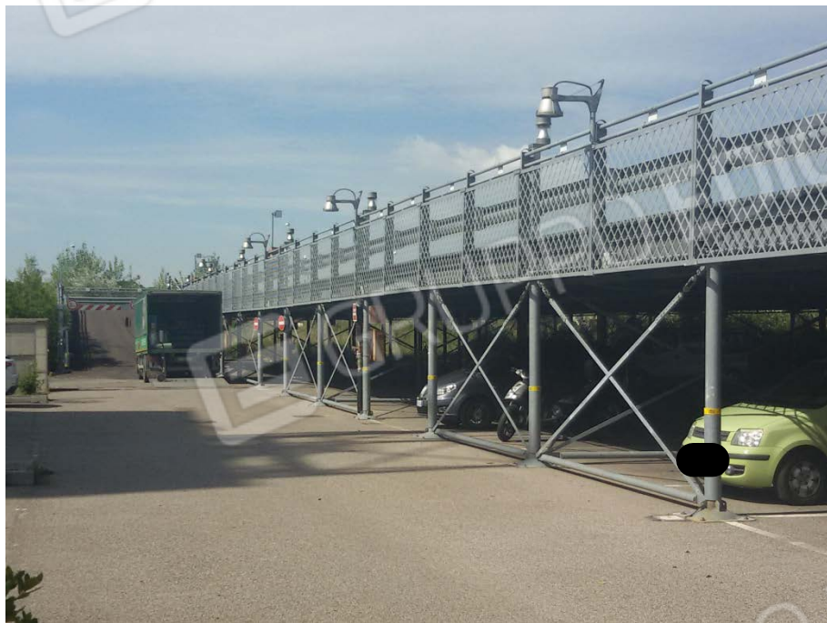
Fotografia 3 – Lotto 2 – Parcheggio