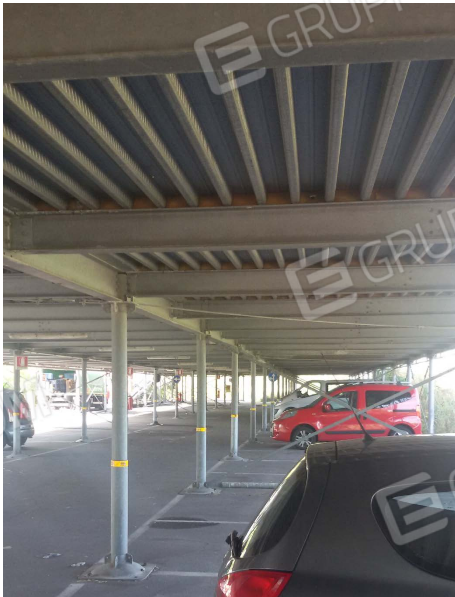
Fotografia 4 – Lotto 2 – Parcheggio Piano Terra