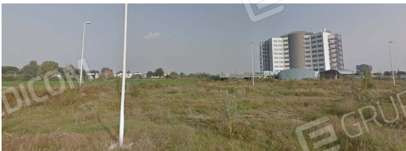
Fotografia 2 – Lotto 1 – Terreno edificabile