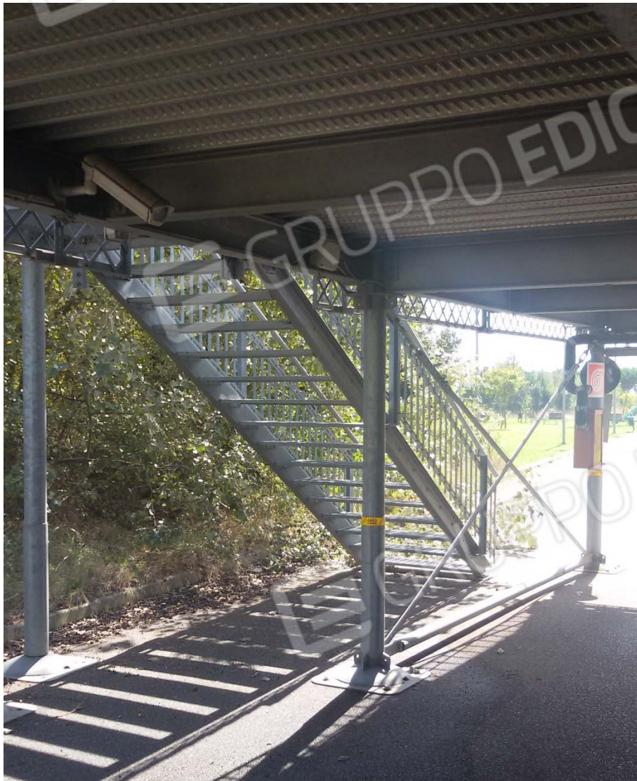
Fotografia 5 – Lotto 2 – Scala di accesso al Piano Primo