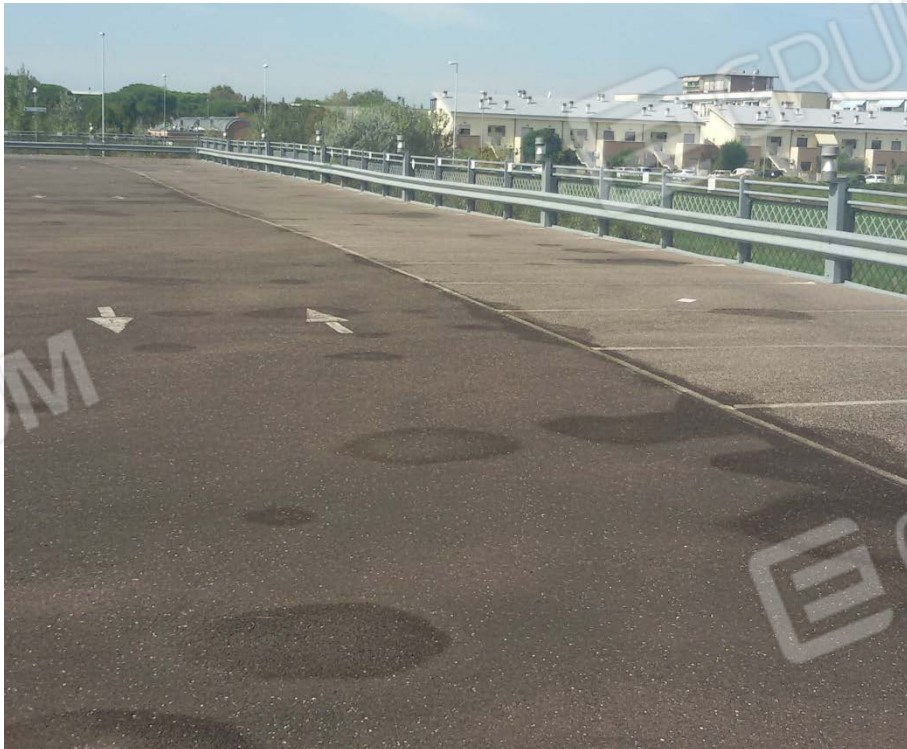
Fotografia 6 – Lotto 2 – Parcheggio Piano Primo