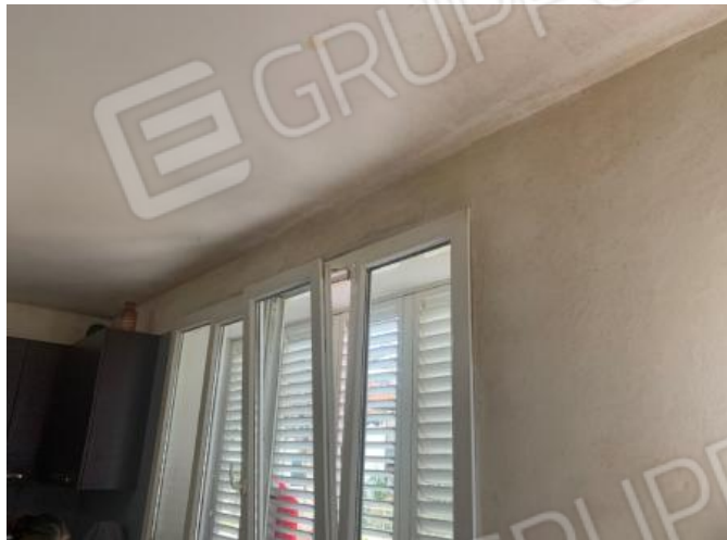
PARTICOLARI DEL DEGRADO DA MUFFE E CONDENZA ZONA PRANZO - INGRESSO SUL LATO SUD