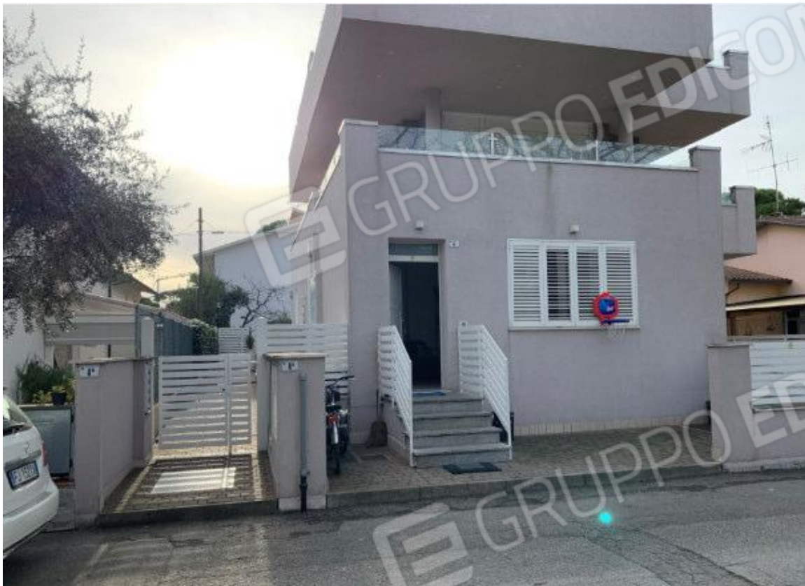
VISTA DA VIA DEL GIRASOLE, PROSPETTO PRINCIPALE CON SCALA DI ACCESSO ALL'APPARTAMENTO