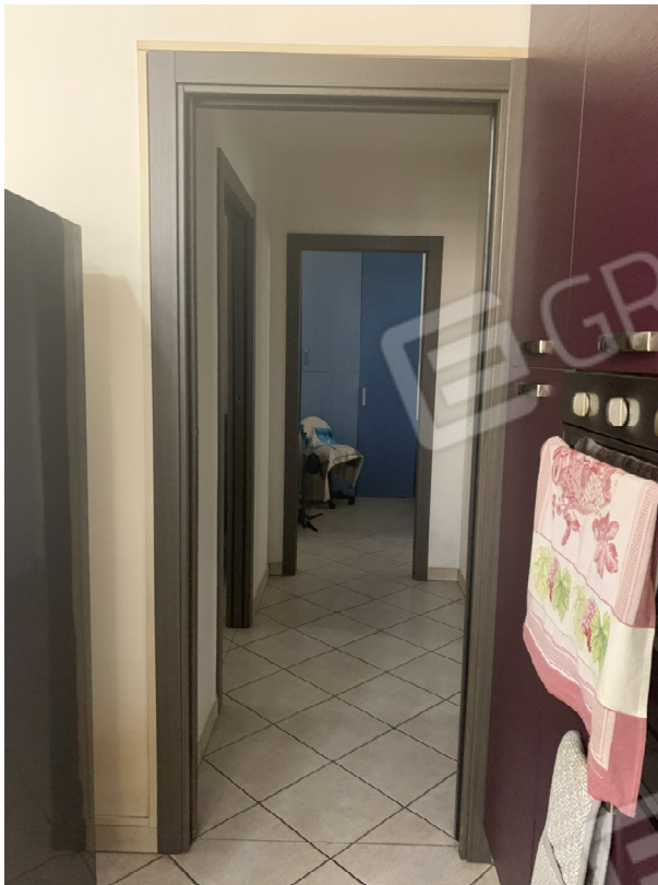
ZONA INGRESSO CON SOGGIORNO E ANGOLO COTTURA. PARTICOLARE DEL DISIMPEGNO DI DISTRIBUZIONE DELLA ZONA NOTTE