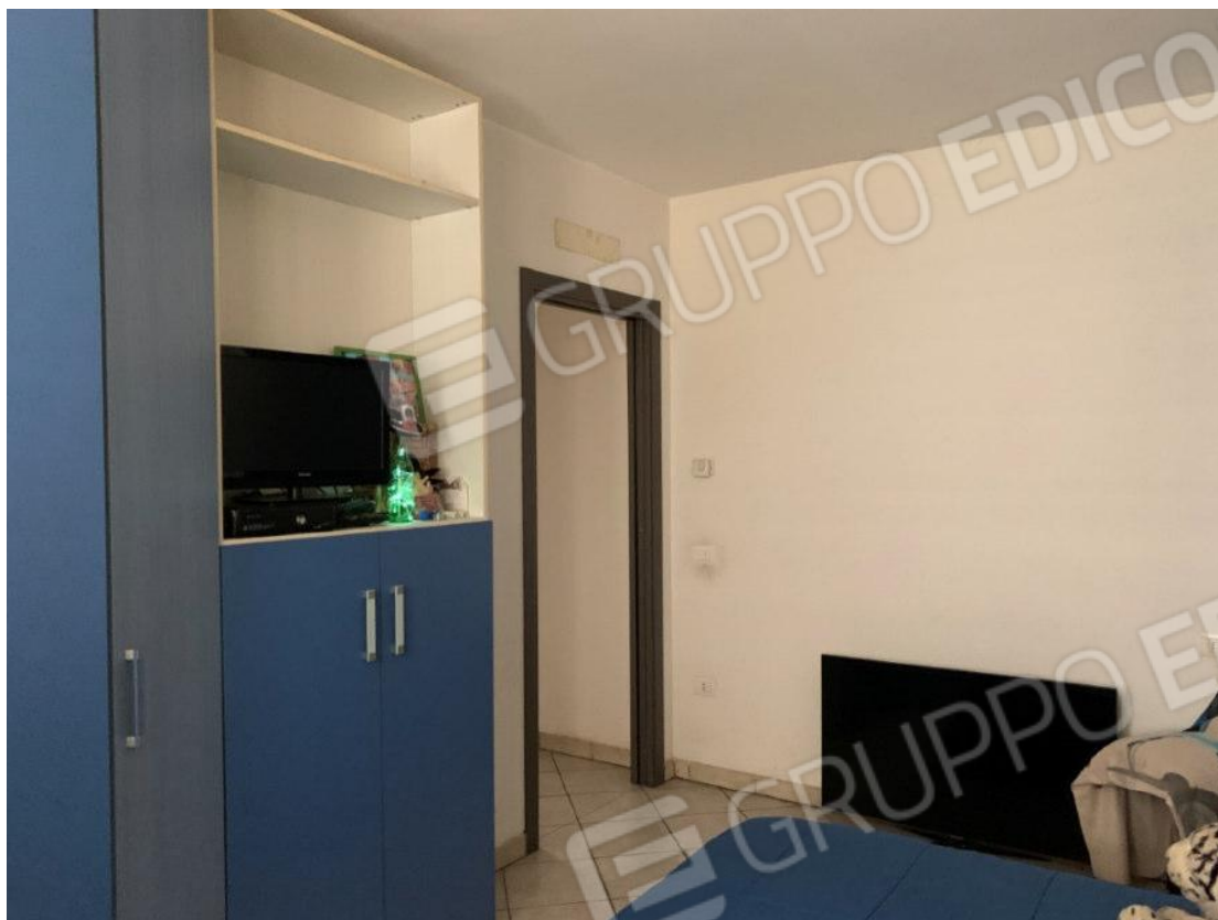
CAMERA DOPPIA VISTE GENERALI