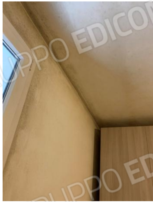
PARTICOLARI DEL DEGRADO DA MUFFE E CONDENZA ZONA CAMERA MATRIMONIALE – LATO OVEST E COPERTURA VERSO TERRAZZO