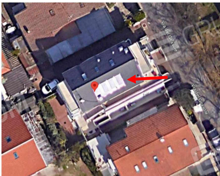
VISTA AEREA CON PARTICOLARE DELLA COPERTURA DOVE SONO INSTALLATI I PANNELLI SOLARI PER LA PRODUZIONE DI ACS