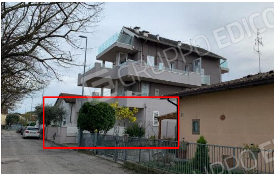
VISTA EDIFICIO SU VIA DEL GIRASOLE (ANGOLO SUD-EST): INDIVIDUAZIONE DELLA PROPRIETA'