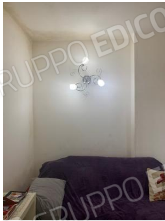
PARTICOLARI DEL DEGRADO DA MUFFE E CONDENZA ZONA SOGGIORNO – LATO OVEST E COPERTURA VERSO TERRAZZO