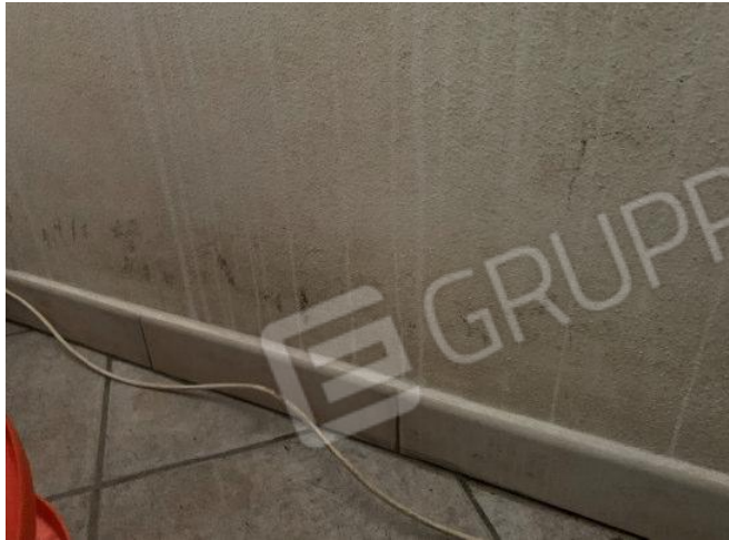
PARTICOLARI DEL DEGRADO DA MUFFE E CONDENZA ZONA CAMERA DOPPIA – LATO EST E COPERTURA VERSO TERRAZZO