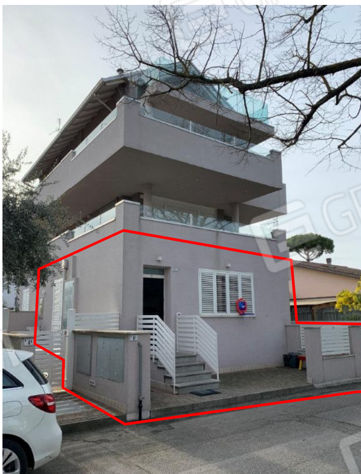
VISTA EDIFICIO SU VIA DEL GIRASOLE (ANGOLO SUD-OVEST): INDIVIDUAZIONE DELLA PROPRIETA'