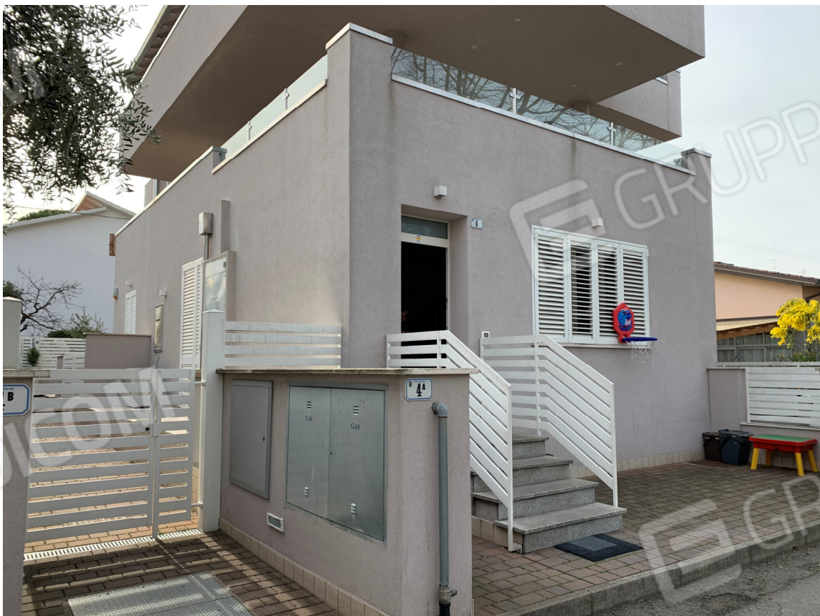
VISTA DA VIA DEL GIRASOLE, ANGOLO SUD-OVEST CON PARTICOLARE DELL'AREA DI ACCESSO COMUNE AI BAULETTI DEI CONTATORI ED AI POZZETTI