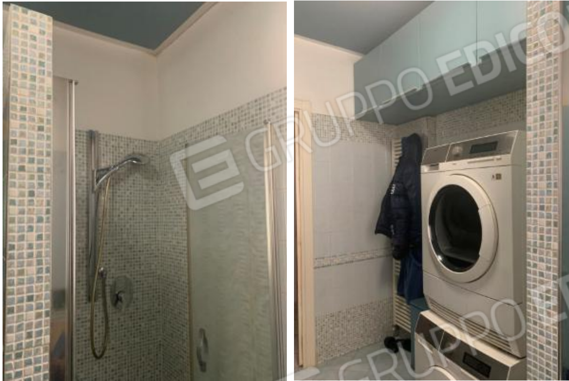
PARTICOLARI FINITURE DEL BAGNO E TERMOARREDO