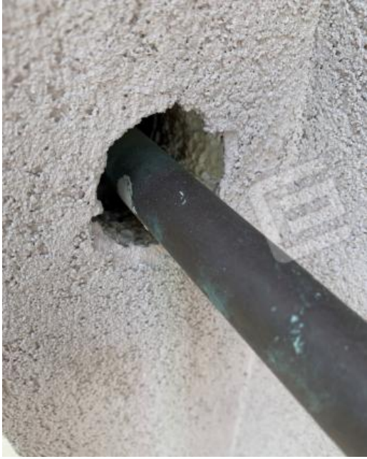
PARTICOLARE COIBENTAZIONE ESTERNA