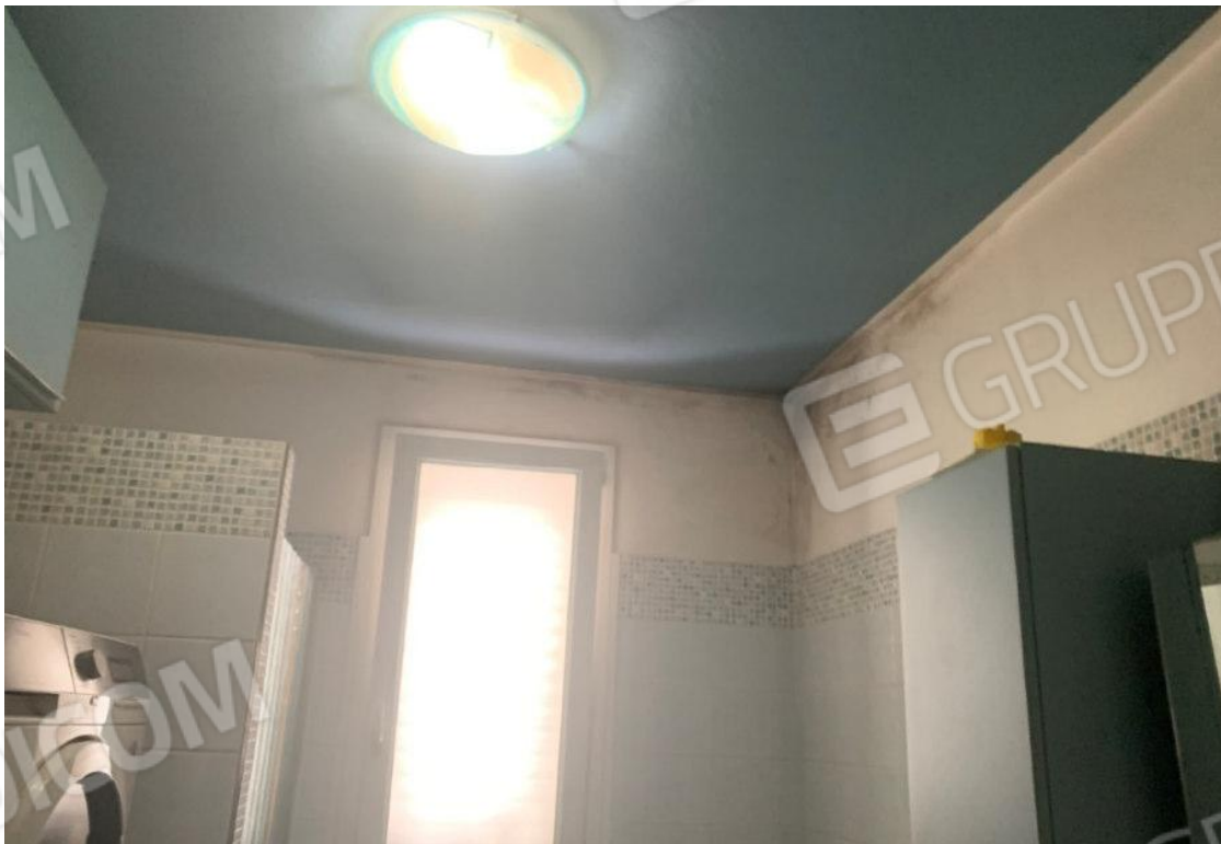
PARTICOLARI DEL DEGRADO DA MUFFE E CONDENZA ZONA BAGNO – LATO EST E COPERTURA VERSO TERRAZZO