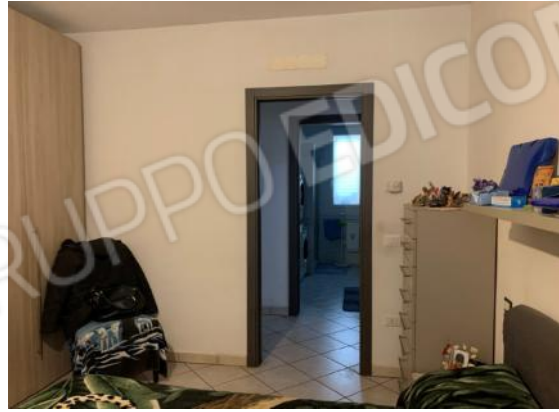
CAMERA MATRIMONIALE VISTE GENERALI