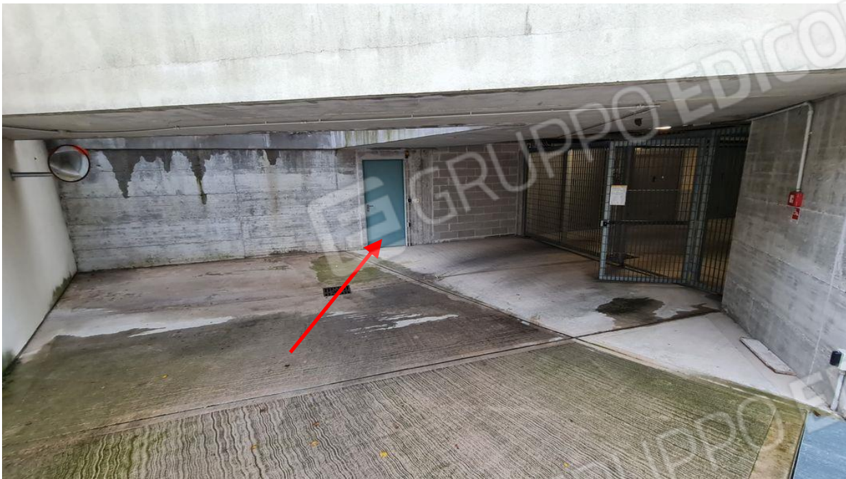
Porta deposito biciclette