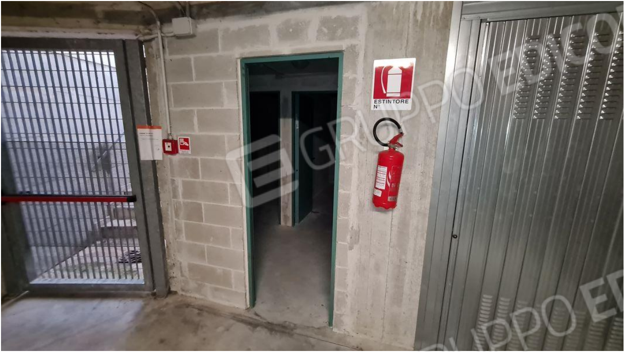
Disimpegno comune lotti 12 e 13