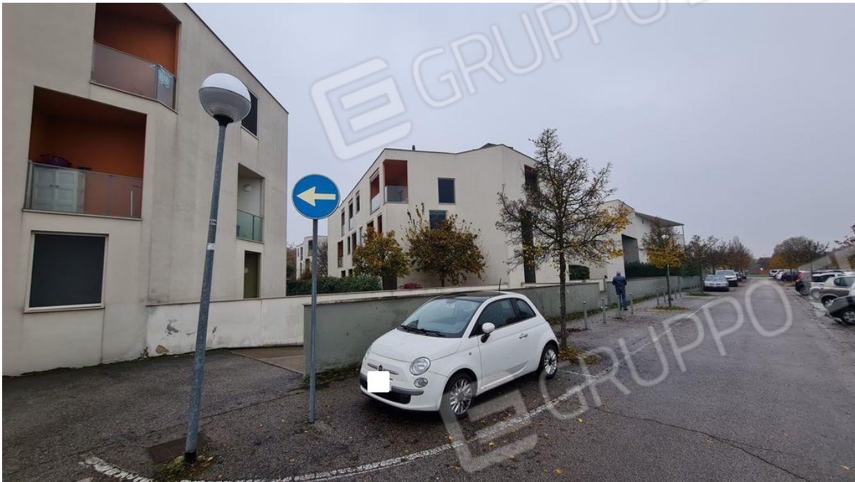
Rampa di accesso interrato lotti 1-7