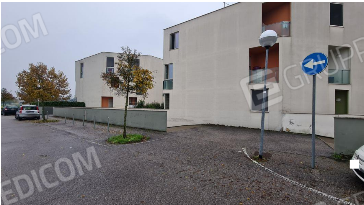
Rampa di accesso interrato lotti 8-15