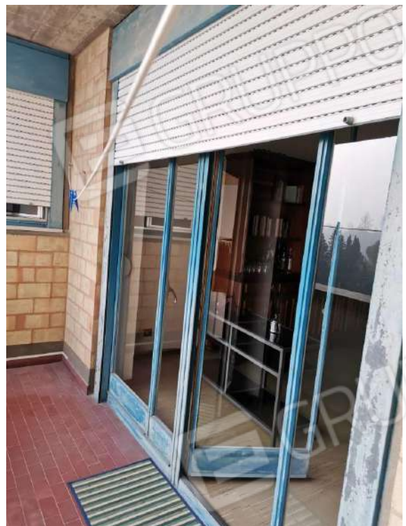
APPARTAMENTO (MAPP.680 SUB 12) LOGGIA LATO NORD CHIUSA CON VETRATE E LOGGIA DEL SOGGIORNO LATO SUD