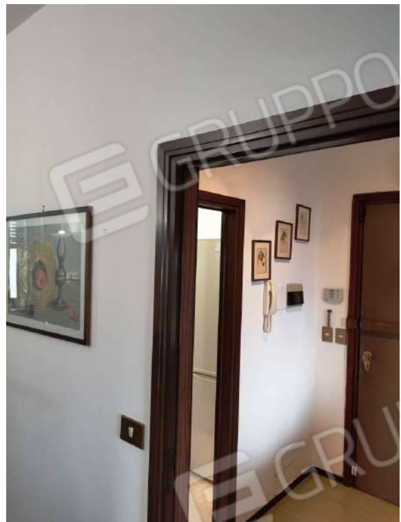
APPARTAMENTO (MAPP.680 SUB 12) INTERNI: INGRESSO E DISIMPEGNO SOGGIORNO E CUCINA