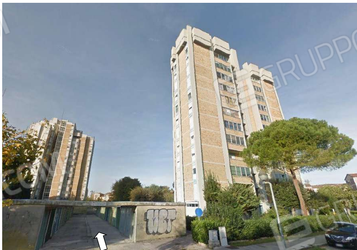
PROSPETTI EST E SUD DELLA "TORRE C" INGRESSO CARRABILE AI GARAGE DA VIA CAORLE