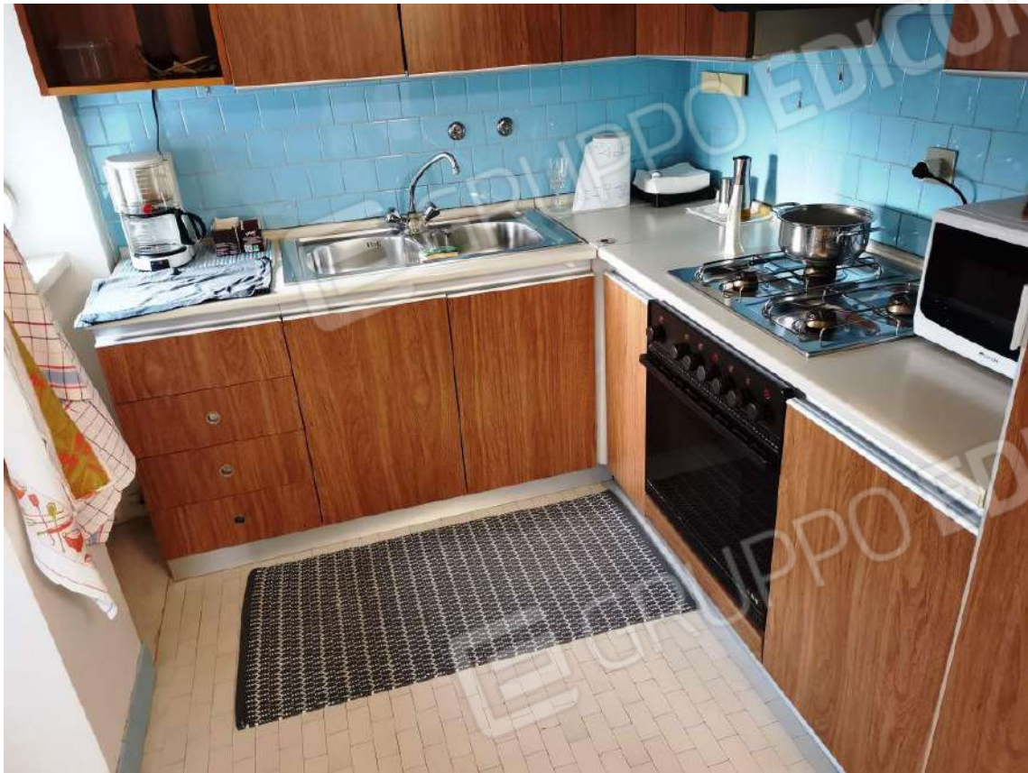
APPARTAMENTO (MAPP.680 SUB 12) INTERNI: CUCINA