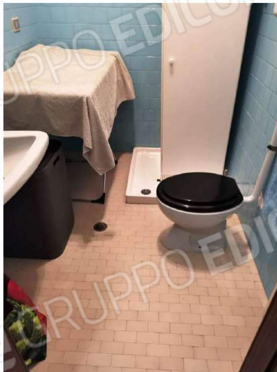
APPARTAMENTO (MAPP.680 SUB 12) – INTERNI: BAGNI