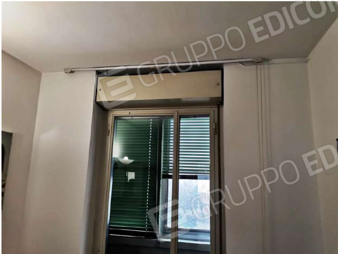
APPARTAMENTO (MAPP.680 SUB 12) INTERNI: CAMERE TIPO