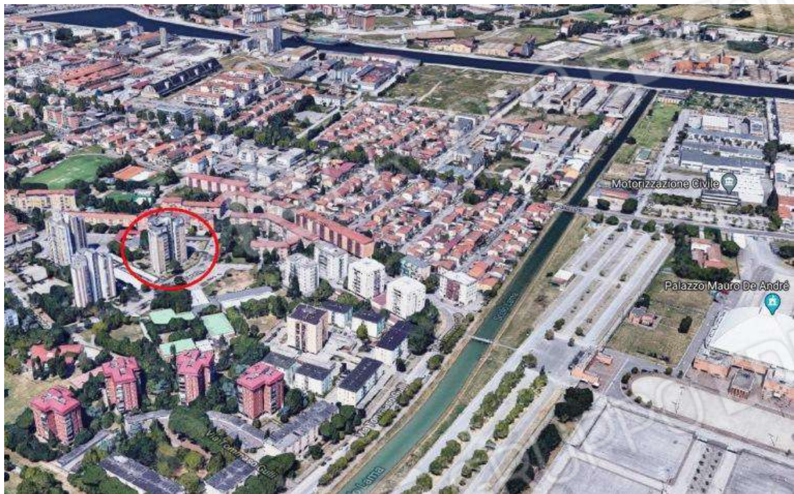
VISTA AEREA 3D: UBICAZIONE DELLA "TORRE C"- VIA CAOLRE 7 – RAVENNA QUARTIERE TRIESTE