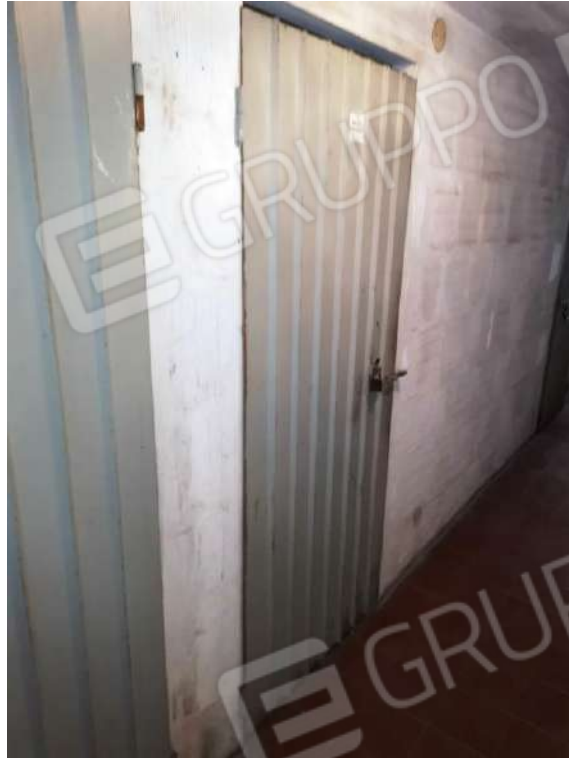
APPARTAMENTO SERVIZI (MAPP.680 SUB 12) – SOFFITTA PIANO 12°