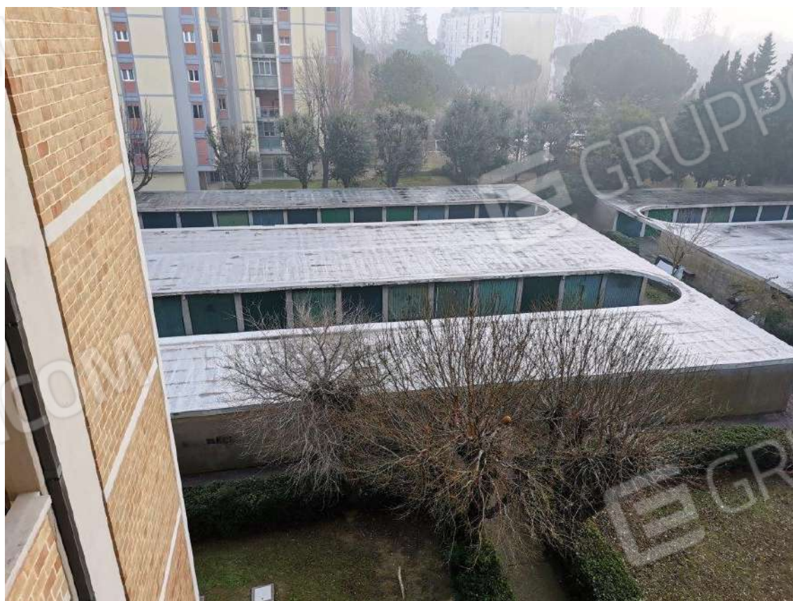
BLOCCO GARAGE VISTI DALLA LOGGIA LATO SUD DELL'APPARTAMENTO