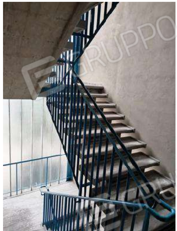
"TORRE C" – PARTI COMUNI: ANDRONE E VANO SCALA CONDOMINIALE