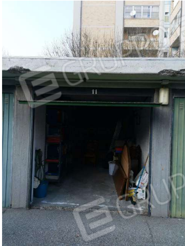
GARAGE (MAPP.707 SUB 12)