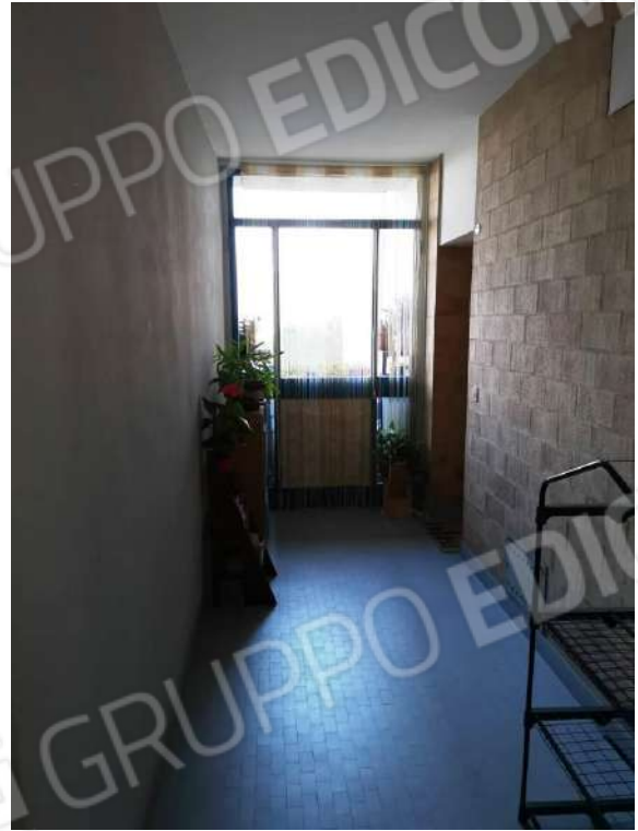
“TORRE C” – PARTI COMUNI: ASCENSORI E CORRIDOIO AL PIANO QUARTO