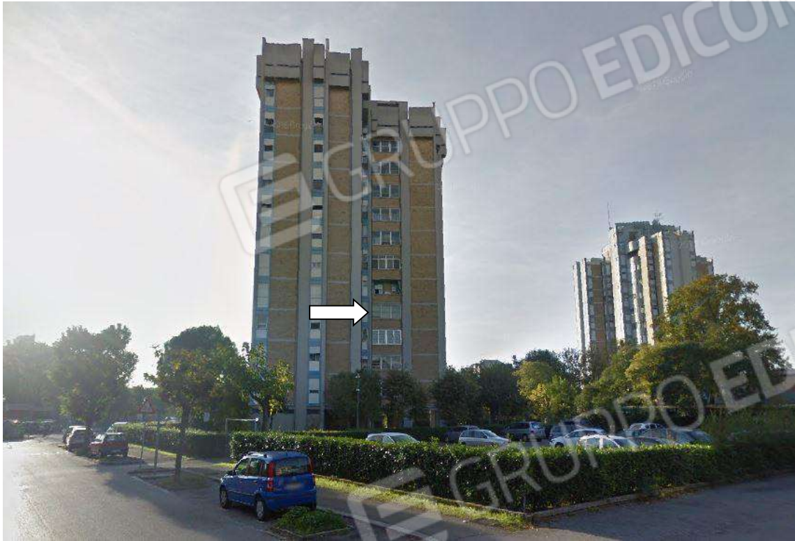
PROSPETTO NORD DELLA "TORRE C" LOCALIZZAZIONE ABITAZIONE Piano 4° (MAPP.680 SUB 12)