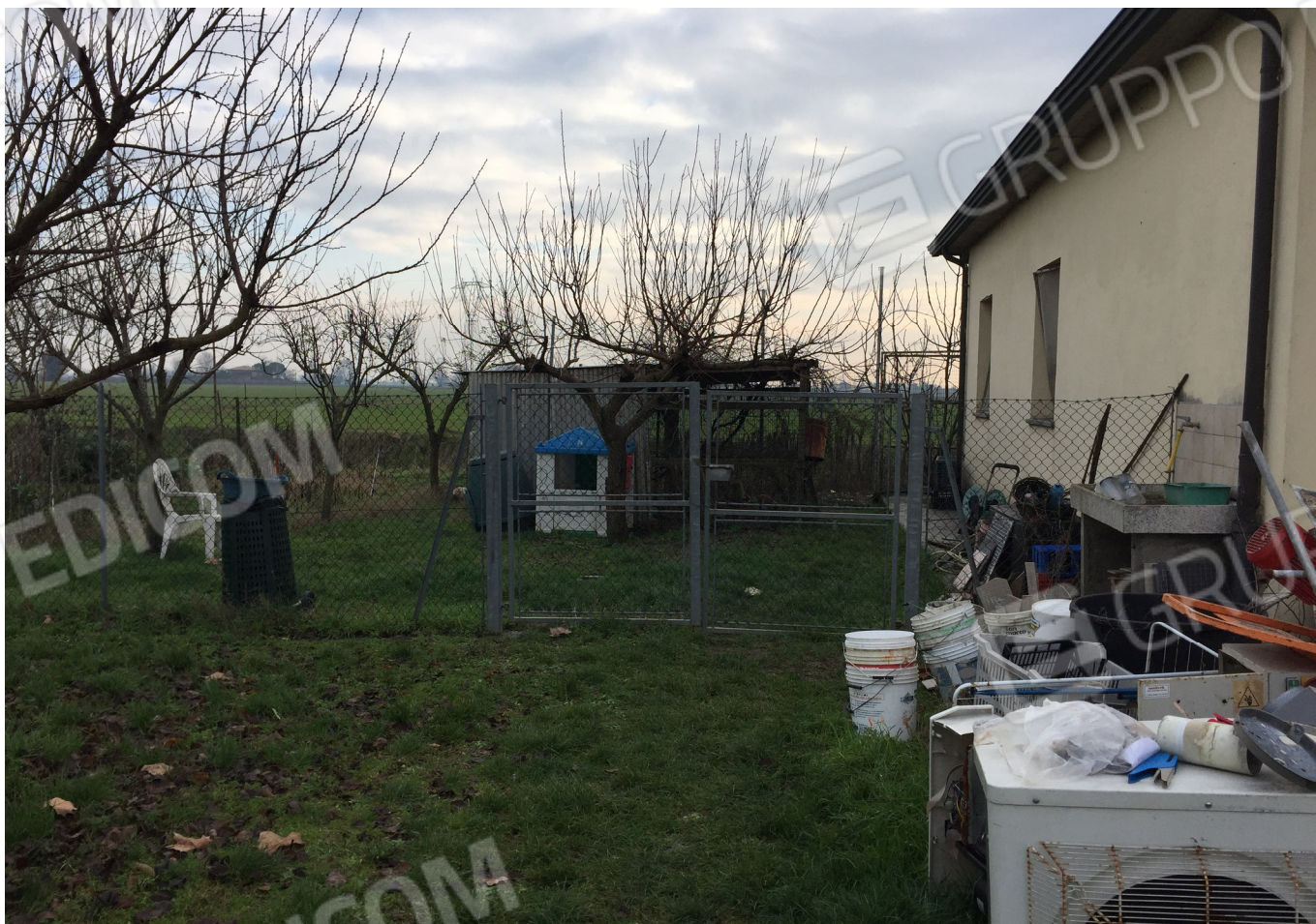
Foto 10 - Recinzione interna alla corte di pertinenza