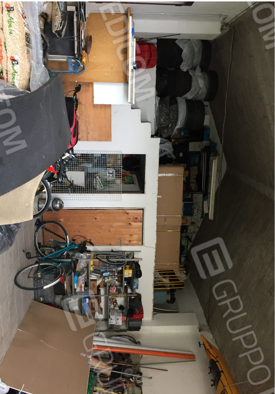
Foto 14 - Interno corpo servizi