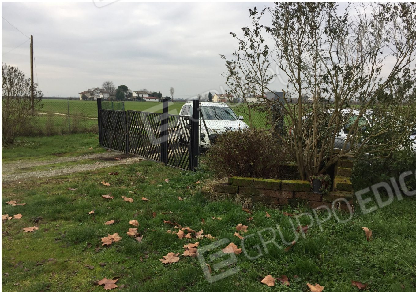
Foto 3 - Cancello pedonale e carrabile d'ingresso