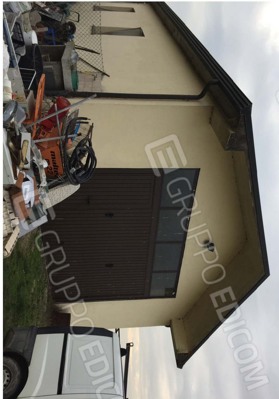
Foto 11 - Corpo servizi