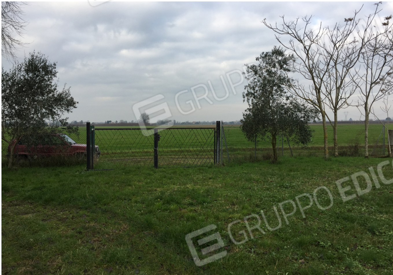
Foto 9 - Altro cancello carrabile d'ingresso