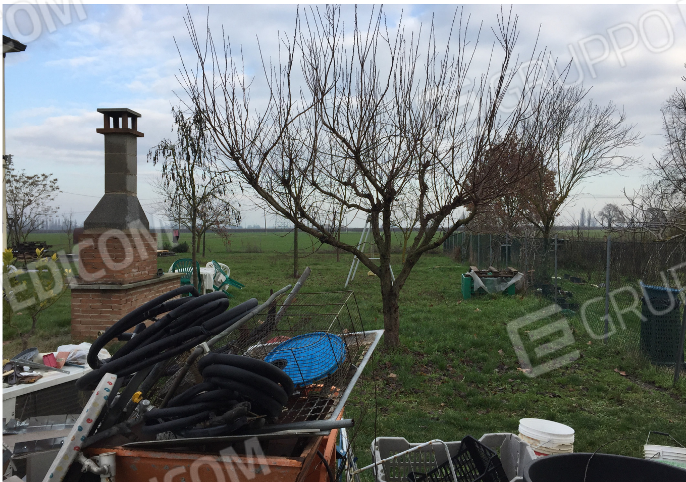
Foto 8 - Corte di pertinenza