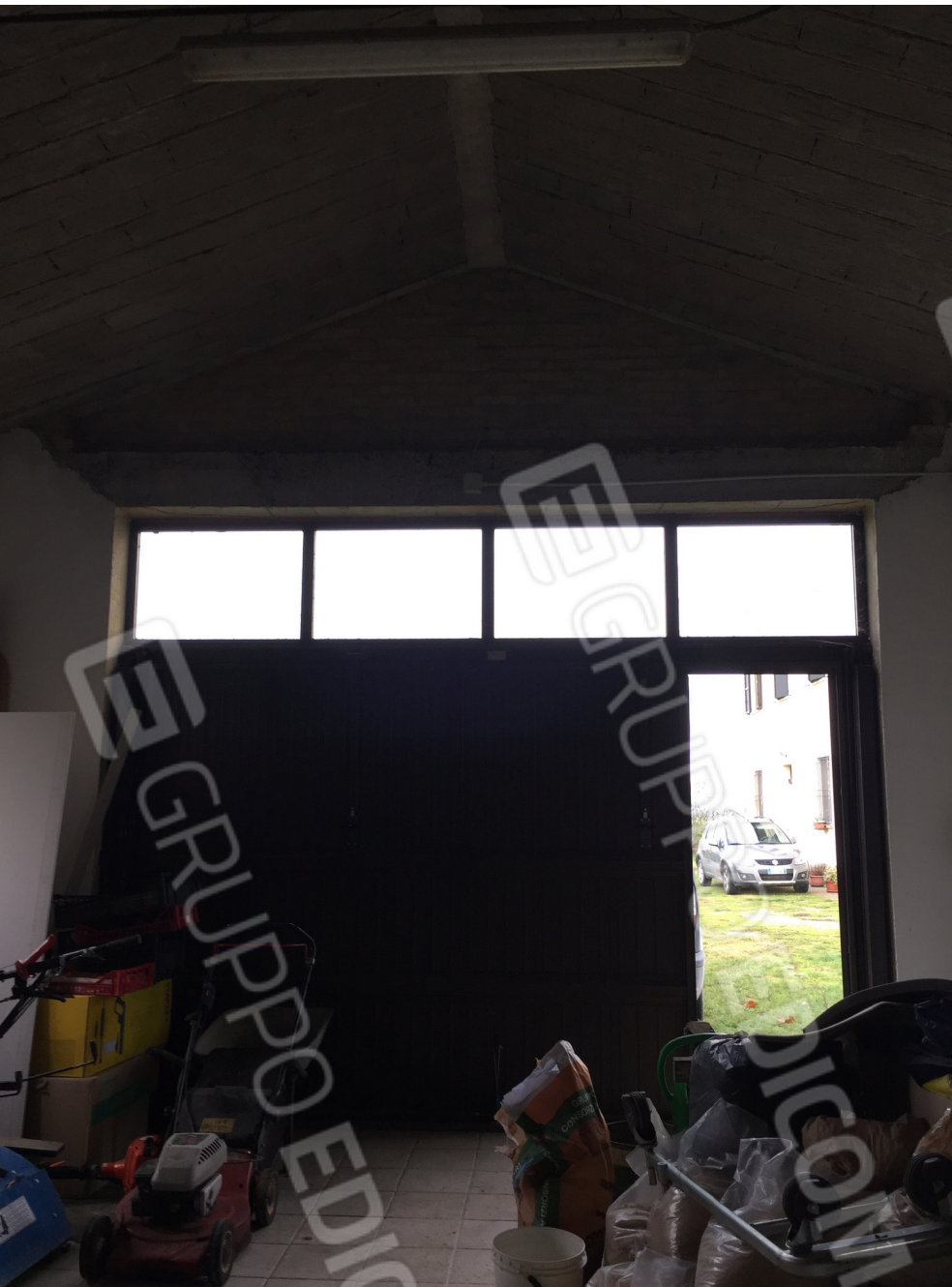
Foto 13 - Portone carrabile/pedonale corpo servizi