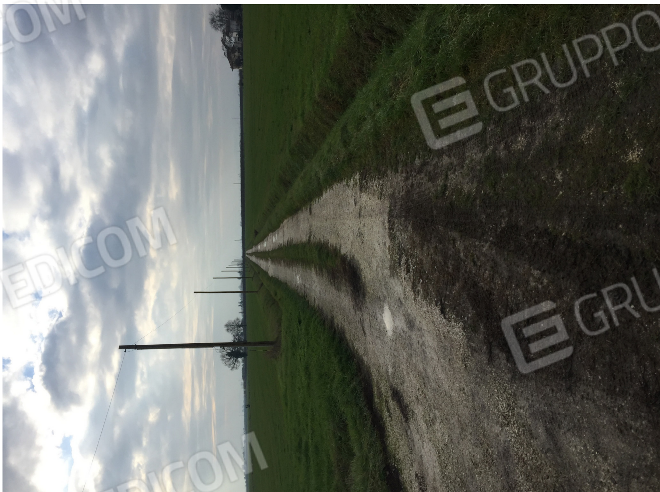
Foto 2 - Strada poderale d'accesso