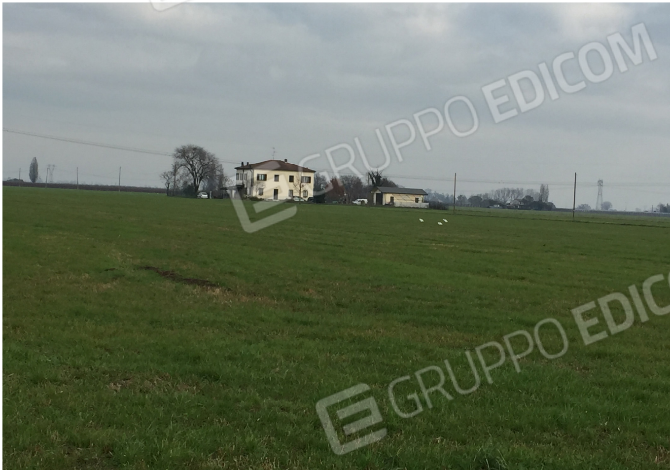
Foto 1 - Vista del fabbricato da via del Sale