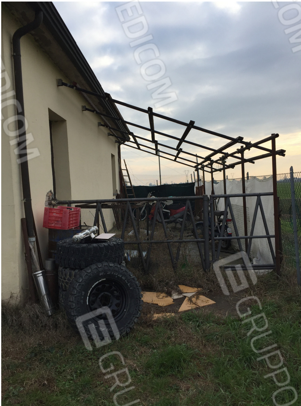
Foto 12 - Tettoia corpo servizi