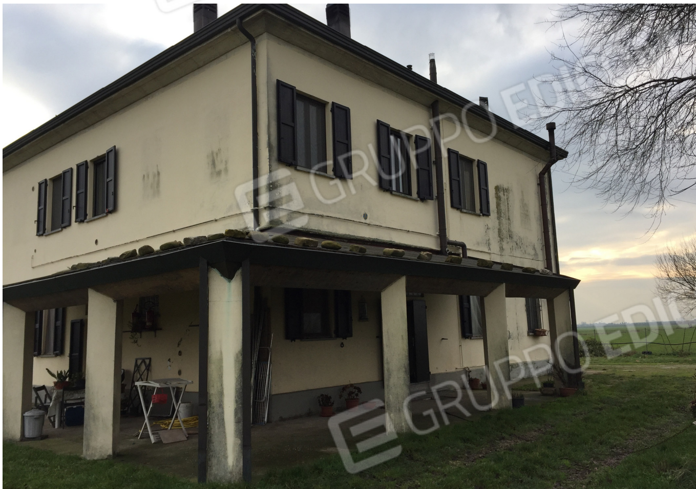
Foto 7 - Prospetto nord-ovest