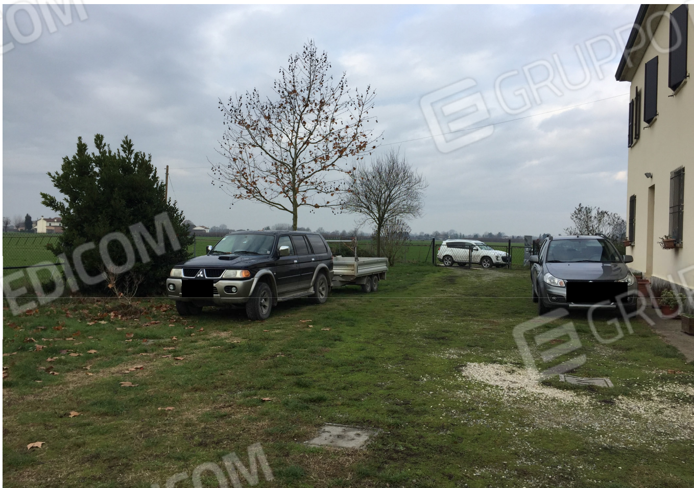
Foto 4 - Corte di pertinenza