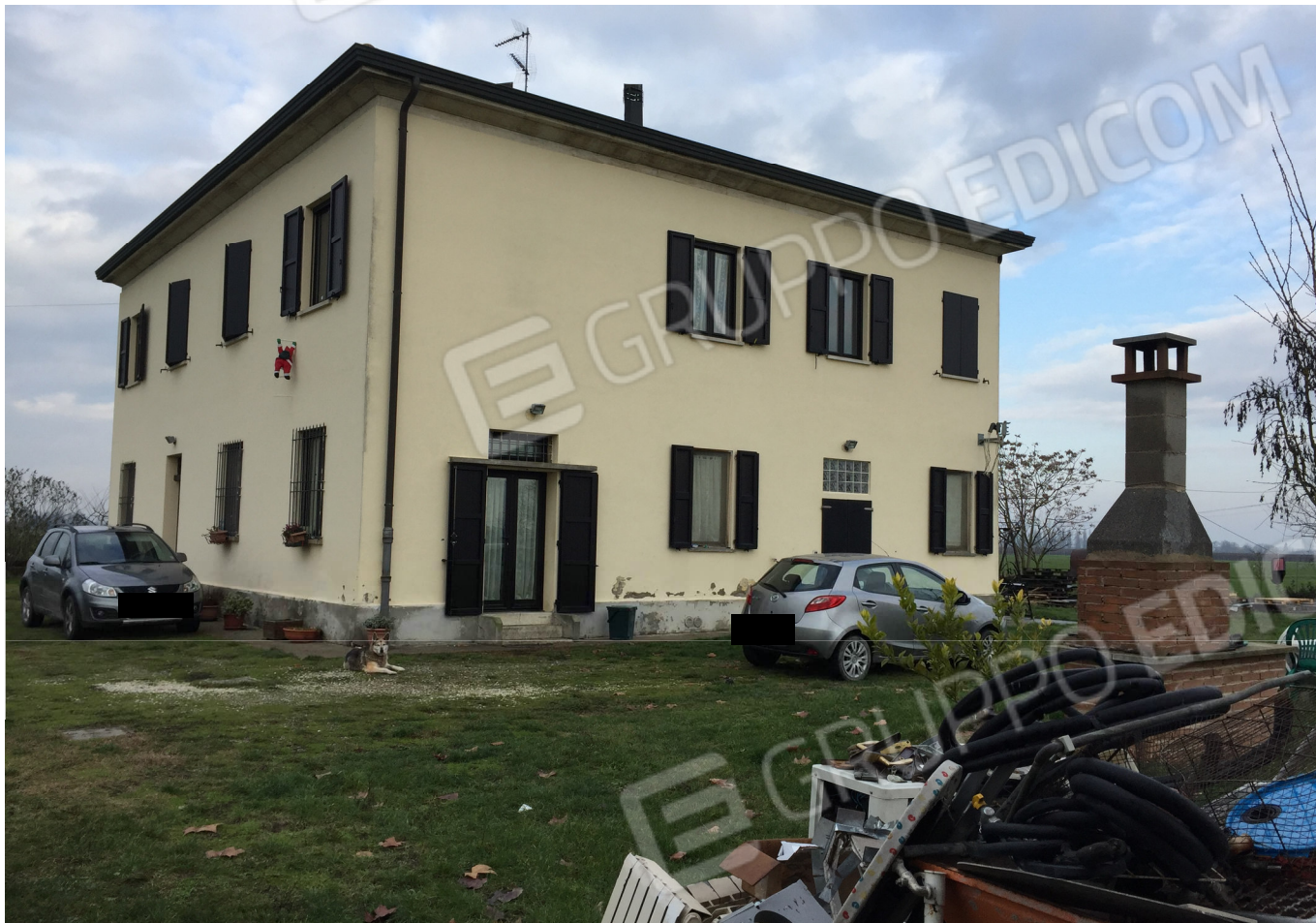
Foto 5 - Prospetto sud-est