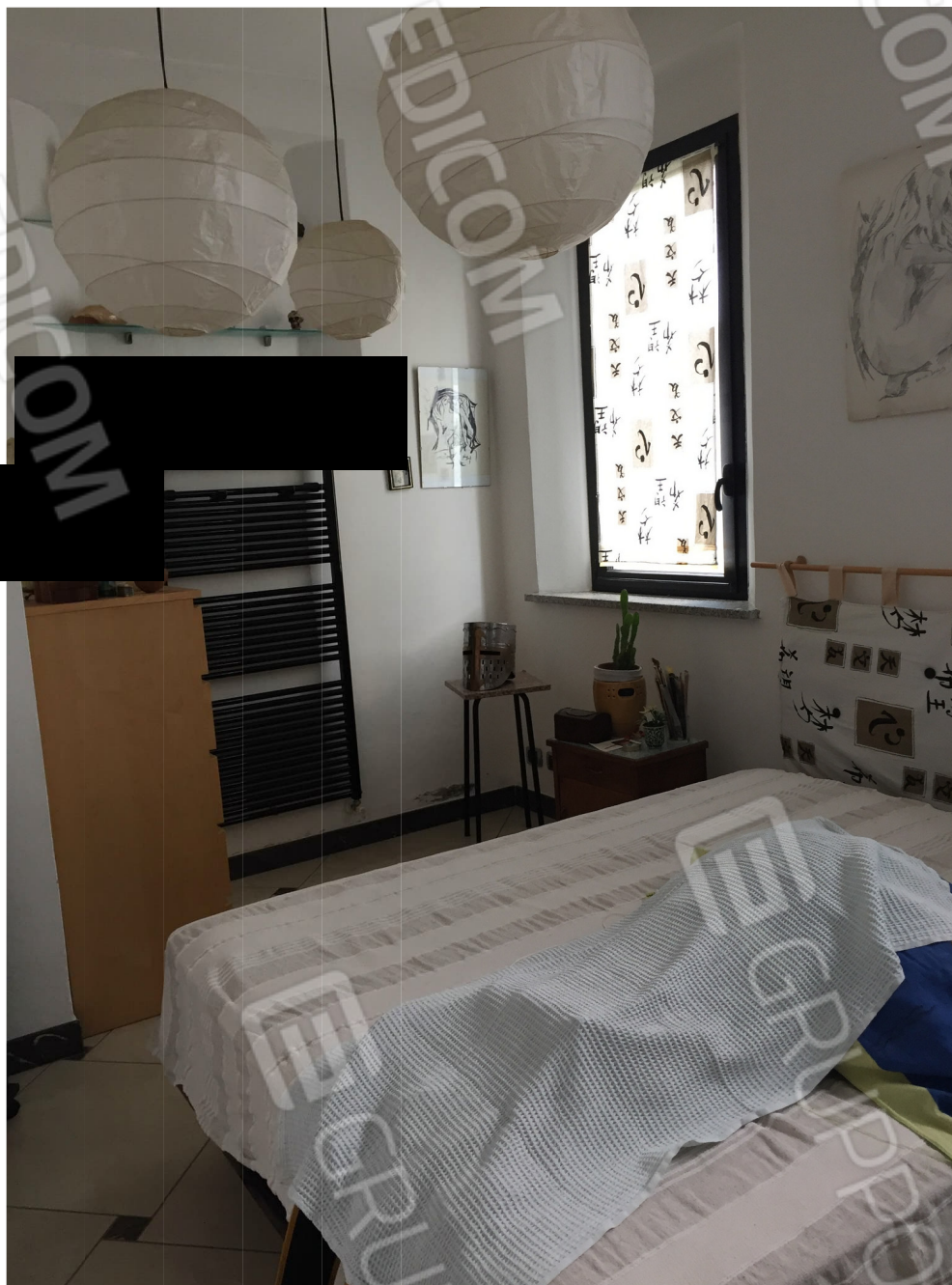
Foto 6 - Camera matrimoniale