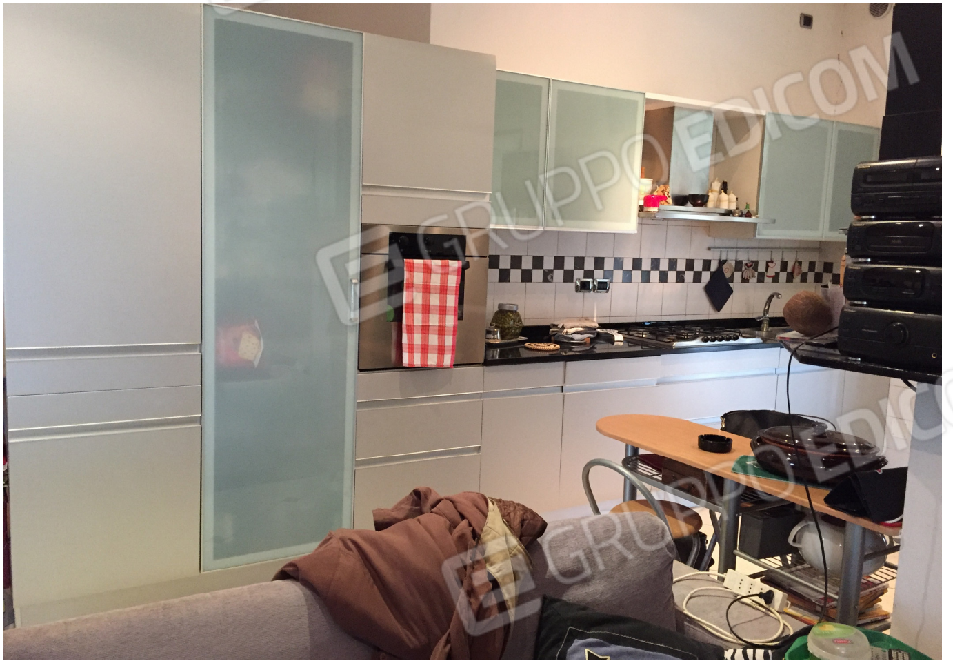
Foto 3 - Angolo cottura