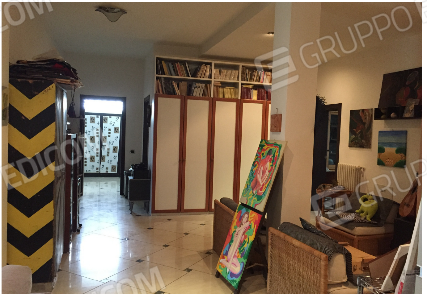
Foto 4 - Soggiorno