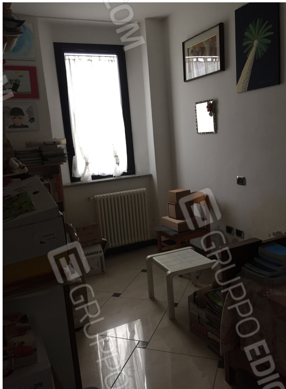
Foto 7 - Camera singola