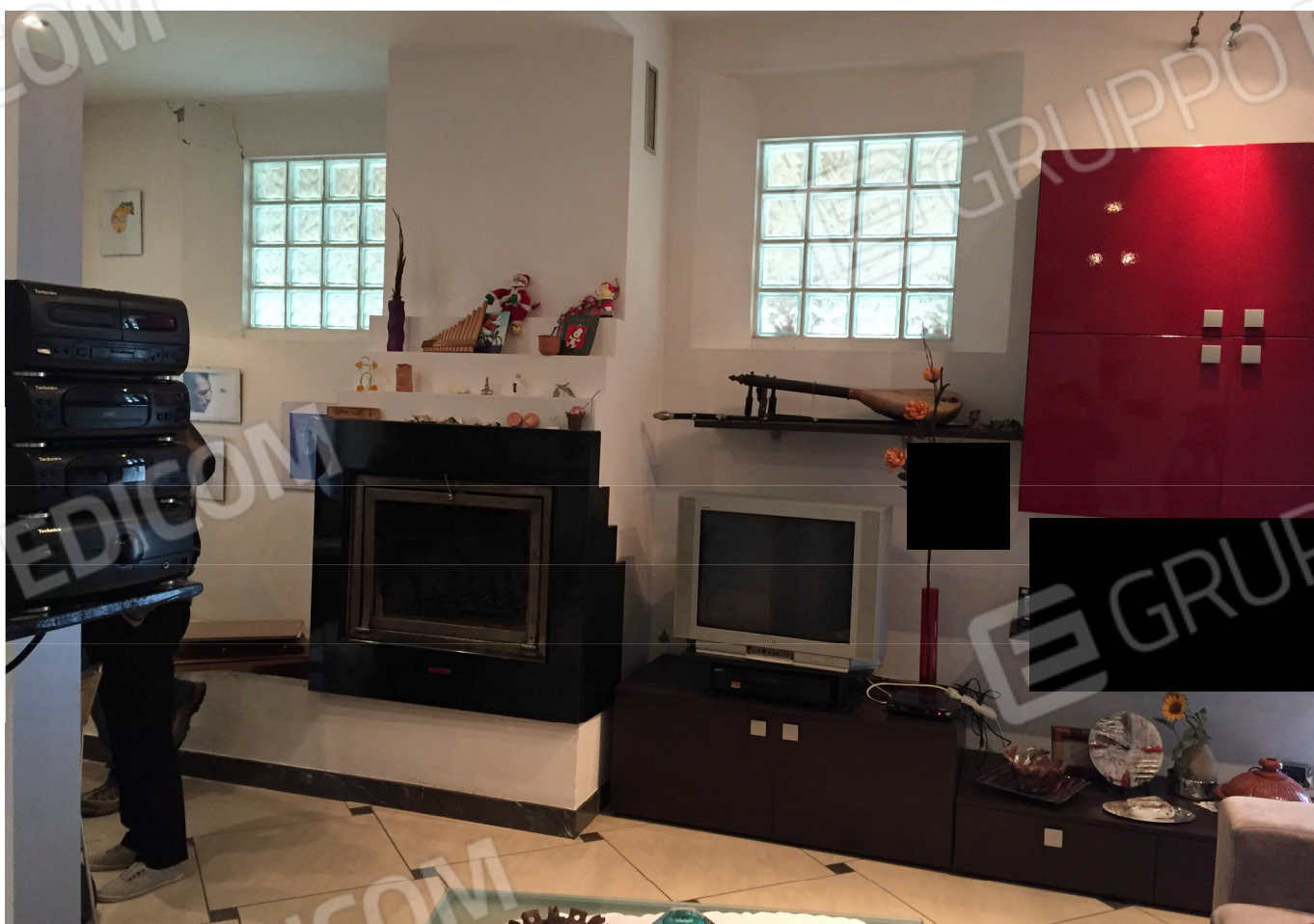
Foto 2 - Soggiorno