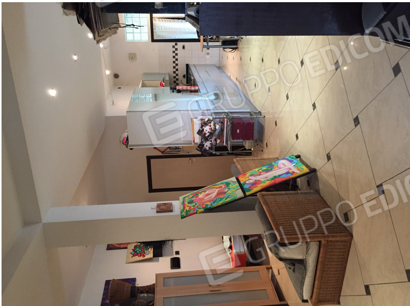
Foto 1 - Soggiorno