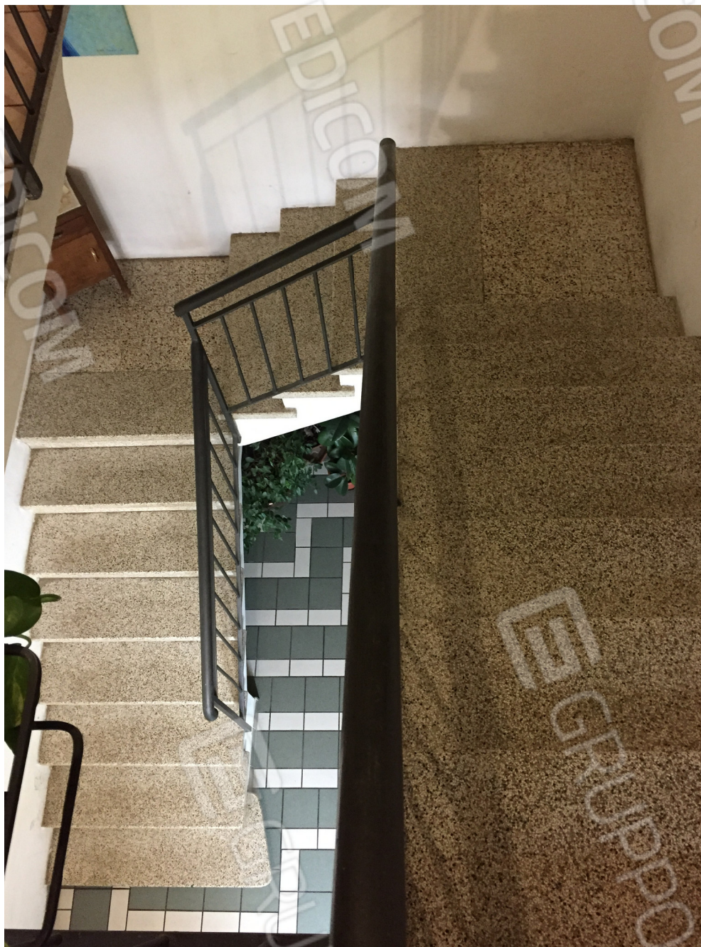
Foto 6 - Vano scala