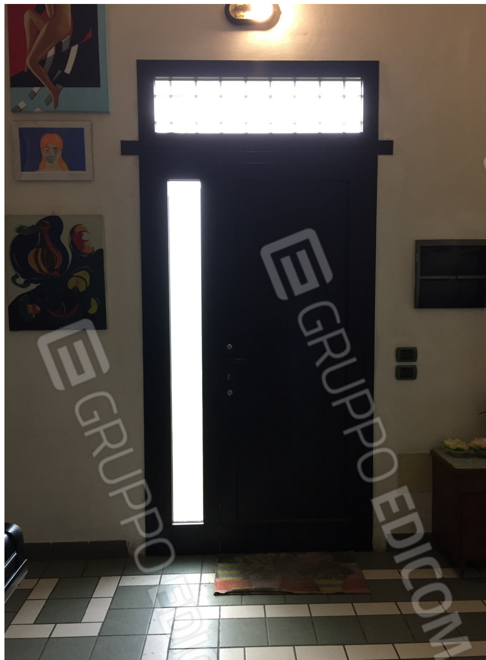
Foto 1 - Ingresso