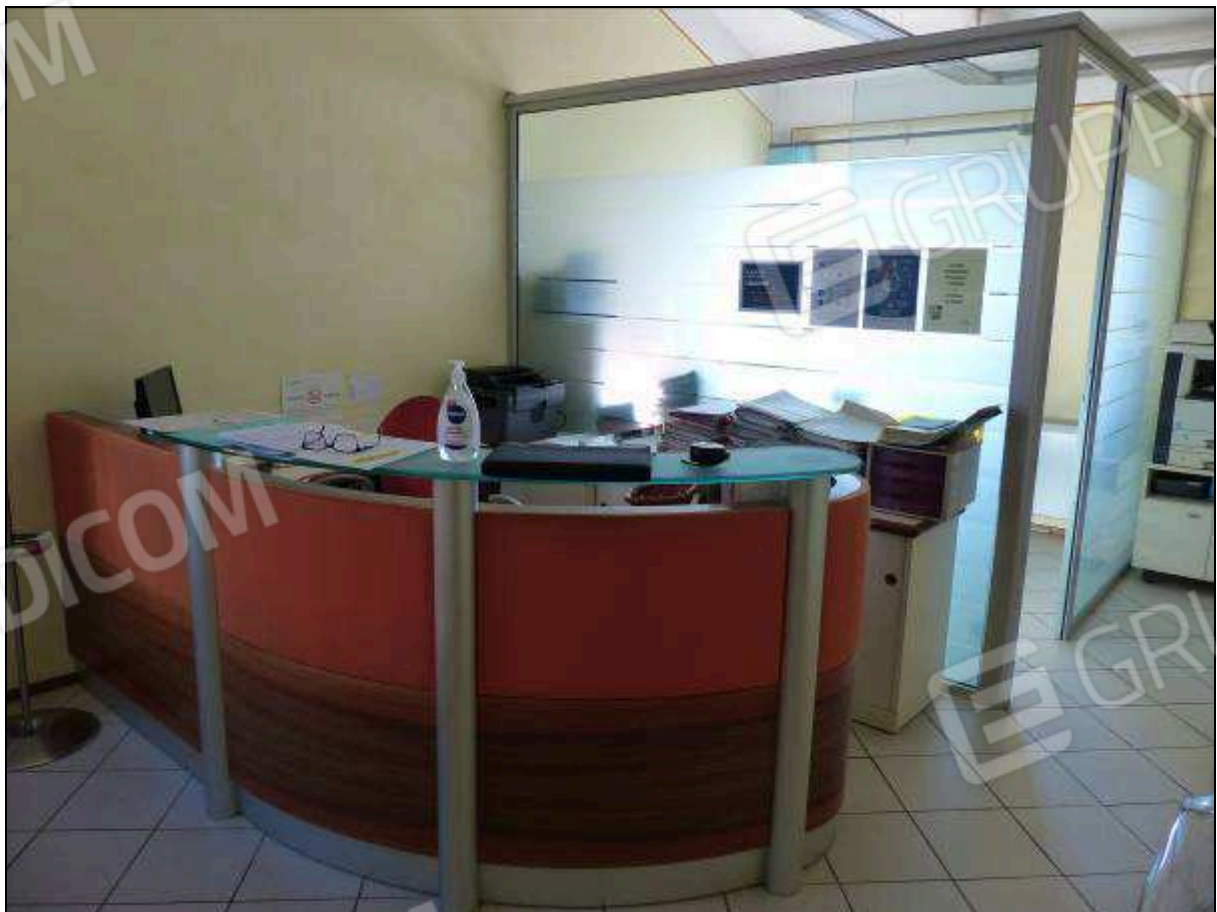
FOTO 16 – Piano secondo: ufficio all'ingresso dell'unità immobiliare in oggetto.