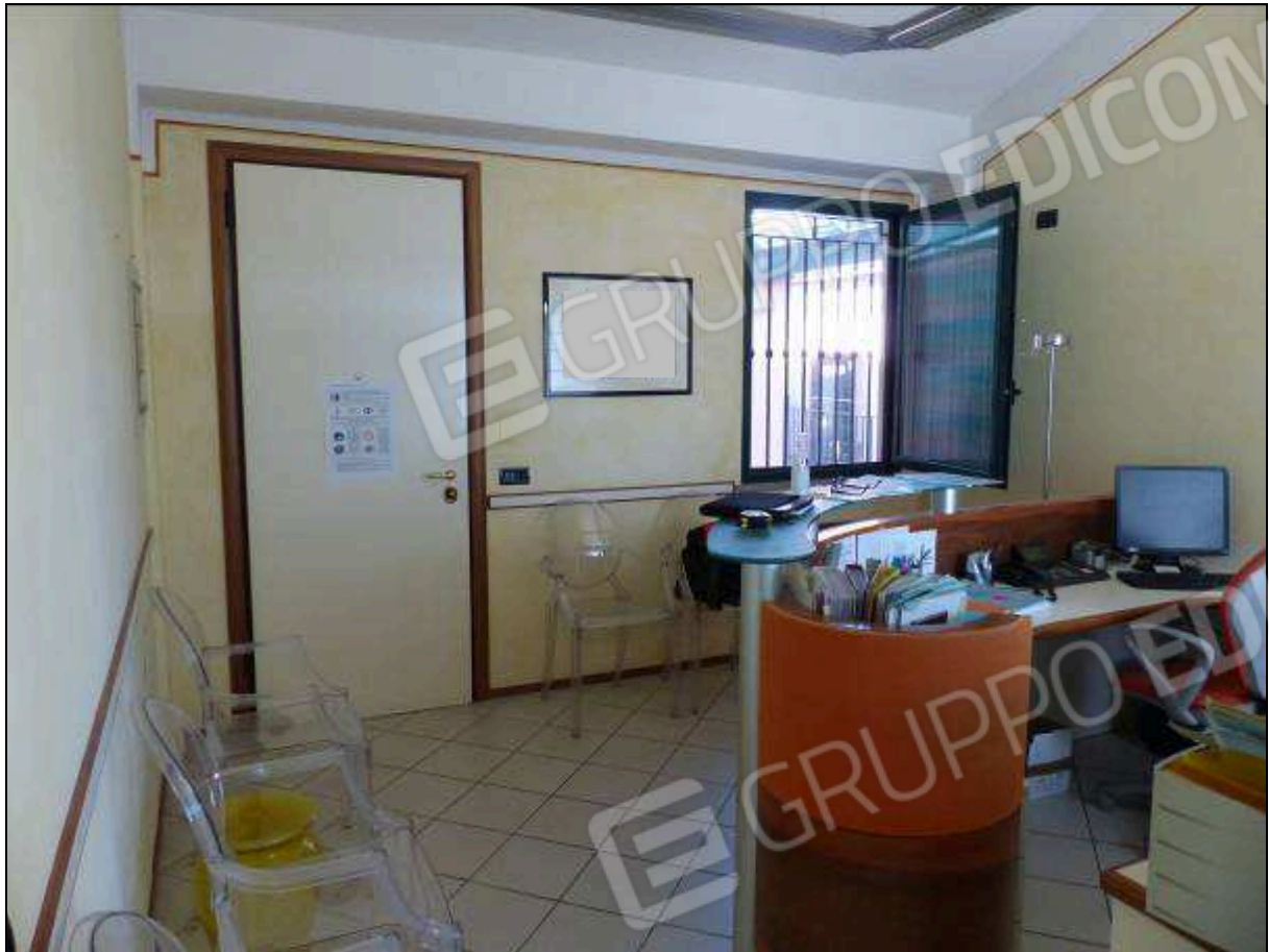
FOTO 15 – Piano secondo: ufficio all'ingresso dell'unità immobiliare in oggetto.