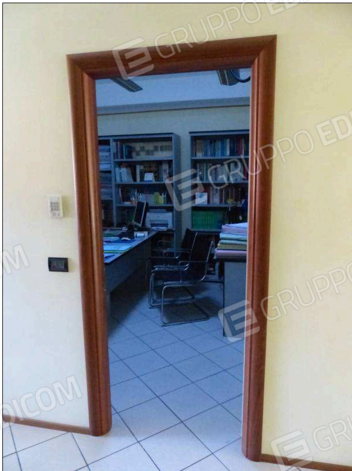
FOTO 25 – Piano secondo: ingresso del secondo ripostiglio, attualmente arredato e utilizzato come ufficio.