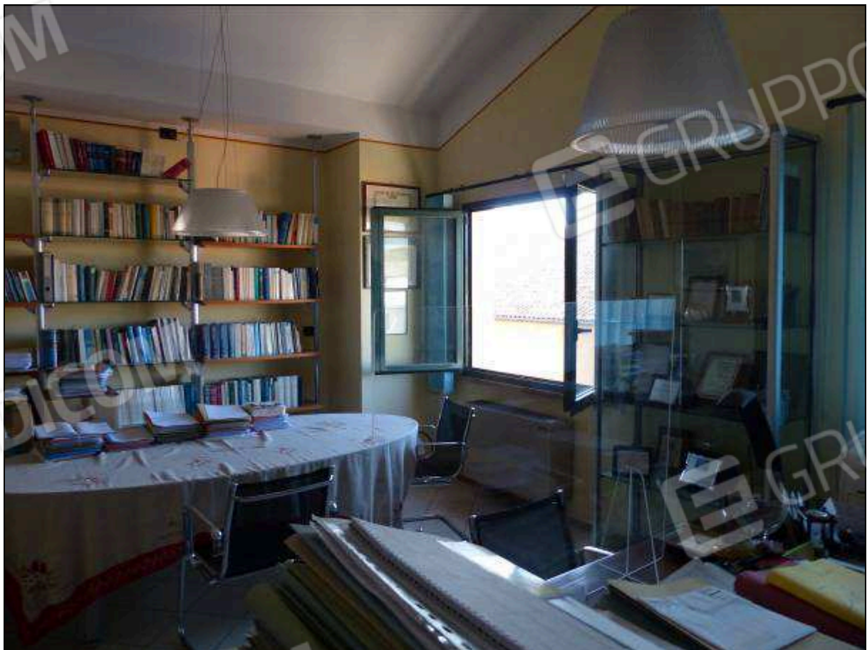
FOTO 31 – Piano secondo: ufficio sul retro dell'unità immobiliare in oggetto.