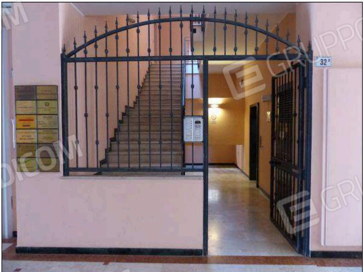
FOTO 6 – Androne di ingresso comune all'unità immobiliare di interesse.