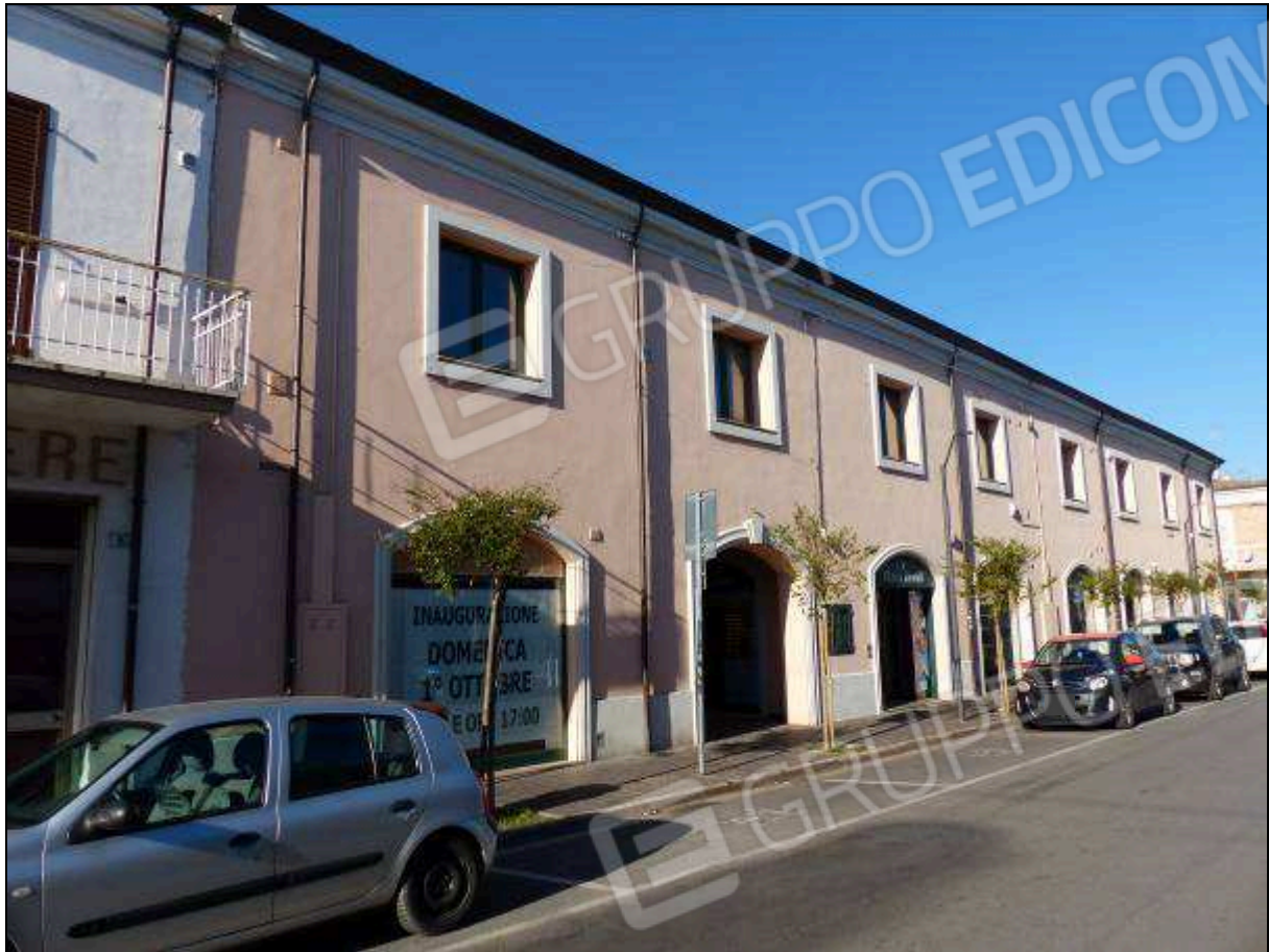
FOTO 1 – Prospetto principale, su Via Bucci, dell'edificio a cui appartiene l'immobile di interesse.