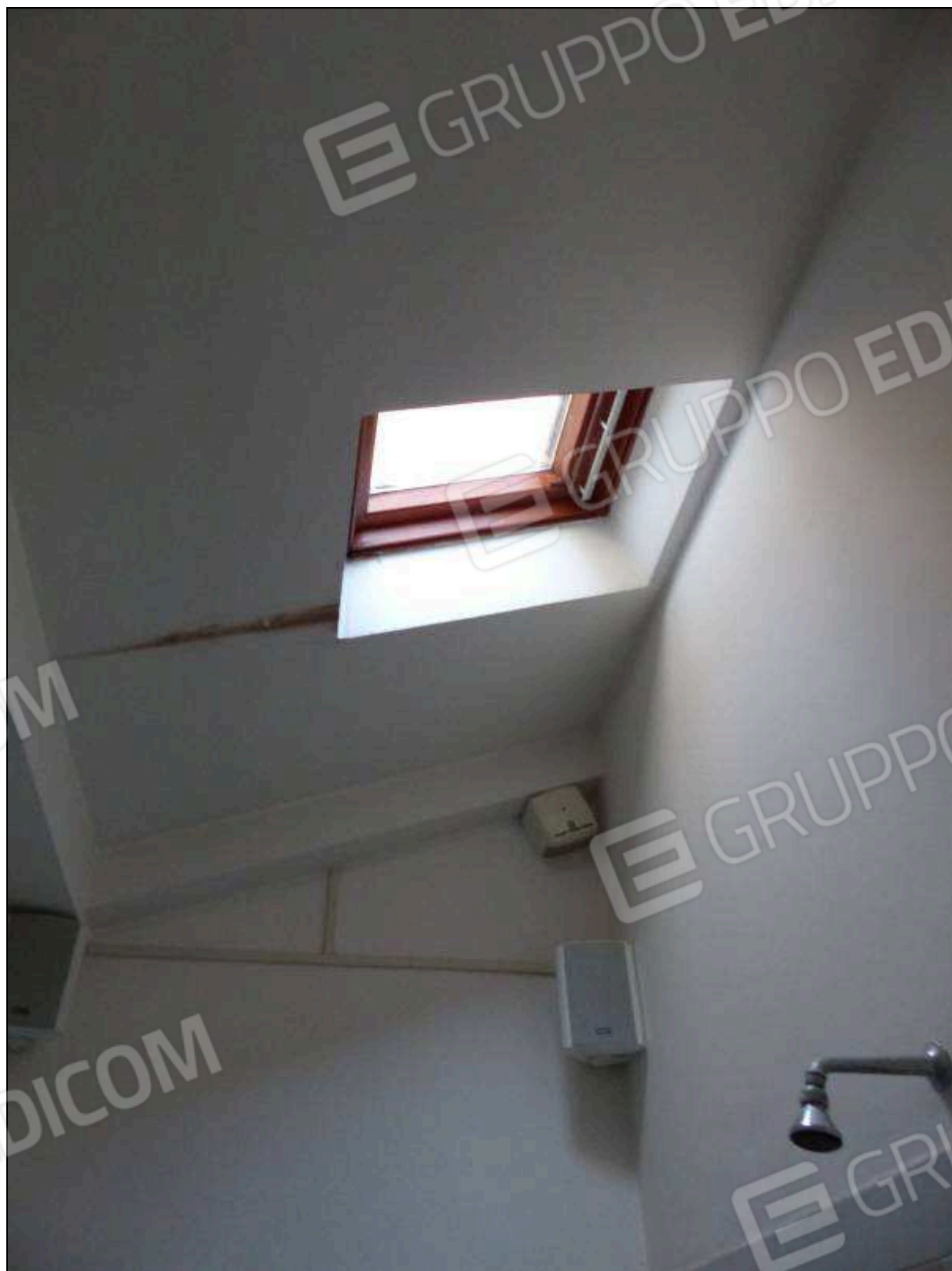
FOTO 22 – Piano secondo: bagno dell'unità immobiliare in oggetto, con lucernario non supportato dai necessari titoli edilizi (da assoggettare a sanatoria).