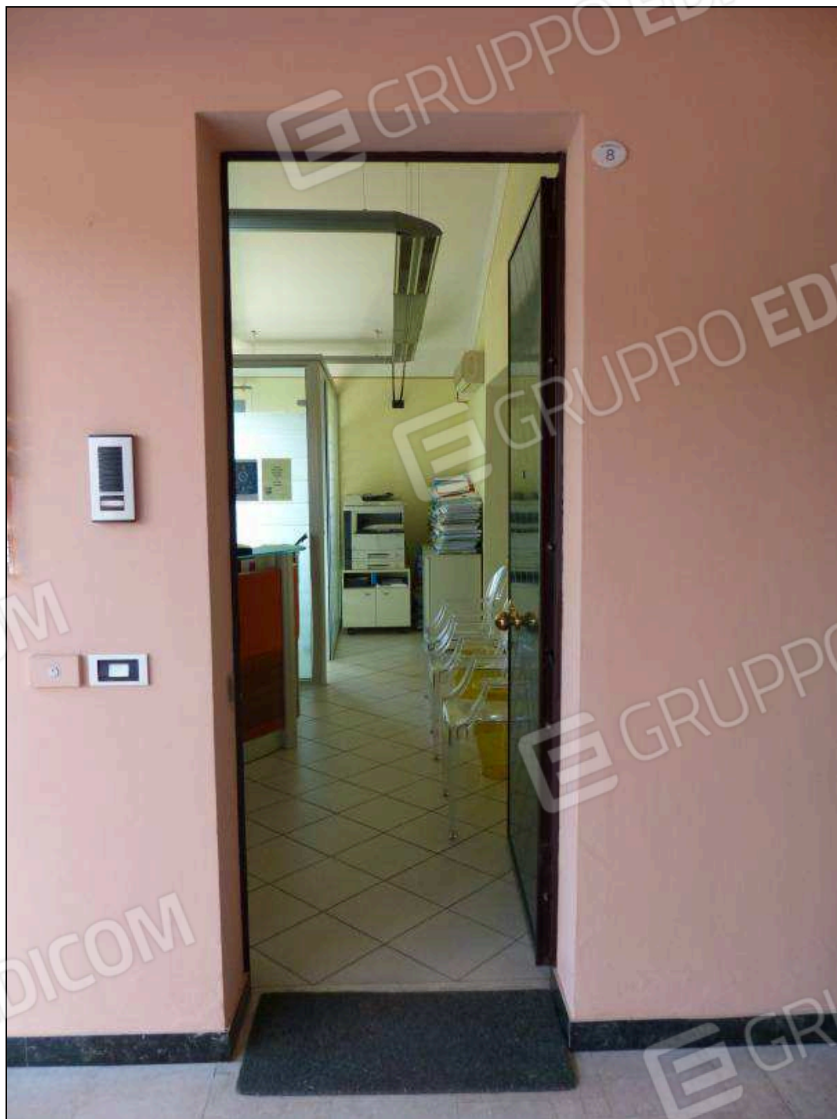
FOTO 14 – Piano secondo: ingresso all'unità immobiliare in oggetto.