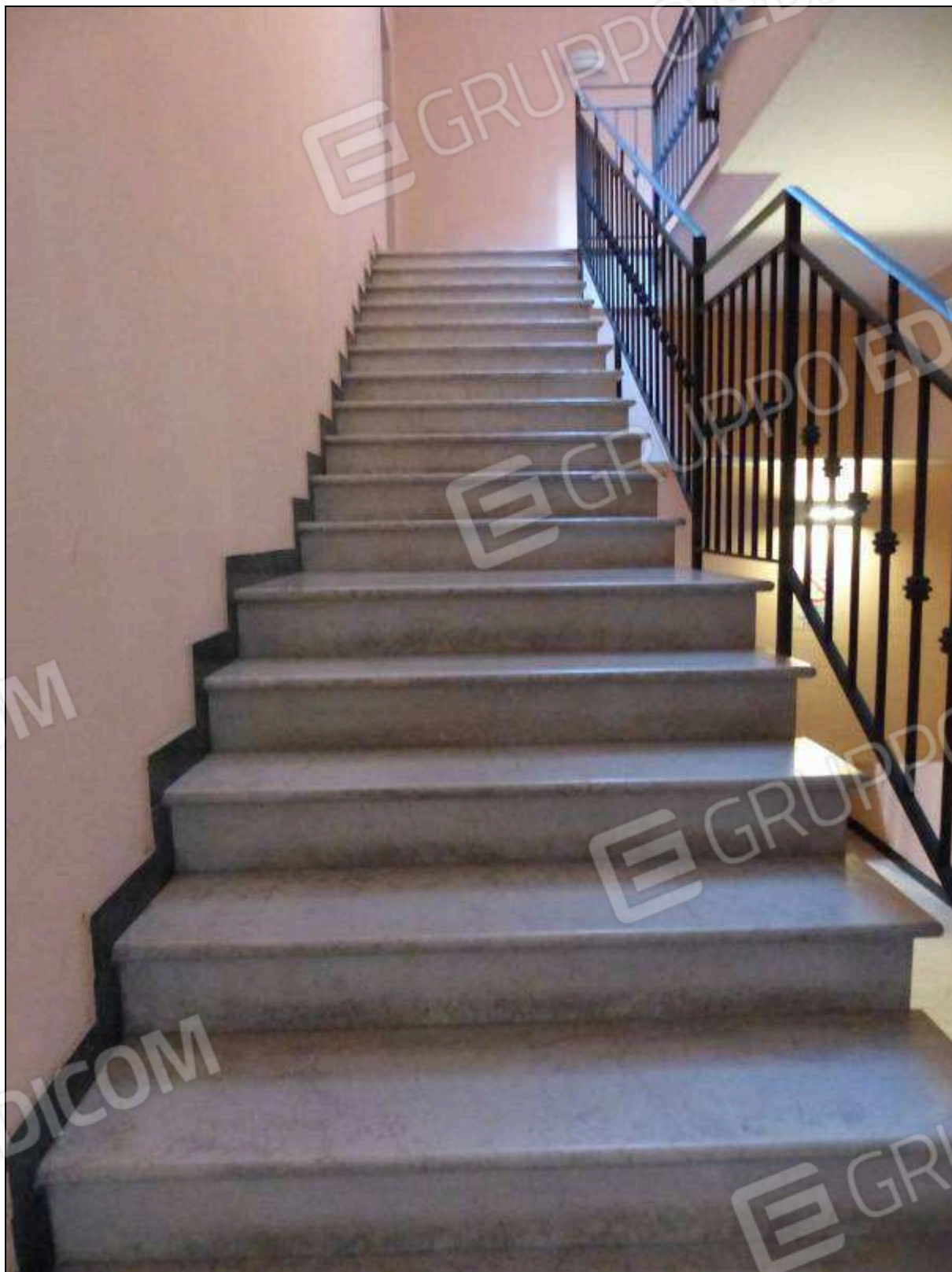
FOTO 7 – Scala condominiale, tra i piani terra e primo, comune all'unità immobiliare di interesse.