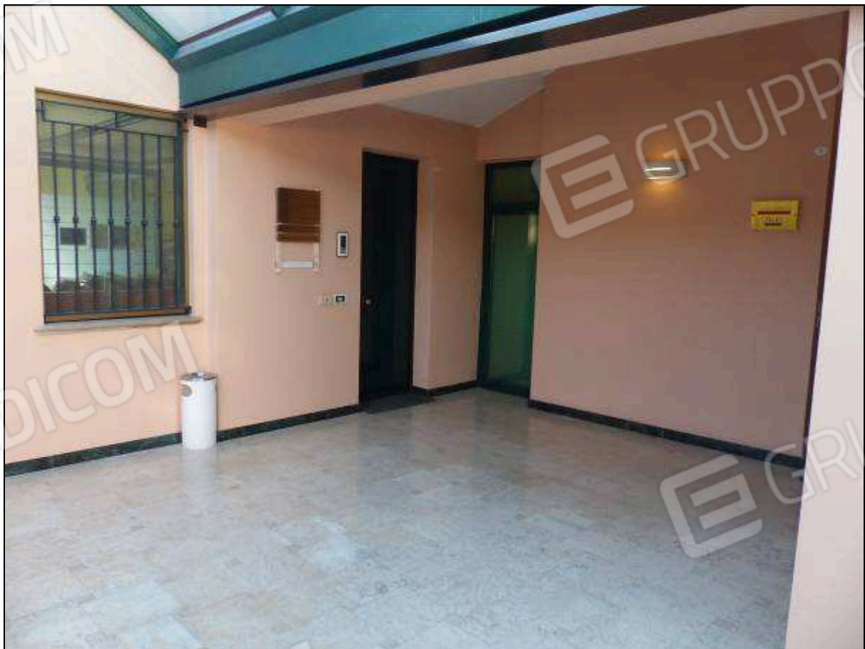
FOTO 13 – Piano secondo: pianerottolo comune di ingresso all'unità immobiliare di interesse.