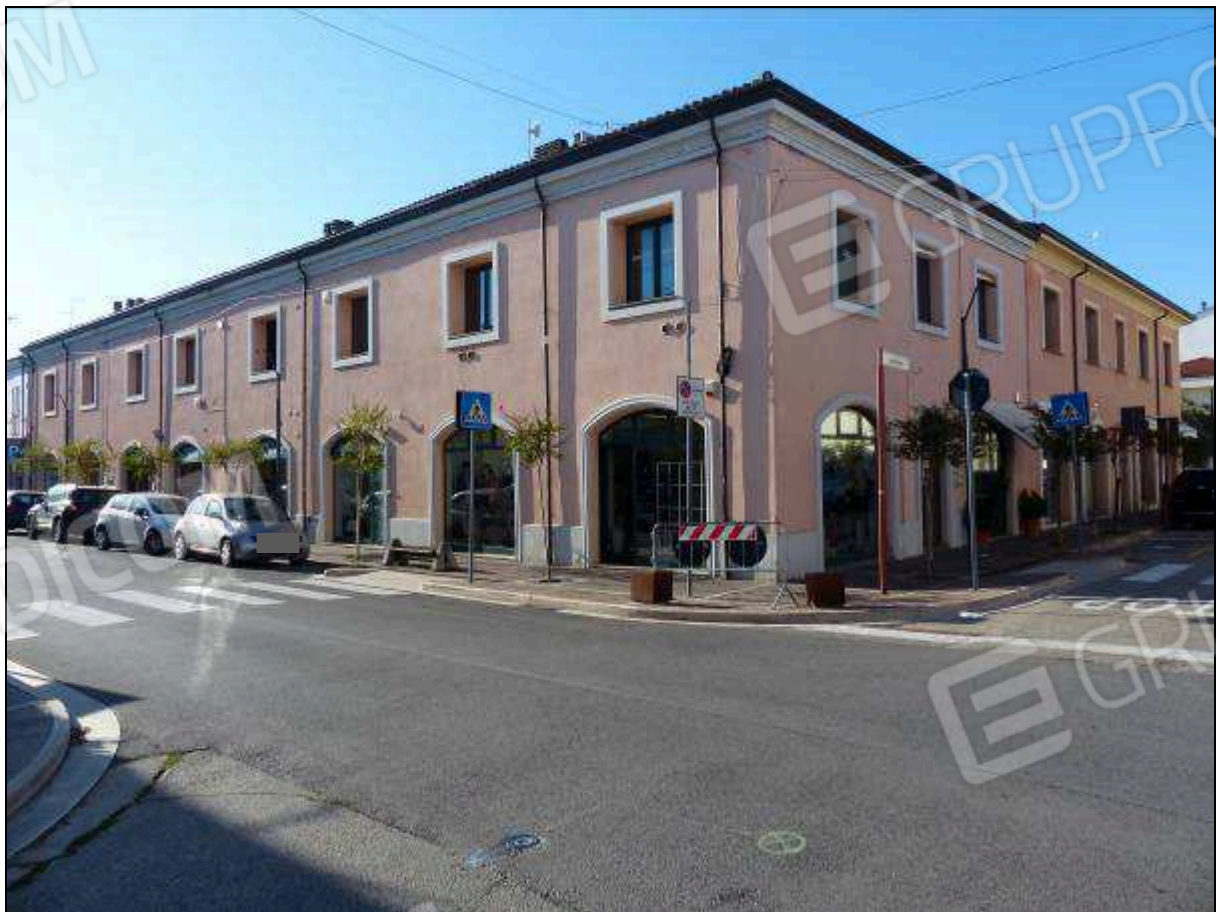
FOTO 2 – Prospetto su Via Bucci, angolo Via Colombari, dell'edificio a cui appartiene l'immobile di interesse.