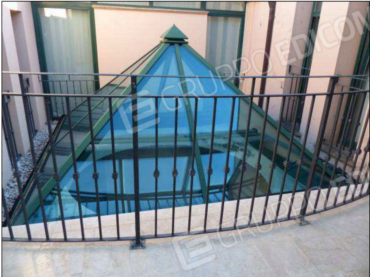
FOTO 12 – Piano secondo: pozzo di luce condominiale, comune all'unità immobiliare di interesse.