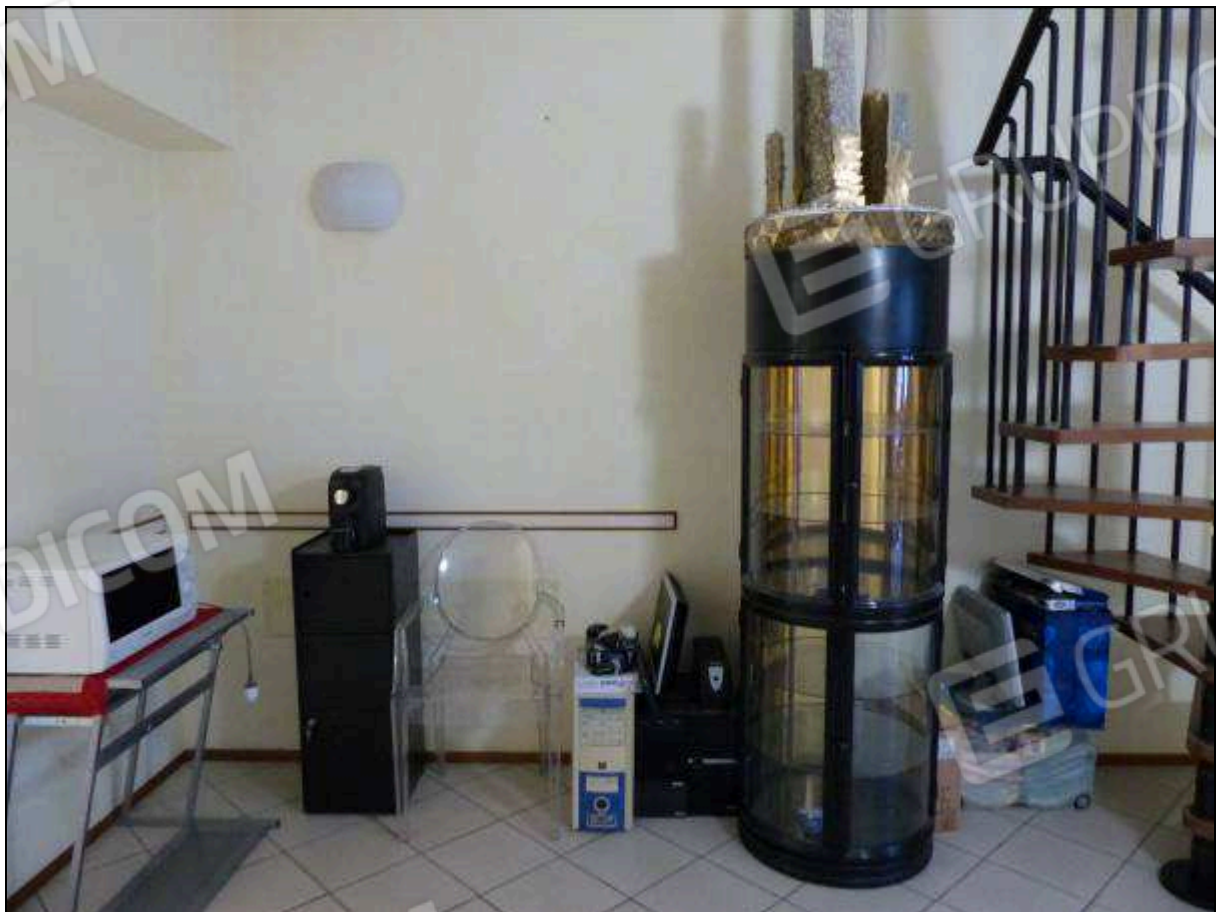
FOTO 35 – Piano secondo: disimpegno in fondo al corridoio, con scala priva di titolo edilizio.