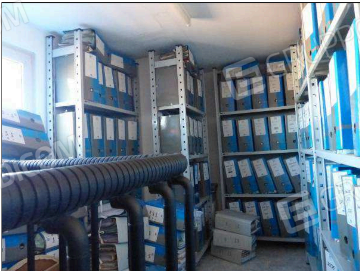
FOTO 38 – Piano terzo: ripostiglio, non supportato dai necessari titoli edilizi, da assoggettare a demolizione.