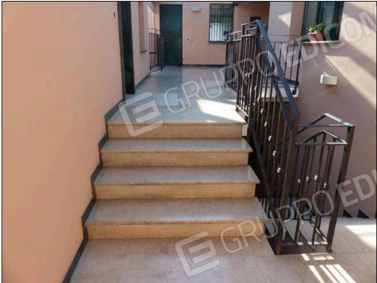
FOTO 10 – Scala condominiale, tra i piani primo e secondo, comune all'unità immobiliare di interesse.