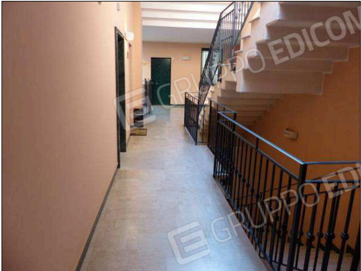
FOTO 8 – Piano primo: ballatoio condominiale, comune all'unità immobiliare di interesse.