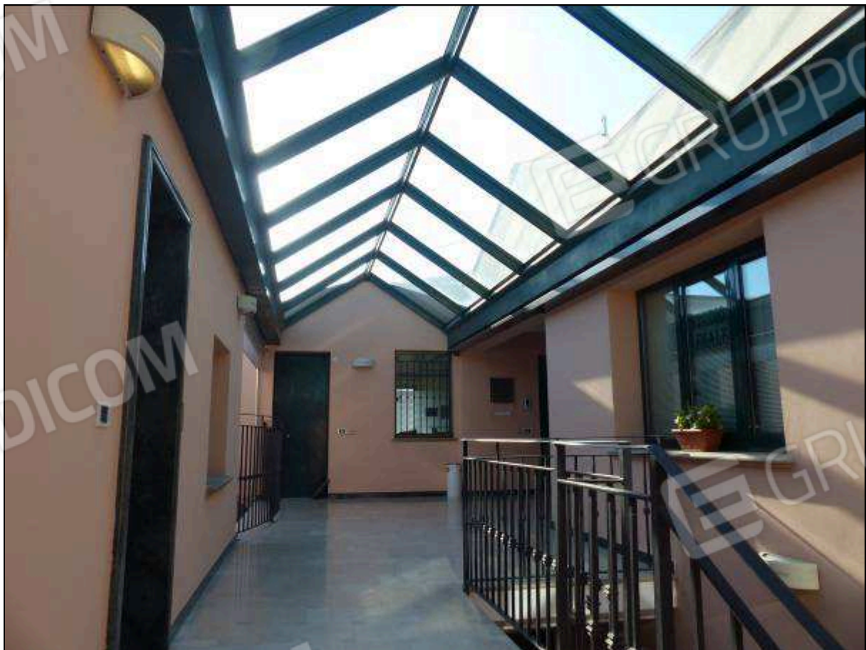
FOTO 11 – Piano secondo: ballatoio condominiale, comune all'unità immobiliare di interesse.