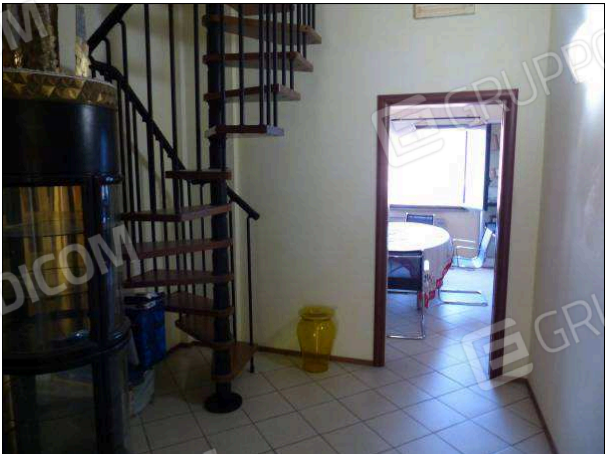
FOTO 29 – Piano secondo: disimpegno di ingresso all'ufficio sul retro.