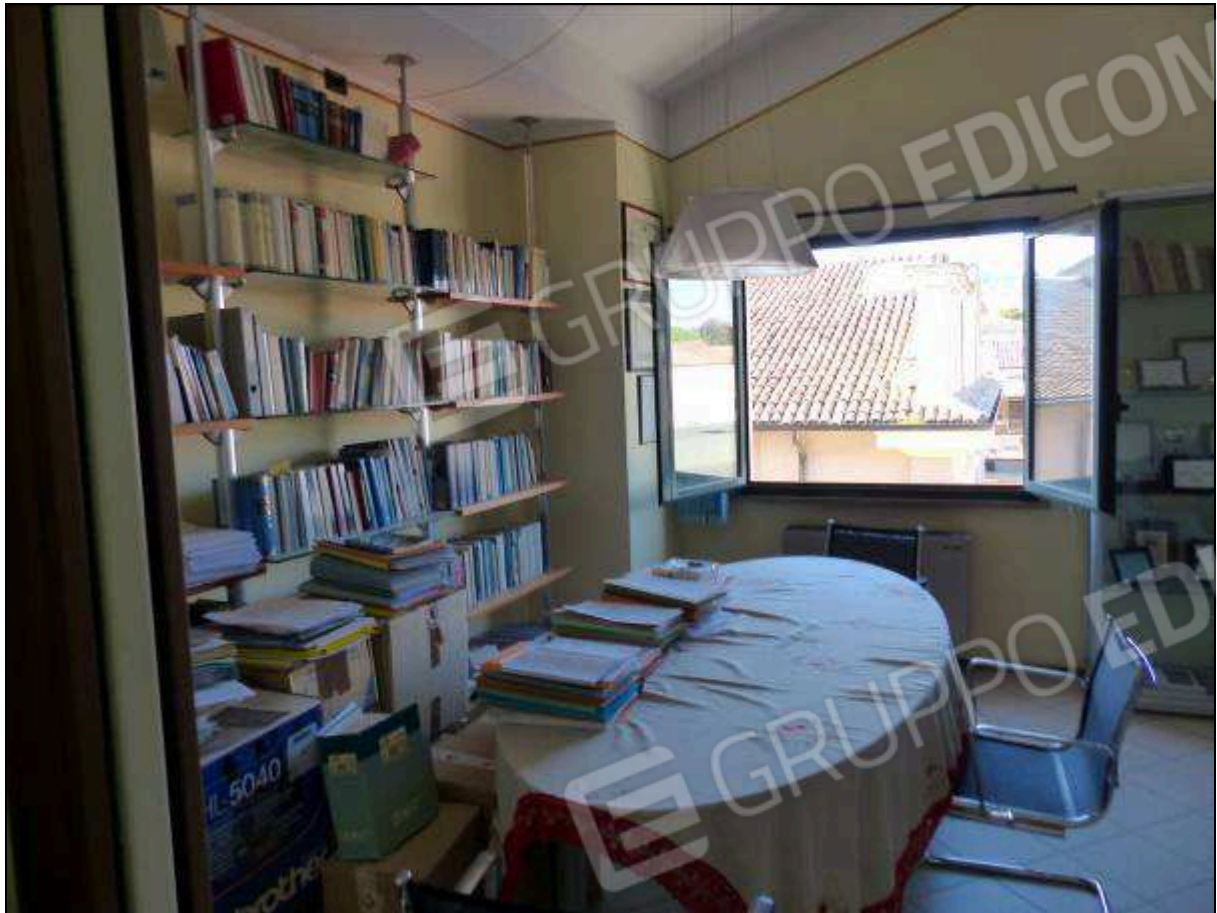
FOTO 30 – Piano secondo: ufficio sul retro dell'unità immobiliare in oggetto.