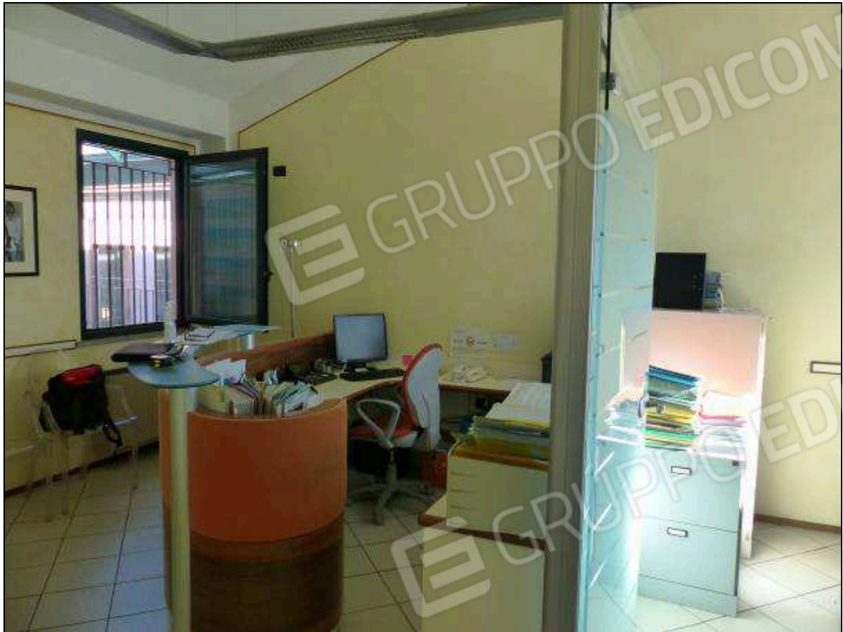
FOTO 17 – Piano secondo: ufficio all'ingresso dell'unità immobiliare in oggetto.