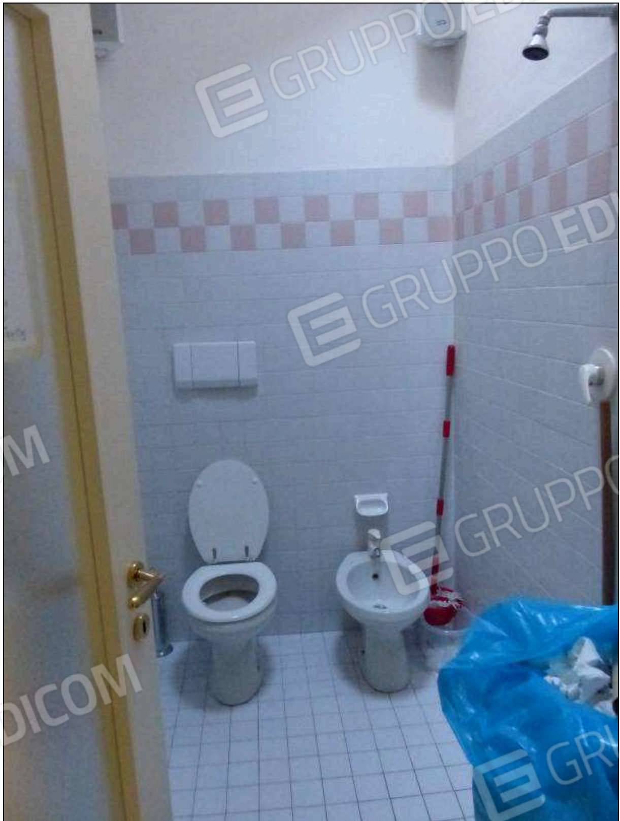
FOTO 21 – Piano secondo: bagno dell'unità immobiliare in oggetto.