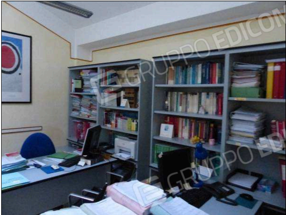
FOTO 28 – Piano secondo: secondo ripostiglio, attualmente arredato e utilizzato come ufficio.