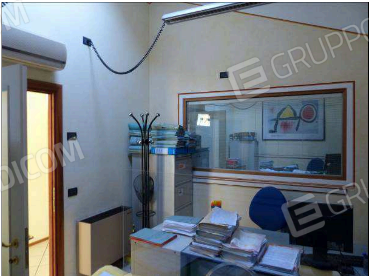
FOTO 24 – Piano secondo: primo ripostiglio, attualmente arredato e utilizzato come ufficio.