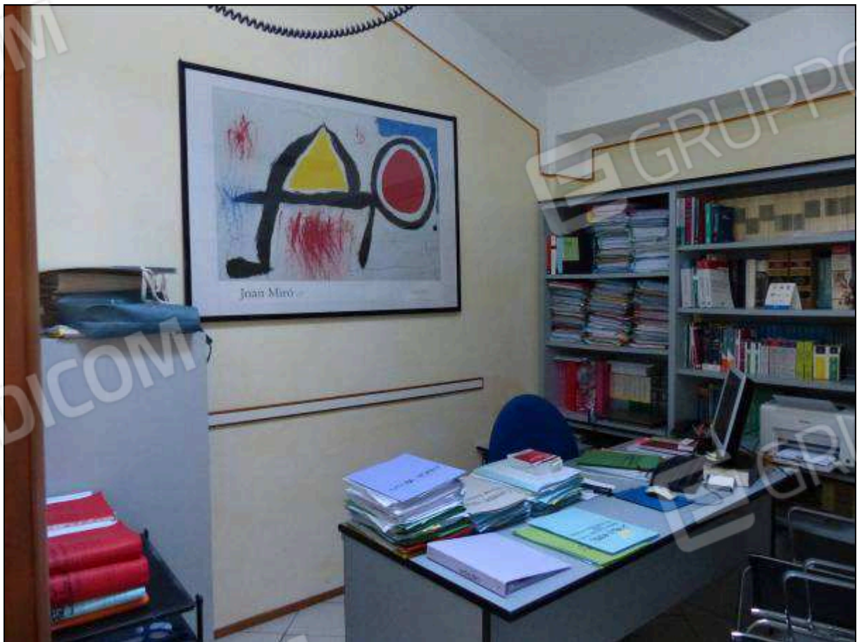
FOTO 27 – Piano secondo: secondo ripostiglio, attualmente arredato e utilizzato come ufficio.