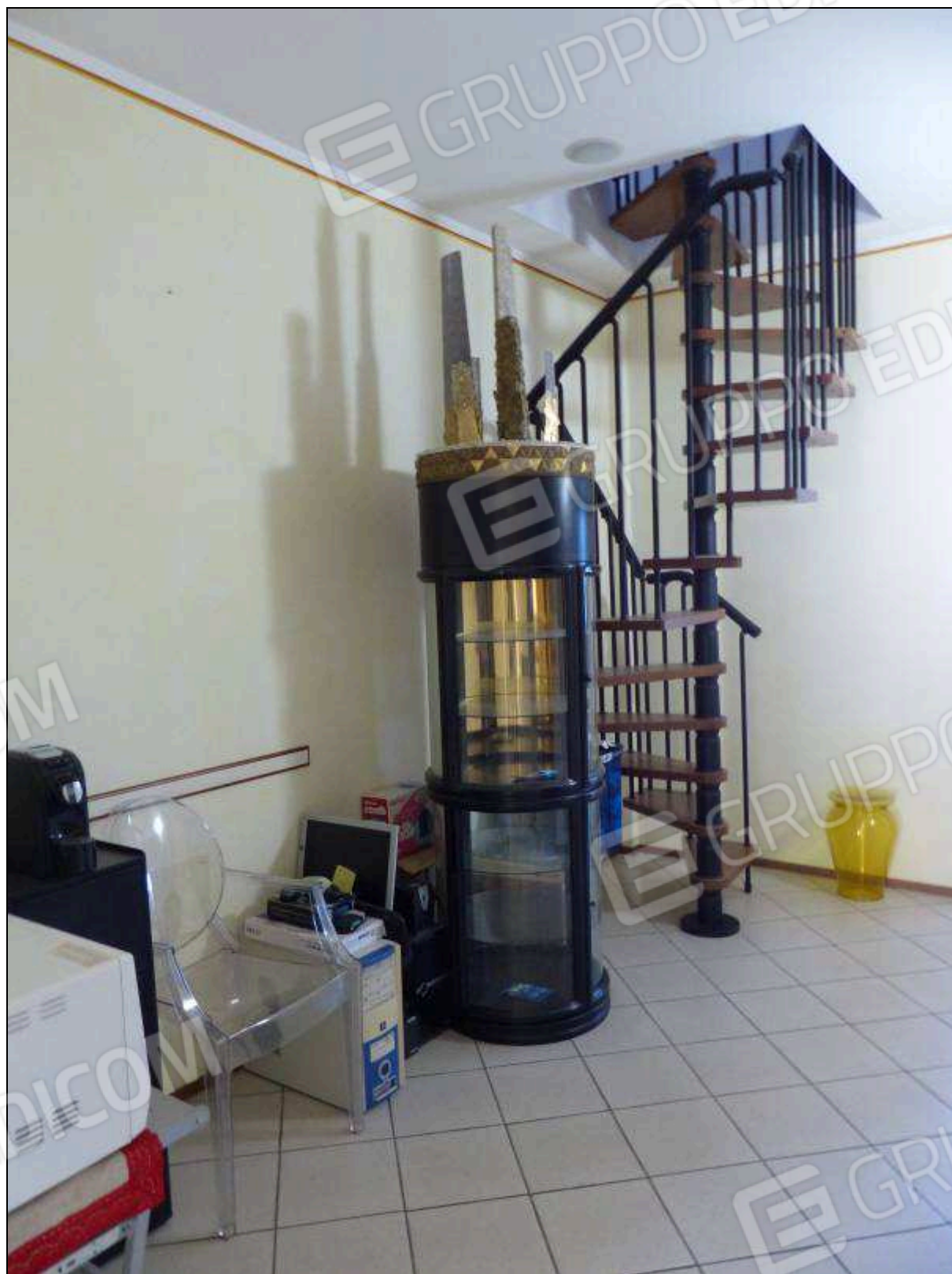
FOTO 36 – Piano secondo: scala interna, di collegamento al ripostiglio di piano terzo, non supportata dai necessari titoli edilizi (da assoggettare a rimozione per ripristino dei luoghi).