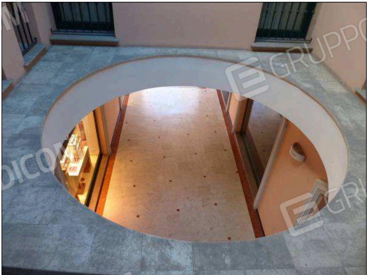
FOTO 9 – Piano primo: pozzo di luce condominiale, comune all'unità immobiliare di interesse.