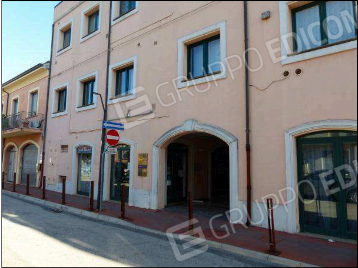
FOTO 3 – Portale di ingresso, in affaccio su Via Bucci, che conduce alla galleria comune.