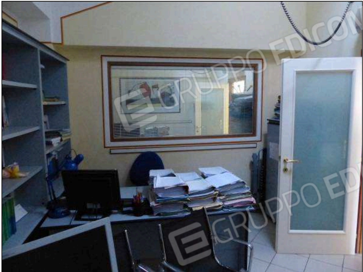
FOTO 26 – Piano secondo: secondo ripostiglio, attualmente arredato e utilizzato come ufficio.