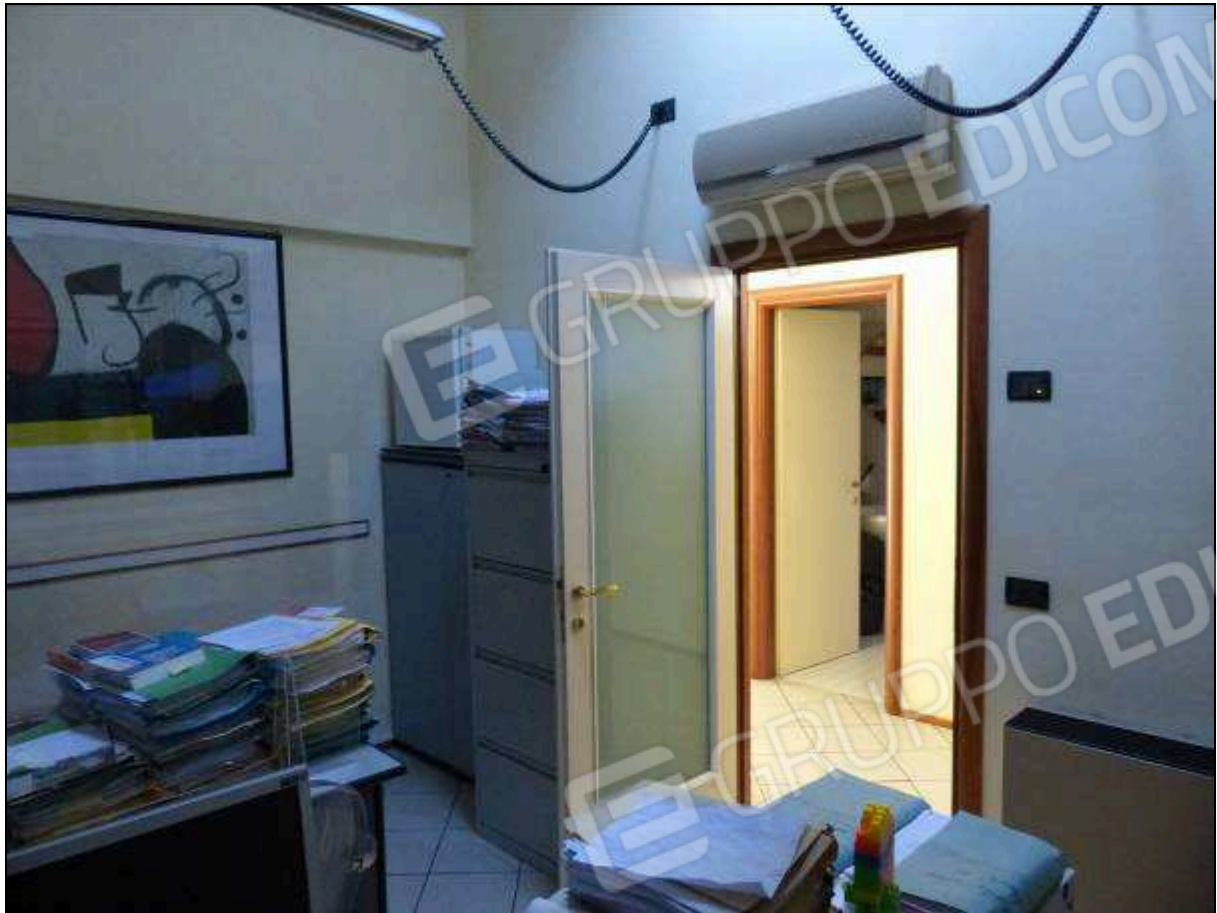
FOTO 23 – Piano secondo: primo ripostiglio, attualmente arredato e utilizzato come ufficio.