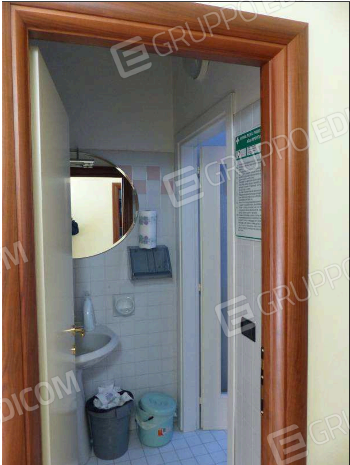
FOTO 20 – Piano secondo: anti bagno dell'unità immobiliare in oggetto.