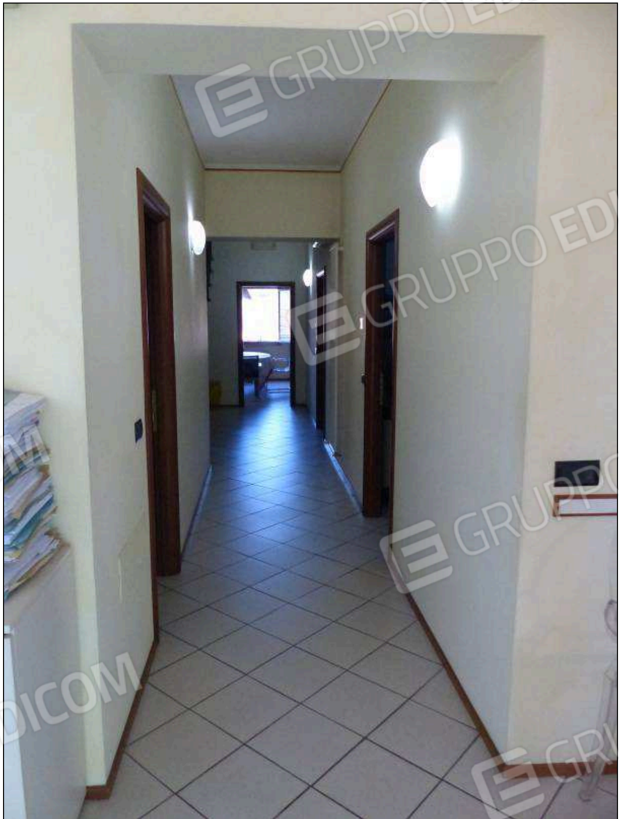
FOTO 19 – Piano secondo: corridoio di disimpegno dell'unità immobiliare in oggetto.