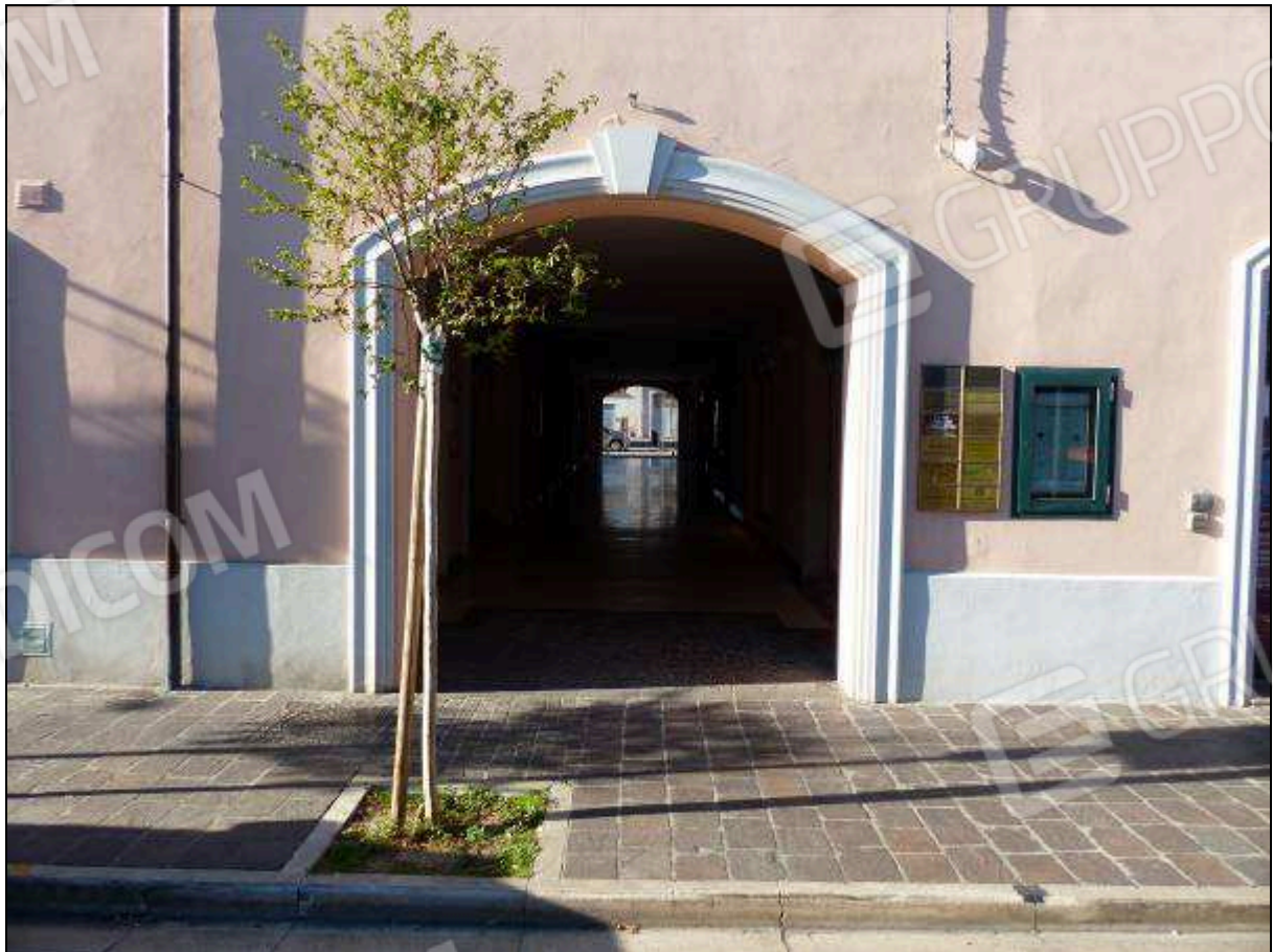
FOTO 4 – Portale di ingresso, in affaccio su Via Bucci, che conduce alla galleria comune.