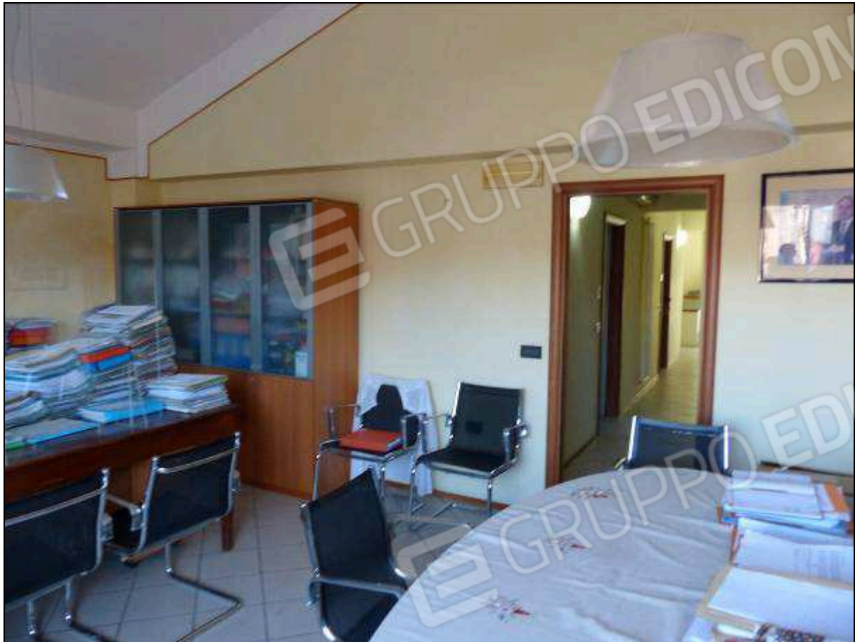
FOTO 34 – Piano secondo: ufficio sul retro dell'unità immobiliare in oggetto.