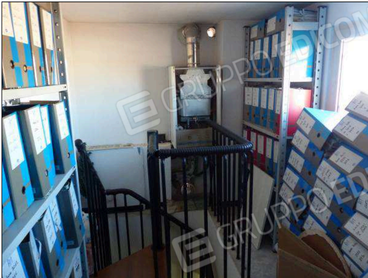
FOTO 37 – Piano terzo: ripostiglio, non supportato dai necessari titoli edilizi, da assoggettare a demolizione.