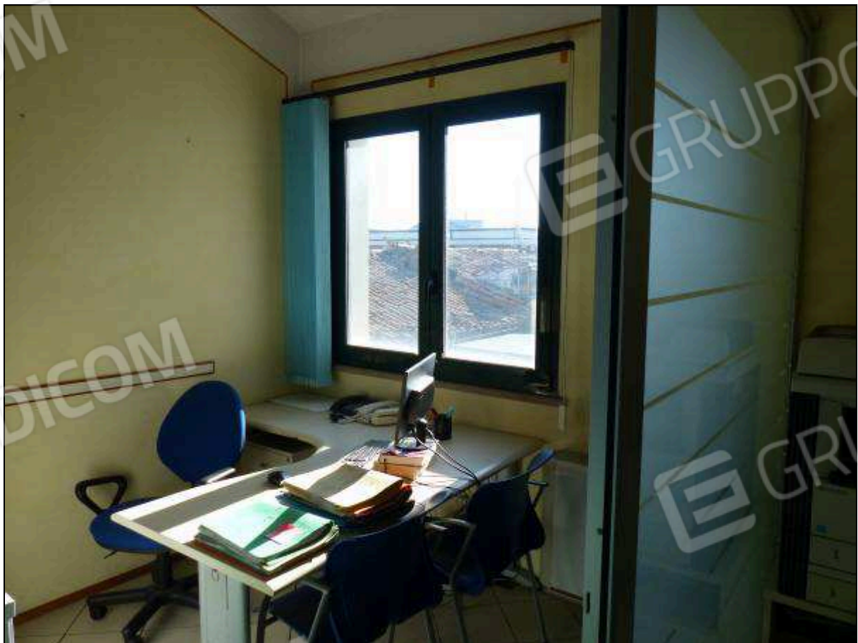
FOTO 18 – Piano secondo: ufficio all'ingresso dell'unità immobiliare in oggetto.