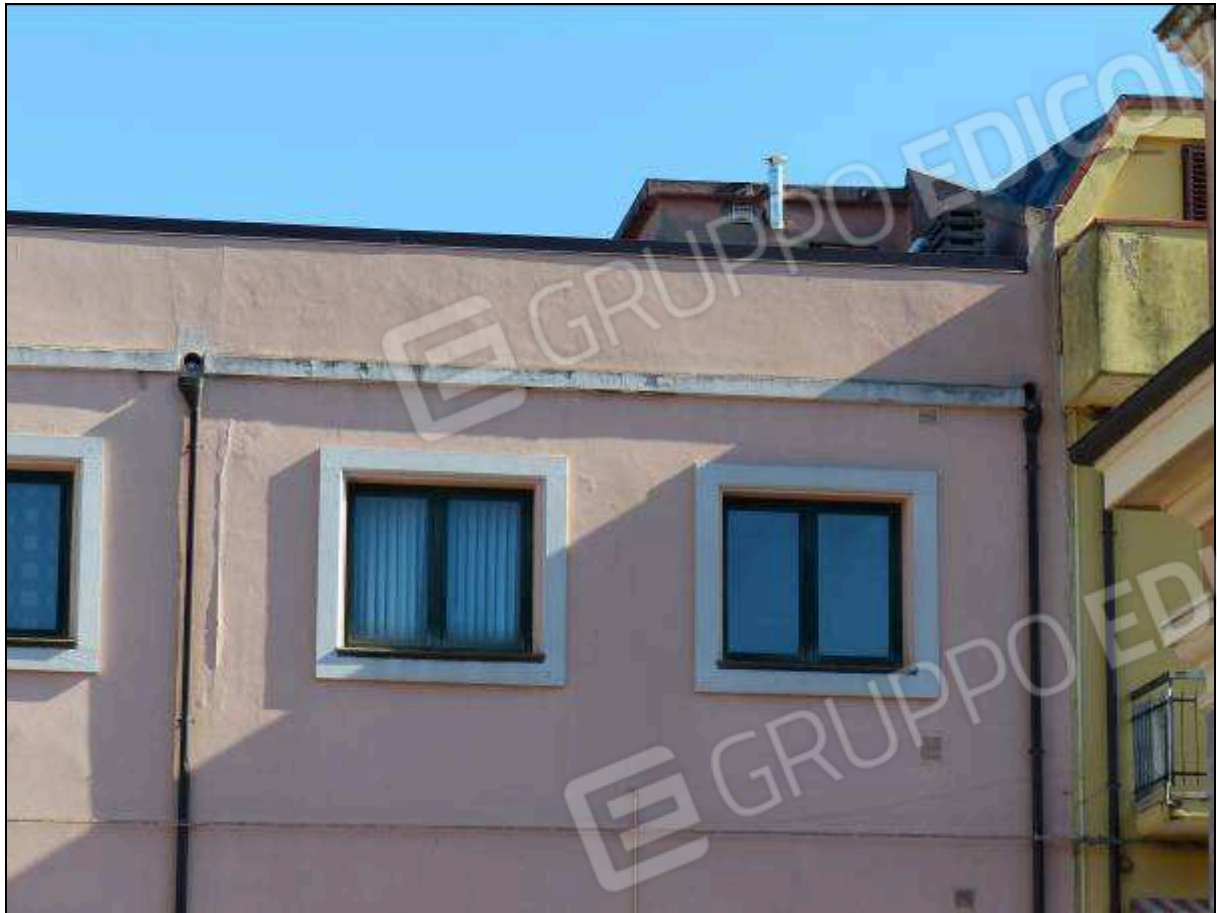
FOTO 39 – Prospetto retro: volume sulla copertura, non supportato dai necessari titoli edilizi, da rimuovere.