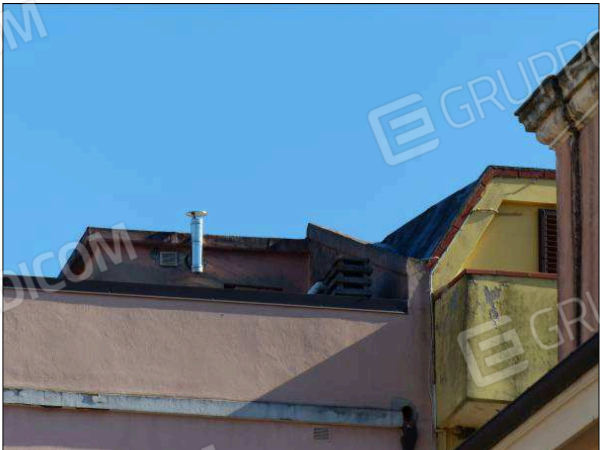
FOTO 40 – Prospetto retro: volume sulla copertura, non supportato dai necessari titoli edilizi, da rimuovere.