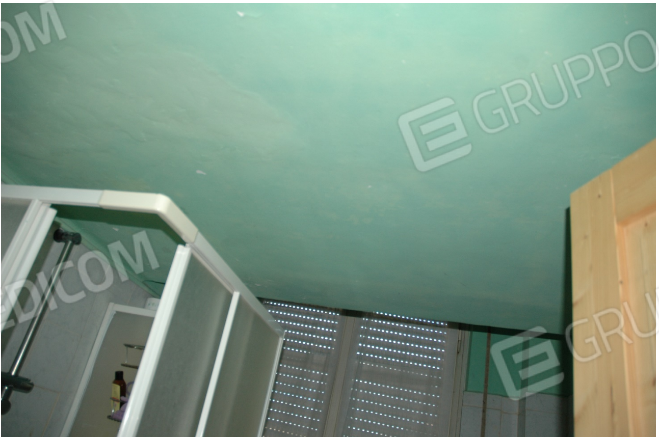
Nell'antibagno è ricavato un ripostiglio, accessibile dal corridoio d'ingresso, l'altezza è ora di cm. 213 circa.