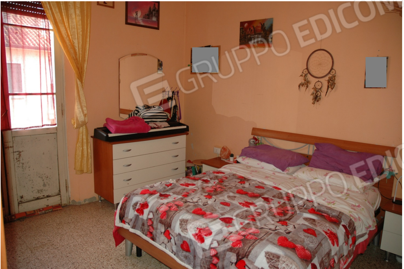
Camera matrimoniale con porta finestra e ringhiera a filo muro