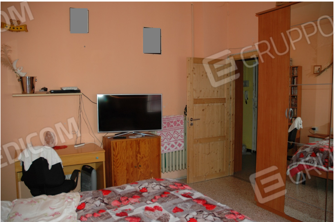
Camera matrimoniale si nota la presenza di tubazioni a vista