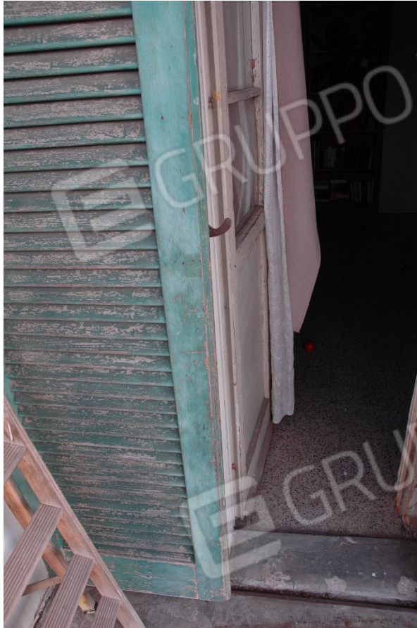
Persiane scorrevoli, soglie e infissi in cattivo stato