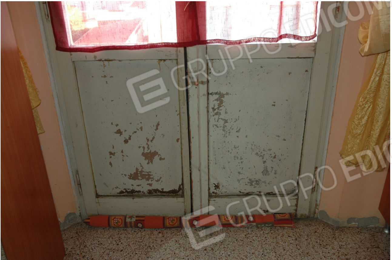
Particolare dell'infisso in cattivo stato.