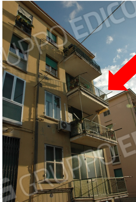
Balcone sul lato Ovest