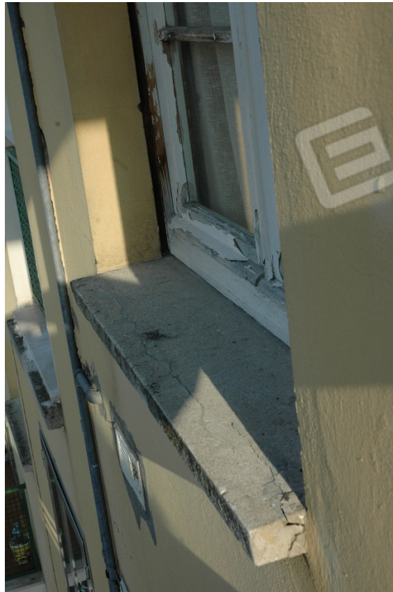
Particolare dell'infisso della cucina e della banchina lesionata