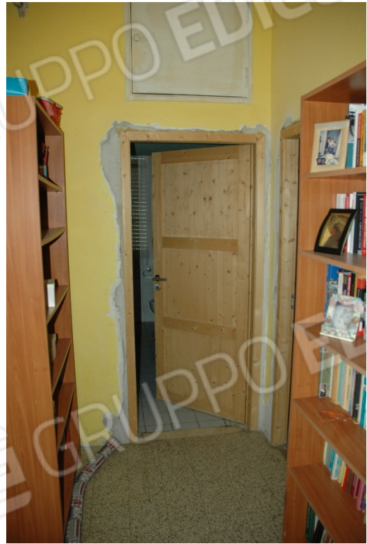
Disimpegno, sopra la porta del bagno è visibile il portello di accesso al ripostiglio ricavato all'interno dell'ingresso del bagno