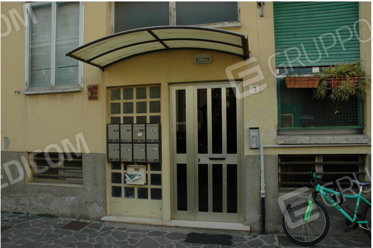
La palazzina ha due ingressi di cui uno al n.3