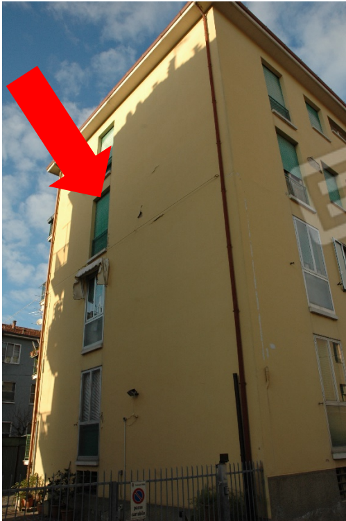
Vista lato monte, al piano secondo.