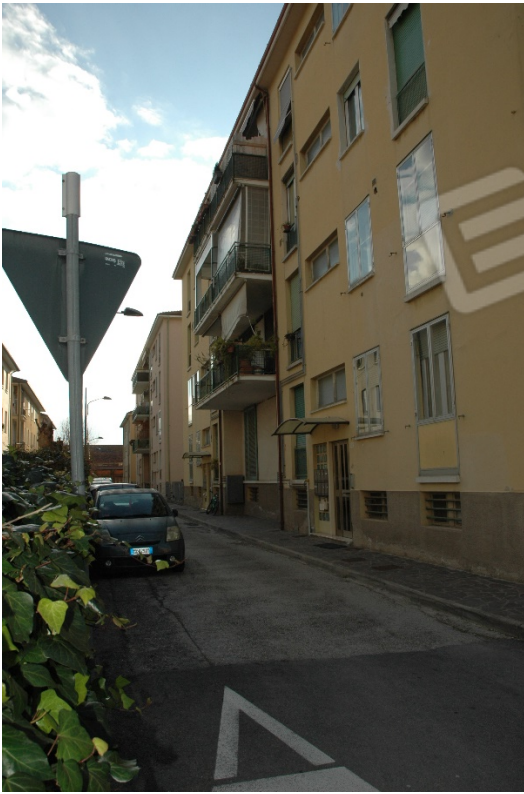
Ingresso su via Ippolito Nievo