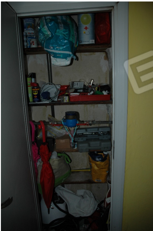
Piccolo ripostiglio nel corridoio