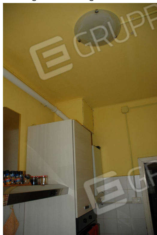
Cucina con la caldaia a parete