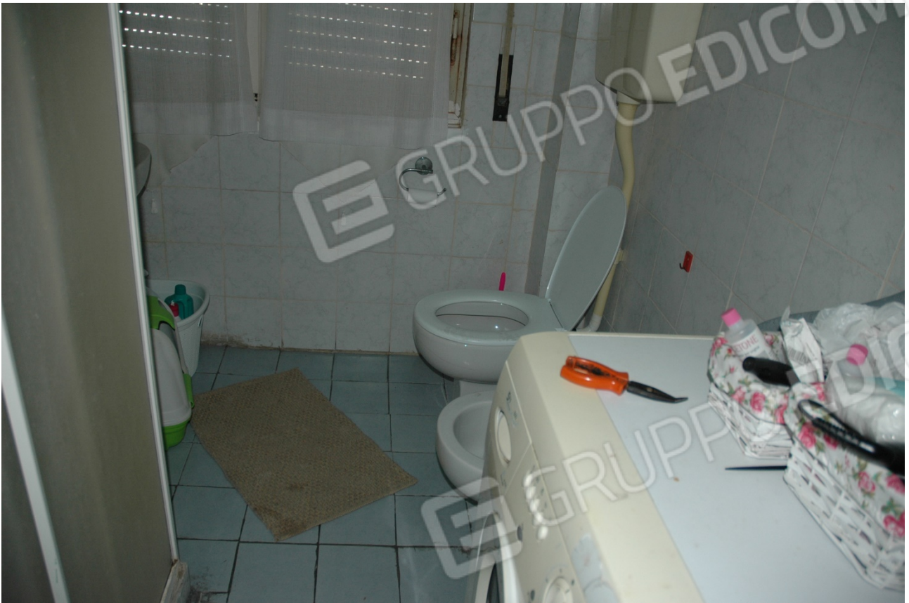
Bagno, molte delle tubazioni sono a vista.