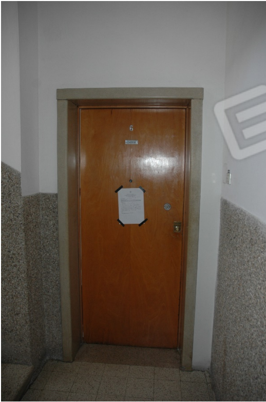
Ingresso al piano secondo