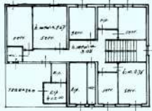
SOTTOTETTO SOTTOTETTO PARTICIPABILE