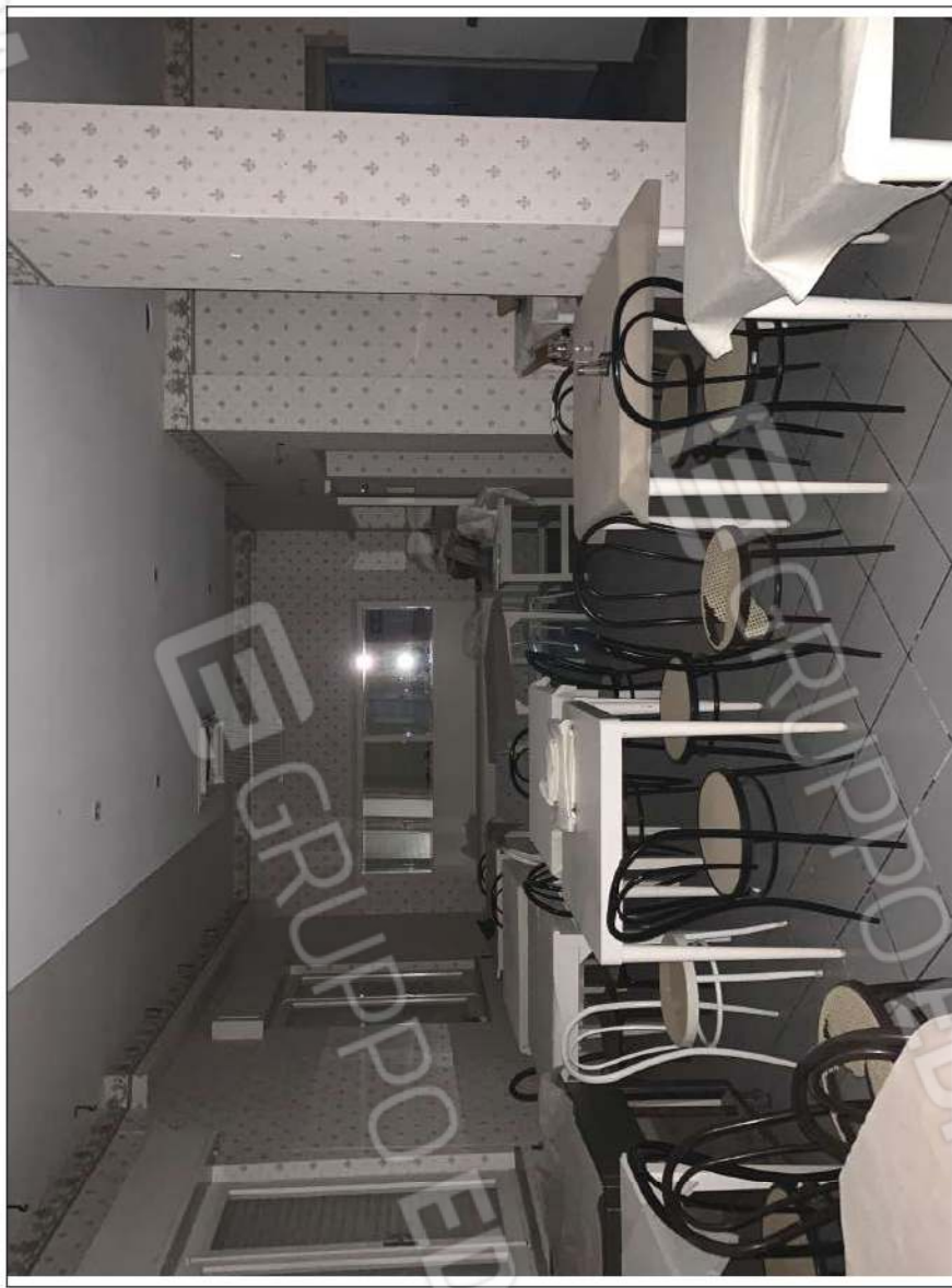
- IMMAGINE N. 12 - (sala da pranzo - piano rialzato)