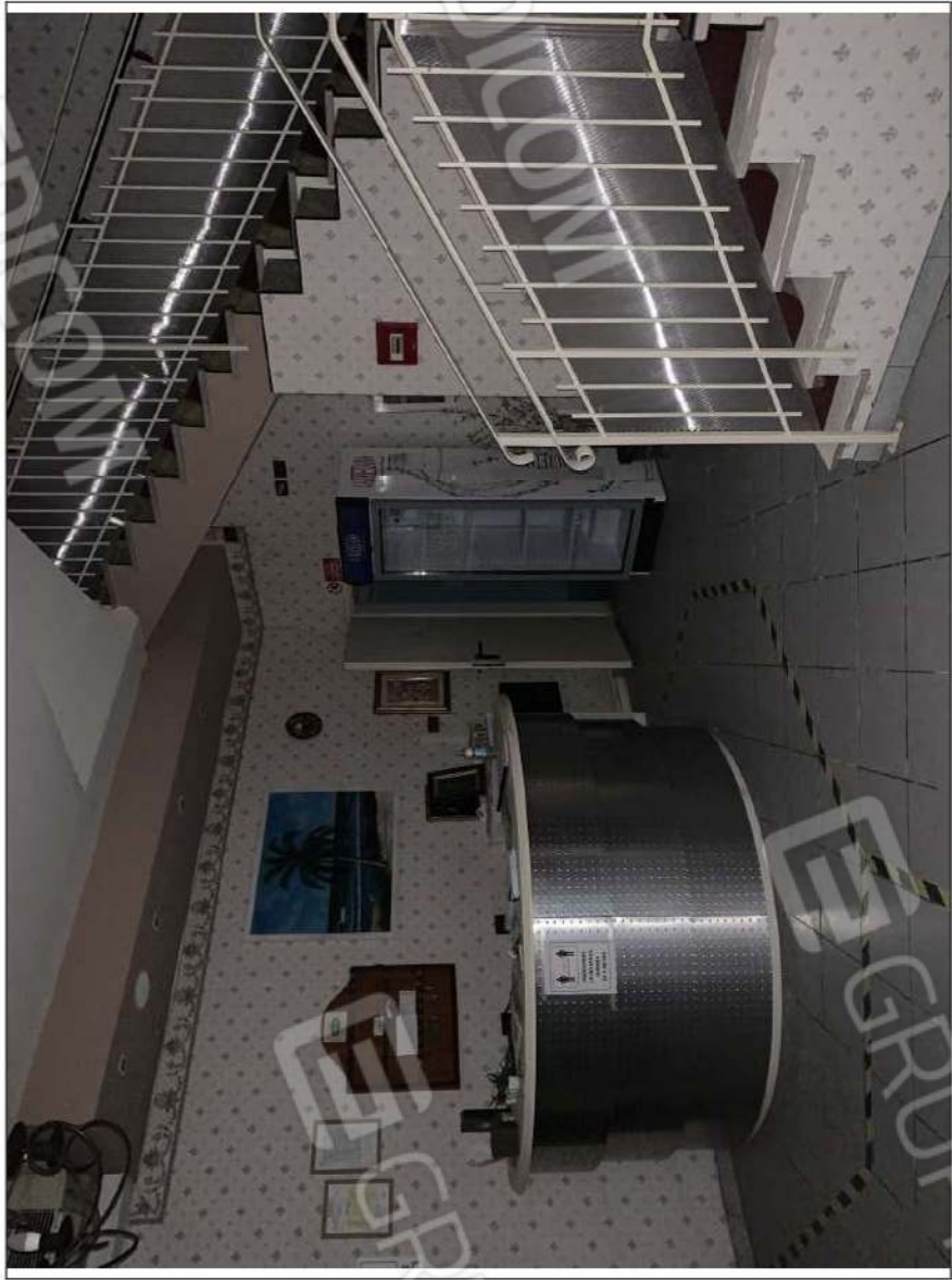
- IMMAGINE N. 11 - (ingresso/reception - piano rialzato)