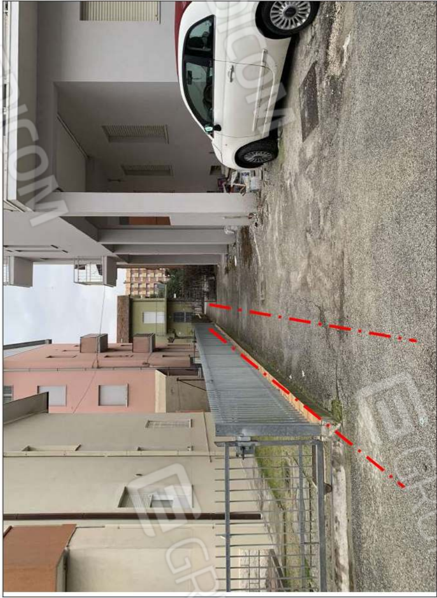
- IMMAGINE N. 7 - (porzione di corte interessata dalla servitù di passaggio - piano terra)