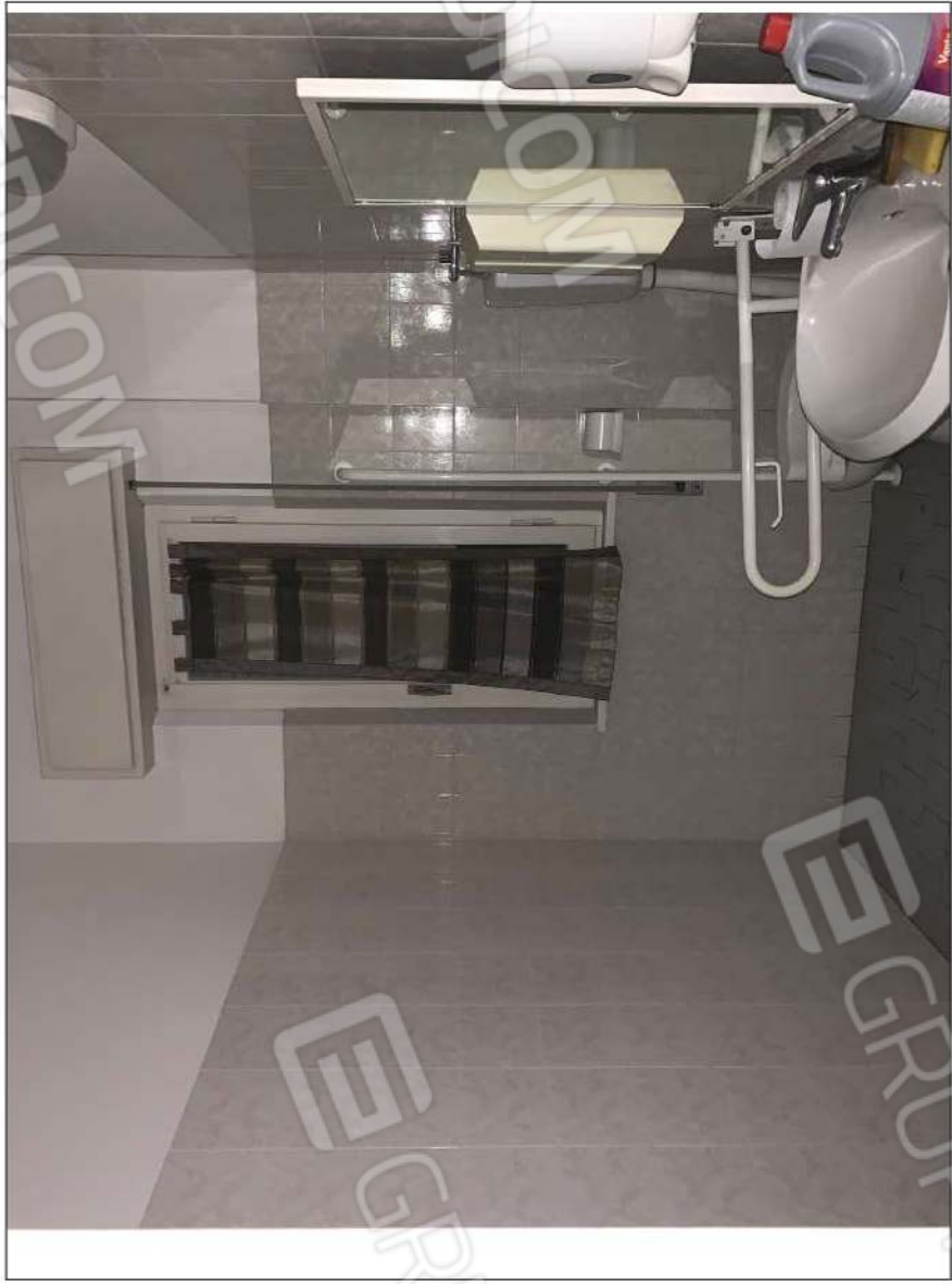
- IMMAGINE N. 13 - (W.C.H. - piano rialzato)