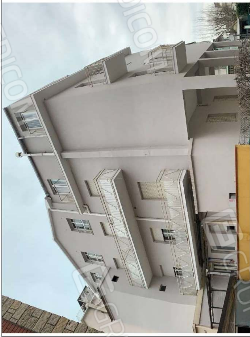
- IMMAGINE N. 3 - (prospetti lato Bellaria-Igea Marina e lato monte)