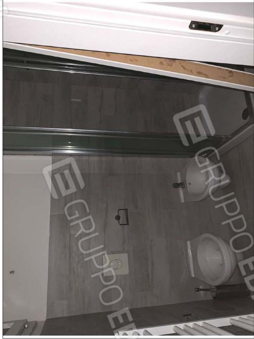
- IMMAGINE N. 28 - (W.C.D. - piano terzo/sottotetto)