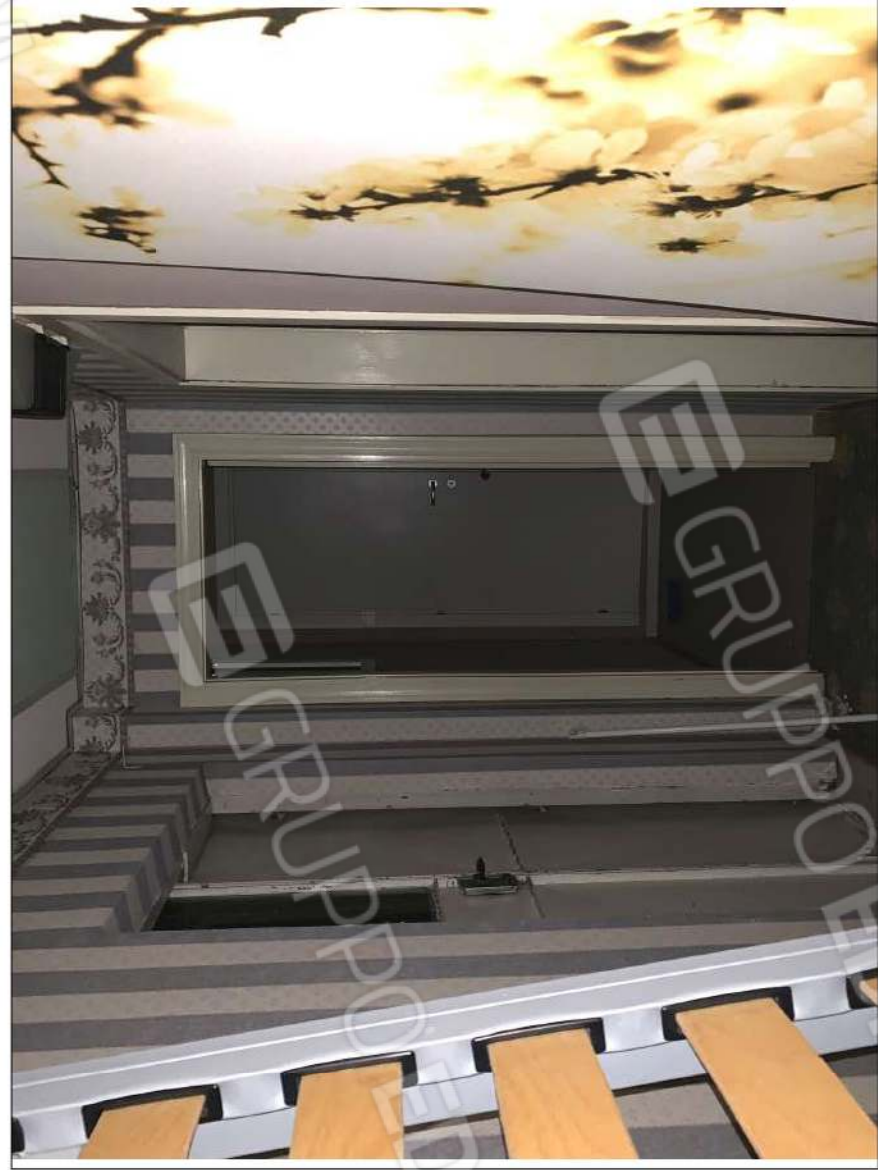
- IMMAGINE N. 26 - (disimpegno - piano terzo/sottotetto)