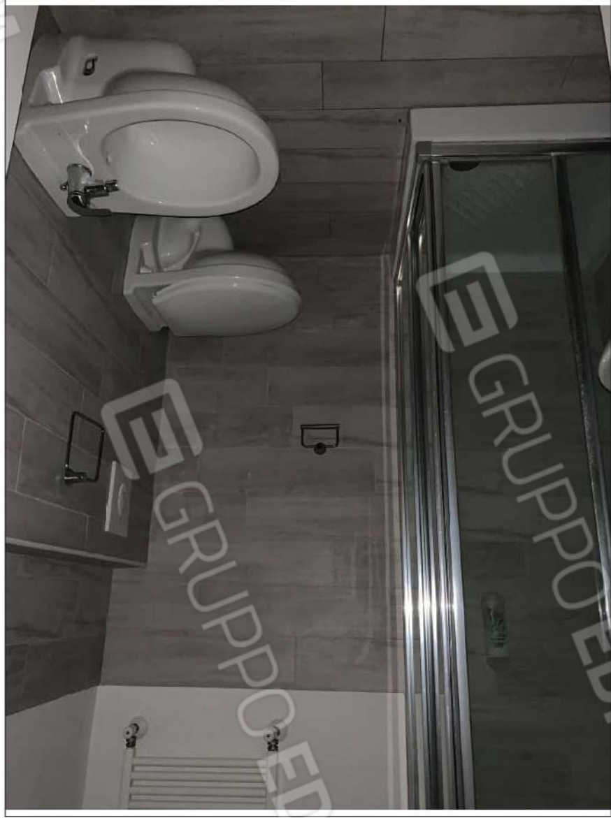
- IMMAGINE N. 24 - (W.C.D. - piano secondo)