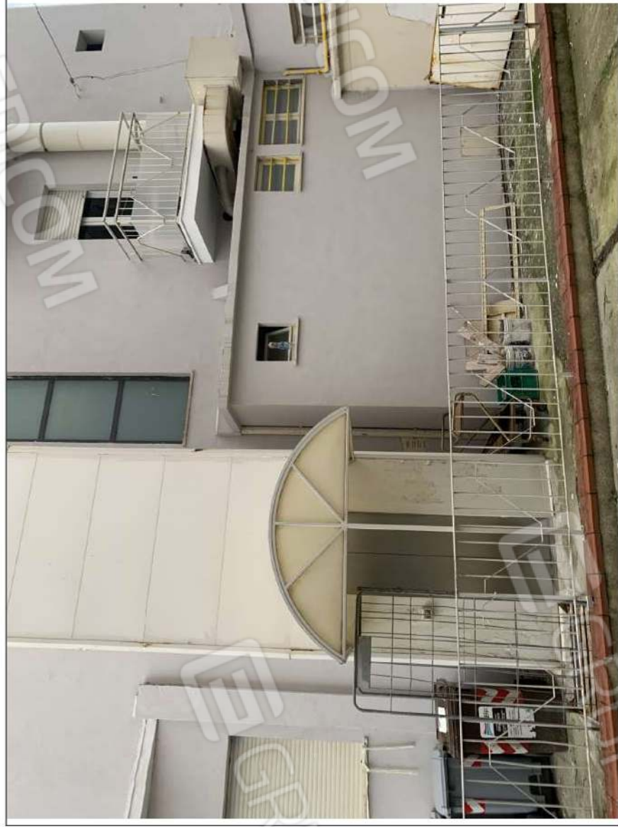
- IMMAGINE N. 5 - (prospetto lato mare con accesso ascensore dalla corte)