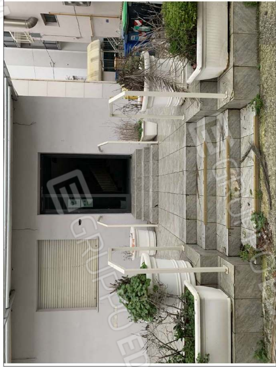
- IMMAGINE N. 6 - (ingresso principale - piano terra/rialzato)