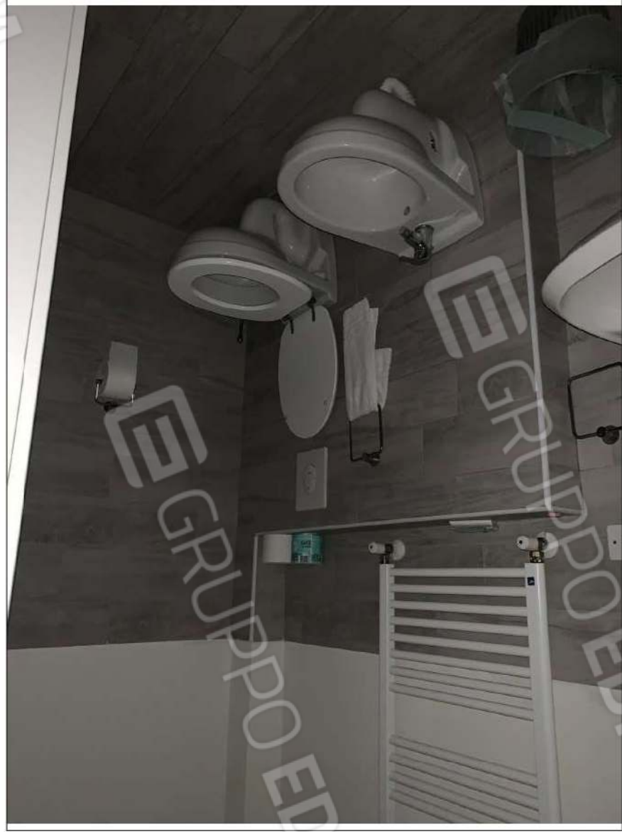
- IMMAGINE N. 18 - (W.C.D. - piano primo)