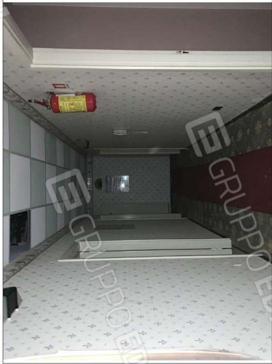
- IMMAGINE N. 22 - (disimpegno - piano secondo)