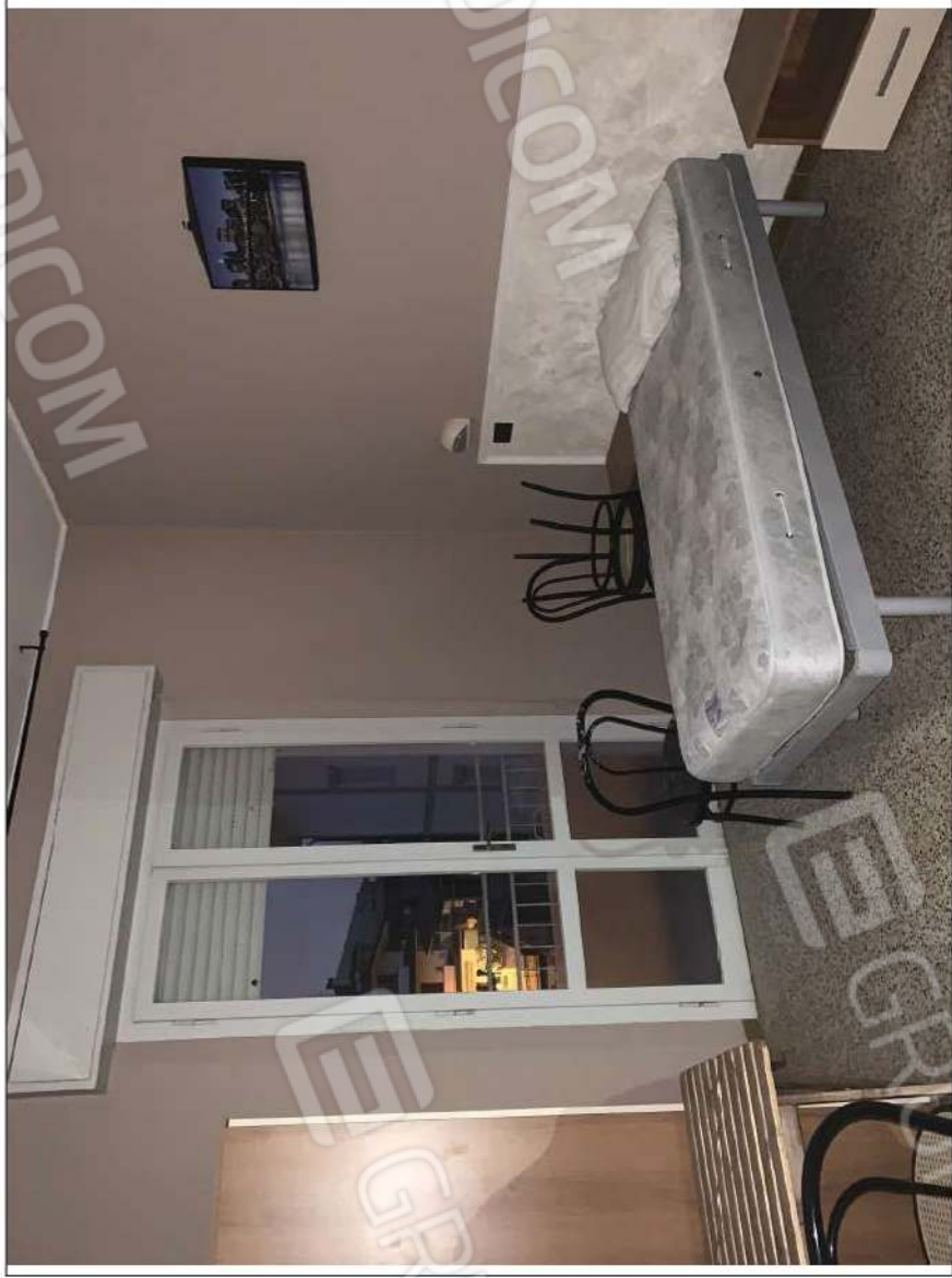
- IMMAGINE N. 23 - (camera n. 212 - piano secondo)