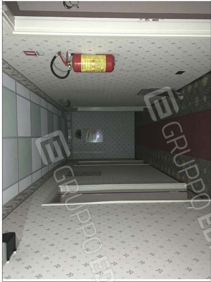
- IMMAGINE N. 16 - (disimpegno - piano primo)