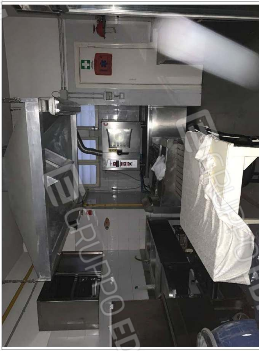
- IMMAGINE N. 14 - (cucina - piano rialzato)