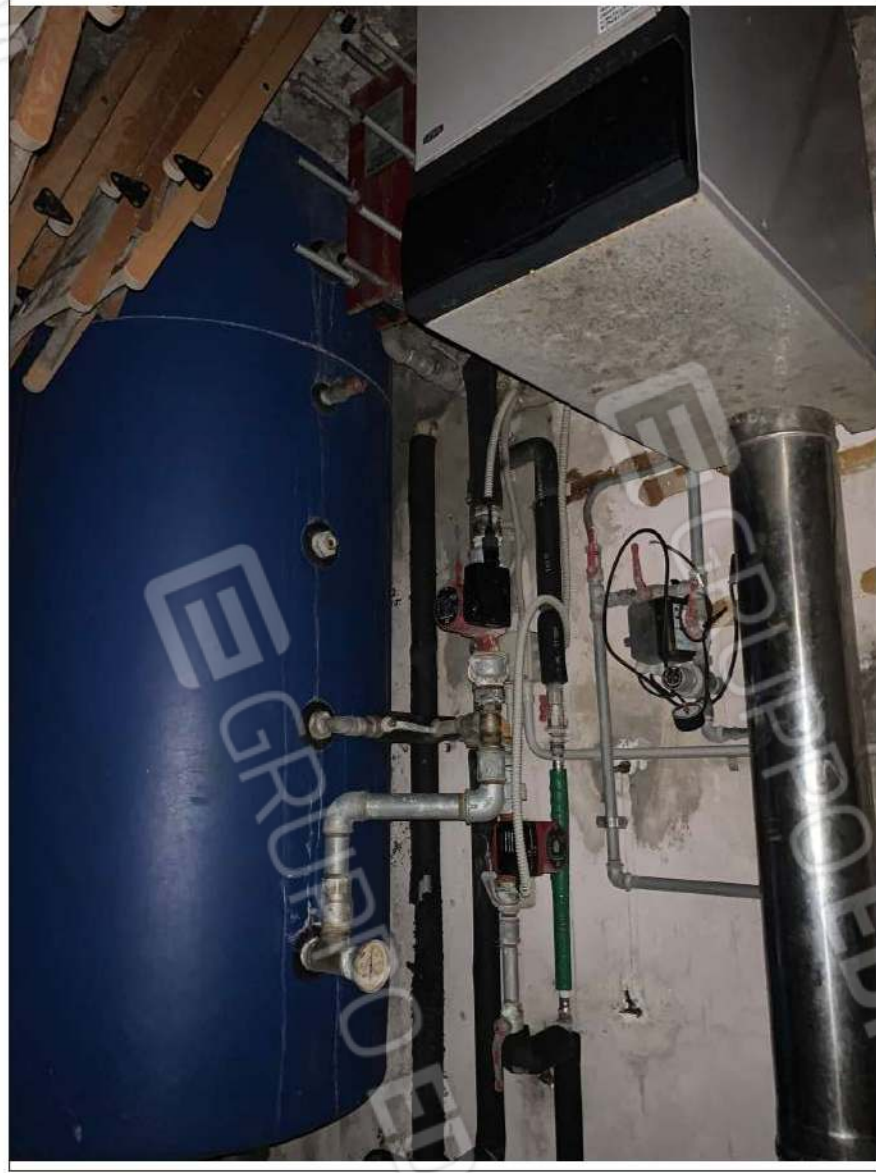
- IMMAGINE N. 10 - (C.T. - piano terra)