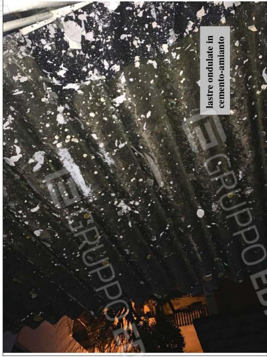
- IMMAGINE N. 31 - (particolare copertura piano rialzato)