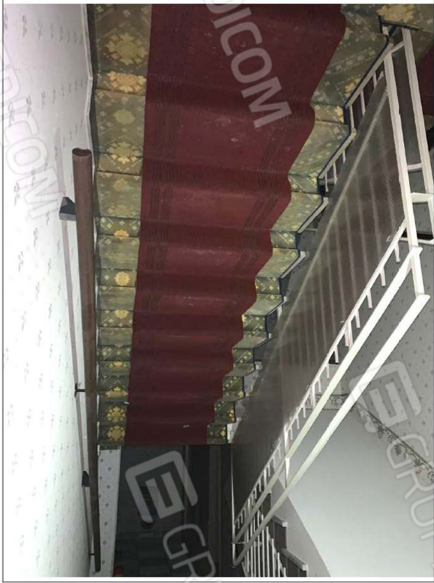
- IMMAGINE N. 21 - (scala di collegamento ai piani)