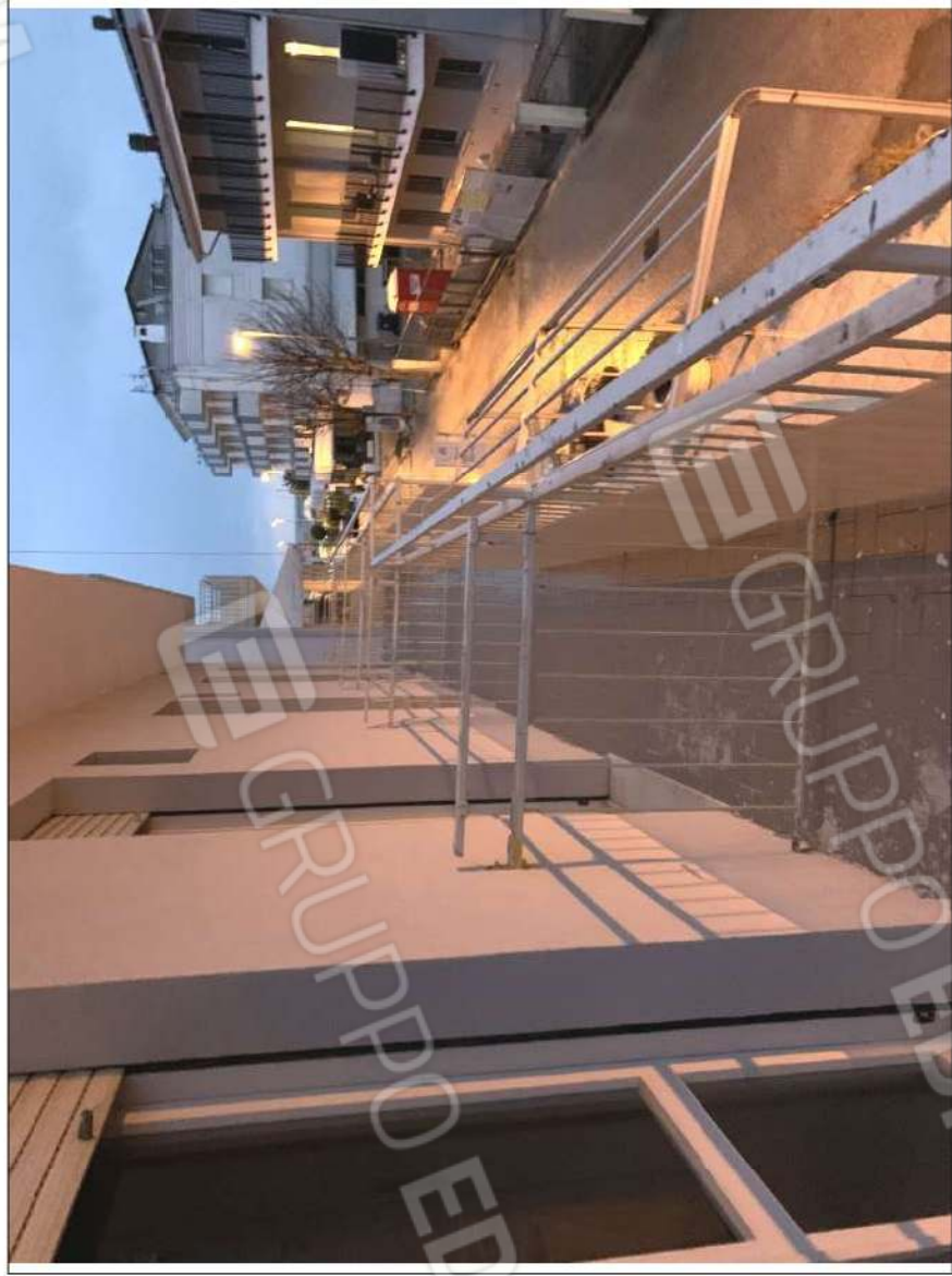
- IMMAGINE N. 20 - (balconi - piano primo)