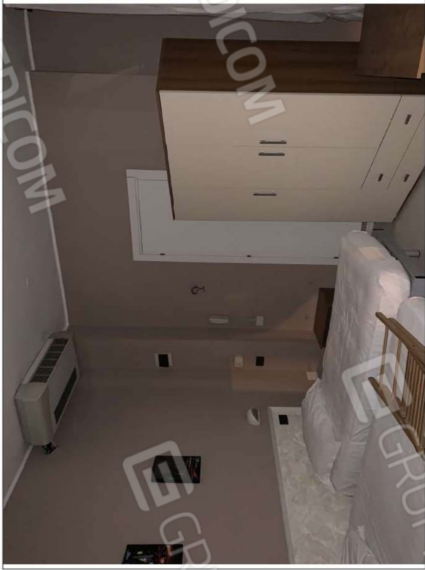
- IMMAGINE N. 17 - (camera n. 118 - piano primo)