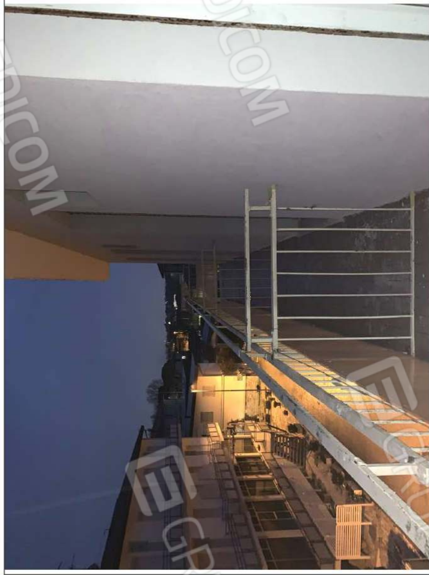
- IMMAGINE N. 25 - (balconi - piano secondo)