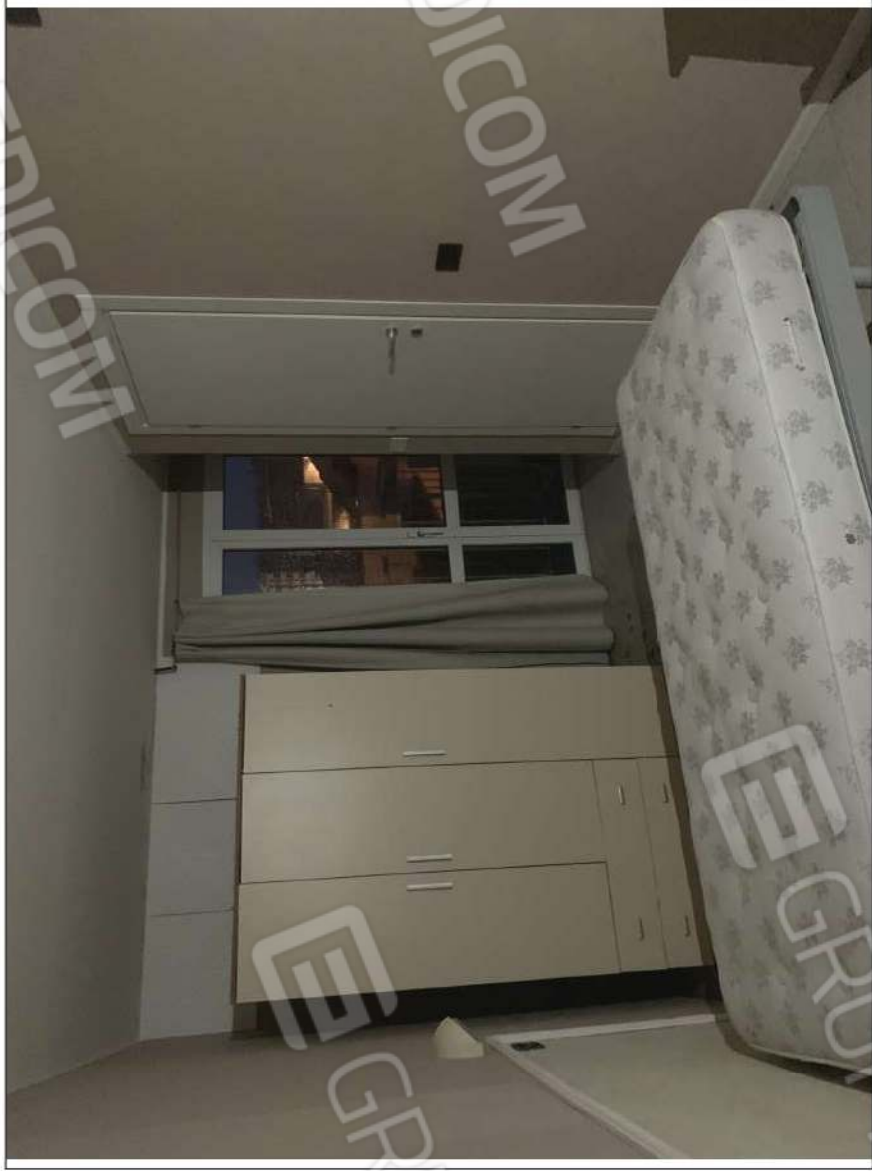
- IMMAGINE N. 27 - (camera 308 - piano terzo/sottotetto)