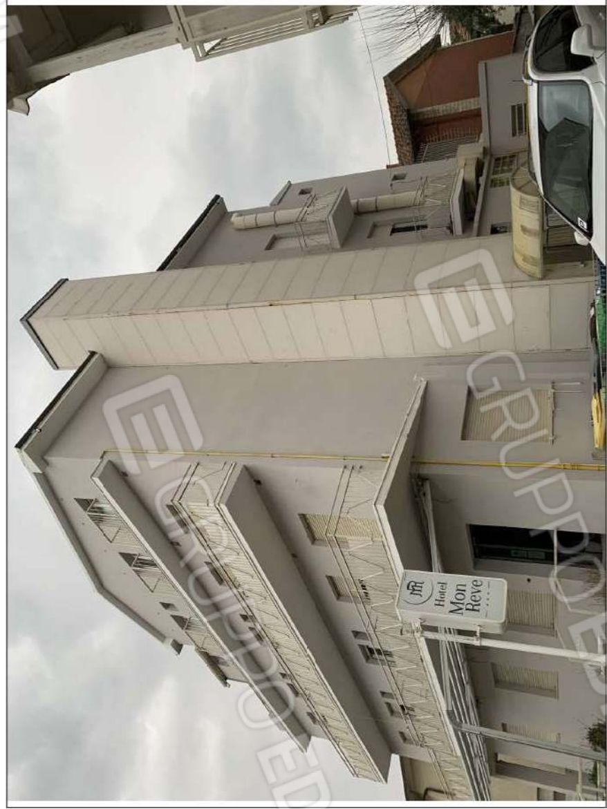
- IMMAGINE N. 4 - (prospetti su V.le Lazzaro Papi e lato mare)