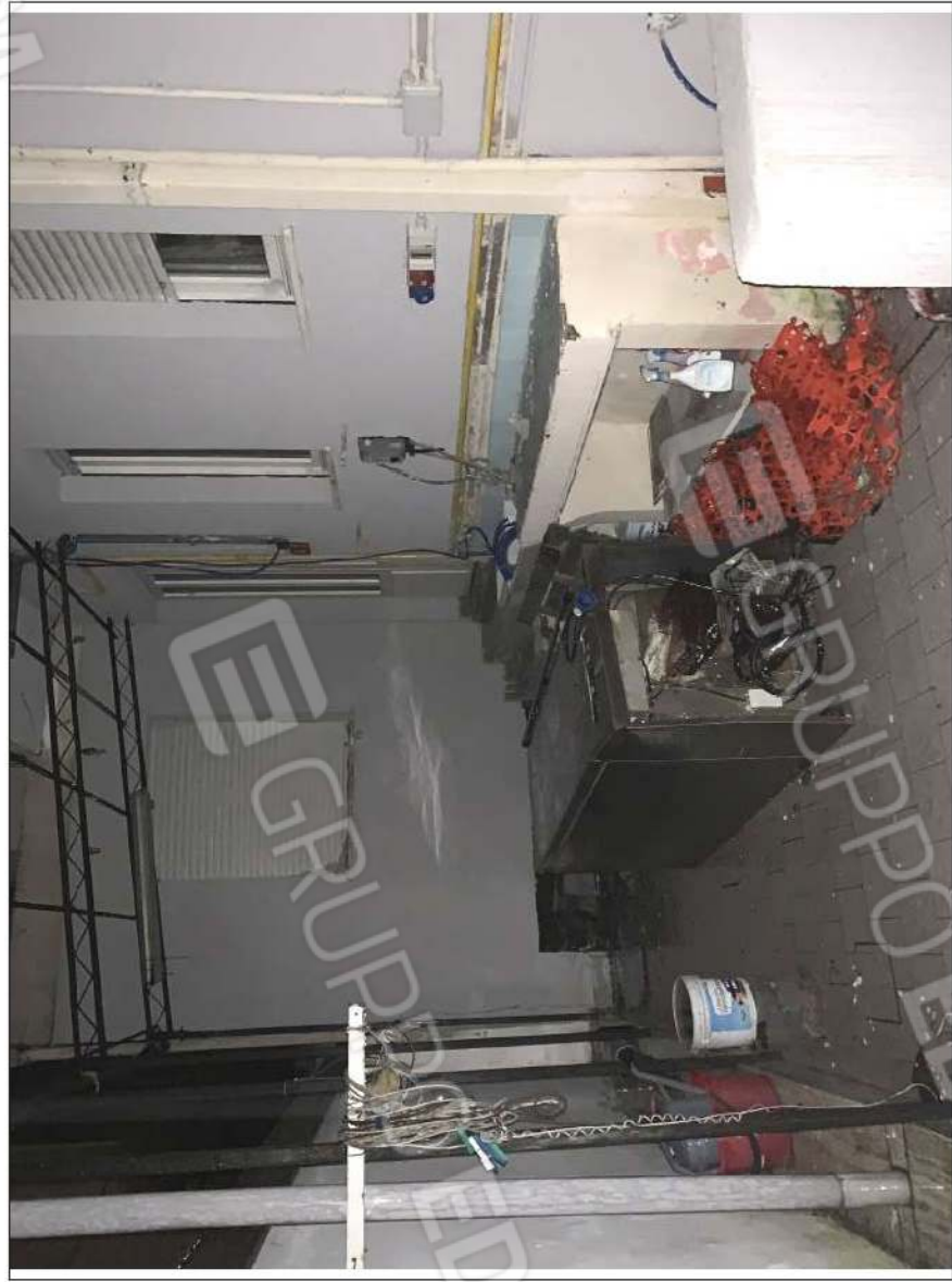
- IMMAGINE N. 8 - (corte esterna e tettoia - piano terra)