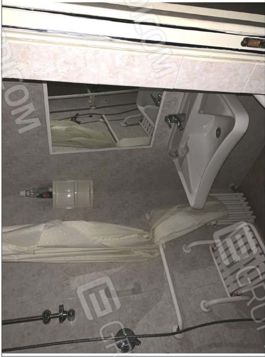
- IMMAGINE N. 19 - (W.C.H. - piano primo)