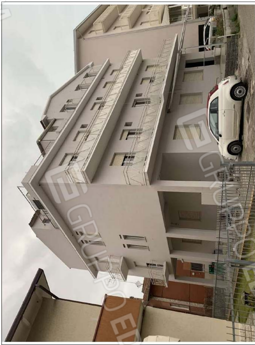
- IMMAGINE N. 2 - (prospetti su V.le Lazzaro Papi e lato monte)