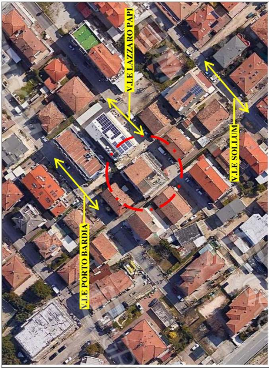
- IMMAGINE N. 1 - (visione aerea della zona)