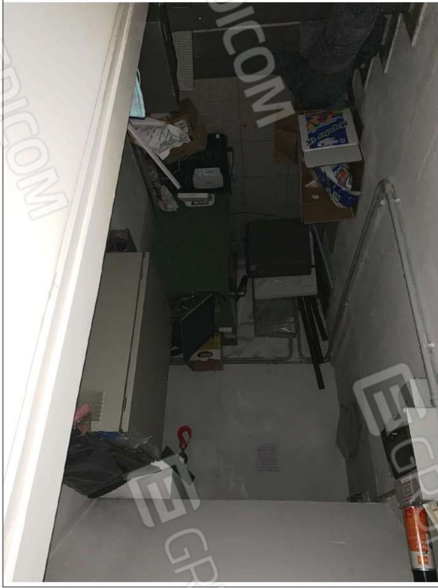
- IMMAGINE N. 15 - (vano macchine ascensore - piano terra/rialzato)