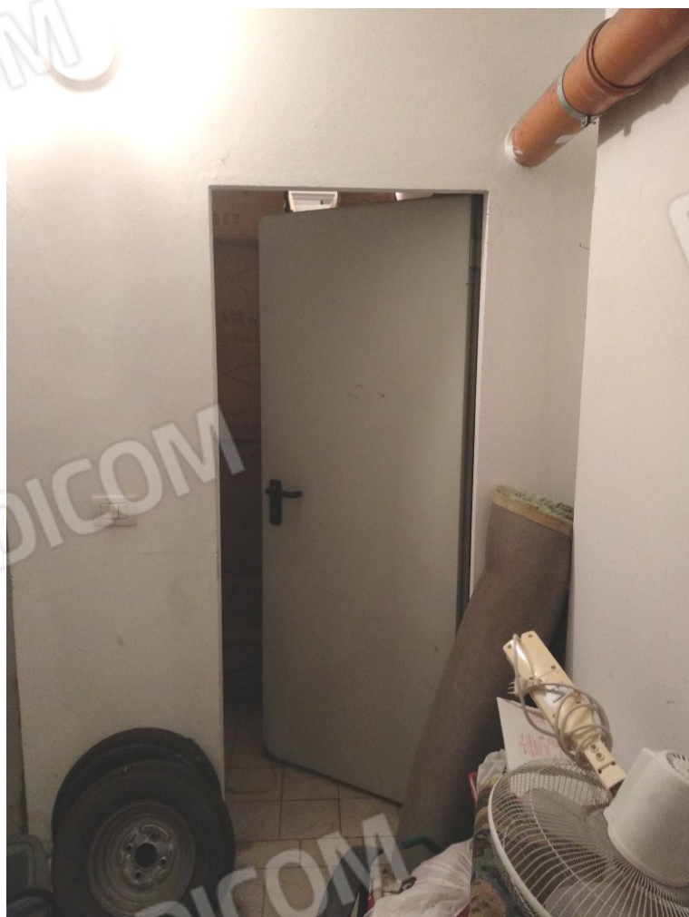
FOTO 15 piano interrato cantina