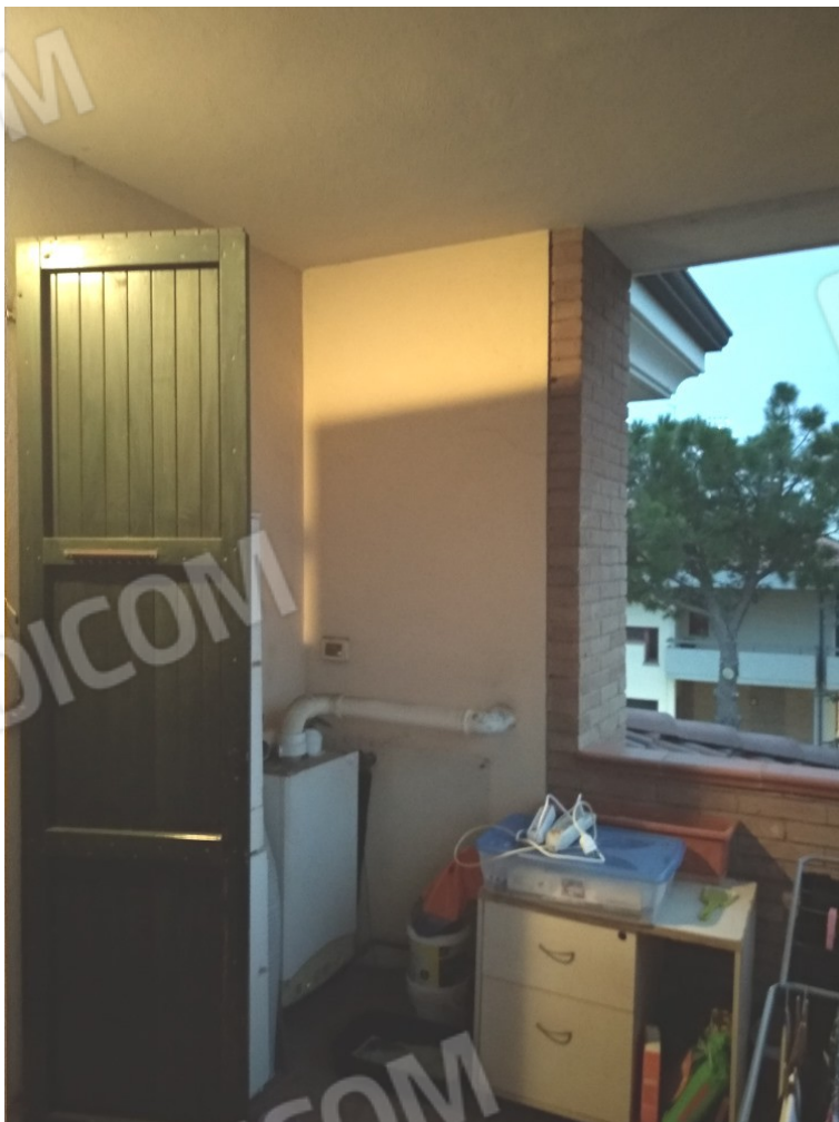
FOTO 11 loggia sul fronte