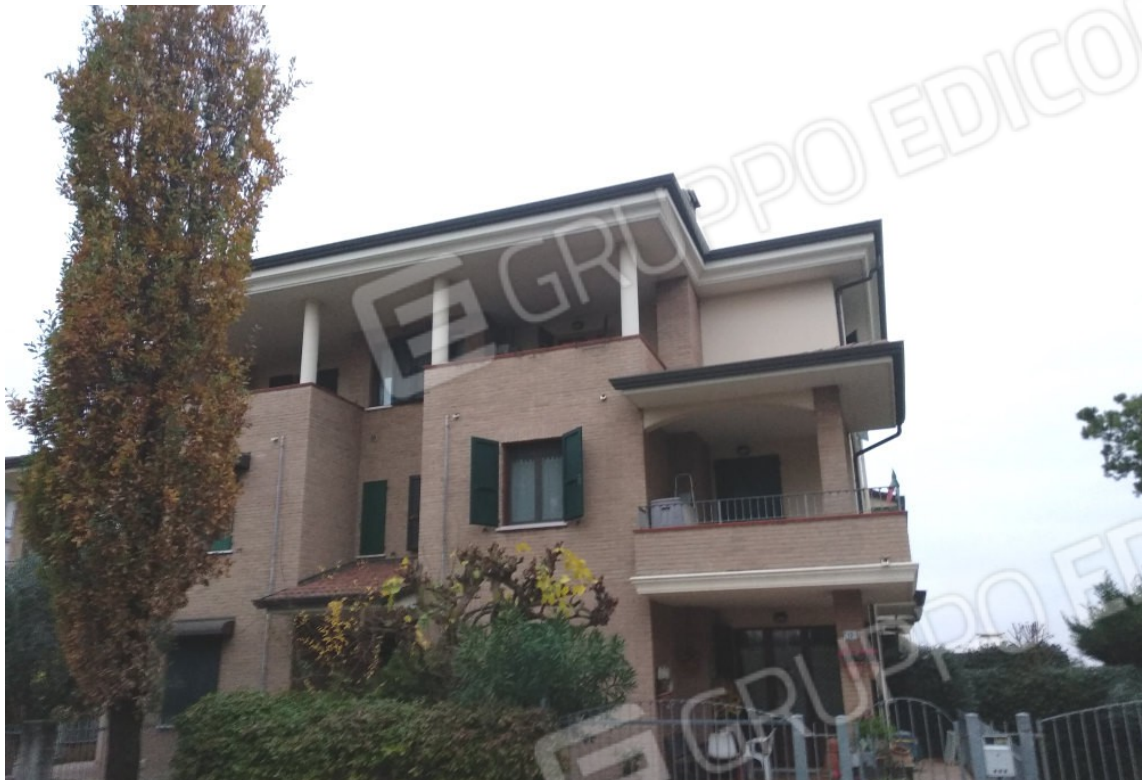
FOTO 02 - esterno