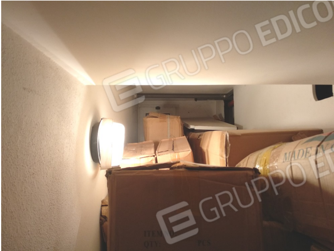
FOTO 16 piano interrato cantina