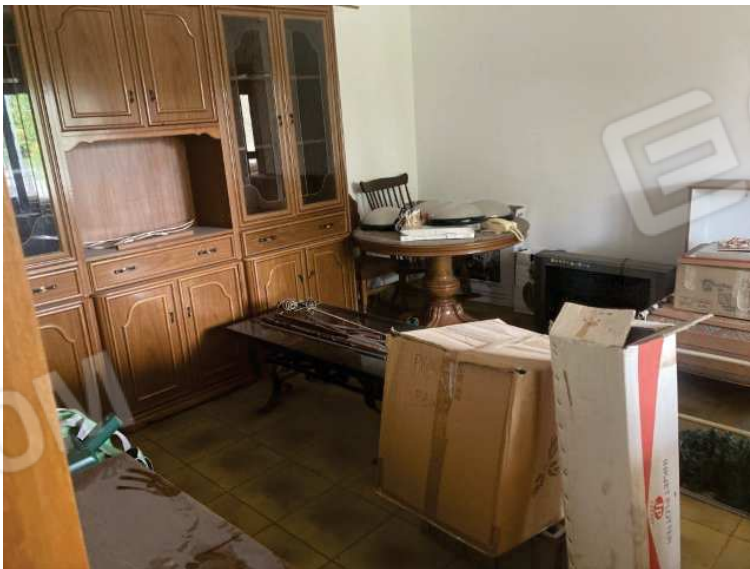
vista interna soggiorno