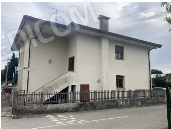
prospetto lato Nord