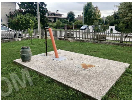
particolare giardino comune con pozzo artesiano