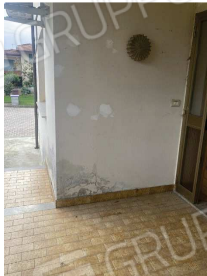
particolare viste porticato