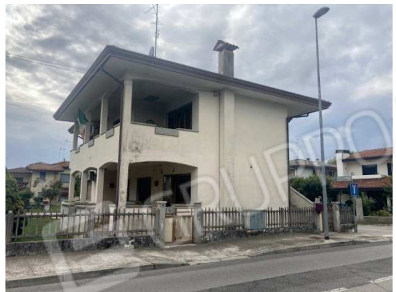
prospetto lato Est