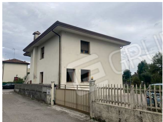
prospetto lato Nord/Ovest