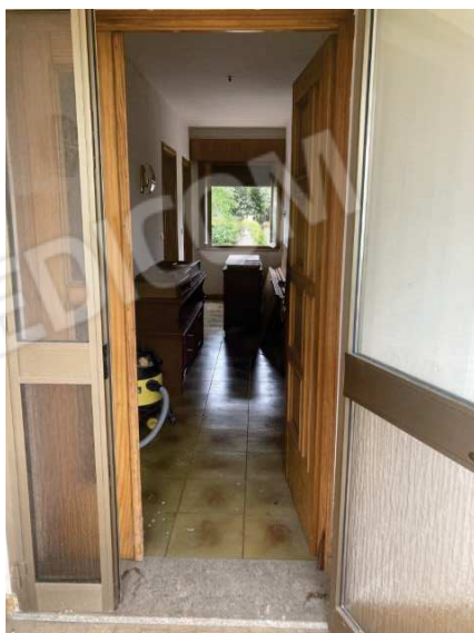
vista porta d'ingresso nel corridoio