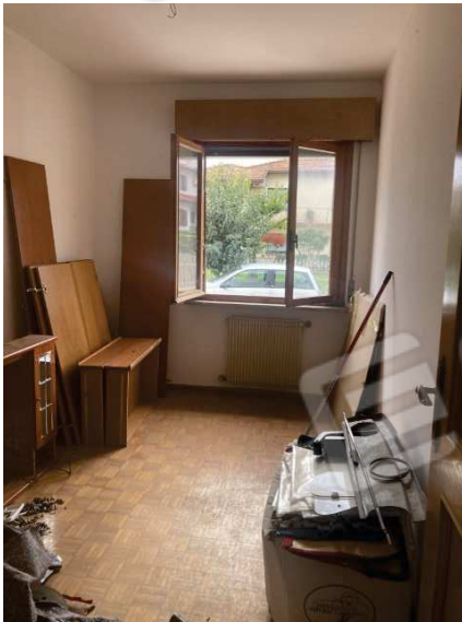
vista interna ulteriore camera