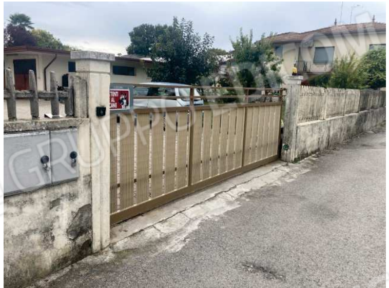
particolare accesso pedonale e carraio