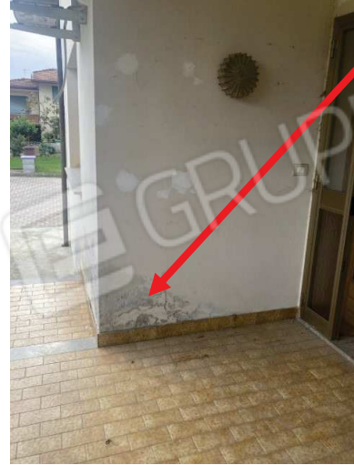
particolare prospetti esterni con degrado delle pitture