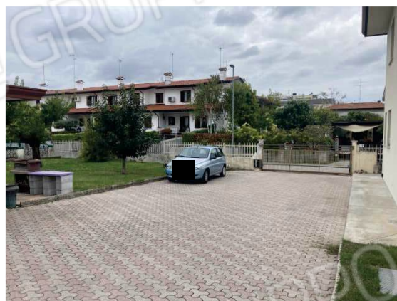
particolare cortile comune