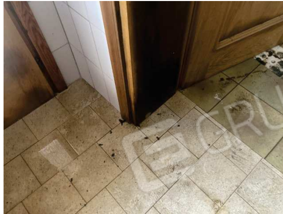
viste porte interne danneggiate