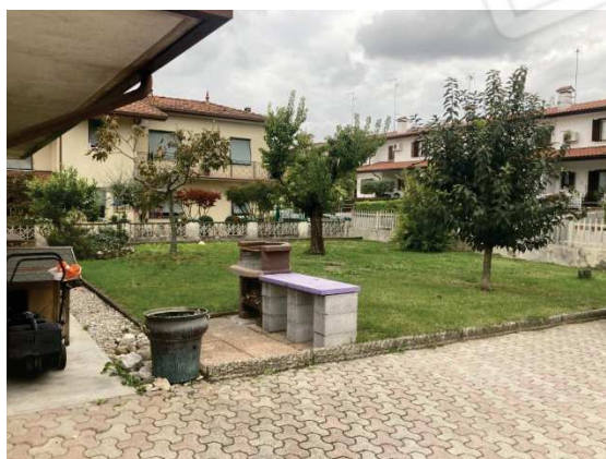
ulteriore particolare del giardino comune