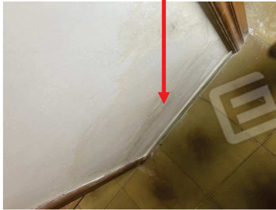
particolare degrado della muratura con umidità di risalita