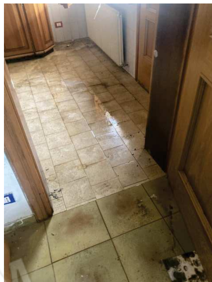
Vista presenza d'acqua sul pavimento del locale soggiorno e cucina