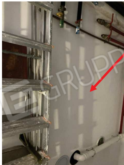
particolare luogo della caldaia rimossa nel locale centrale termica