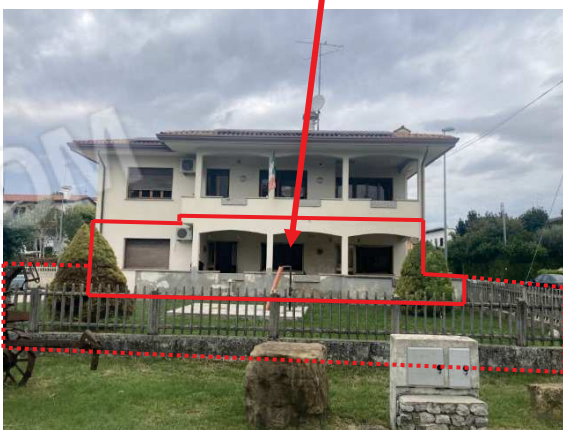
prospetto principale lato Sud con particolare porticato

fabbricato d'abitazione oggetto di esecuzione immobiliare