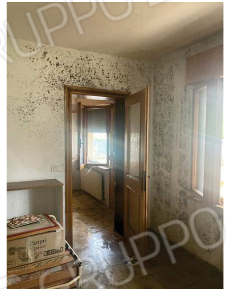
vista interna soggiorno con danni causati da infiltrazioni d'acqua provenienti dal solaio