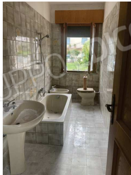
vista interna bagno