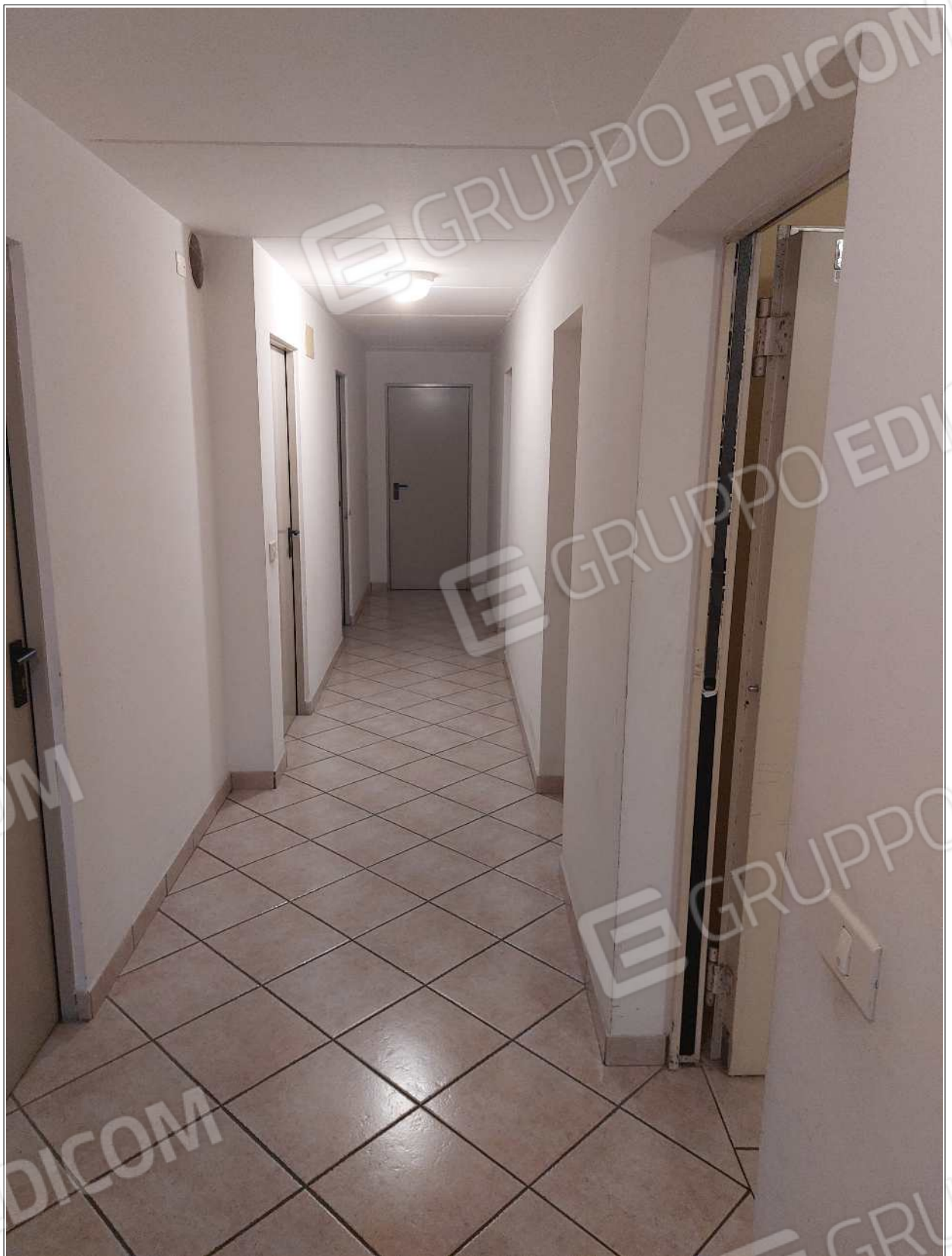
Foto n° 19 – 10/07/2023 - Comune di Brugnera, foglio 23, part.548 – Corridoio condominiale al piano interrato.