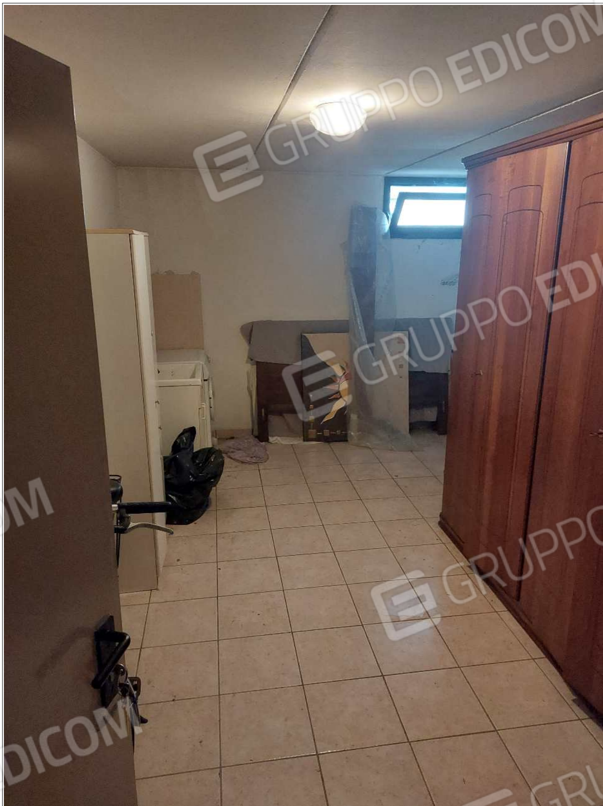
Foto n° 20 – 10/07/2023 - Comune di Brugnera, foglio 23, part.548, sub.74 – Cantina.