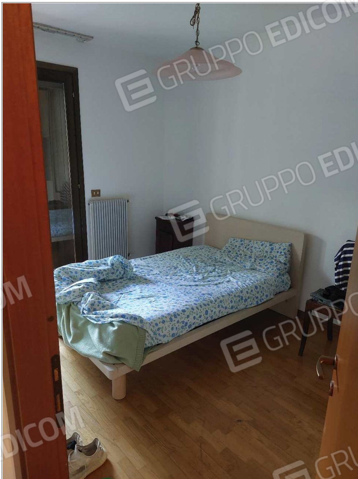
Foto n° 11 – 10/07/2023 - Comune di Brugnera, foglio 23, part.548, sub.11 – Camera.