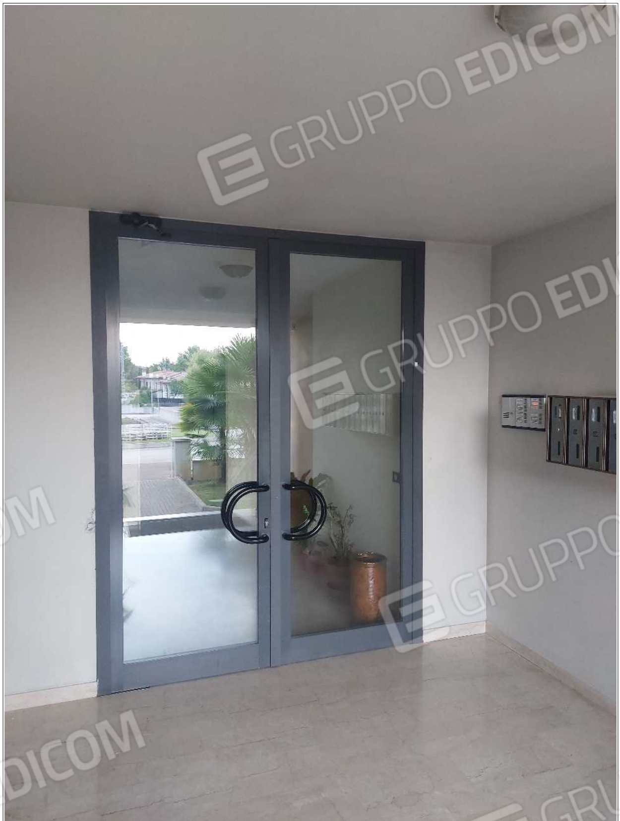
Foto n° 2 – 10/07/2023 - Comune di Brugnera, foglio 23, part.548 – Portone di accesso al condominio, scala B.