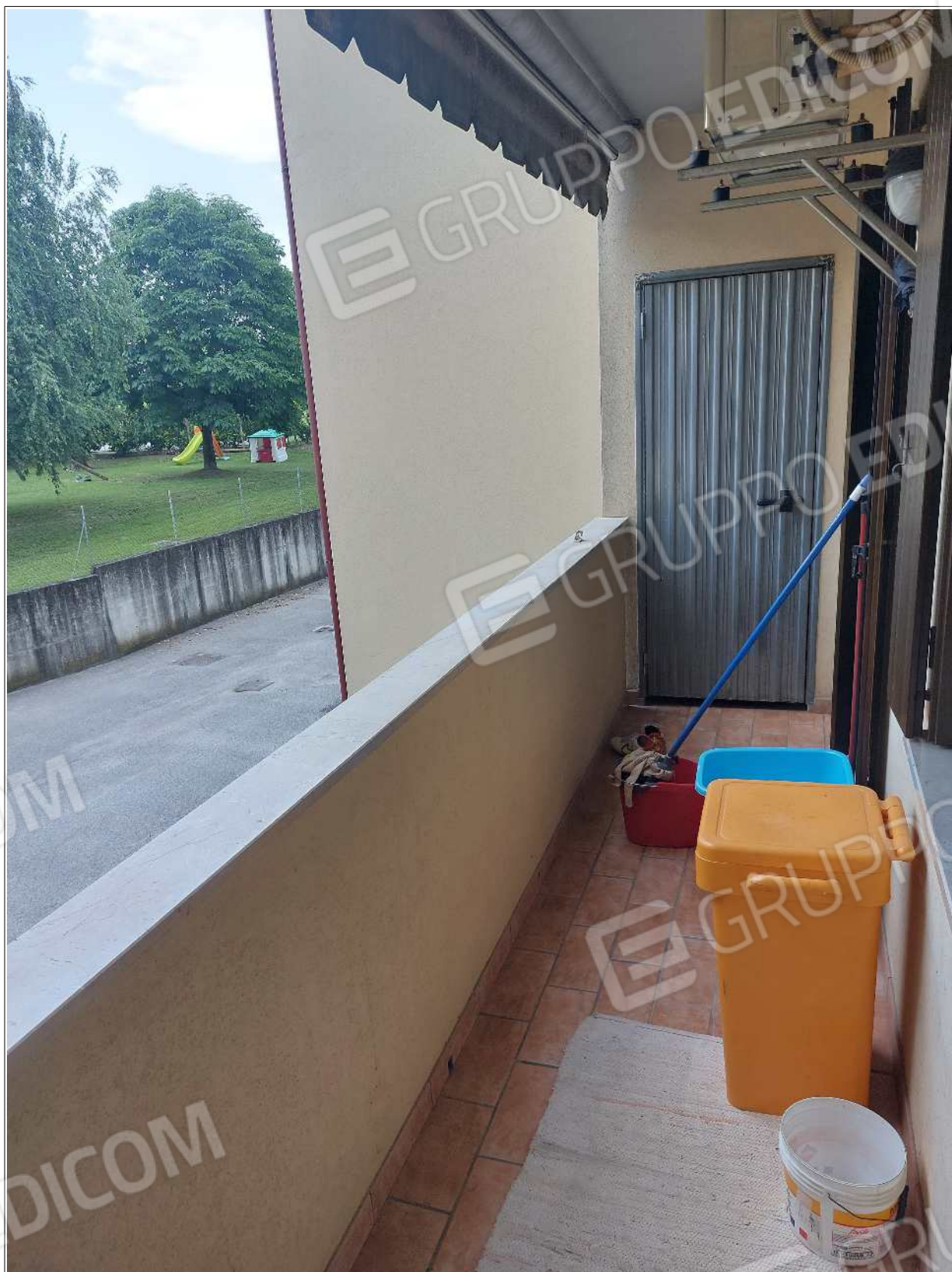
Foto n° 14 – 10/07/2023 - Comune di Brugnera, foglio 23, part.548, sub.11 – Terrazza.