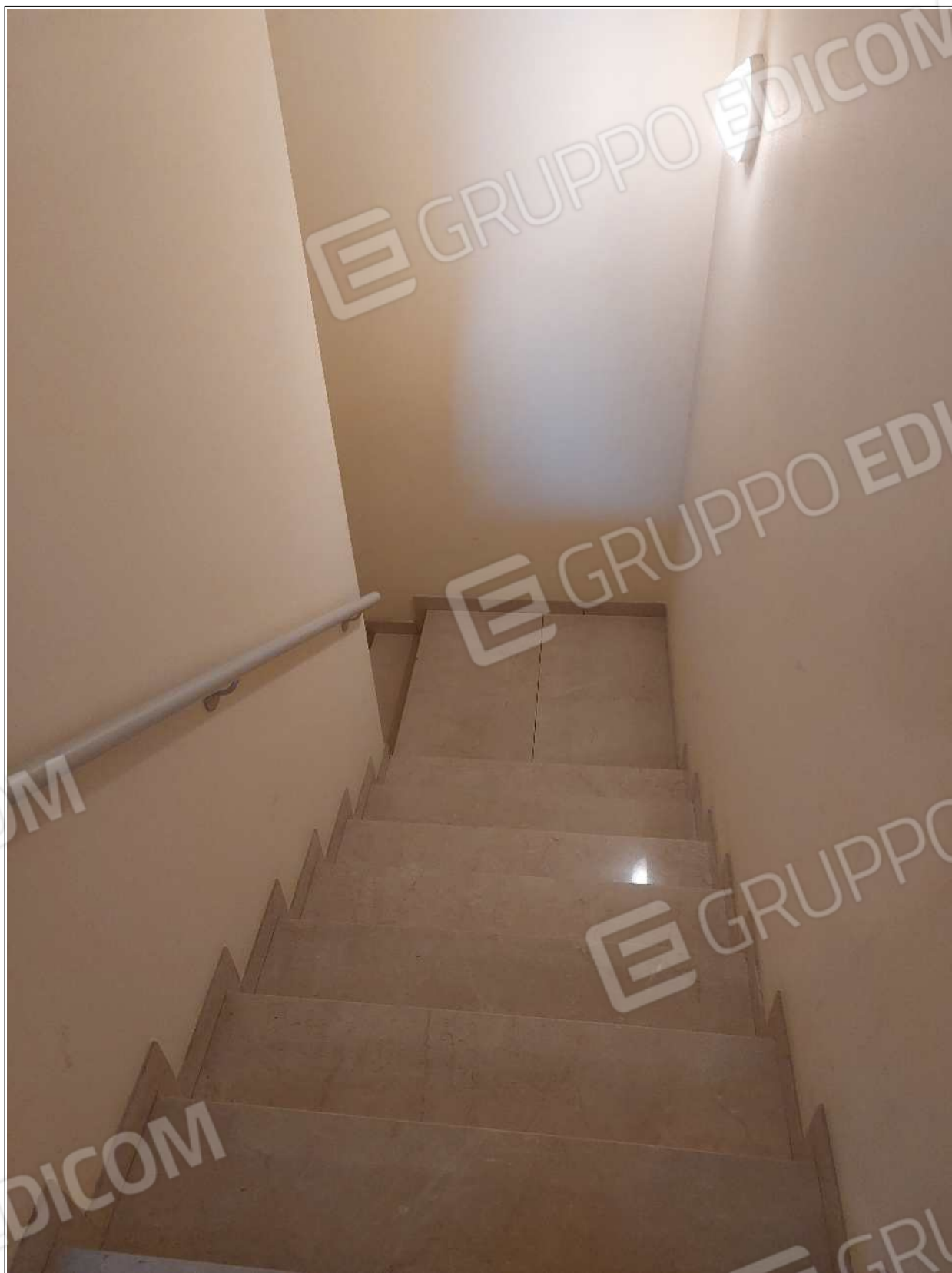
Foto n° 18 – 10/07/2023 - Comune di Brugnera, foglio 23, part.548 – Particolare del vano scale condominiale che conduce al piano interrato.