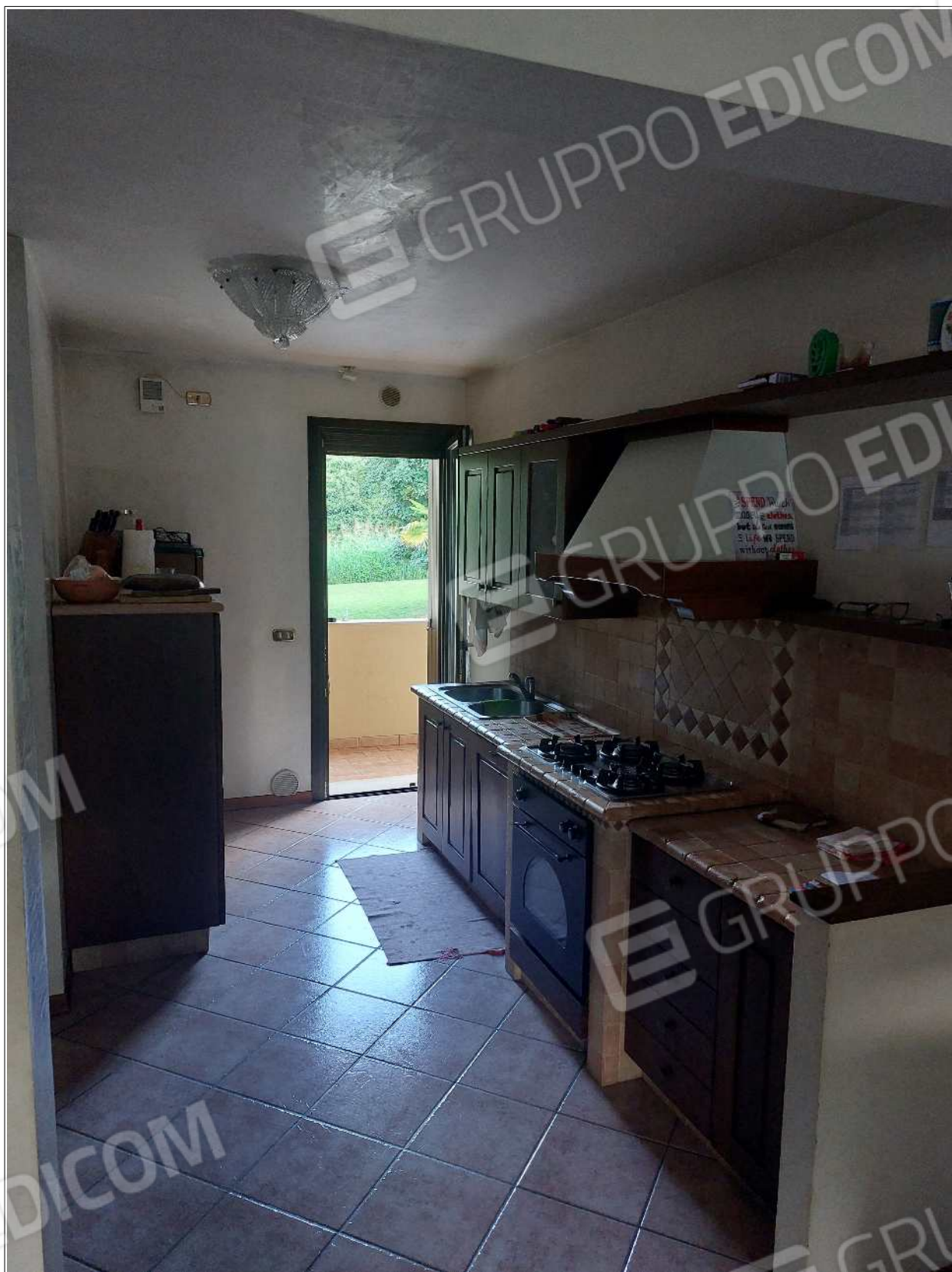
Foto n° 7 – 10/07/2023 - Comune di Brugnera, foglio 23, part.548, sub.11 – Cucina.