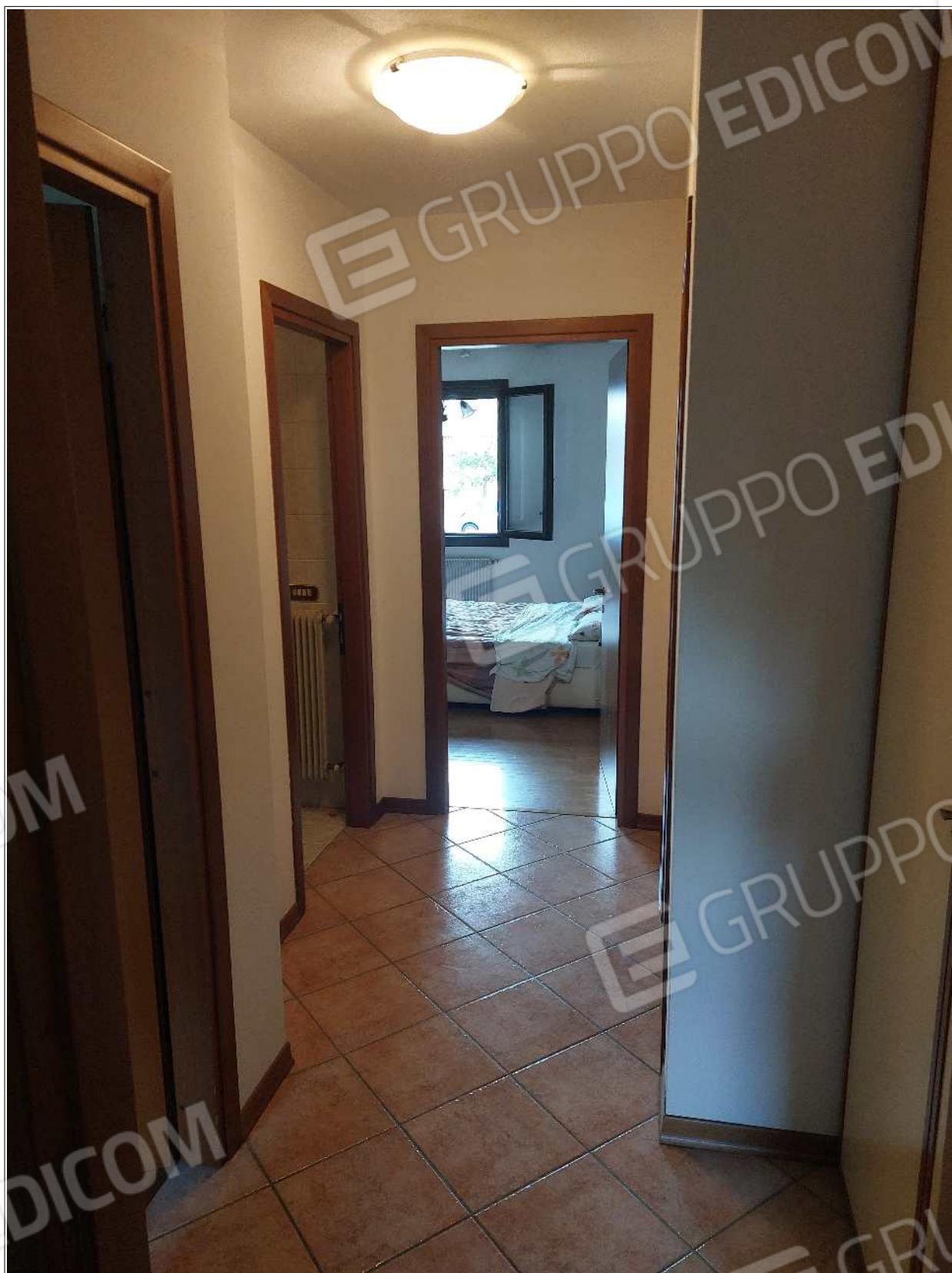
Foto n° 9 – 10/07/2023 - Comune di Brugnera, foglio 23, part.548, sub.11 – Disimpegno nel reparto notte.