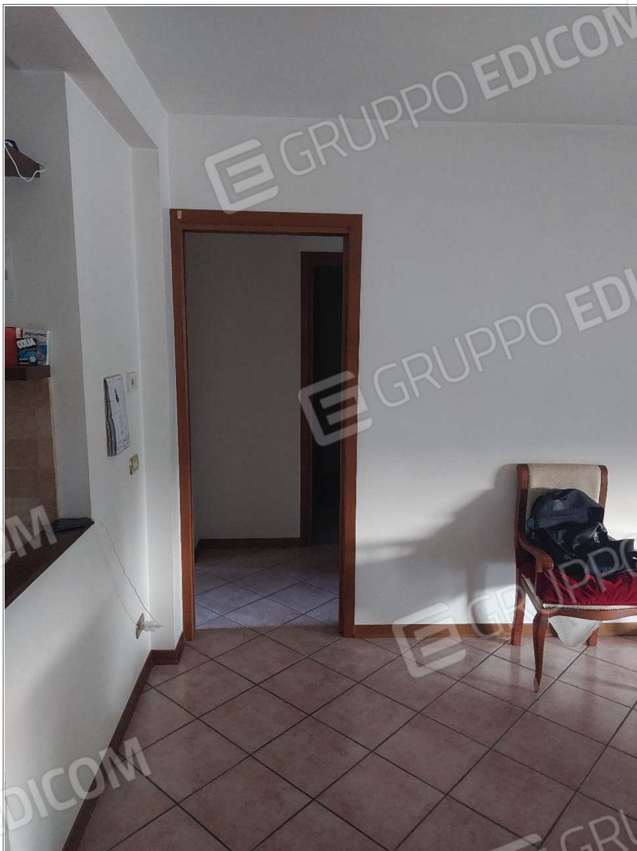
Foto n° 8 – 10/07/2023 - Comune di Brugnera, foglio 23, part.548, sub.11 – Porta di accesso al reparto notte.