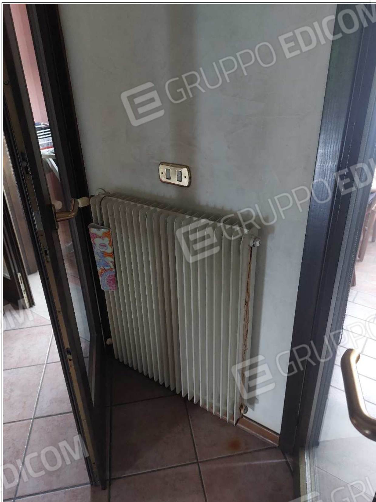
Foto n° 17 – 10/07/2023 - Comune di Brugnera, foglio 23, part.548, sub.11 – Particolare del soggiorno.