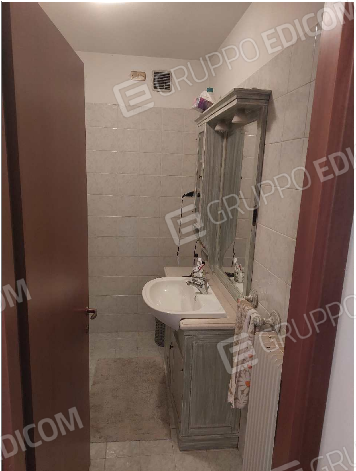
Foto n° 13 – 10/07/2023 - Comune di Brugnera, foglio 23, part.548, sub.11 – Bagno.