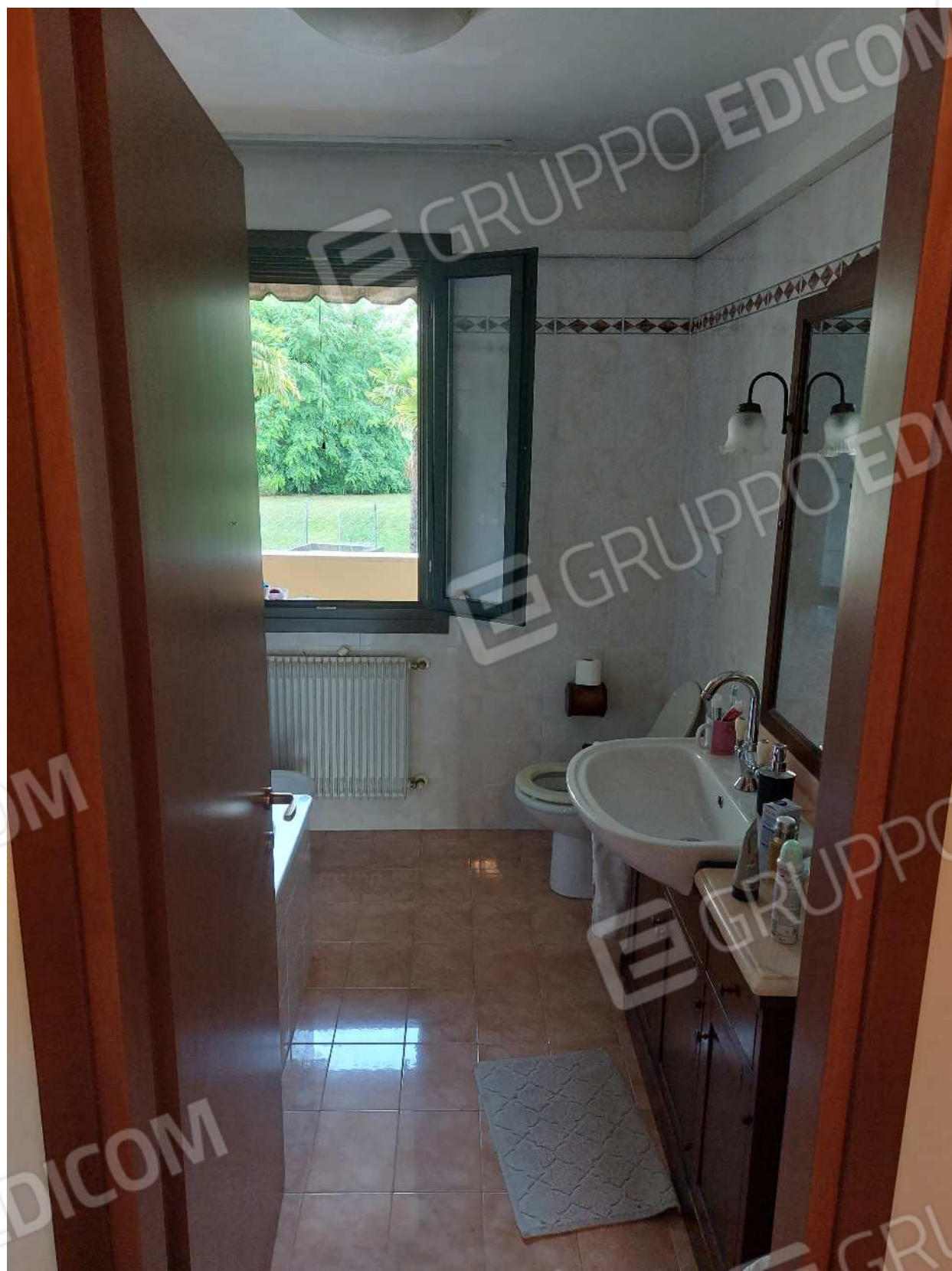
Foto n° 12 – 10/07/2023 - Comune di Brugnera, foglio 23, part.548, sub.11 – Bagno principale.