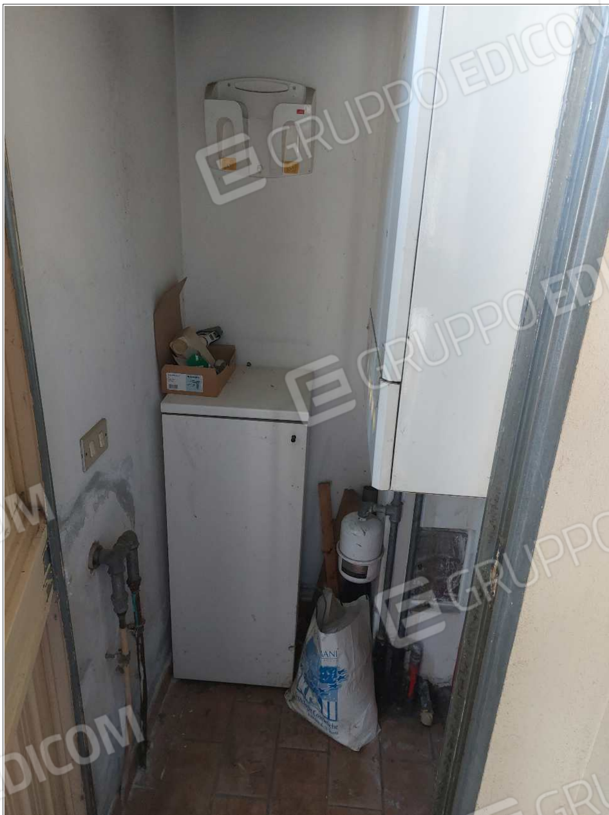
Foto n° 15 – 10/07/2023 - Comune di Brugnera, foglio 23, part.548, sub.11 – Vano caldaia.