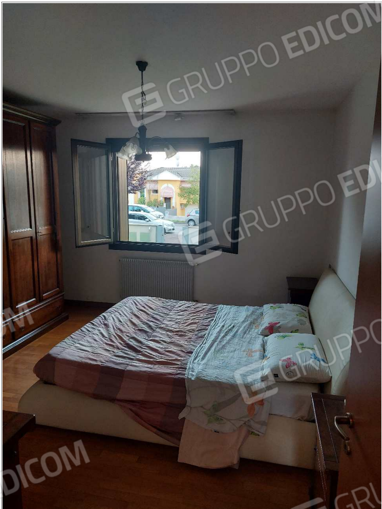
Foto n° 10 – 10/07/2023 - Comune di Brugnera, foglio 23, part.548, sub.11 – Camera matrimoniale.