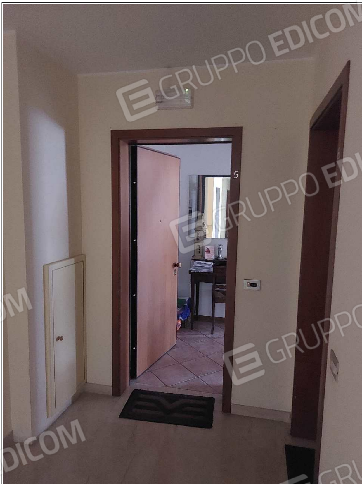
Foto n° 3 – 10/07/2023 - Comune di Brugnera, foglio 23, part.548, sub.11 – Porta di accesso all'appartamento pignorato.