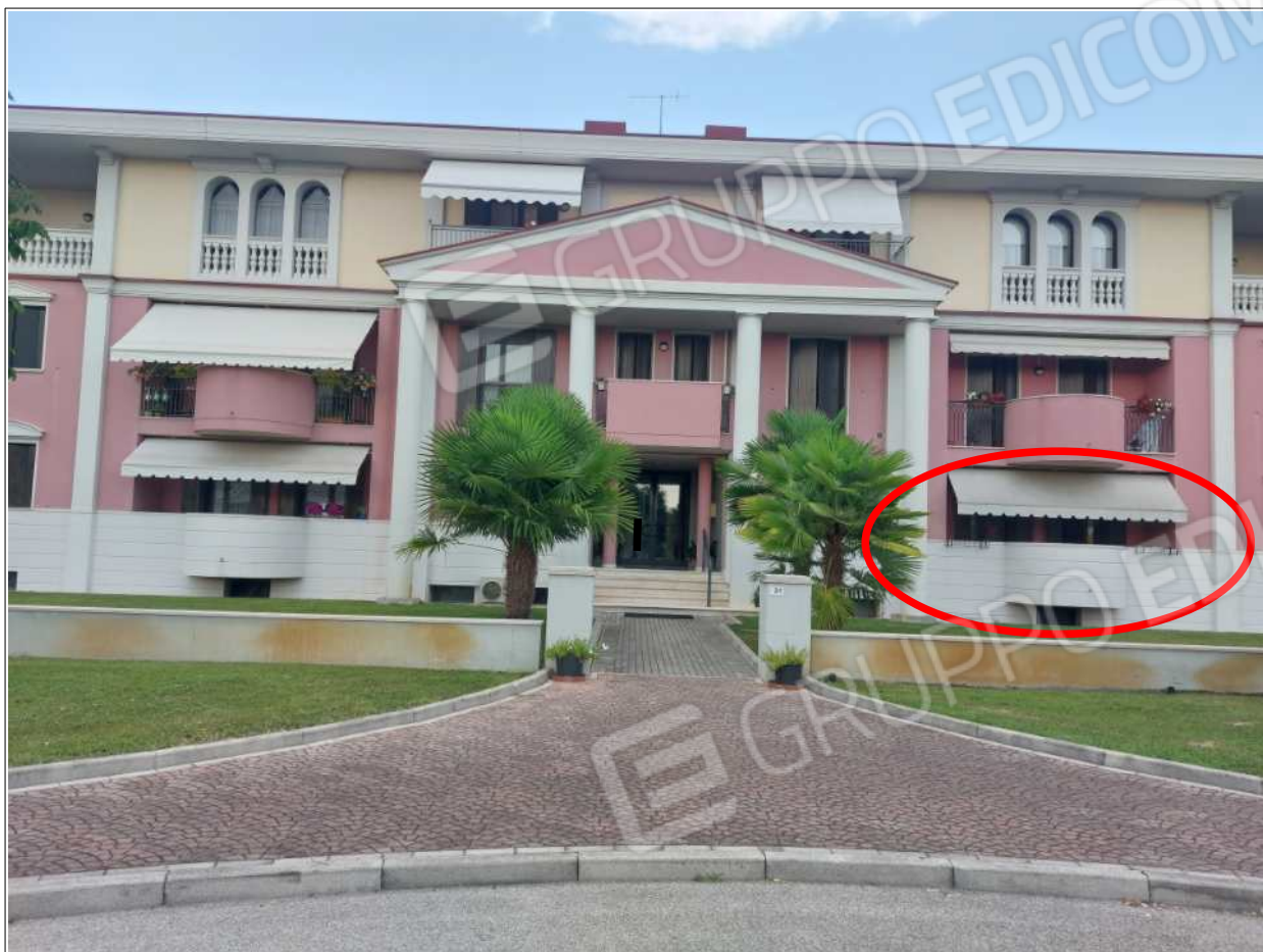
Foto n° 1 – 10/07/2023 - Comune di Brugnera, foglio 23, part.548 – Visione esterna del "Condominio Villa Brugnera". Cerchiato in rosso l'immobile pignorato.