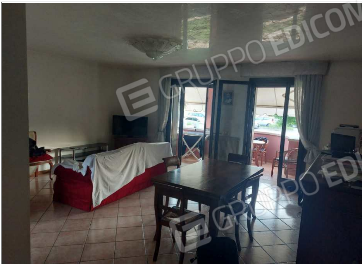
Foto n° 5 – 10/07/2023 - Comune di Brugnera, foglio 23, part.548, sub.11 – Soggiorno.