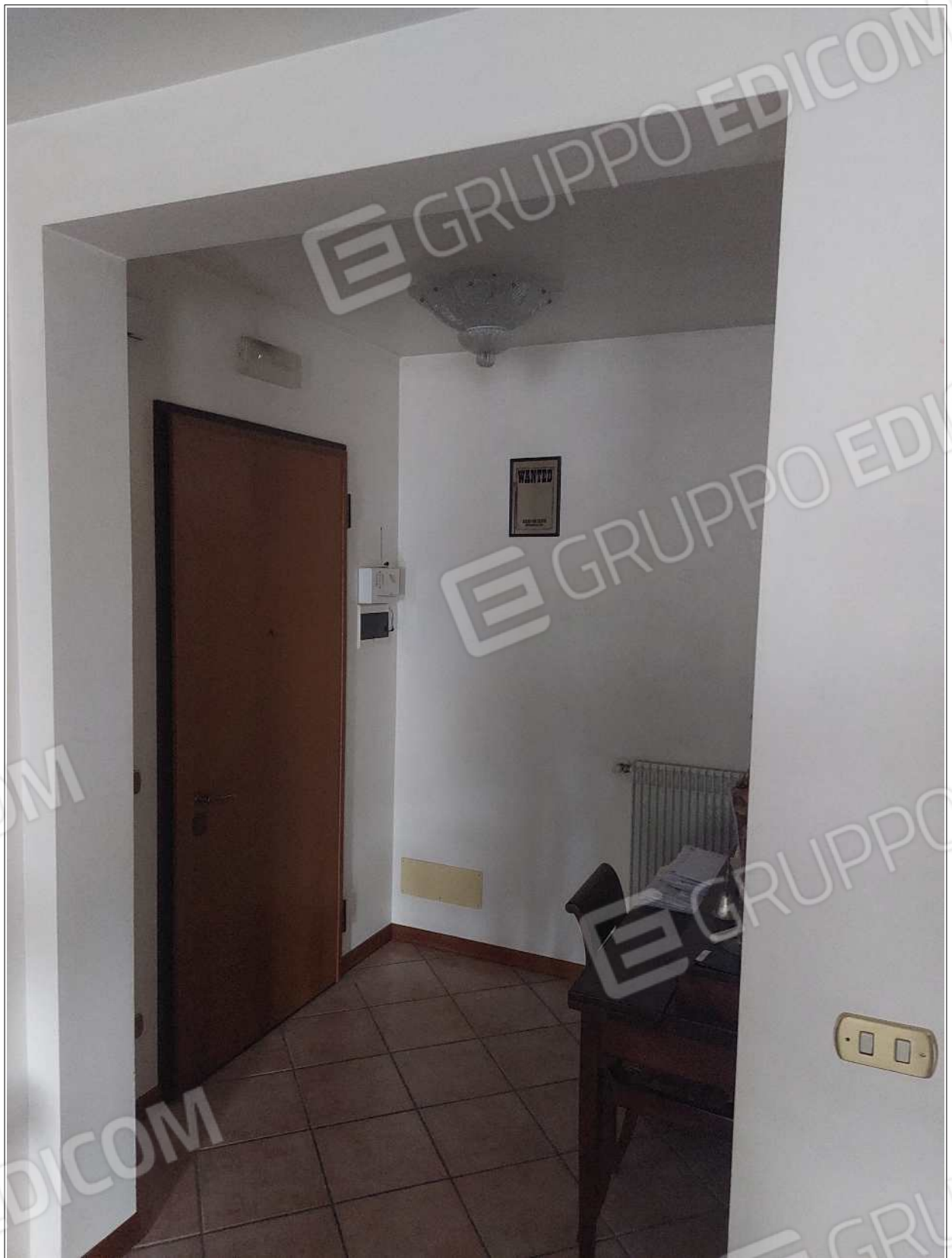
Foto n° 4 – 10/07/2023 - Comune di Brugnera, foglio 23, part.548, sub.11 – Entrata.