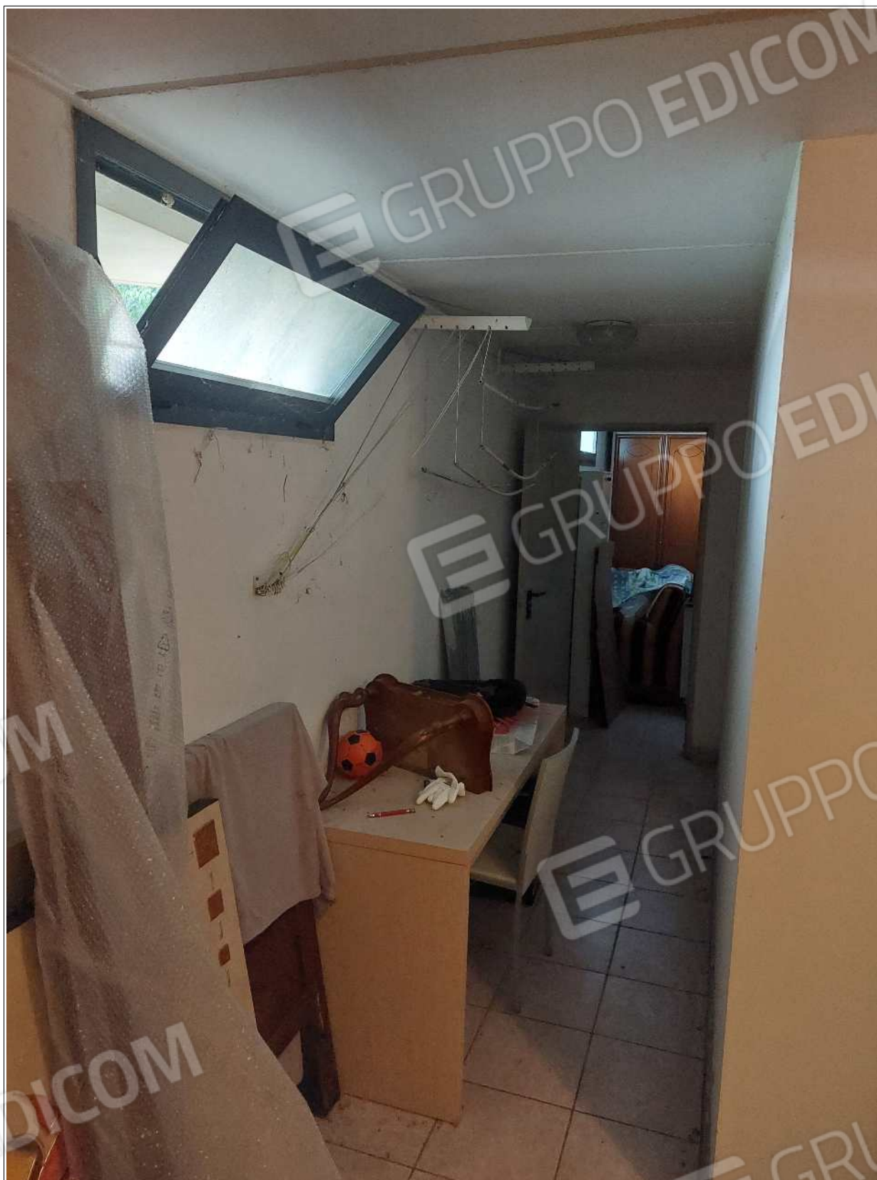
Foto n° 21 – 10/07/2023 - Comune di Brugnera, foglio 23, part.548, sub.74 – Cantina. Visibile la porta che conduce all'autorimessa.