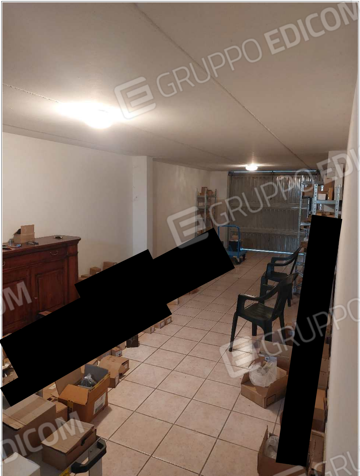
Foto n° 22 – 10/07/2023 - Comune di Brugnera, foglio 23, part.548, sub.46 – Autorimessa.