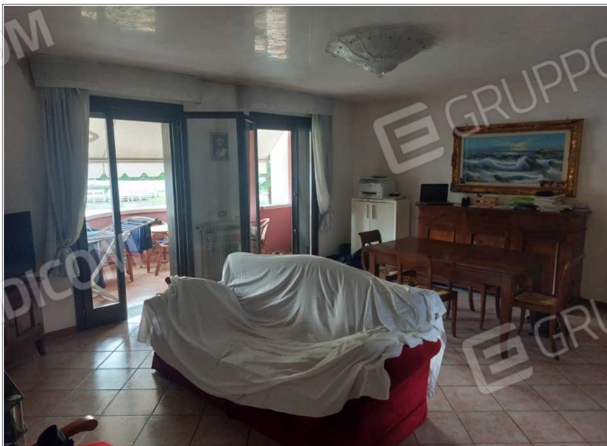
Foto n° 6 – 10/07/2023 - Comune di Brugnera, foglio 23, part.548, sub.11 – Soggiorno.