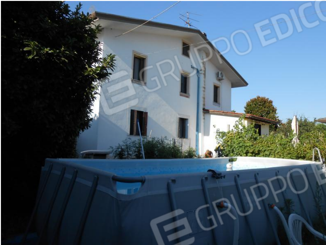
Veduta del fabbricato abitazione dallo scoperto