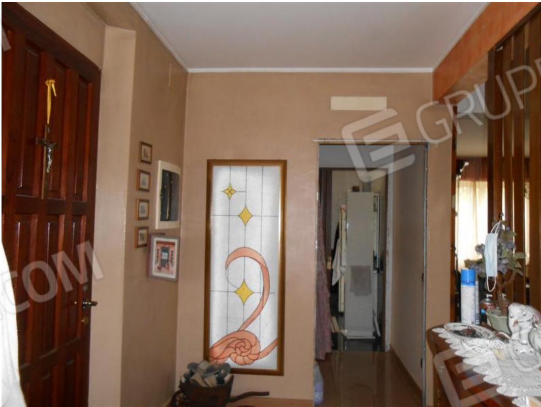
Veduta antibagno dall'ingresso