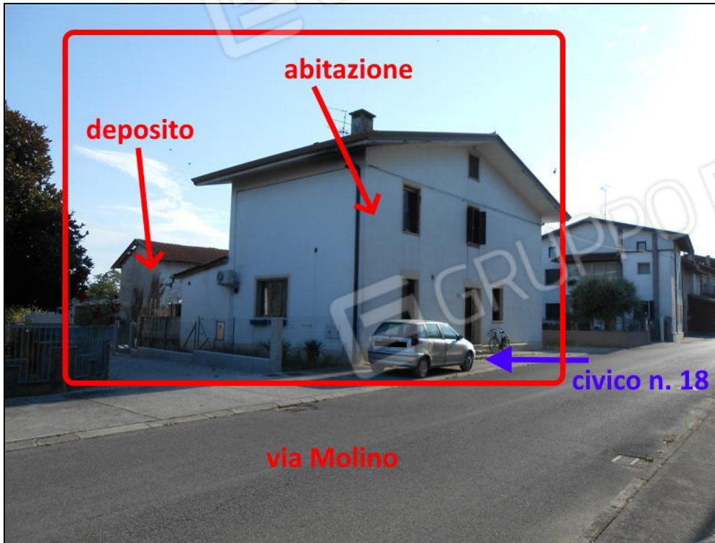
Veduta del complesso pignorato dalla strada via Molino

la documentazione fotografica dettagliata è riportata negli allegati alla relazione peritale: ALL. 5.1.1, ALL. 5.1.2, ALL. 5.1.3, ALL. 5.1.4, ALL. 5.1.5