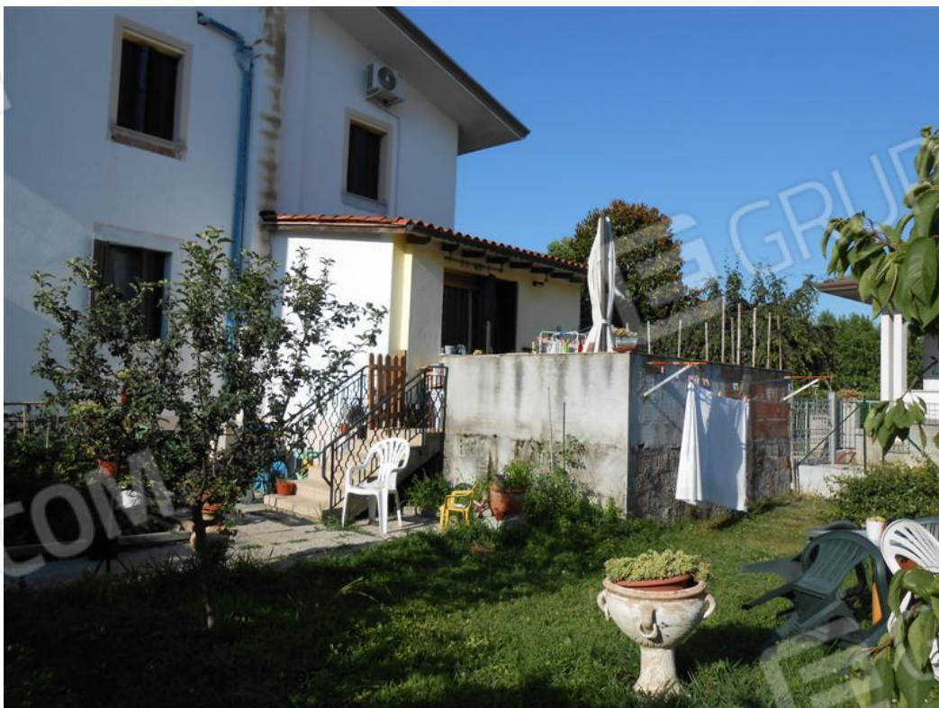
Veduta dell'abitazione e della terrazza comunicante con lo scoperto