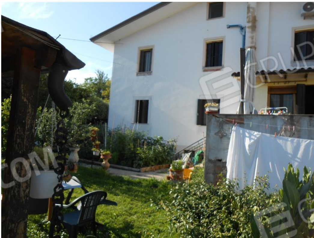
Veduta dello scoperto