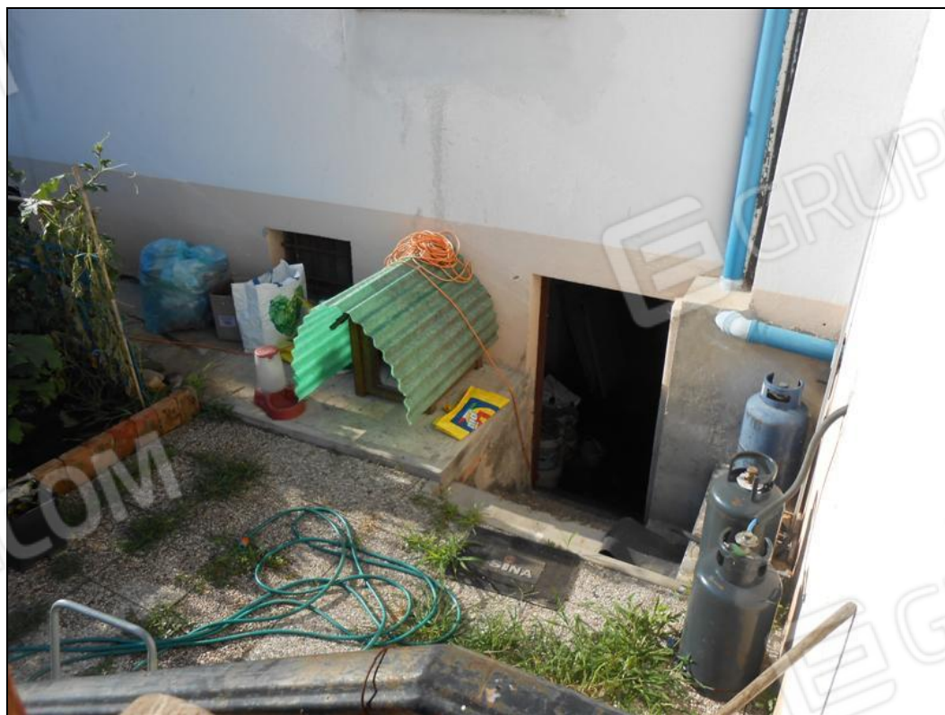
Scala di comunicazione con lo scoperto