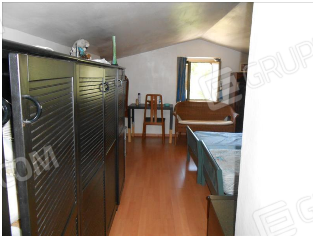
Soffitta – locale centrale