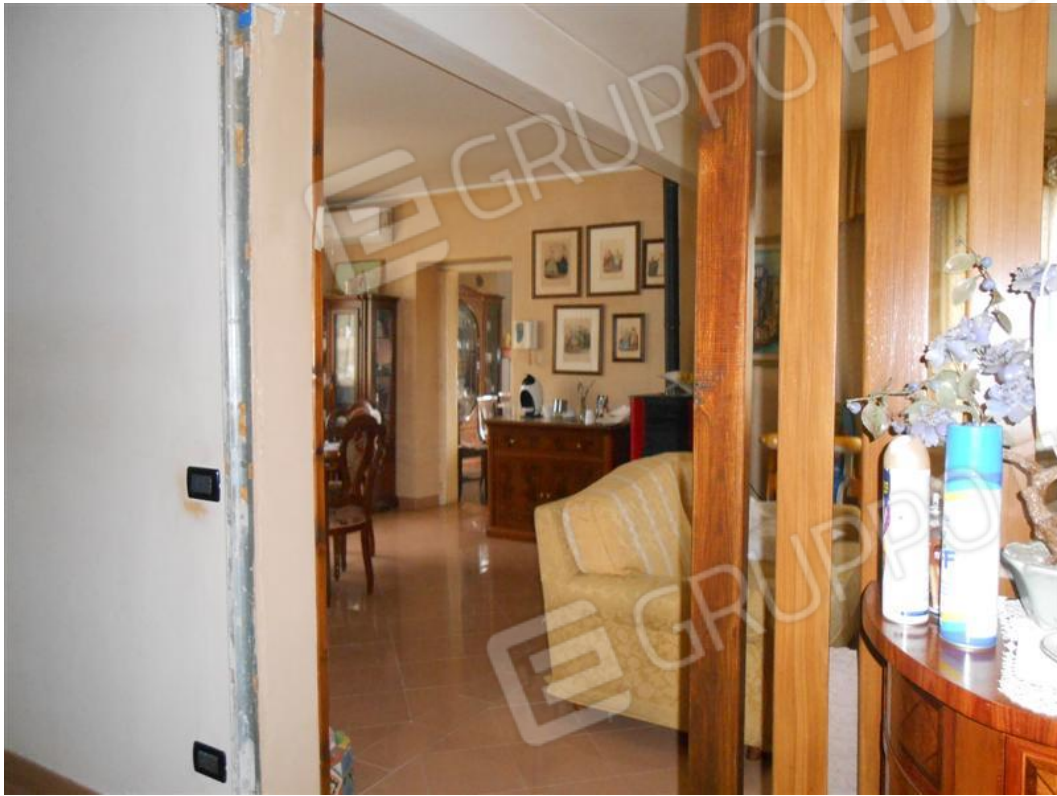
Ingresso e veduta soggiorno