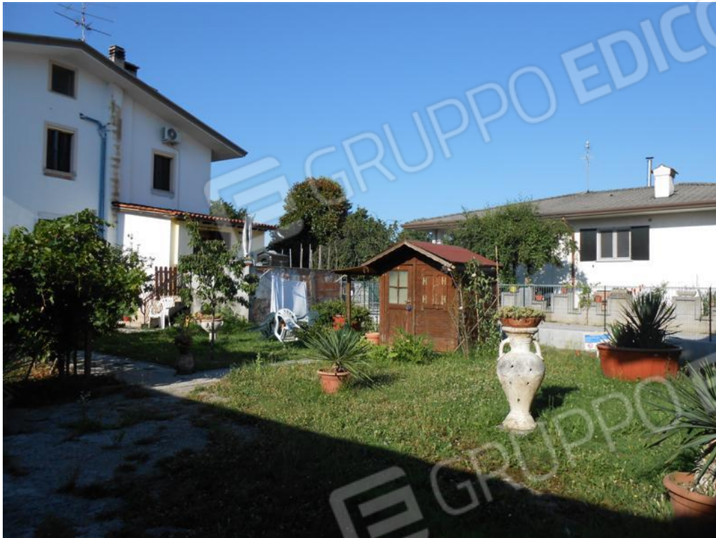
Veduta dello scoperto