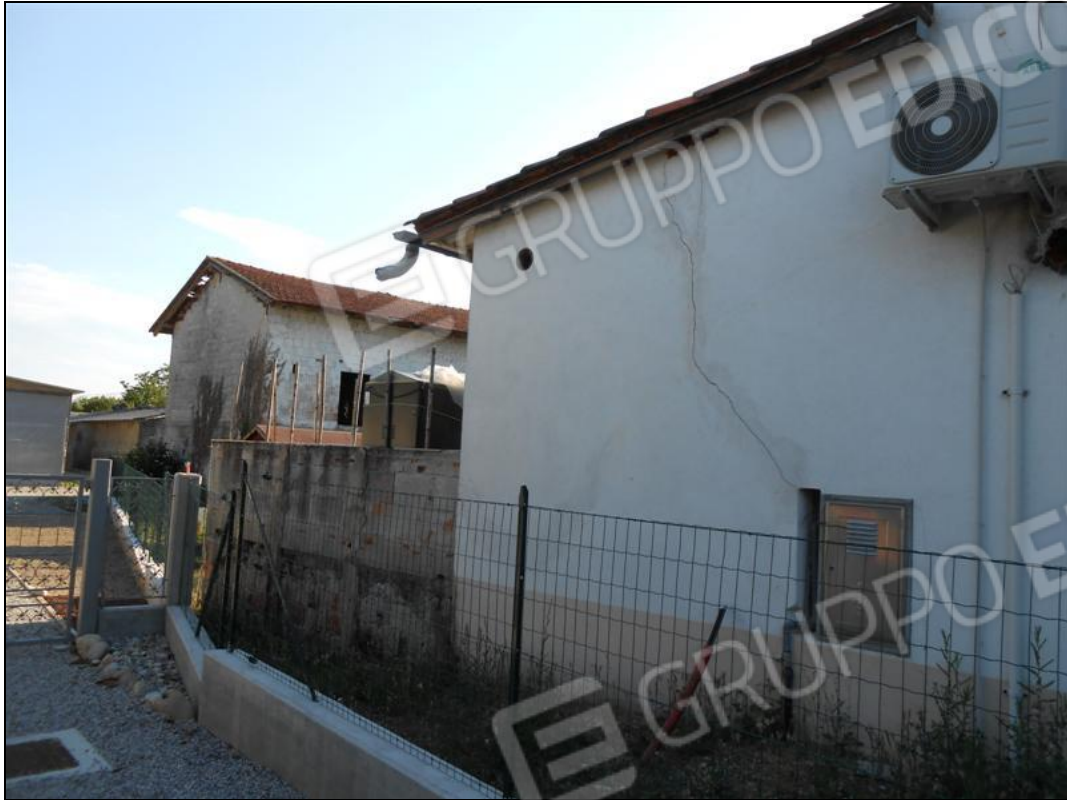
Recinzione sul lato est del complesso e veduta del fabbricato deposito