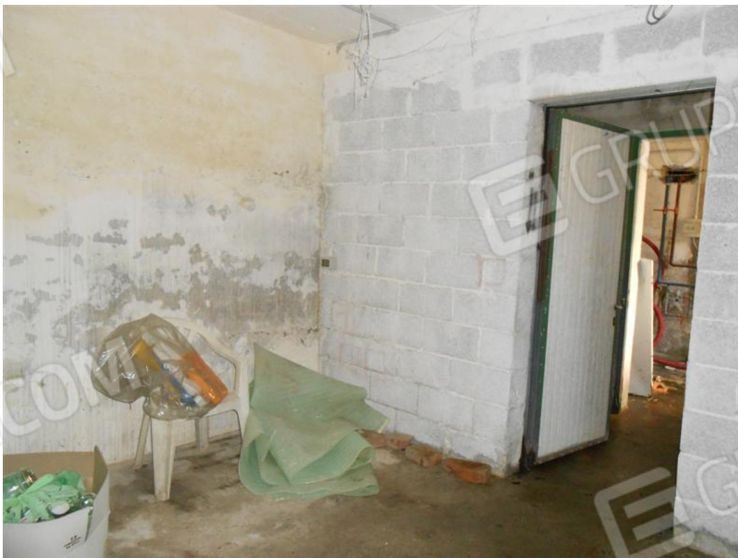
Cantina e disimpegno