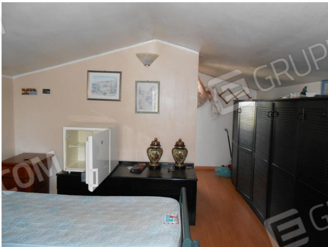
Soffitta – locale centrale