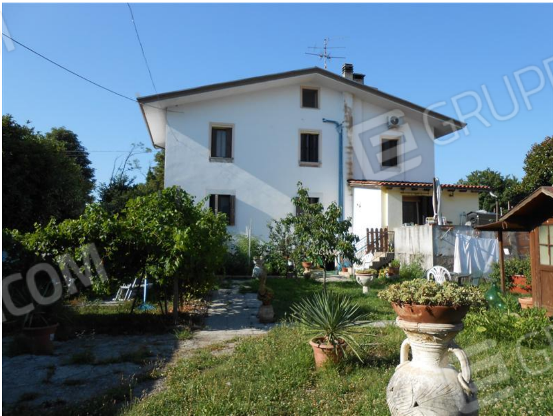
Fronte sud del fabbricato abitazione e veduta dello scoperto