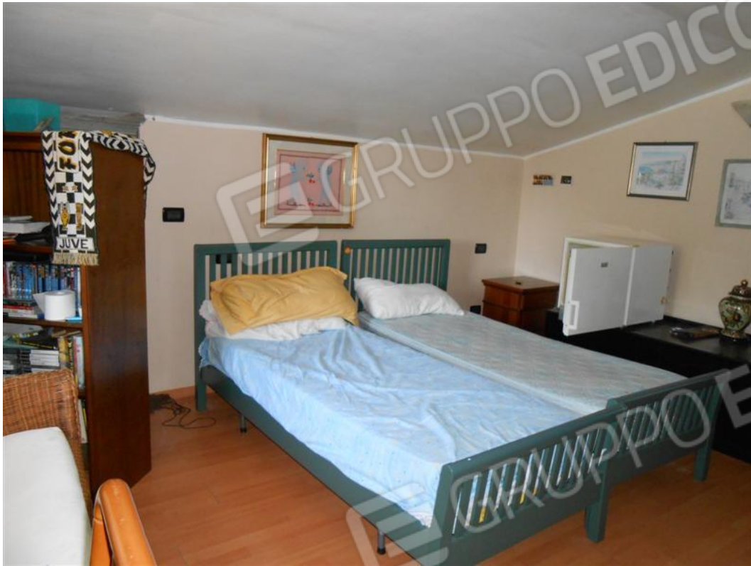
Soffitta – locale centrale