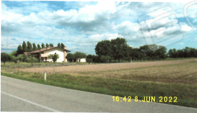
F.24, mapp. 63