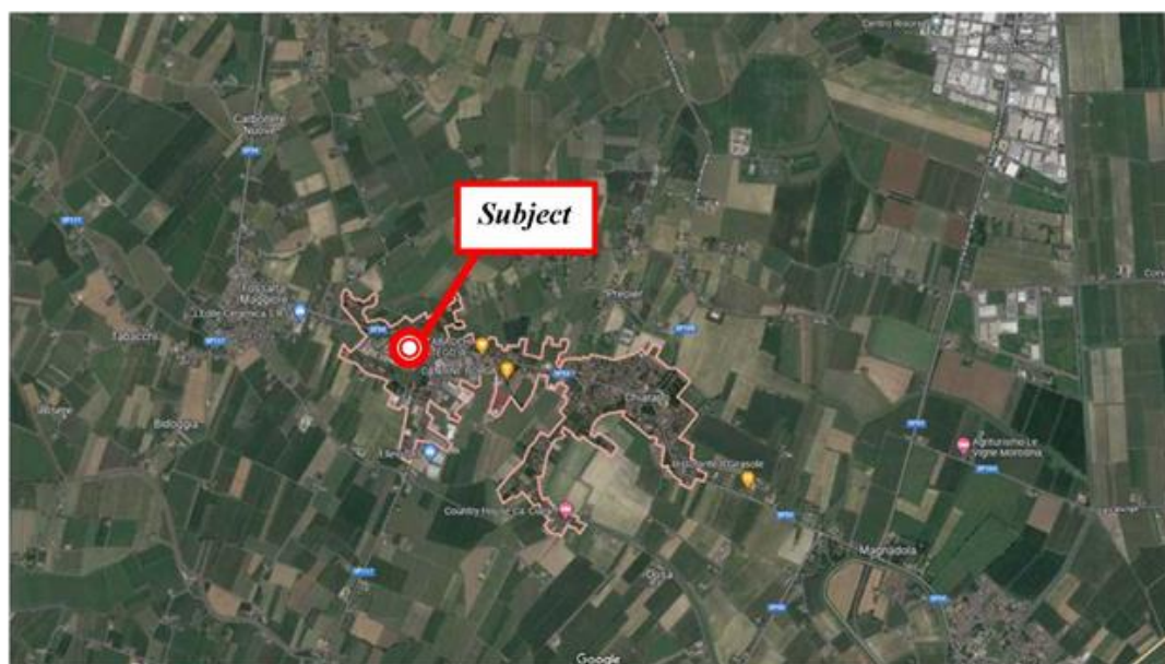
Vista aerea: Comune di Chiarano (TV)

Viste satellitari con indicazione dell'immobile oggetto di valutazione.