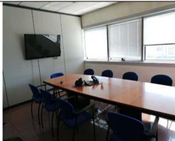
Vista locali interni area uffici