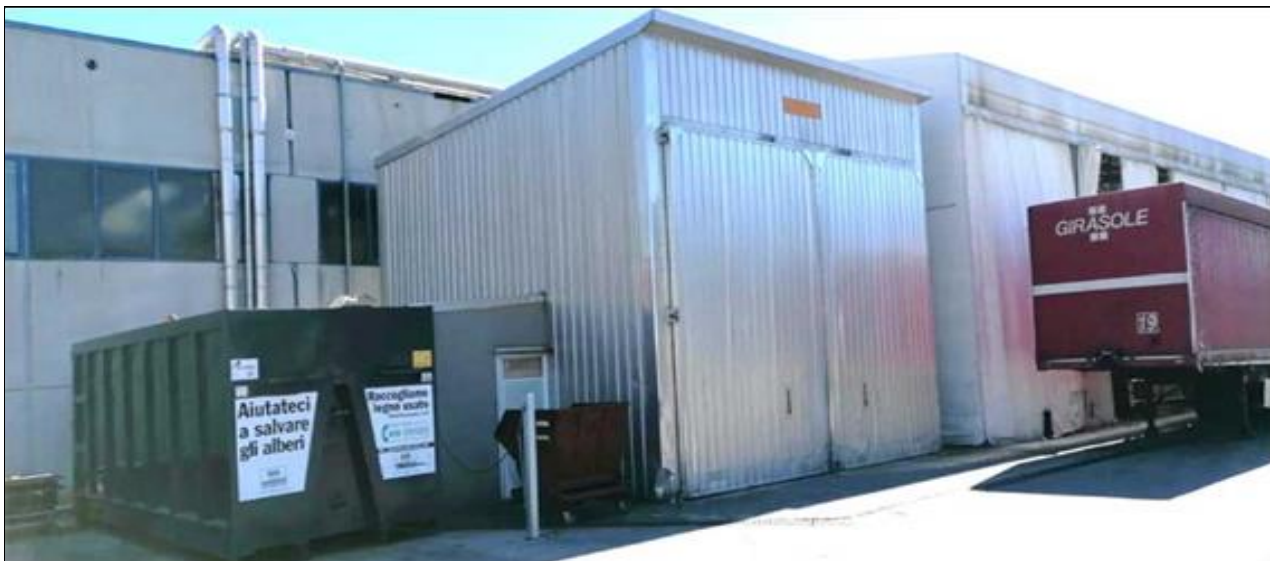
Esterno - Vista manufatto uso essiccatoio