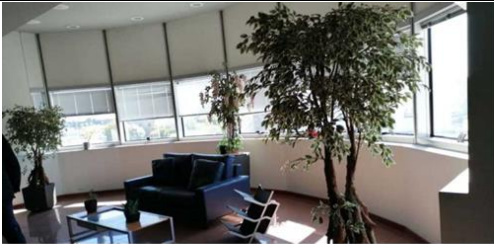
Vista locali interni area uffici

TERMINE PRESENTAZIONE OFFERTA: MERCOLEDÌ 06/11/2024 ORE 11:15