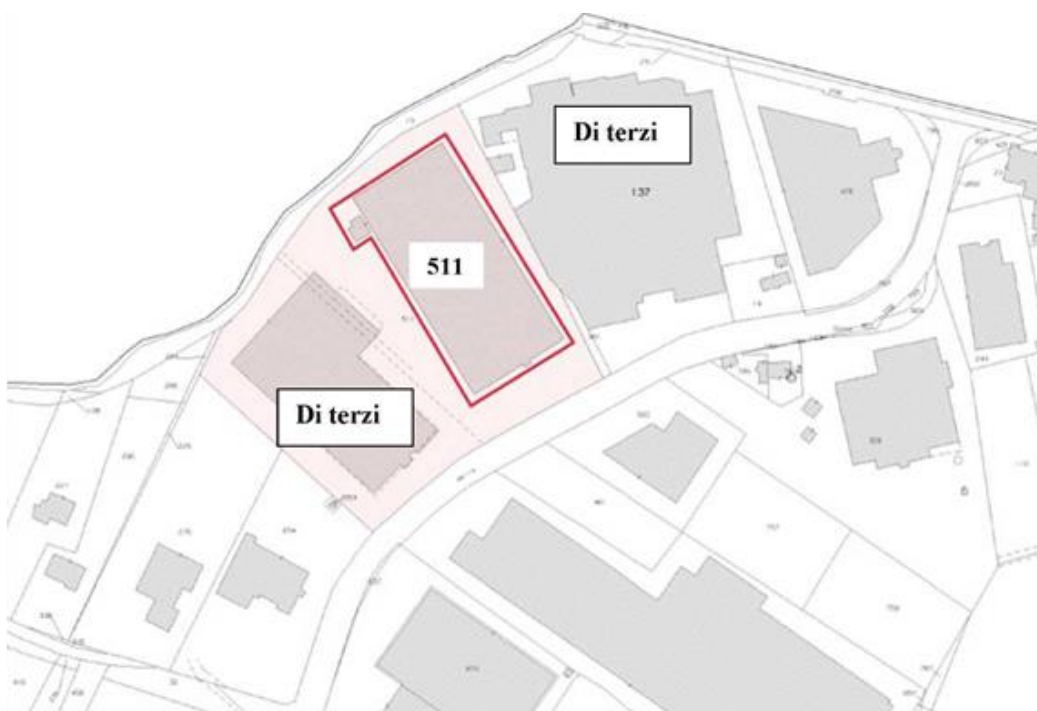
Chiarano (TV), fg. 7 part. 511 - Estratto di mappa (allegato 2.1)

Il fabbricato in oggetto è sito nella zona industriale del Comune di Chiarano (TV) in Via Vittorio Veneto n. 6 con un'area esterna comune al mapp. 511 subb. 8-9-10-11 di terzi, per cui manca una superficie scoperta ad uso esclusivo.