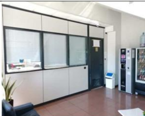
Vista locali interni area uffici