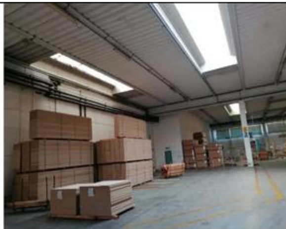
Vista locali interni area produttiva