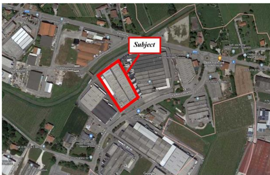
Vista aerea: Comune di Chiarano (TV)