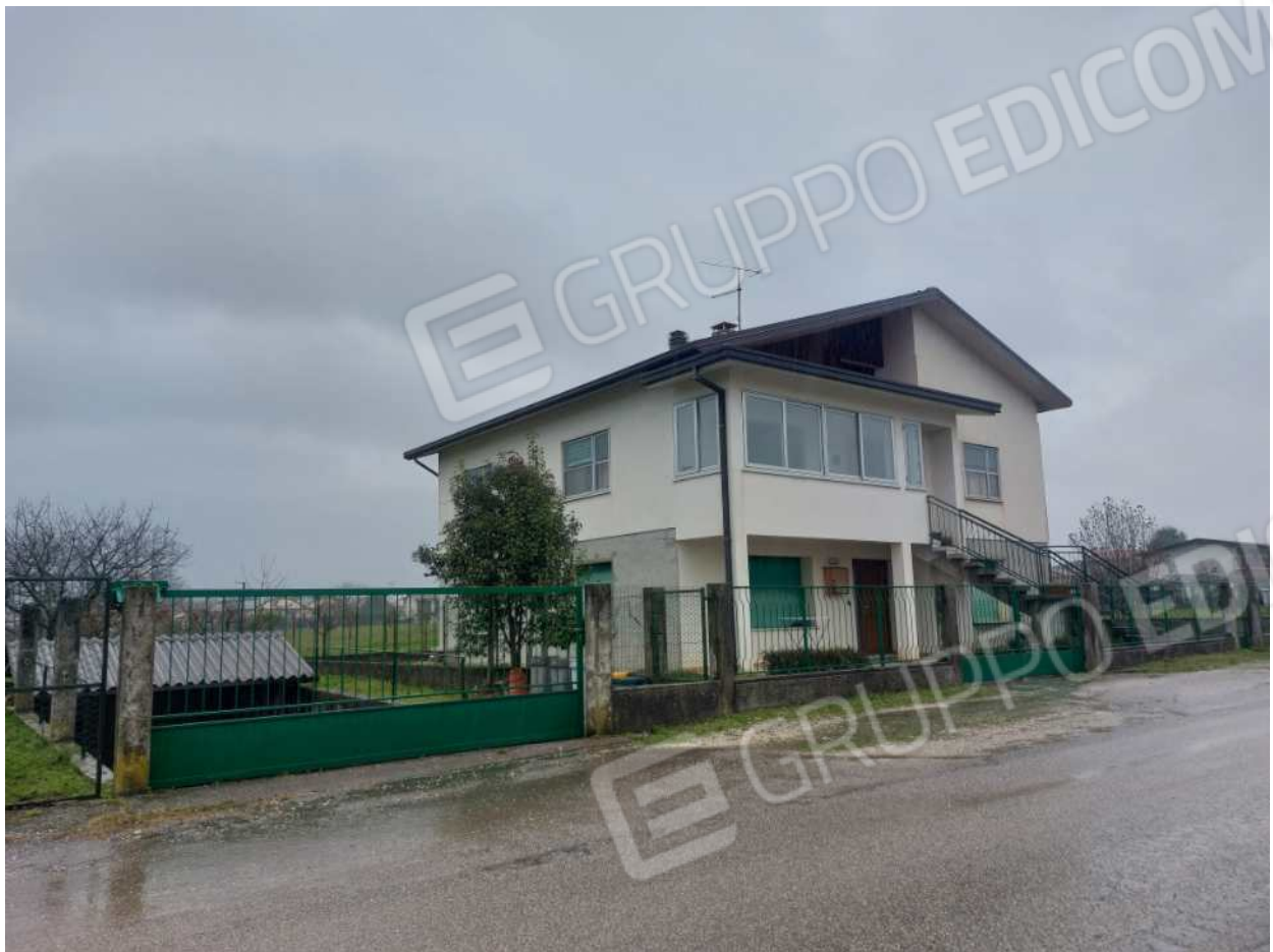
Foto n° 1 – 01/03/2024 - Comune di Aviano, foglio 55, part.384 – Visione esterna dell'abitazione pignorata (Piano 1-2).