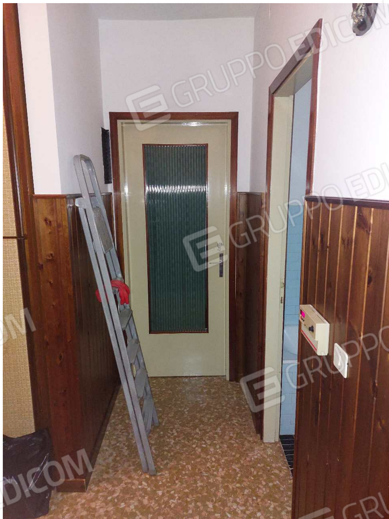
Foto n° 8 – 01/03/2024 - Comune di Aviano, foglio 55, part.384, sub.4 – Corridoio.