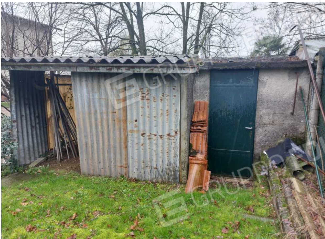
Foto n° 21 – 01/03/2024 - Comune di Aviano, foglio 55, part.413 – Magazzino/legnaia.