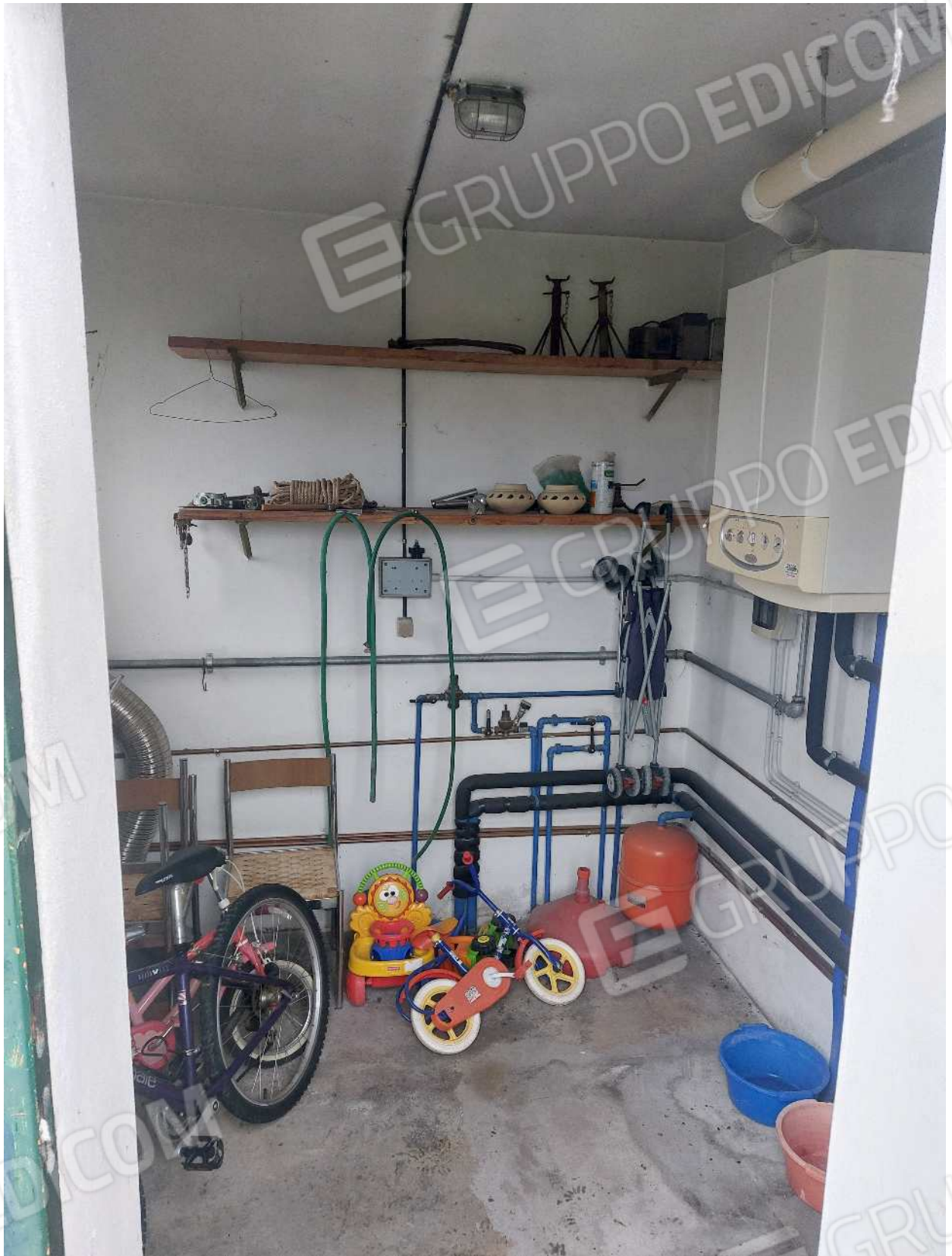
Foto n° 19 – 01/03/2024 - Comune di Aviano, foglio 55, part.384, sub.7 – Centrale termica.