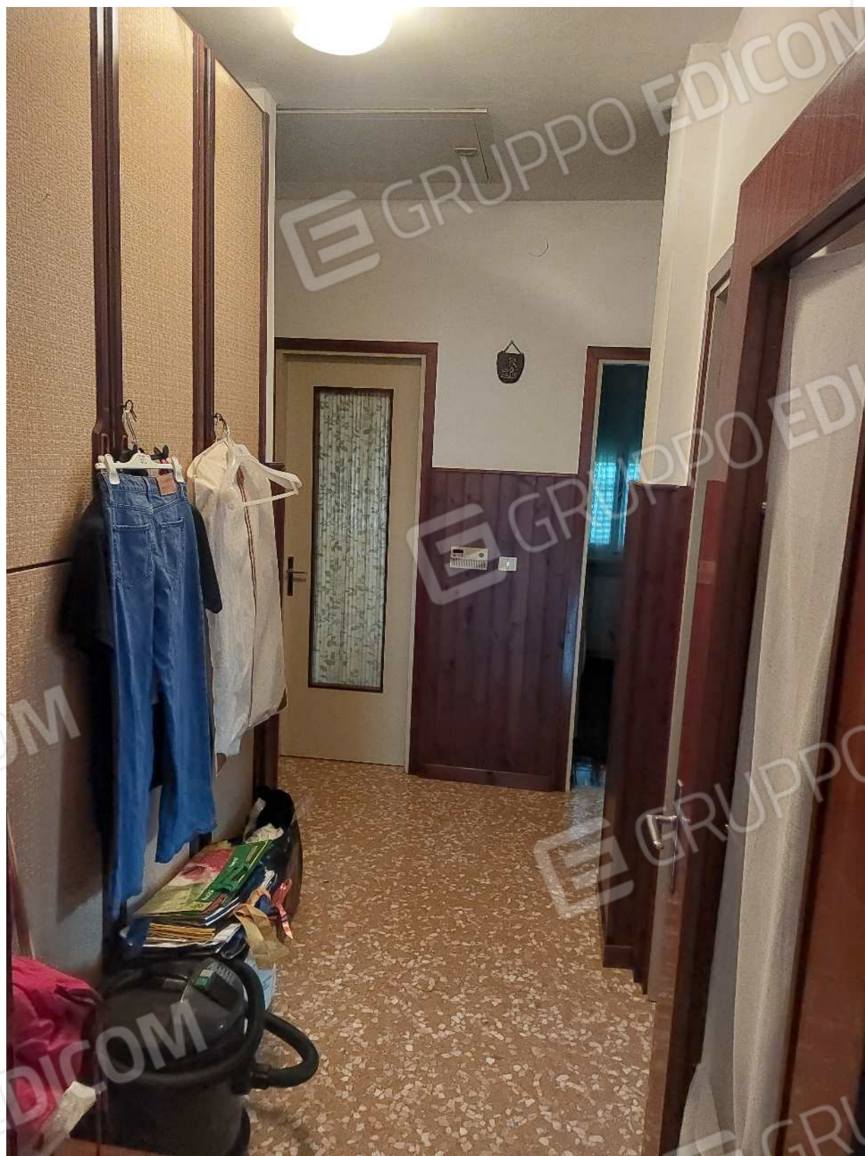
Foto n° 7 – 01/03/2024 - Comune di Aviano, foglio 55, part.384, sub.4 – Corridoio.