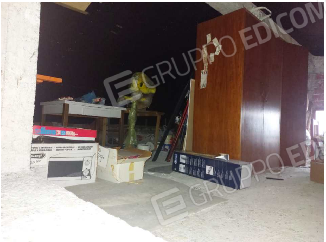
Foto n° 16 – 01/03/2024 - Comune di Aviano, foglio 55, part.384, sub.4 – Soffitta.