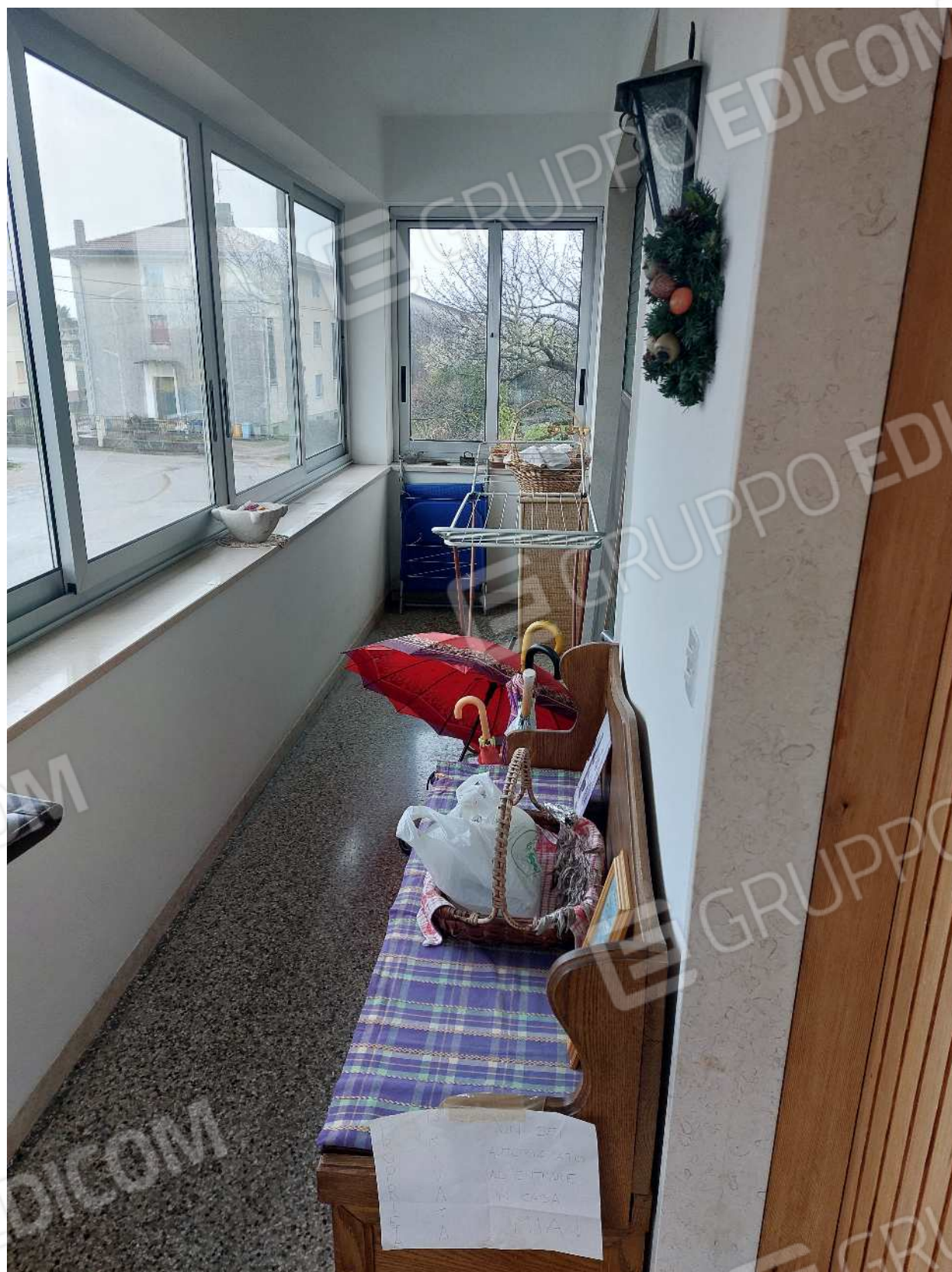
Foto n° 18 – 01/03/2024 - Comune di Aviano, foglio 55, part.384, sub.4 – Balcone.