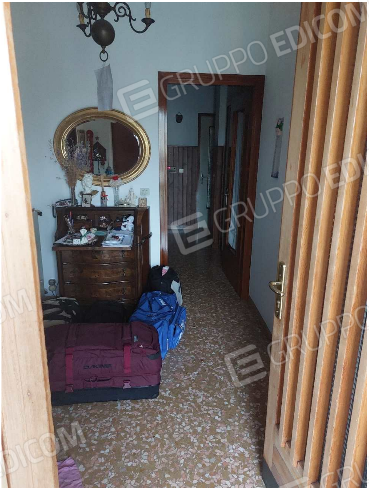
Foto n° 4 – 01/03/2024 - Comune di Aviano, foglio 55, part.384, sub.4 – Disimpegno.