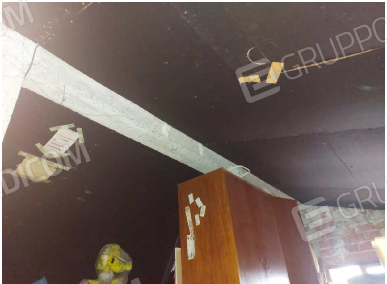
Foto n° 17 – 01/03/2024 - Comune di Aviano, foglio 55, part.384, sub.4 – Soffitta.