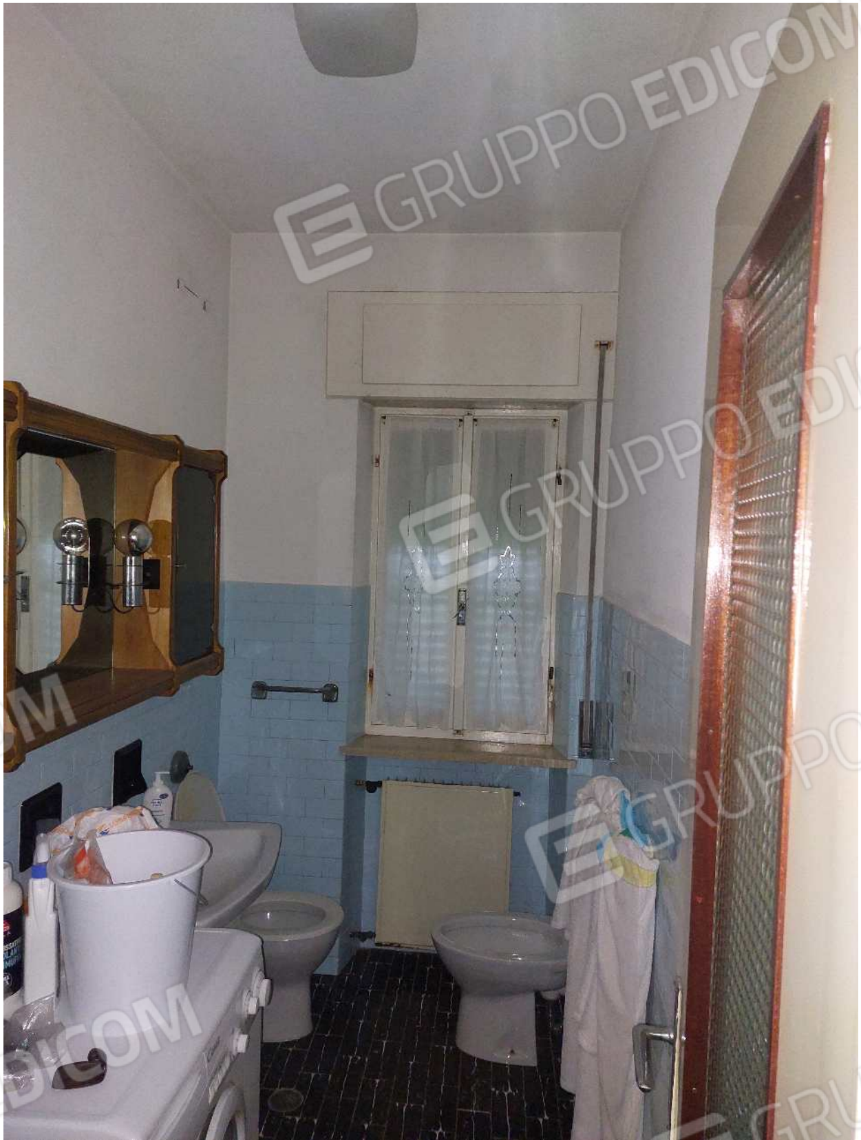
Foto n° 10 – 01/03/2024 - Comune di Aviano, foglio 55, part.384, sub.4 – Lavanderia.