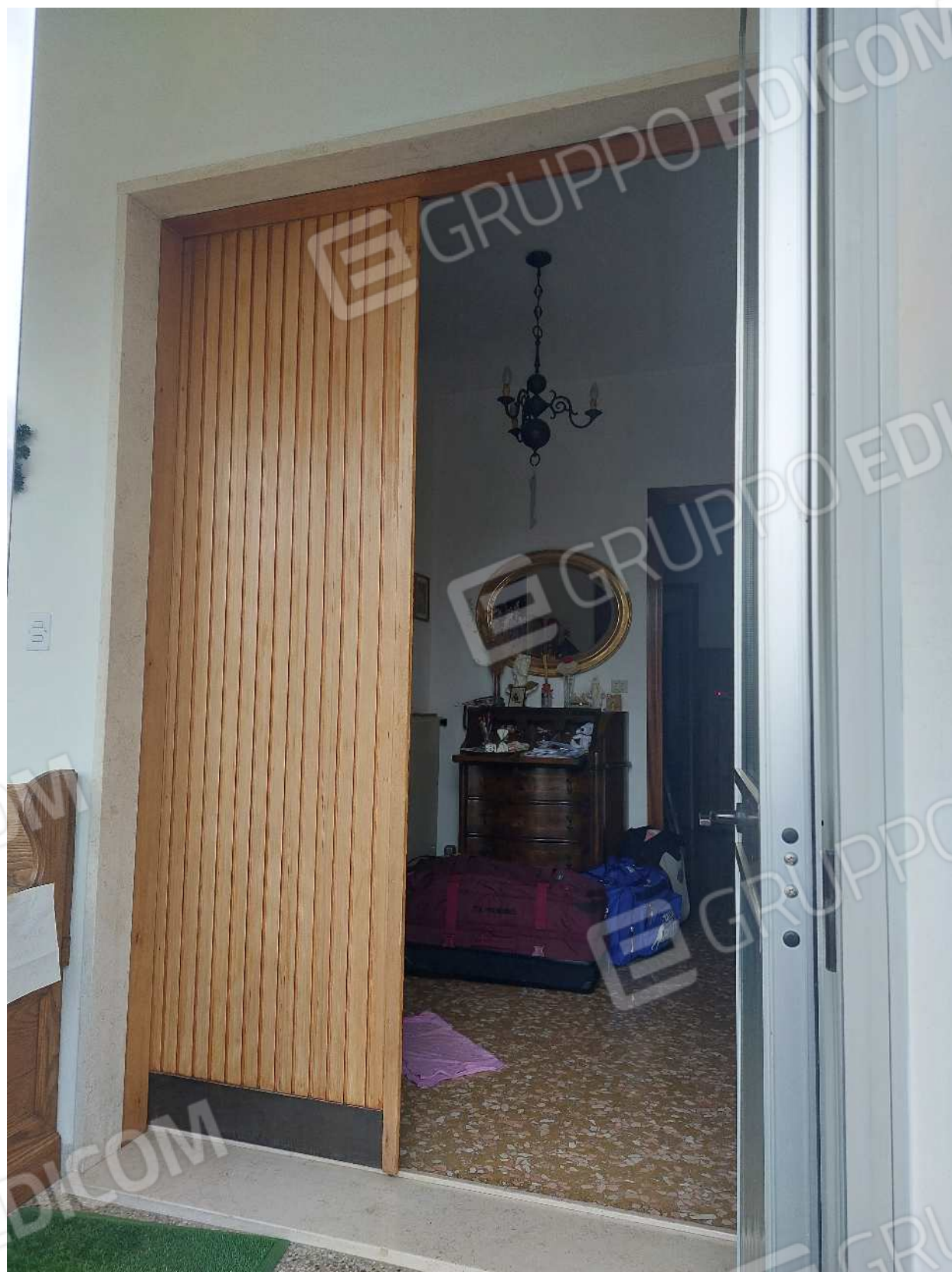
Foto n° 3 – 01/03/2024 - Comune di Aviano, foglio 55, part.384, sub.4 – Porta d'accesso.