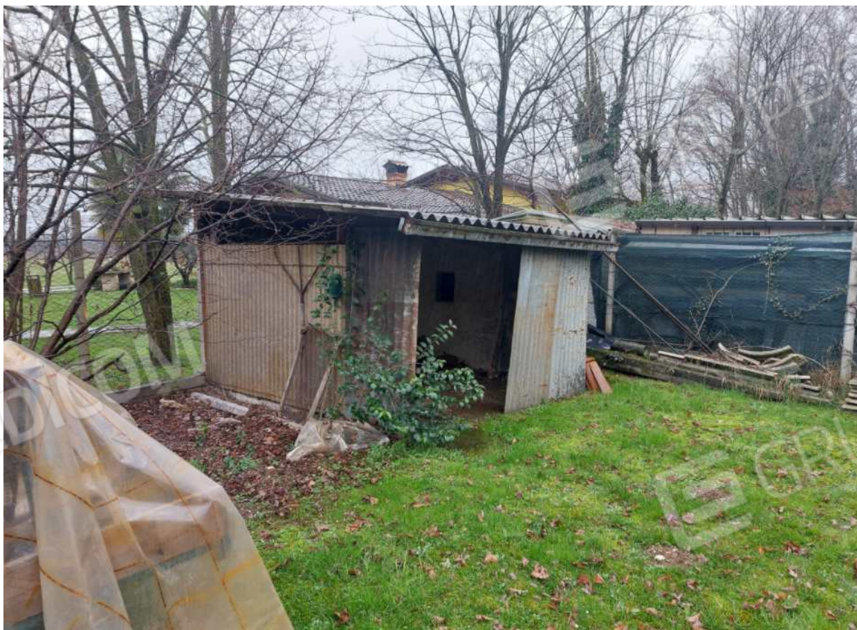
Foto n° 22 – 01/03/2024 - Comune di Aviano, foglio 55, part.413 – Magazzino/legnaia.