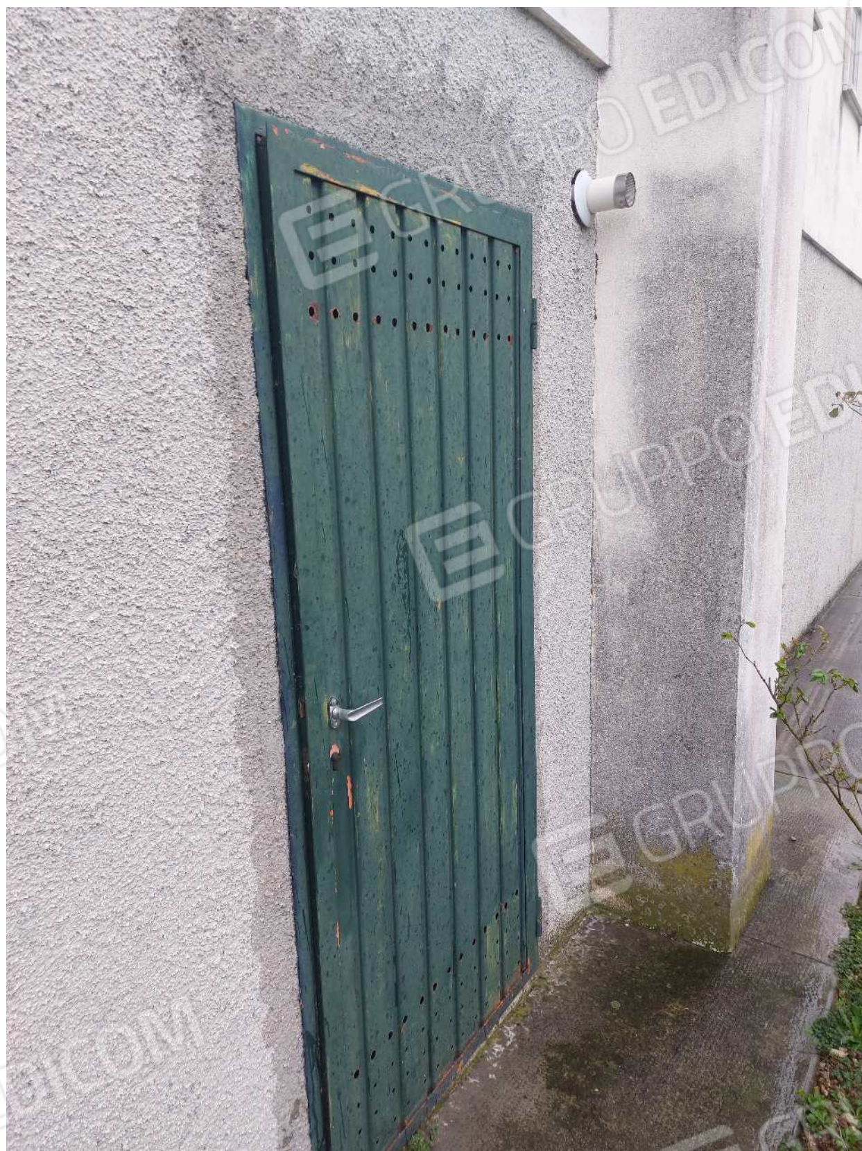
Foto n° 20 – 01/03/2024 - Comune di Aviano, foglio 55, part.384, sub.7 – Accesso alla centrale termica.