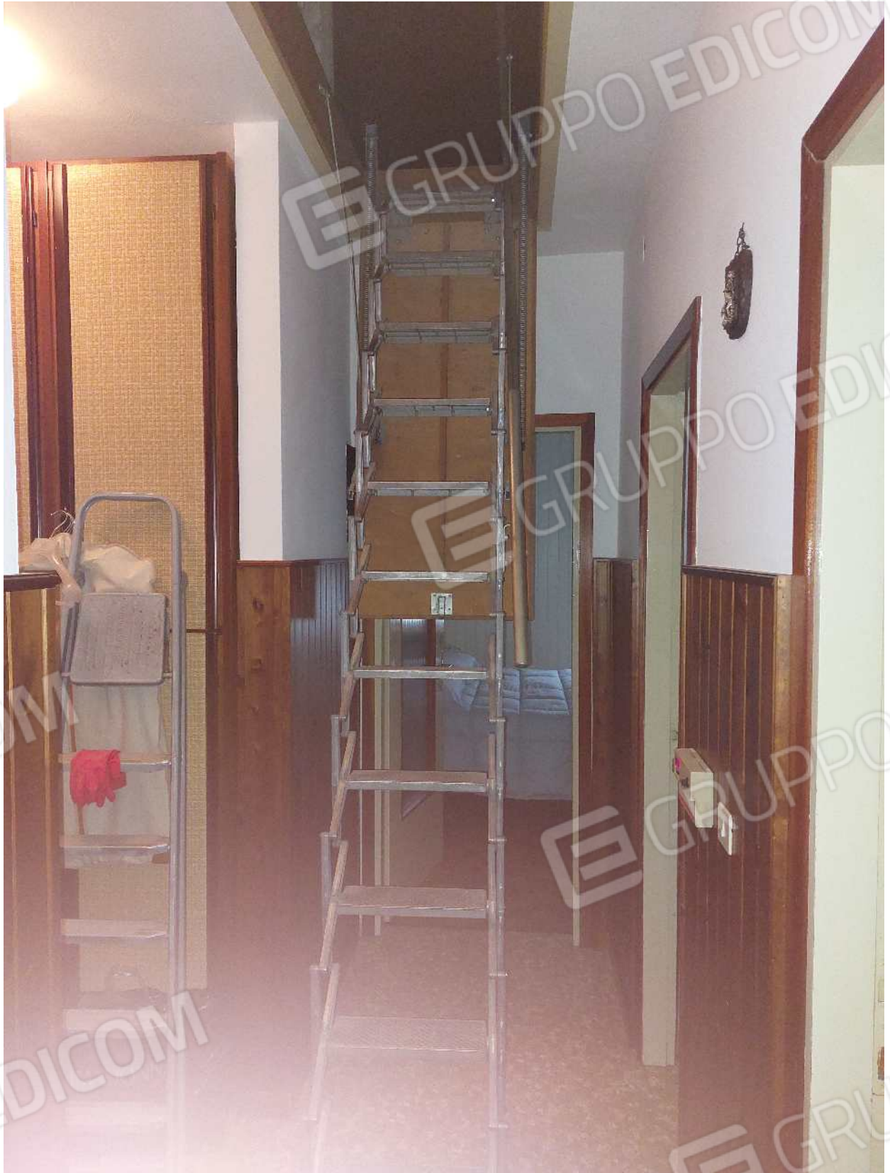
Foto n° 15 – 01/03/2024 - Comune di Aviano, foglio 55, part.384, sub.4 – Scala retrabile che conduce alla soffitta.