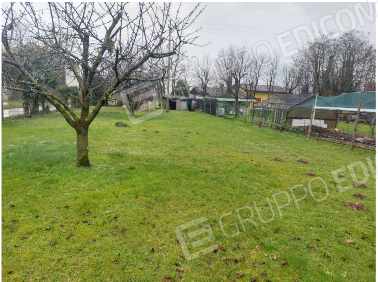
Foto n° 24 – 01/03/2024 - Comune di Aviano, foglio 55, part.389 – Terreno.