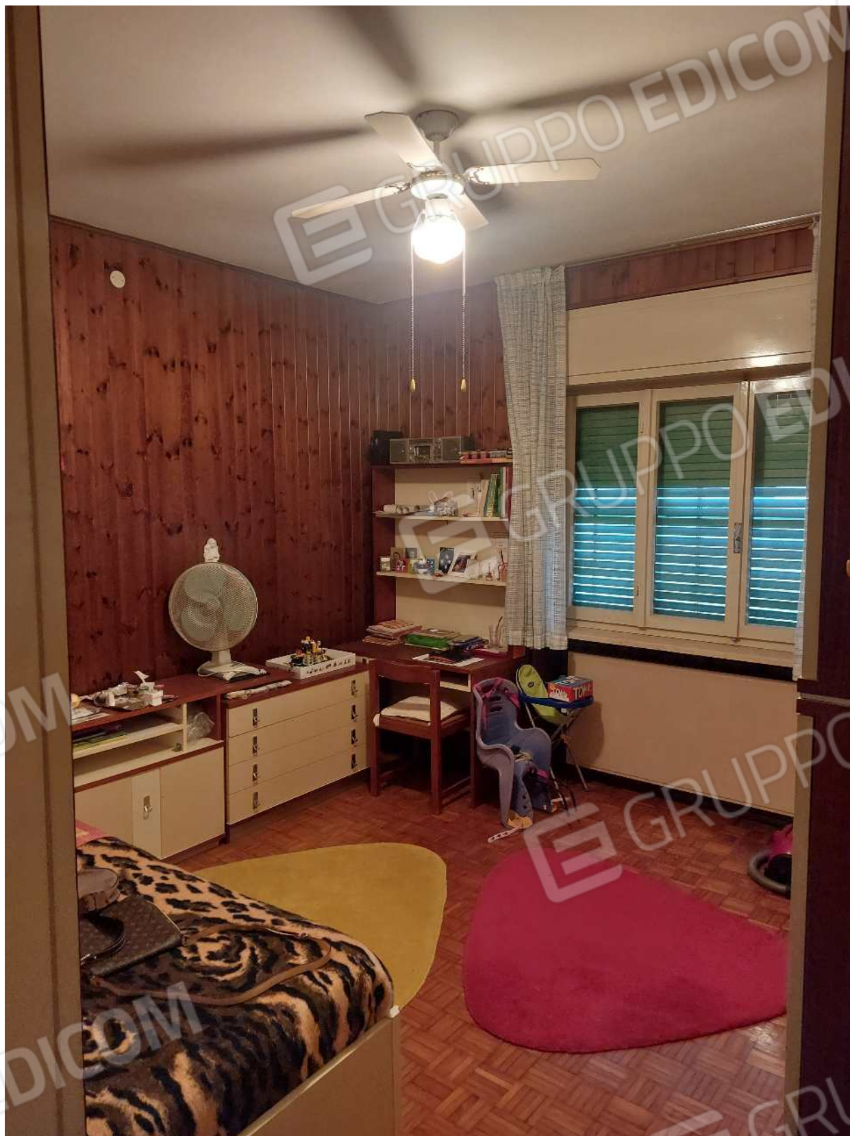
Foto n° 12 – 01/03/2024 - Comune di Aviano, foglio 55, part.384, sub.4 – Camera.