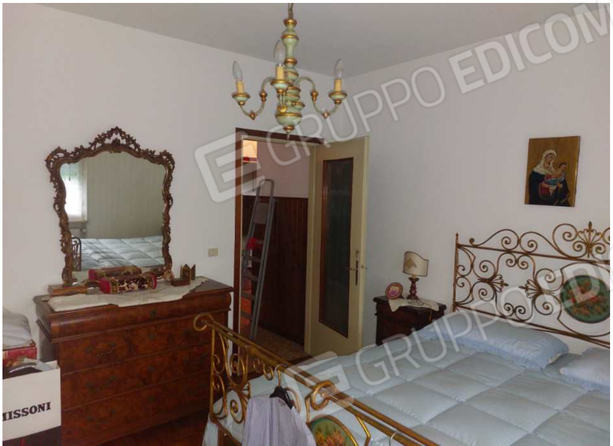
Foto n° 13 – 01/03/2024 - Comune di Aviano, foglio 55, part.384, sub.4 – Camera.