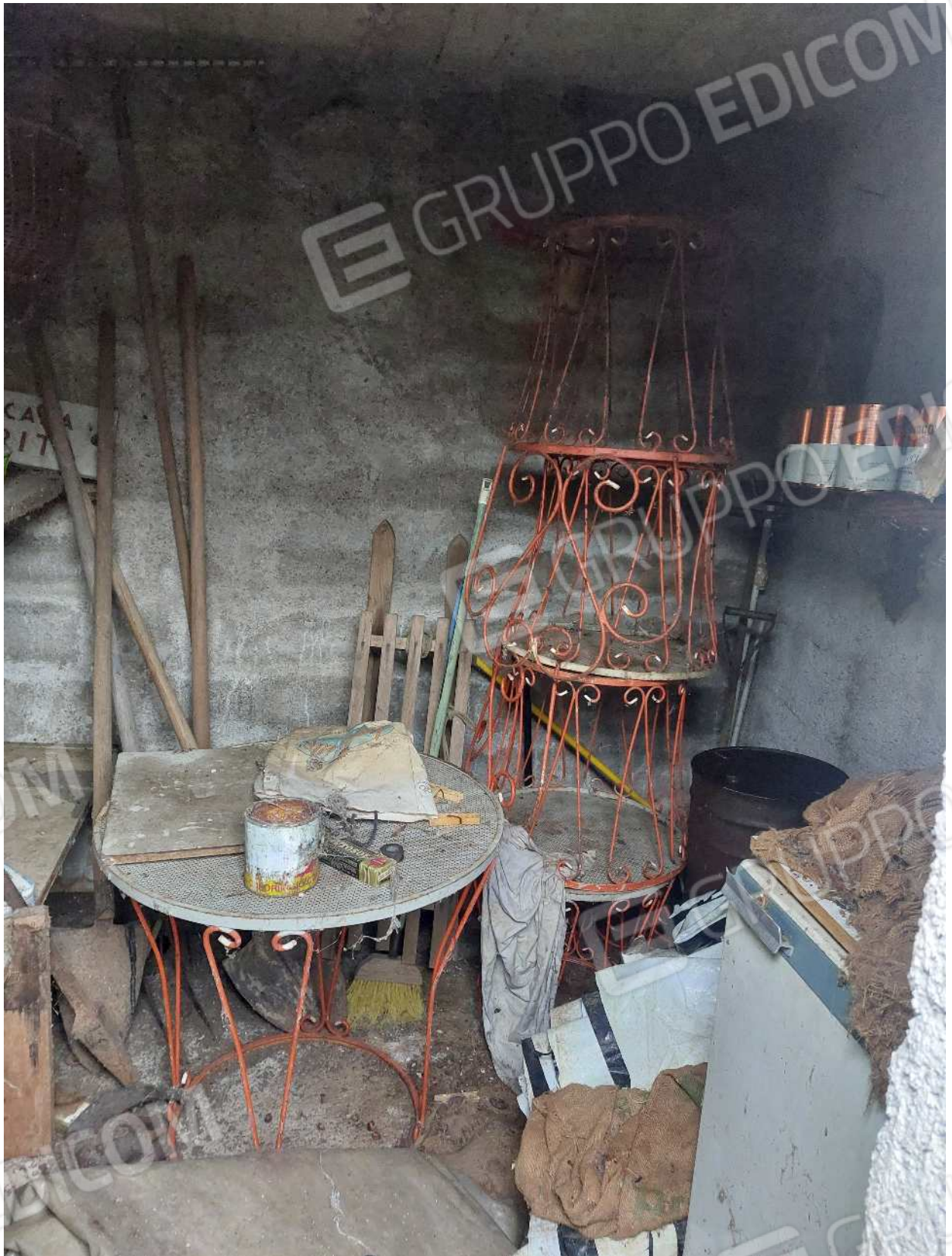
Foto n° 23 – 01/03/2024 - Comune di Aviano, foglio 55, part.413 – Magazzino/legnaia.