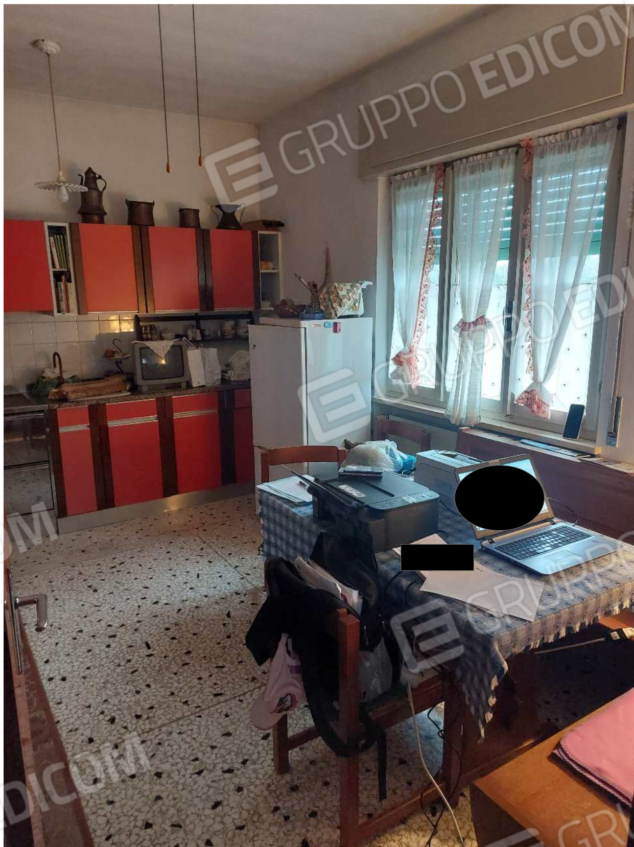
Foto n° 6 – 01/03/2024 - Comune di Aviano, foglio 55, part.384, sub.4 – Cucina.