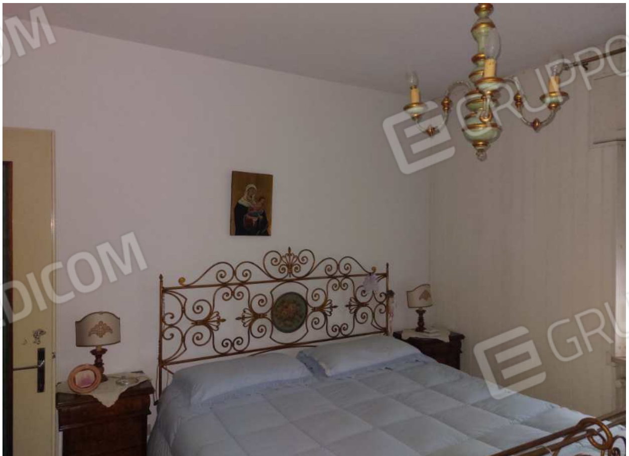
Foto n° 14 – 01/03/2024 - Comune di Aviano, foglio 55, part.384, sub.4 – Camera.