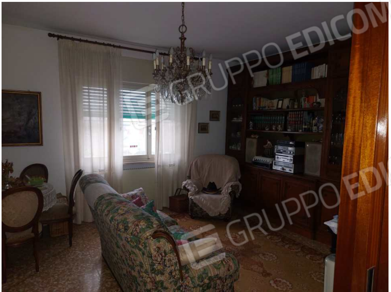
Foto n° 5 – 01/03/2024 - Comune di Aviano, foglio 55, part.384, sub.4 – Salotto.