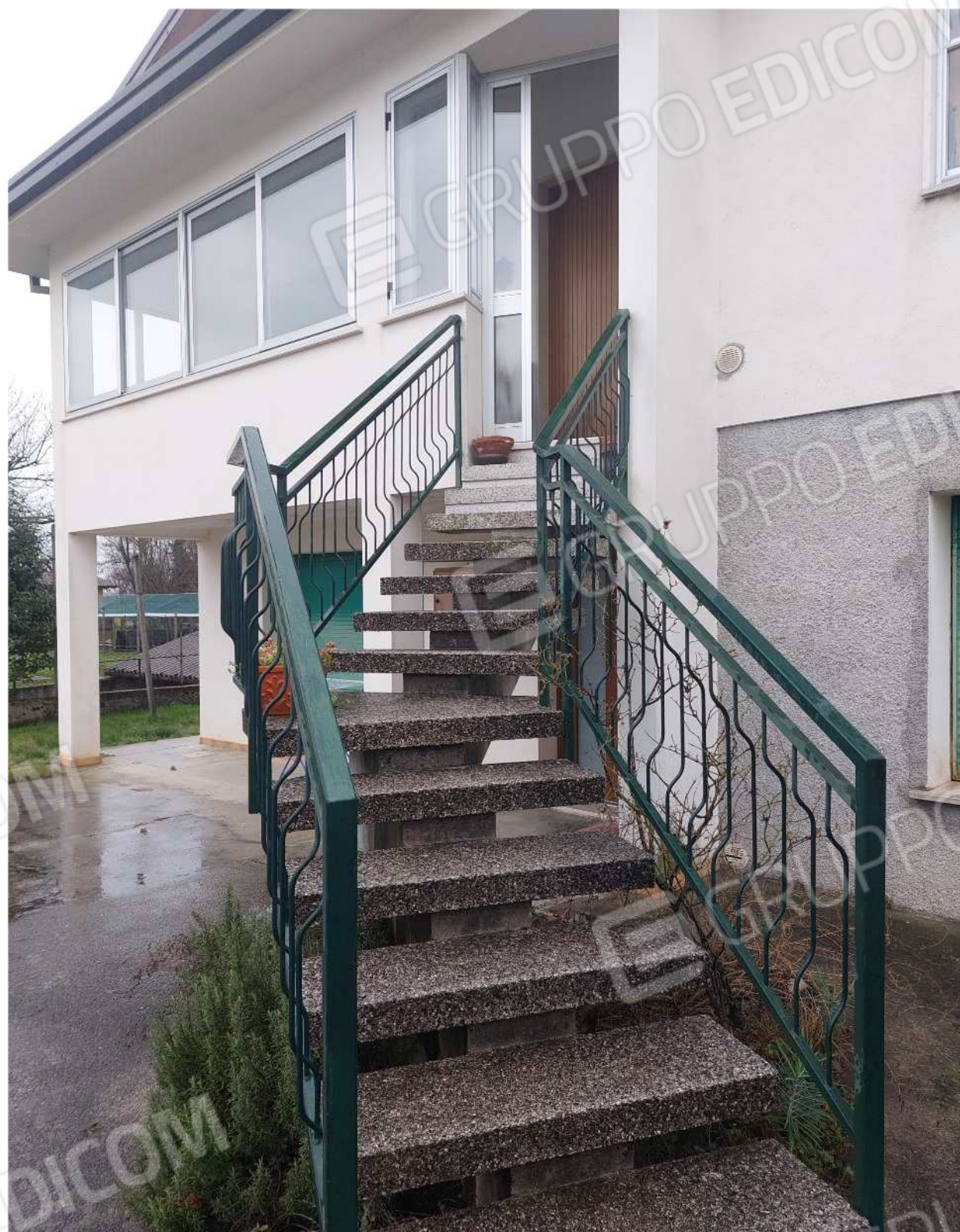
Foto n° 2 – 01/03/2024 - Comune di Aviano, foglio 55, part.384 – Scala di accesso.