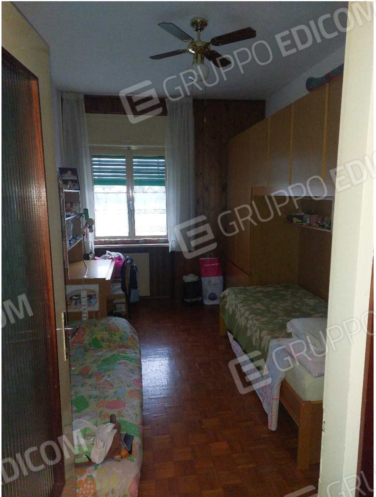
Foto n° 9 – 01/03/2024 - Comune di Aviano, foglio 55, part.384, sub.4 – Camera.