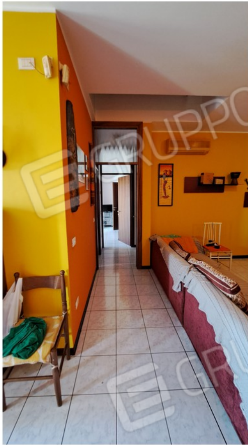
13-zona giorno verso zona notte