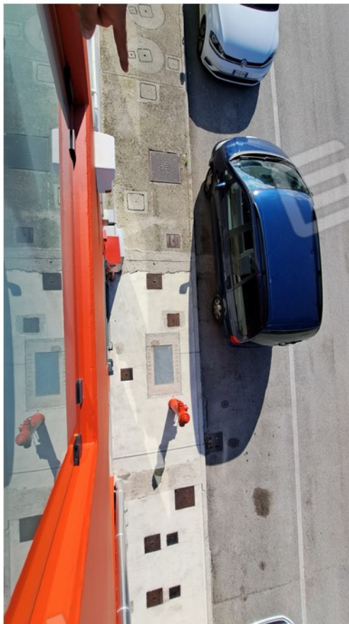
30 - vasche reflui - acquedotto