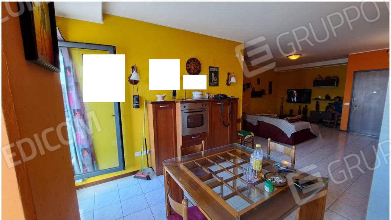
12-zona giorno pranzo