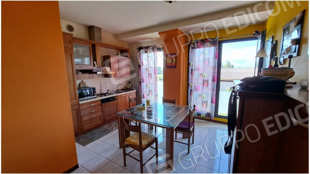
11-zona giorno cottura pranzo