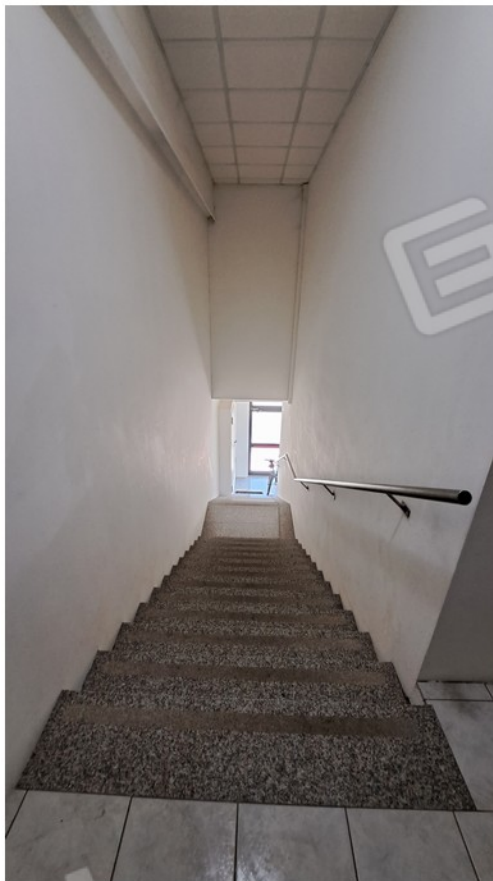
8-vano scala comune