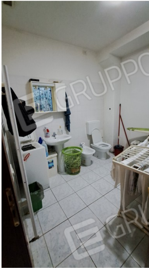
27- bagno lavanderia