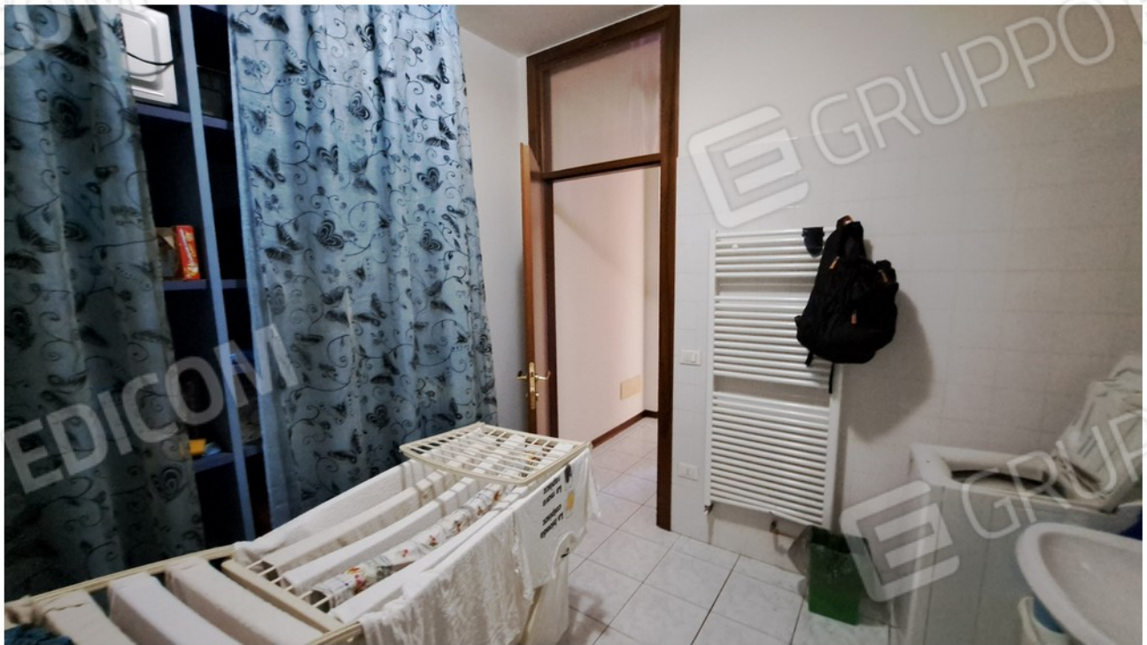
28- bagno lavanderia