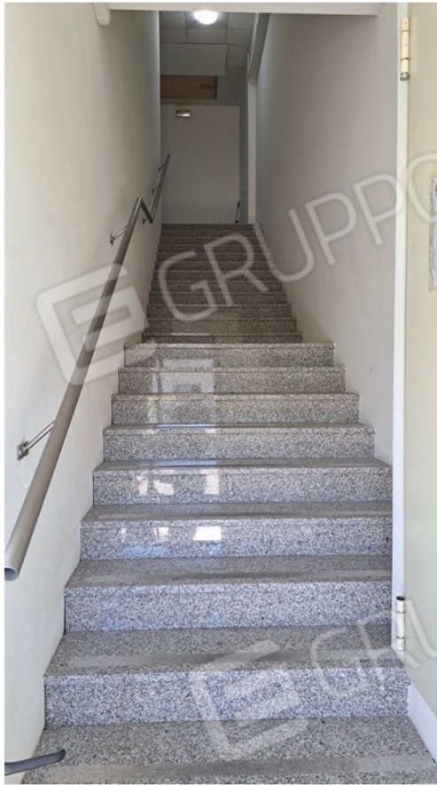
5-vano scala comune