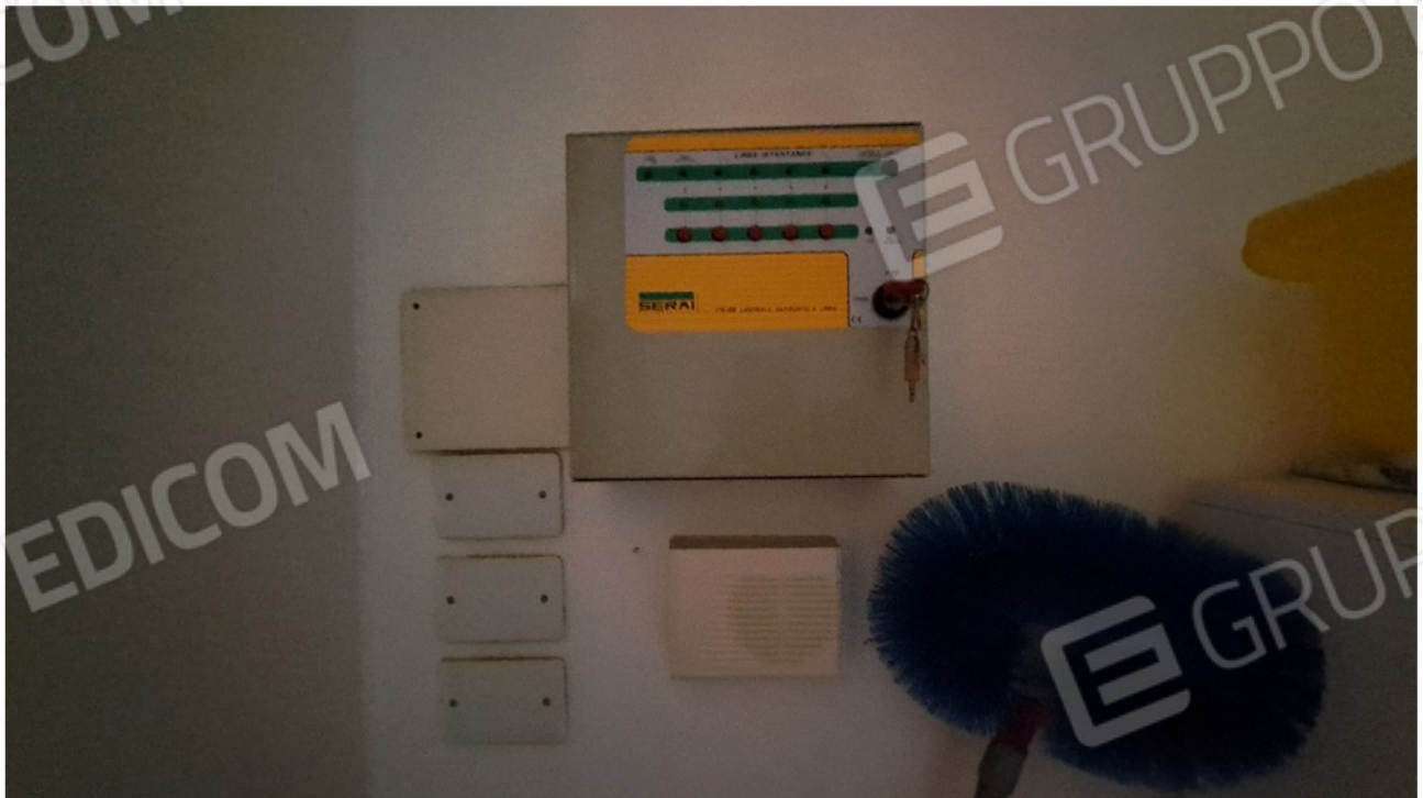
38 - impianto allarme