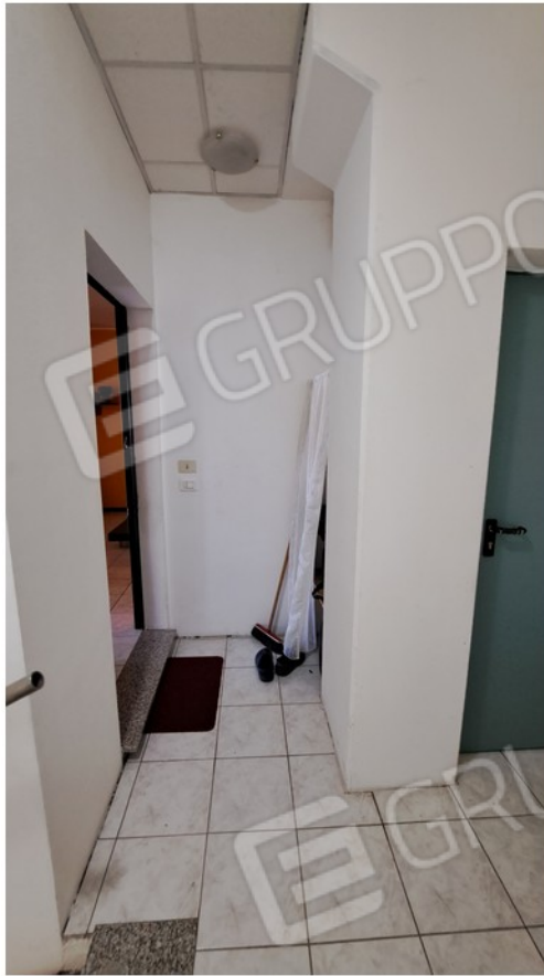
7-ingresso zona comune