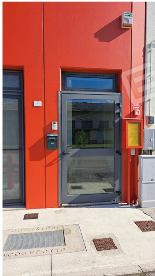
4-accesso vano scala comune