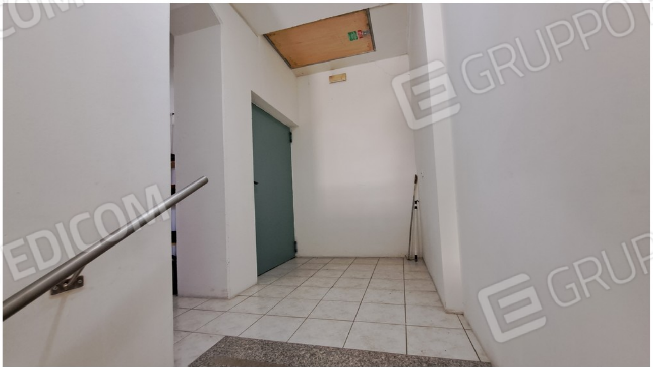
6-vano scala comune e botola