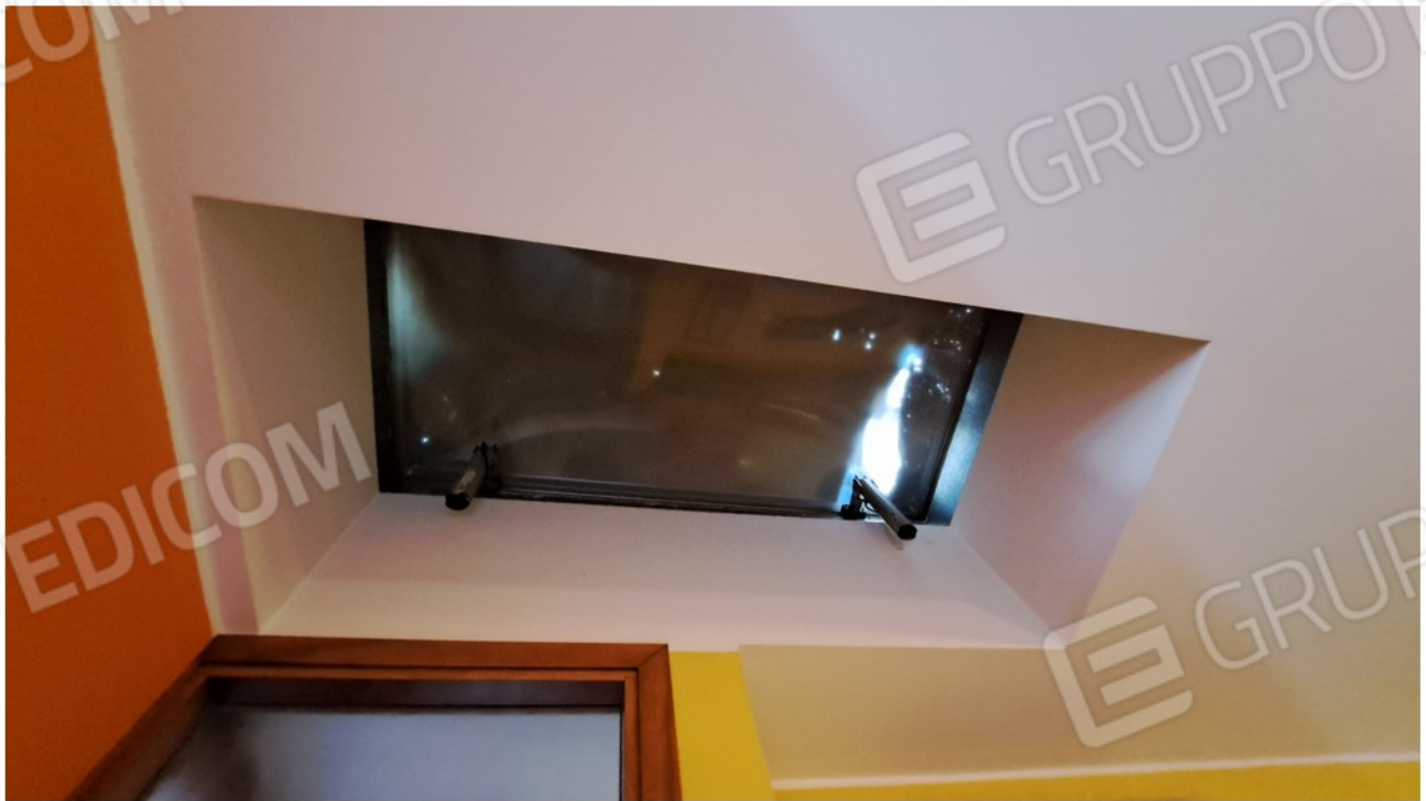
14-lucernaio su zona giorno