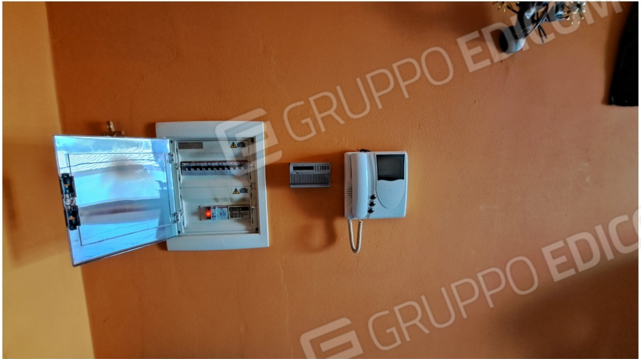
37-quadro elettrico citofono e termostato