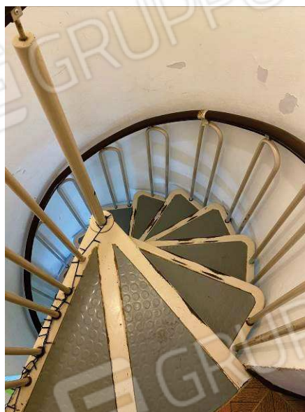
viste scala a chiocciola di collegamento piano terra con il primo piano