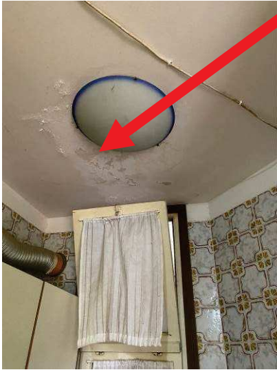
degrado soffitto della cucina