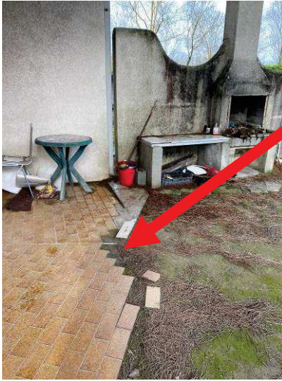
particolare degrado pavimento del marciapiede