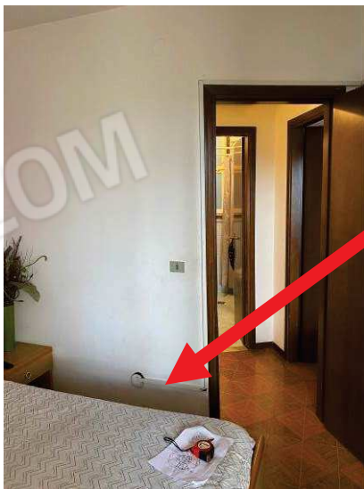
vista modifica impianto elettrico nella camera