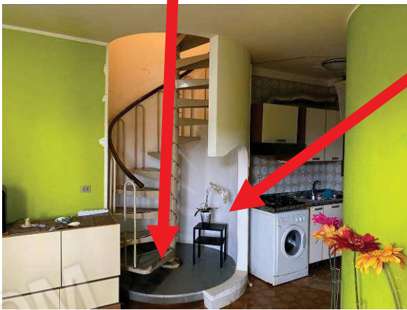
vista difformità della partenza scala a chiocciola al piano terra e demolizione parziale muratura