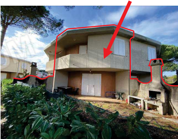
particolare prospetto lato Sud

appartamento con corte esclusiva pertinenziale oggetto di esecuzione immobiliare