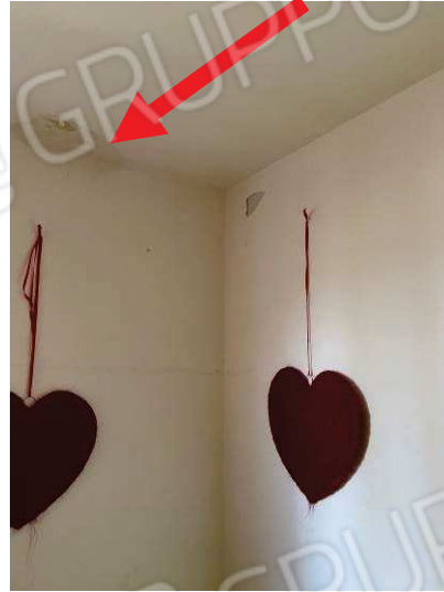
vista infiltrazione d'acqua nel soffitto della cameretta