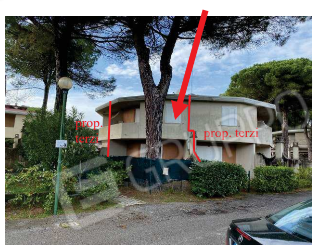
particolare prospetto lato Est