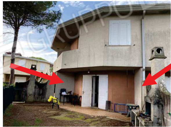
vista difformità catastale dei muri divisorii esterni confinanti con i subalterni adiacenti di proprietà terzi