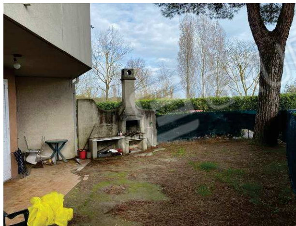
particolare caminetto esistente nella corte esclusiva pertinenziale