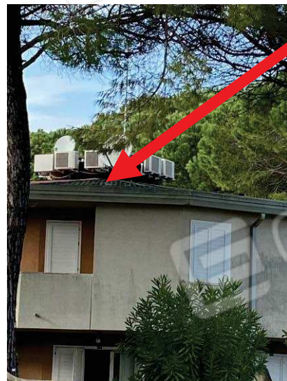
vista degrado manto di copertura