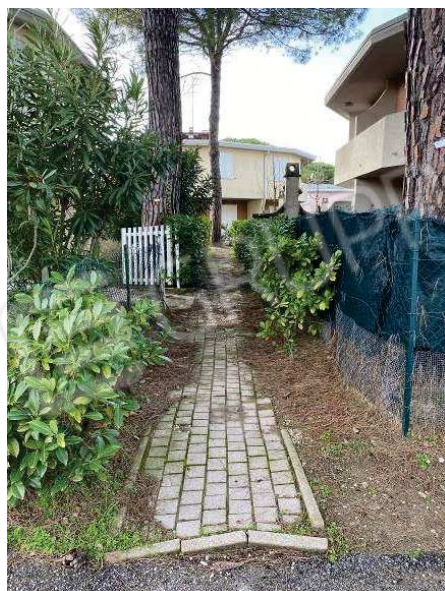
particolare ingresso pedonale condominiale