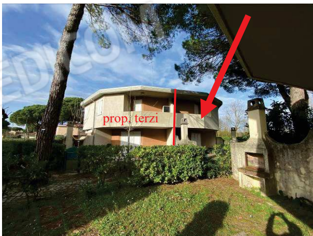
particolare prospetto lato Ovest