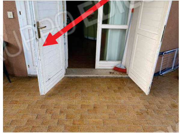
degrado della porta d'ingresso