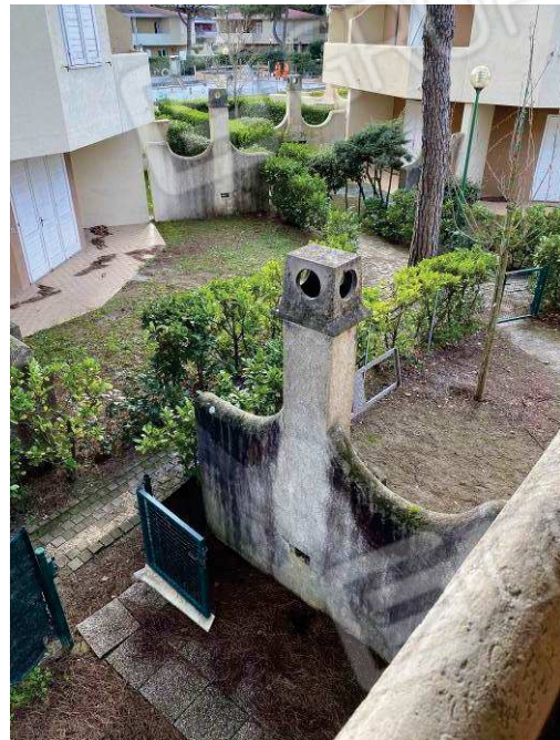
vista dall'alto della corte esclusiva pertinenziale