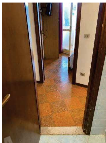
Vista corridoio al primo piano