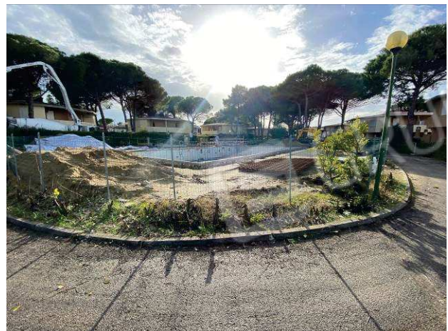
particolare piscina sud in fase di manutenzione straordinaria