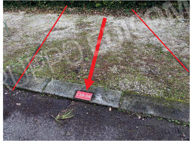
particolare posto auto scoperto ad uso perpetuo sull'area condominiale