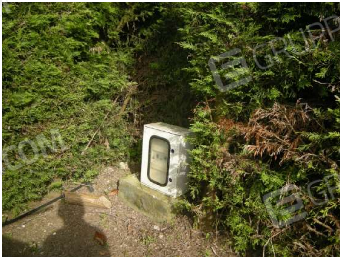
Ottava Presa (Caorle), Strada Fortuna n. 56 – Sopra vano contatori elettricit  e telefonia, sotto armadietto di comando luci esterne.