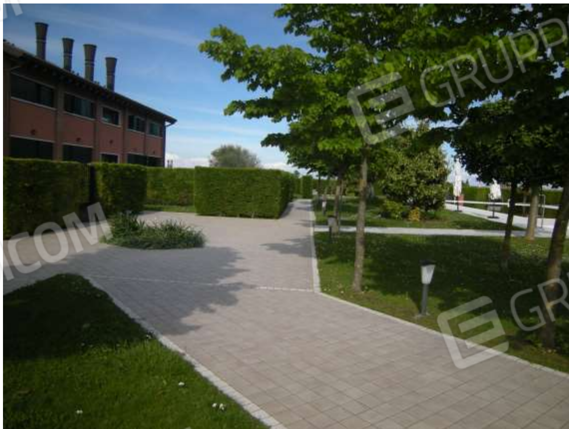
Ottava Presa (Caorle), Strada Fortuna n. 56 - La corte di pertinenza dell'immobile e la piscina.