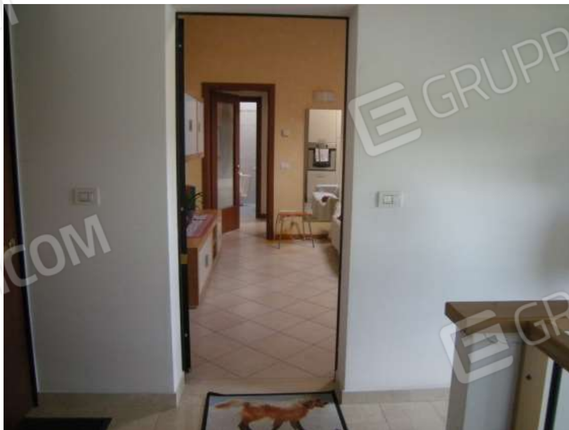
Ottava Presa (Caorle), Strada Fortuna n. 56 - Il corpo scala.