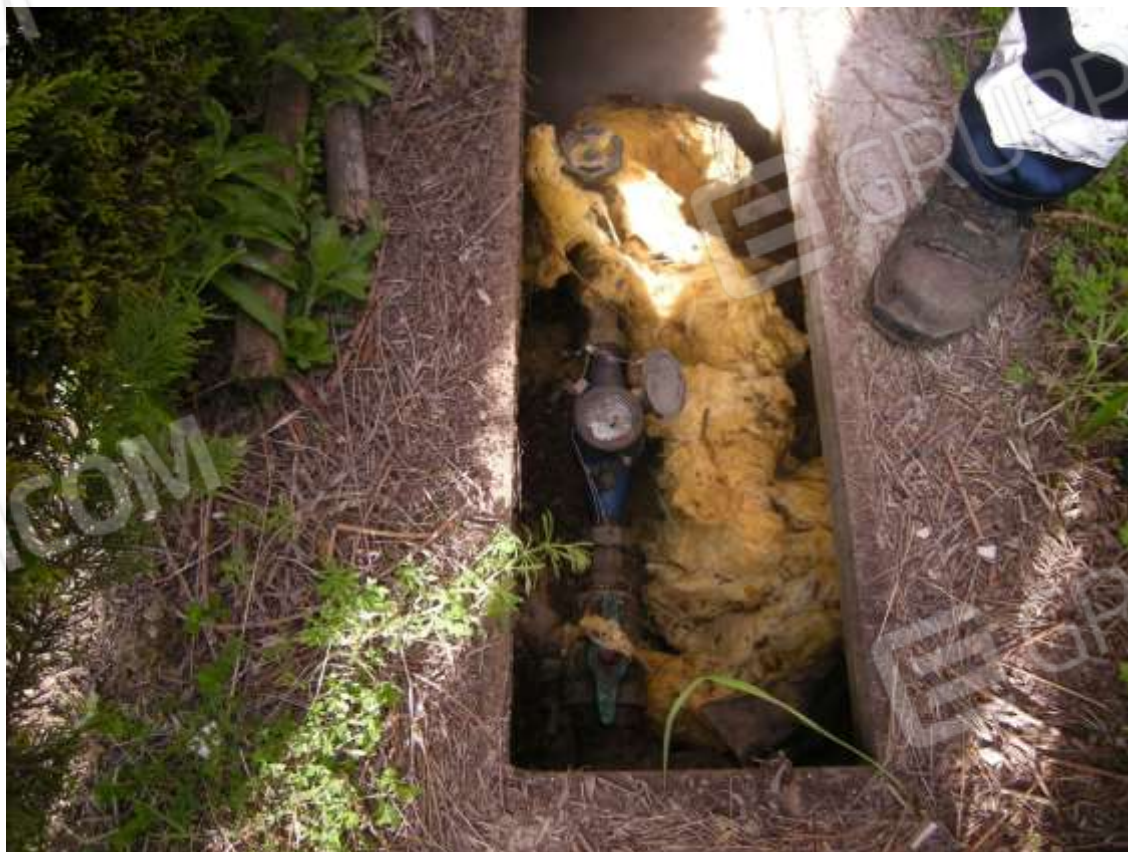
Ottava Presa (Caorle), Strada Fortuna n. 56 - Sopra nicchia contatori gas, sotto pozzetto contatore generale acqua.