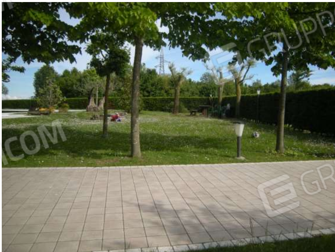
Ottava Presa (Caorle), Strada Fortuna n. 56 - La corte di pertinenza dell'immobile e la piscina.