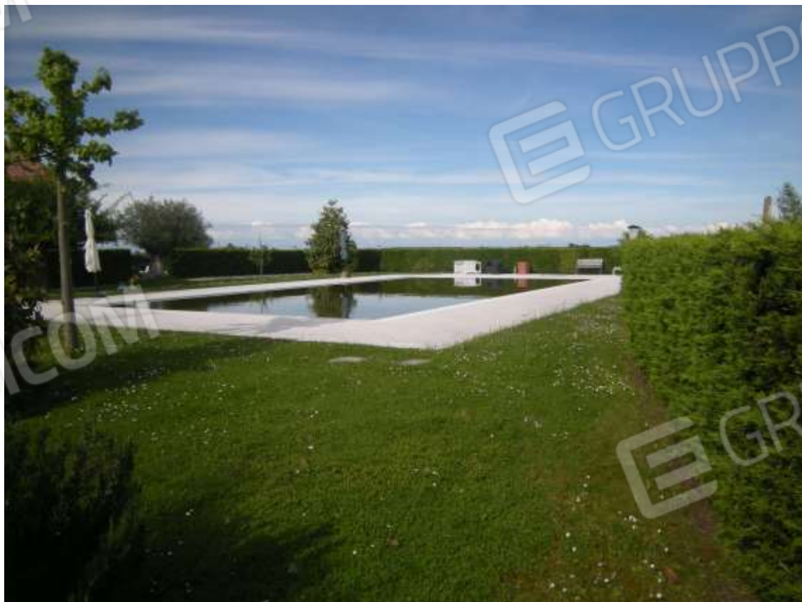
Ottava Presa (Caorle), Strada Fortuna n. 56 - La corte di pertinenza dell'immobile e la piscina.