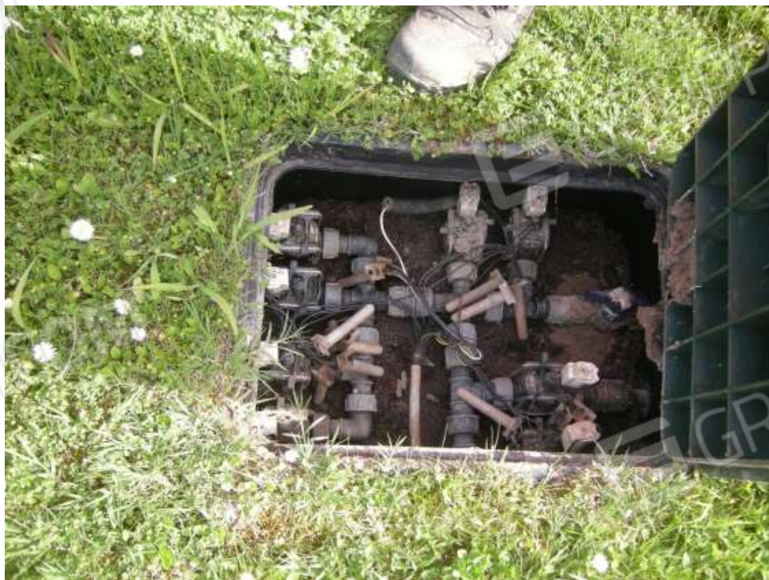
Ottava Presa (Caorle), Strada Fortuna n. 56 – Sopra pozzetto contatori acqua, sotto pozzetto irrigazione corte comune.