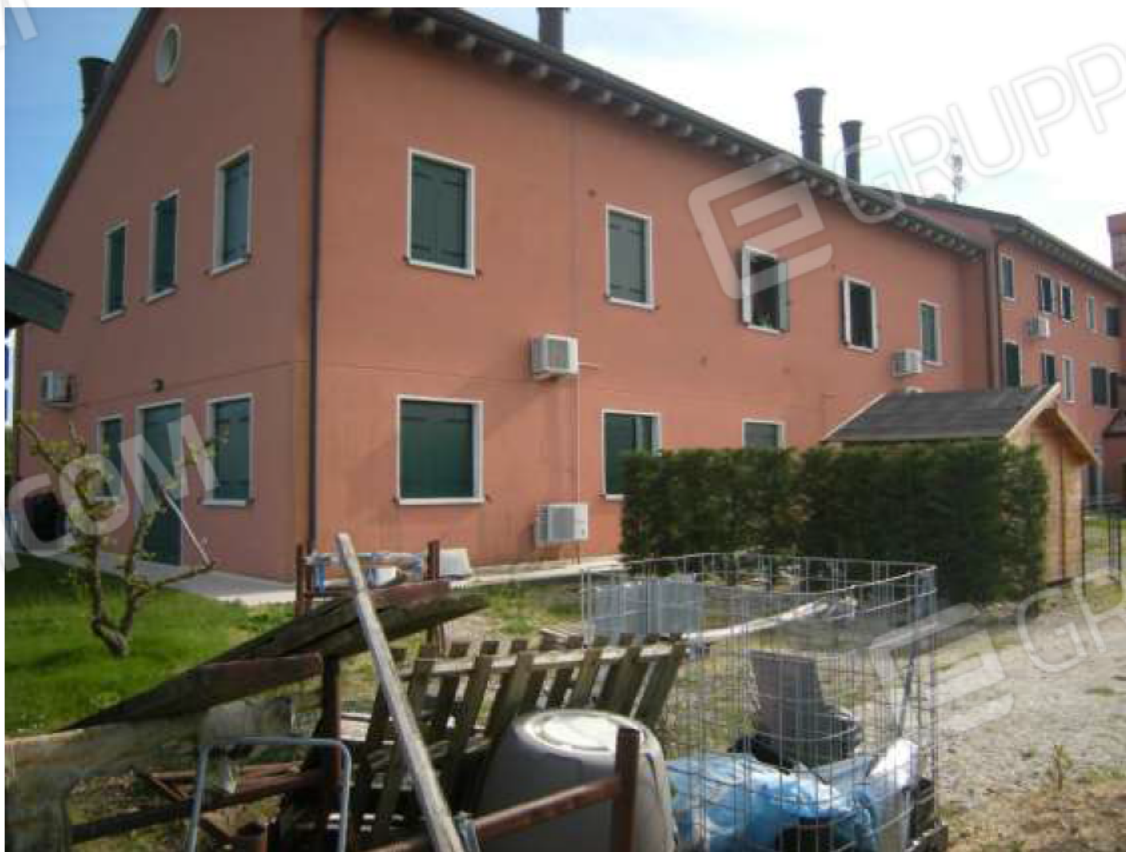
Ottava Presa (Caorle), Strada Fortuna n. 56 – Sopra i prospetti a sud-est e nord-ovest, sotto i prospetti ad nord -ovest ed a nord – est.