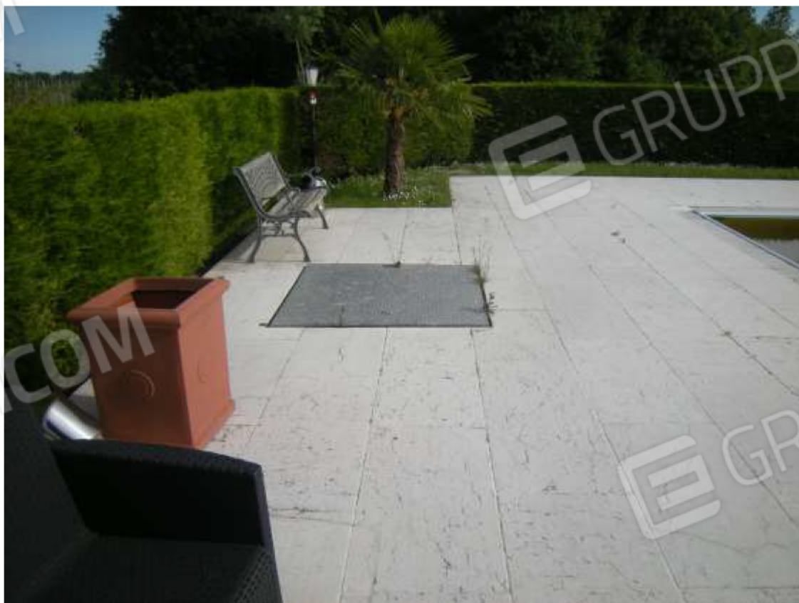
Ottava Presa (Caorle), Strada Fortuna n. 56 – Sopra il citofono esterno, sotto il pozzetto del gruppo pompe della piscina.