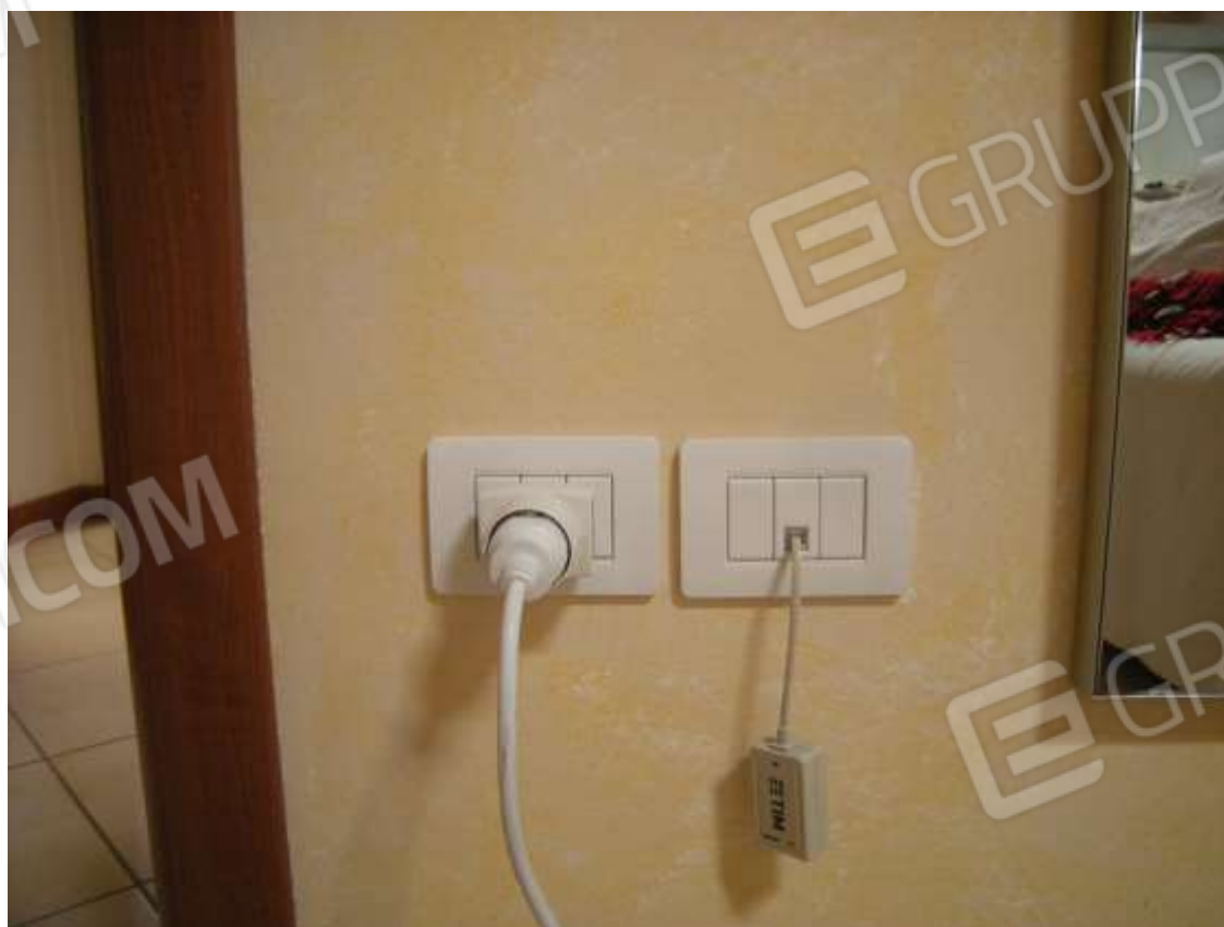
Ottava Presa (Caorle), Strada Fortuna n. 56- Sopra il quadro elettrico, sotto gli interruttori.