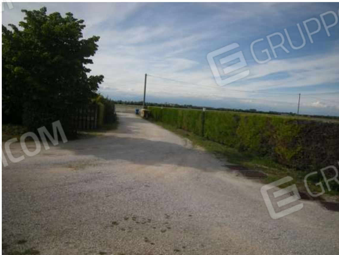
Ottava Presa (Caorle), Strada Fortuna n. 56 - L'ingresso al fabbricato.