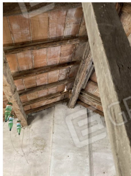
vista del vetusto tetto in legno con cedimenti strutturali e causa di infiltrazioni d'acqua