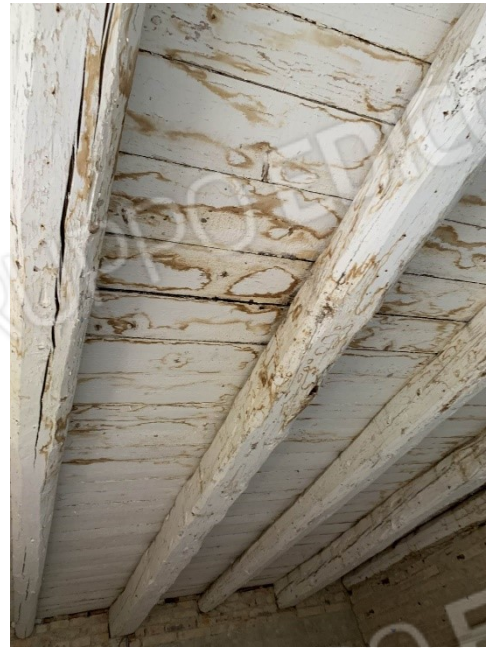
particolare del secondo solaio in legno con tracce di infiltrazioni d'acqua