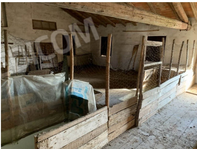
vista interna soffitta non divisa materialmente rispetto alla proprietà terzi