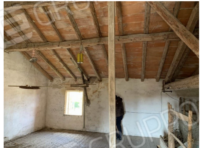
viste interne soffitta