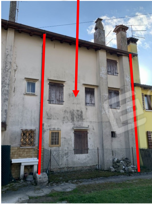
prospetto retro fabbricato (lato nord)