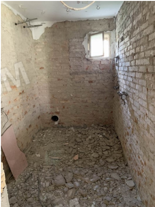
vista della centrale termica/lavanderia