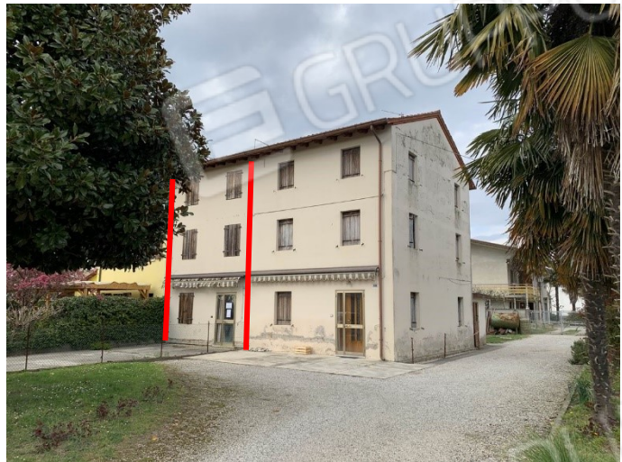
prospetto lato sud-est