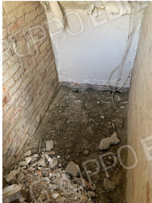
viste del sottoscala/secchiaio