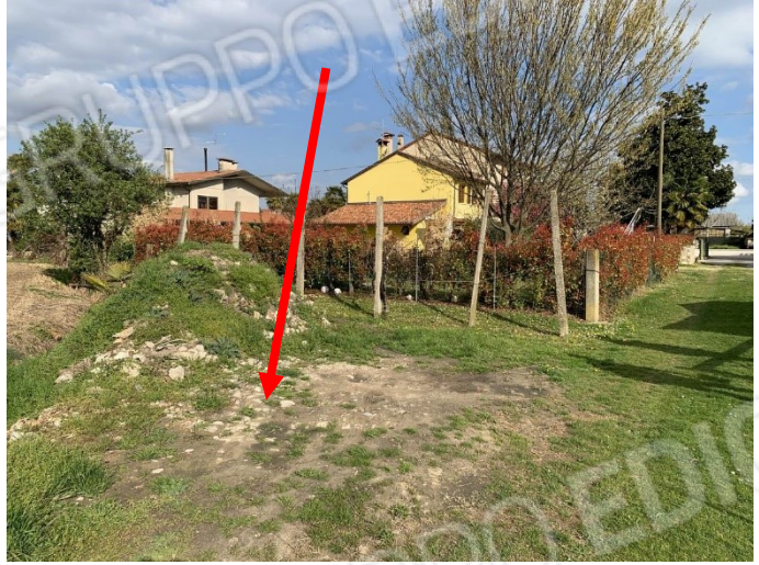
particolare di un'area scoperta esclusiva localizzata confinante con il mappale 99 (lato ovest del mappale 367)