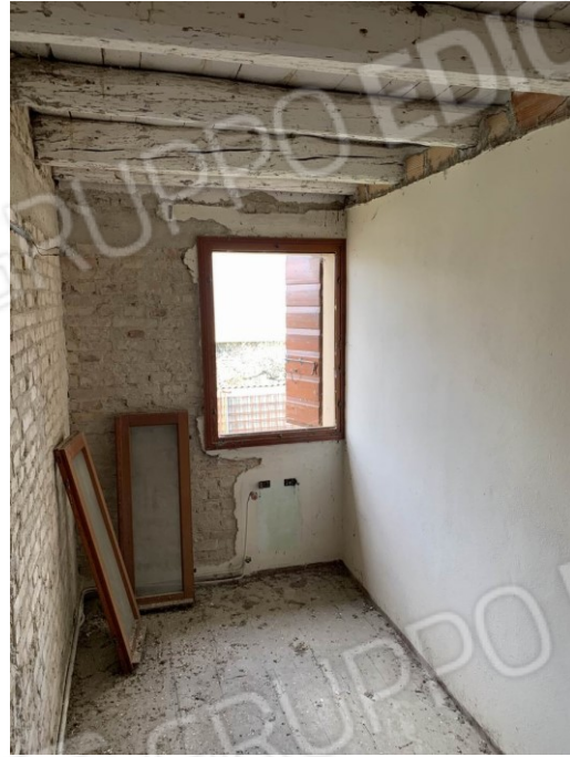
vista della cameretta