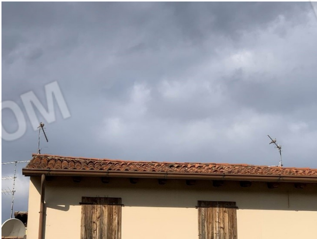
particolare vetusta copertura con cedimenti causa di infiltrazioni d'acqua