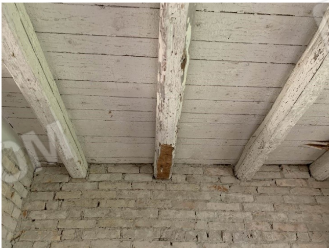
particolare del primo solaio in legno