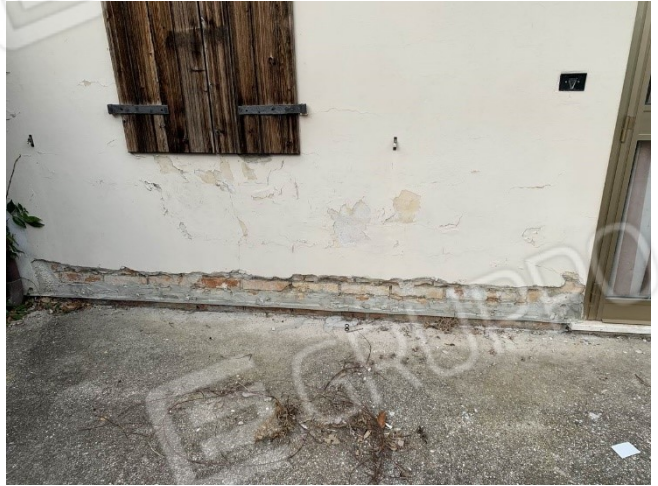
particolare taglio meccanico alla base della muratura per eliminare l'umidità di risalita