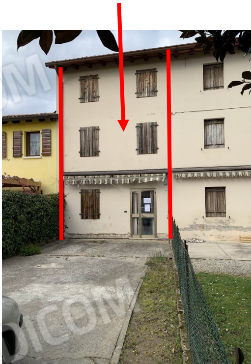
vista esterna del prospetto principale del fabbricato (lato sud con scoperto esclusivo)

fabbricato oggetto di esecuzione immobiliare