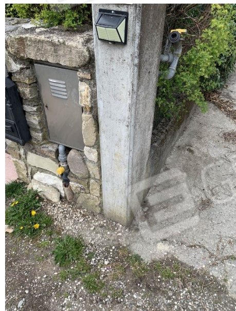
particolare della predisposizione dell'allacciamento alla rete gas metano