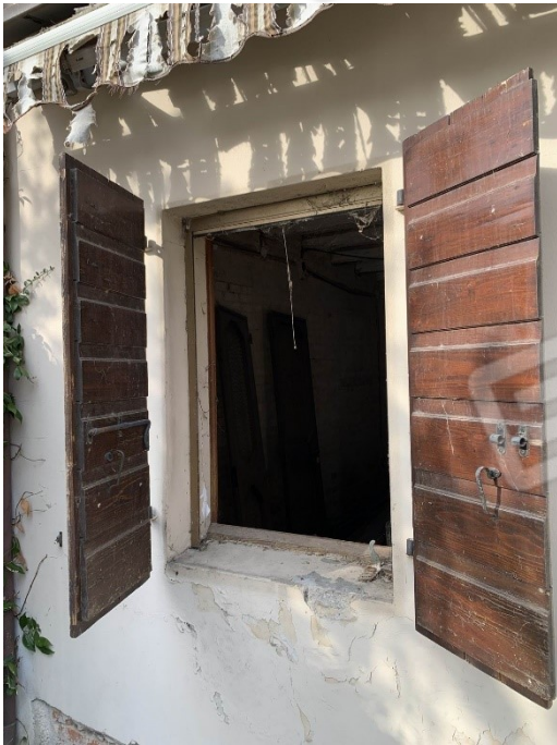
particolare di una vetusta finestra e balcone