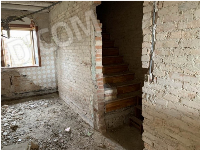
ulteriori particolari del taglio meccanico nelle murature interne