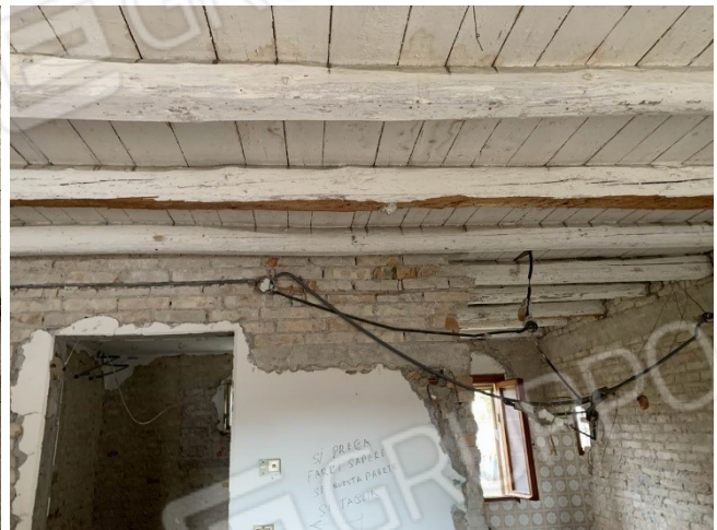
particolare del vetusto impianto elettrico