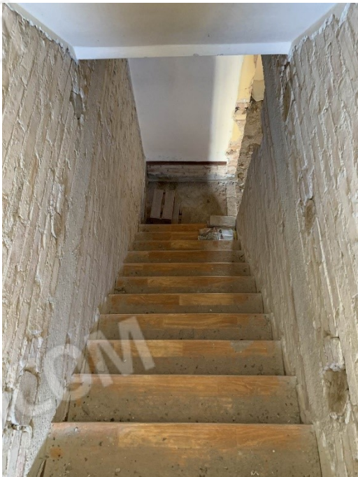
vista scala dal piano terra al primo piano