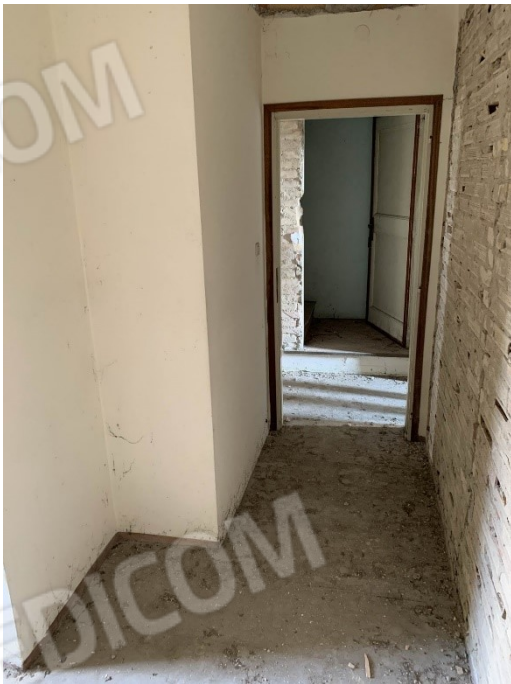
ulteriore vista della cameretta