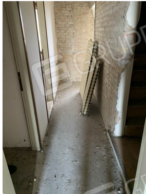
vista corridoio al primo piano