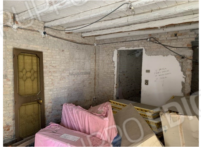
viste interne del locale pranzo