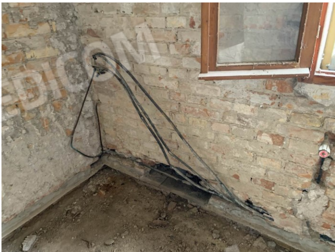
particolare del vetusto impianto termico rimosso