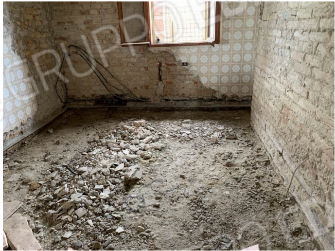
particolare interno del piano terra con pavimento totalmente demolito