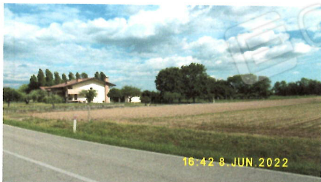
F.24, mapp. 63