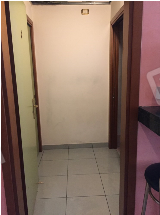
vista interna corridoio