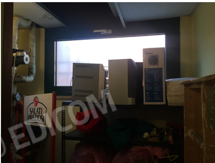
ulteriore vista interna ripostiglio