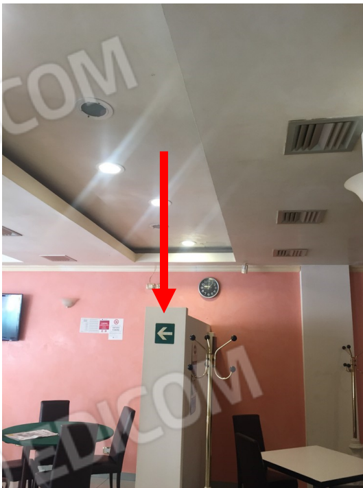
vista difformità della testata di una parete