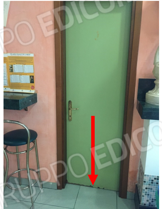
vista difetto nella porta di accesso al corridoio