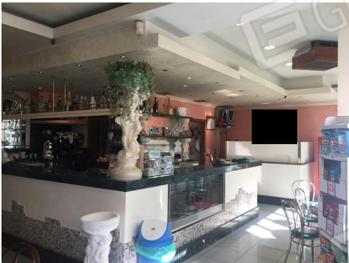
vista interna dell'immobile commerciale "attualmente ad uso bar"