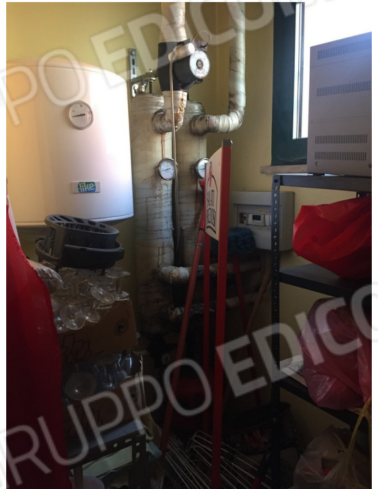
vista interna ripostiglio