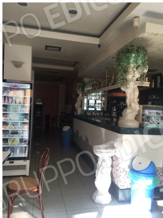
ulteriore vista interna dell'immobile commerciale "attualmente ad uso bar"