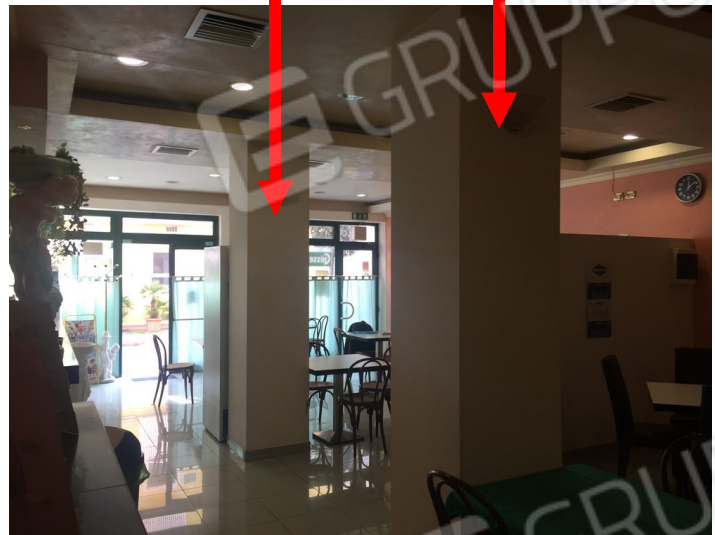
vista difformità per allargamento della sezione di due pilastri centrali