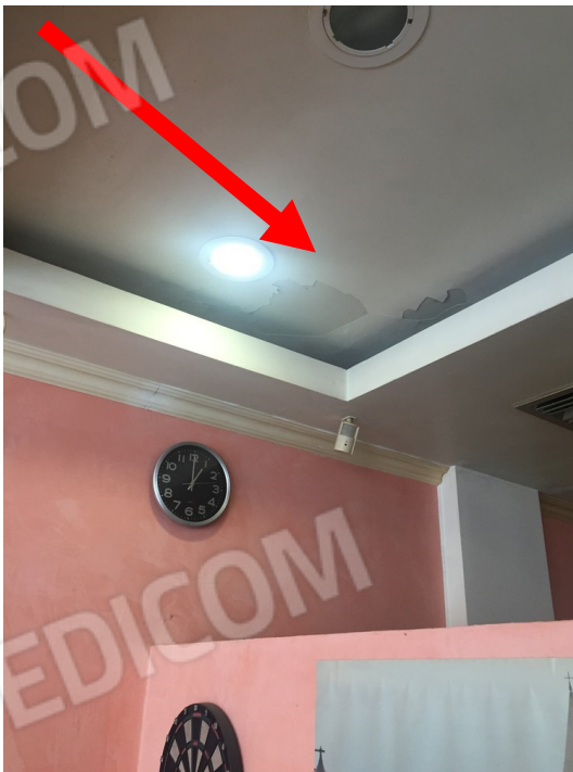
vista difetto di distacco tinteggiatura dal soffitto