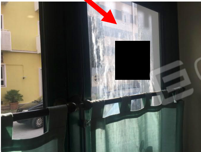
ulteriore vista del difetto nei vetri delle vetrate fronte strada