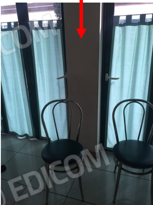
difformità catastale e di progetto dei pilastri e di una parete in prossimità alle vetrate dell'immobile commerciale