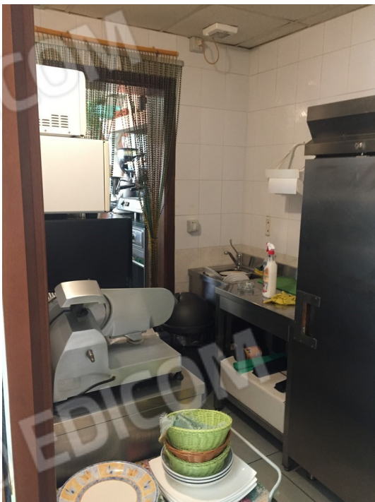
vista interna locale retro