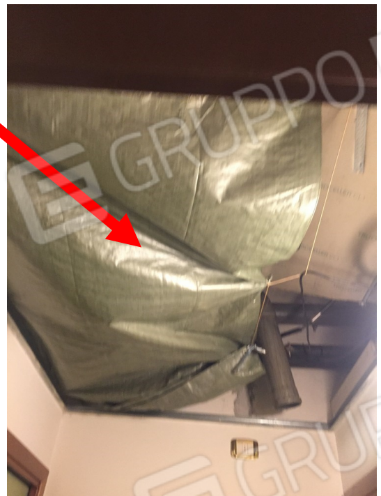
vista difetto per mancanza del soffitto nel corridoio