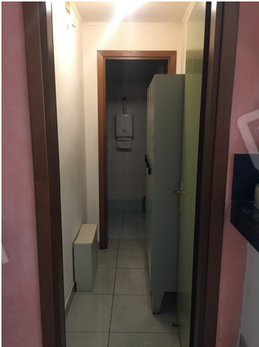
vista interna corridoio/spogliatoio