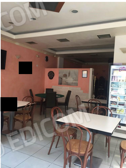
ulteriore vista interna dell'immobile commerciale "attualmente ad uso bar"