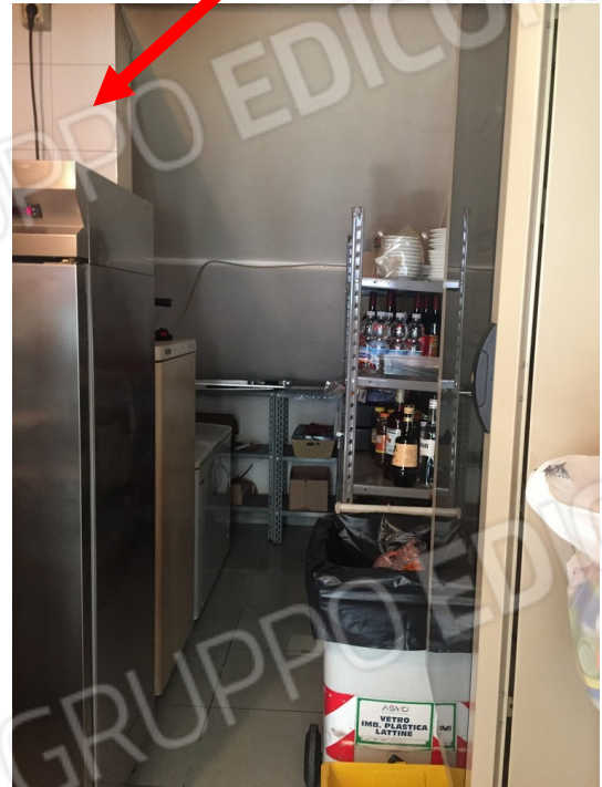
vista difformità di una parete nel sottoscala