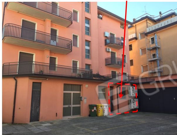
ulteriore prospetto retro fabbricato dell'immobile commerciale

fabbricato commerciale oggetto di esecuzione