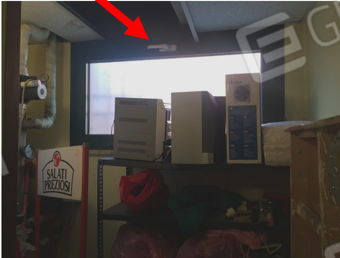
vista difetto nel soffitto del ripostiglio