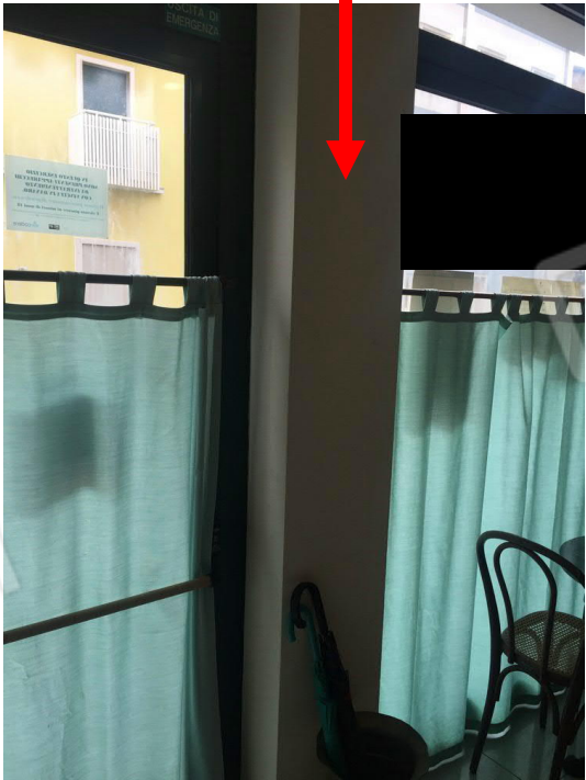
ulteriore vista difformità catastale e di progetto del pilastro dell'immobile commerciale