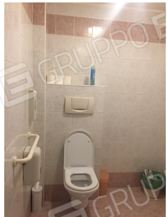
vista interna bagno disabili