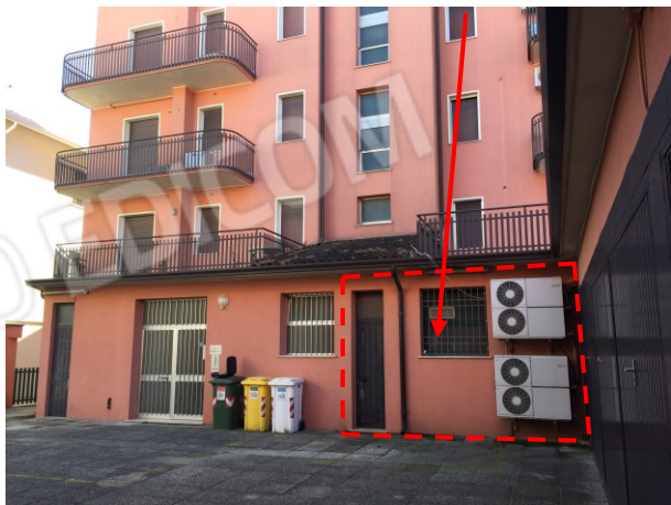
prospetto nord retro fabbricato dell'immobile commerciale

fabbricato commerciale oggetto di esecuzione