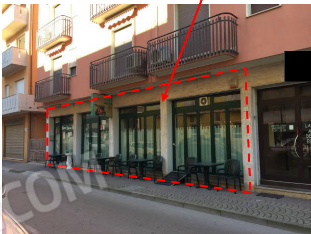
prospetto sud immobile commerciale visto dalla strada Via G. Marconi n. 58

fabbricato commerciale oggetto di esecuzione