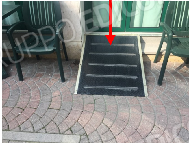
vista difetto di pendenza della rampa disabili