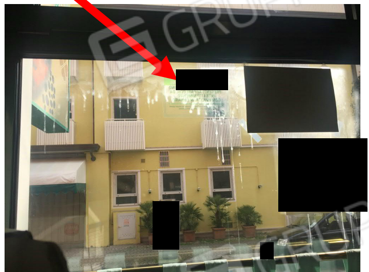
vista difetto nei vetri delle vetrate fronte strada