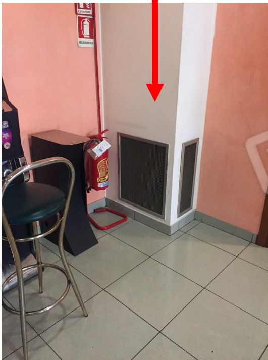
vista difformità per il ricavo di una parete a mascheratura di un canale di depurazione, ricambio d'aria con climatizzazione