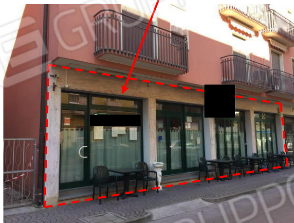
ulteriore prospetto sud dell'immobile commerciale

fabbricato commerciale oggetto di esecuzione