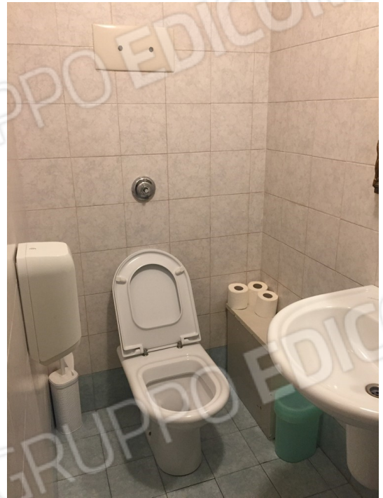
vista interna bagno