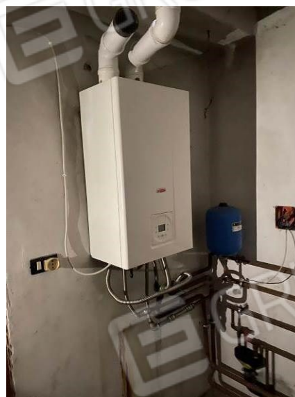
particolare caldaia posta in soffitta "in possesso" all'appartamento da regolarizzare con permesso di costruire in sanatoria