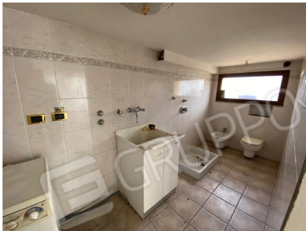
vista bagno/lavanderia da regolarizzare con permesso di costruire in sanatoria