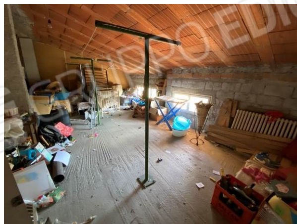
soffitta "in possesso" all'appartamento con altezza media di ml 2.35 da regolarizzare con permesso di costruire in sanatoria