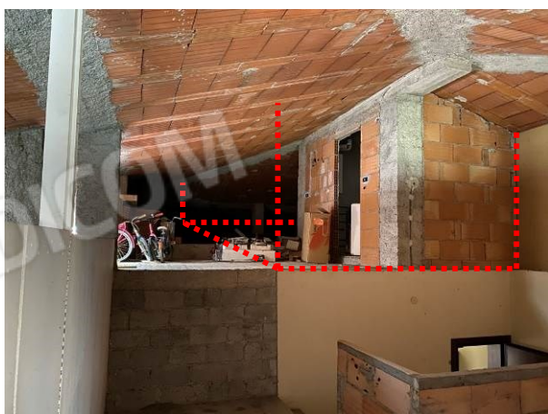
soffitta "in possesso" all'appartamento con altezza media di ml 1.35 da regolarizzare con permesso di costruire in sanatoria