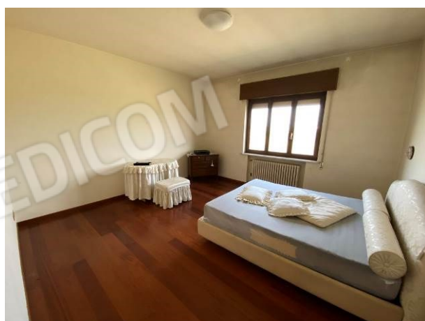
vista camera matrimoniale