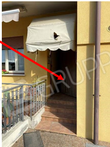
vista ingresso al piano terra