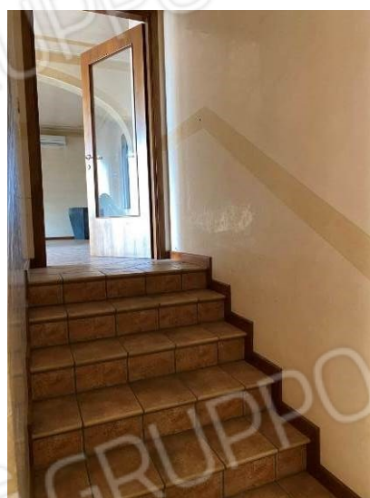
viste interne vano scala dal piano terra al primo piano