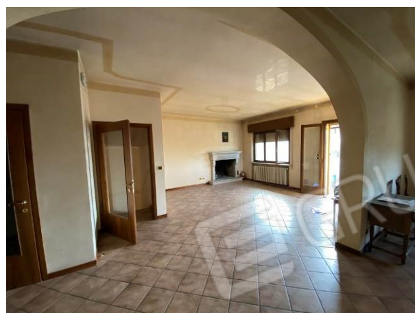
viste interne ingresso/soggiorno