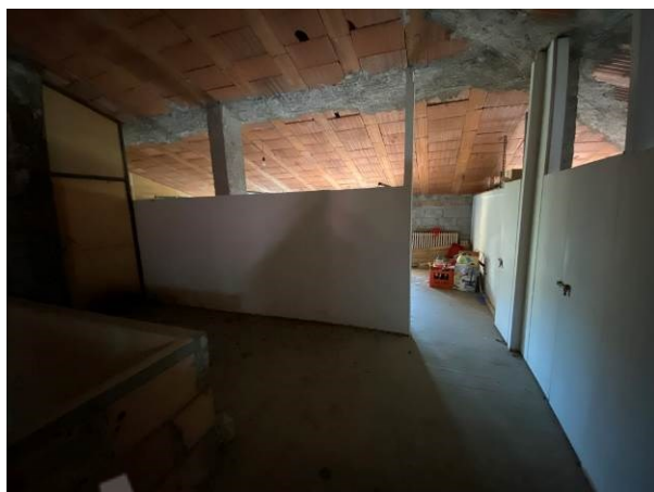
ulteriore vista corridoio condominiale posto in soffitta da regolarizzare con permesso di costruire in sanatoria