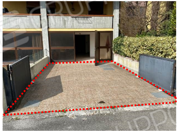
vista esterna cortile "in possesso" all'autorimessa