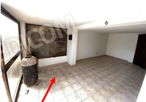
viste interne garage