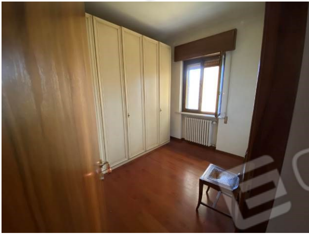
vista interna camera/guardaroba