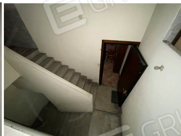
viste vano scala ad uso comune