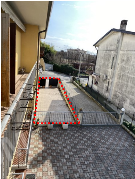
vista esterna cortile "in possesso" all'appartamento