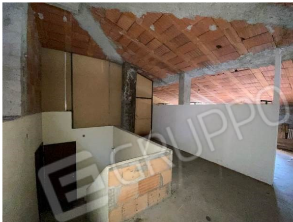
vista corridoio condominiale posto in soffitta da regolarizzare con permesso di costruire in sanatoria