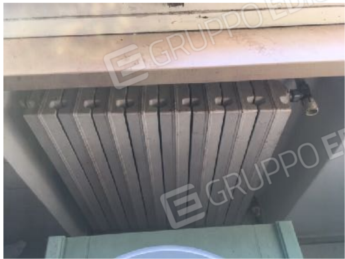
Particolare stato manutenzione serramenti esterni