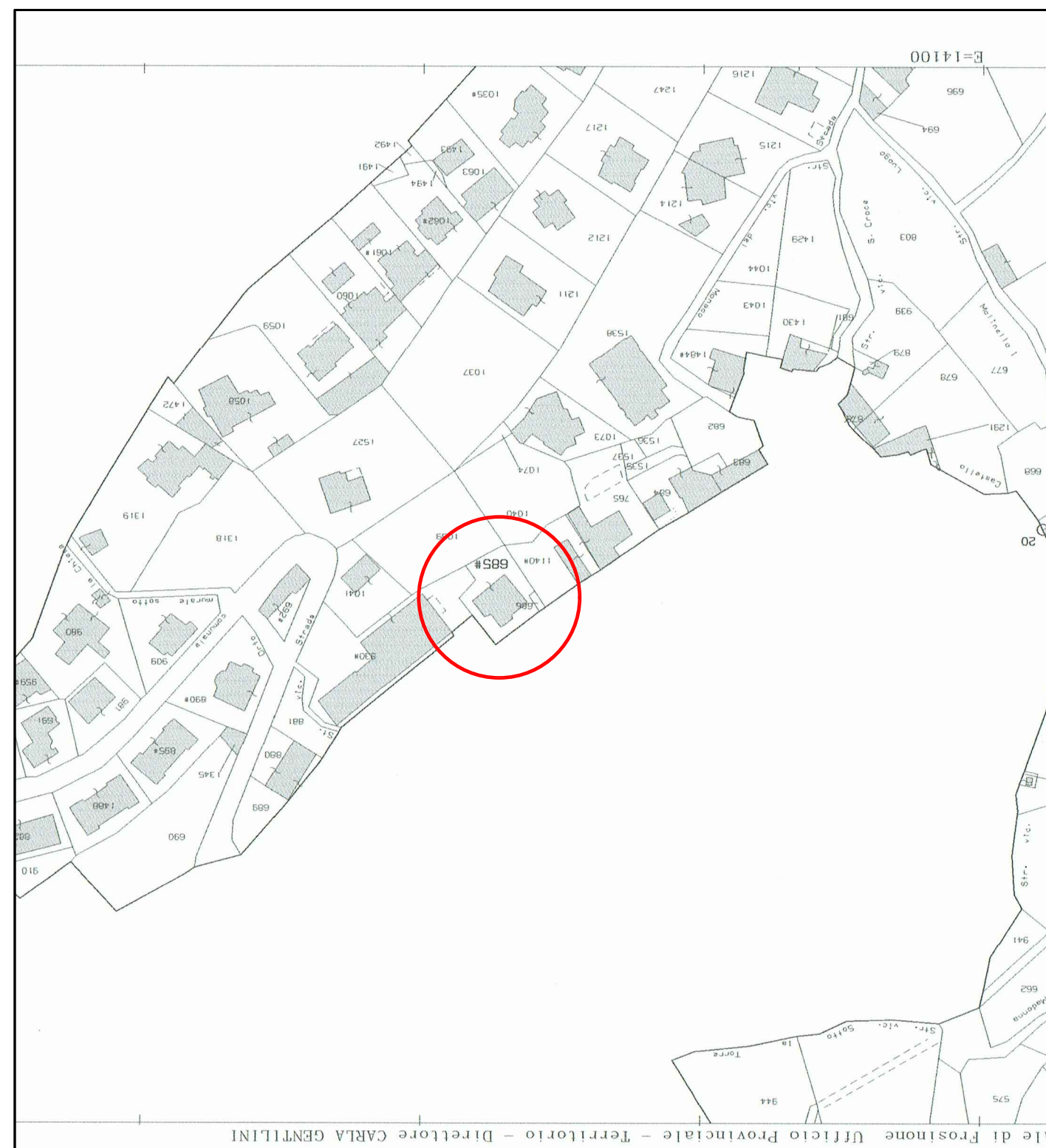
STRALCIO DI MAPPA CATASTALE Scala 1:2000 C.F.: - Foglio 8 Particella 685 sub 5

STUDIO TECNICO Geometra DANILCO COLETTA 03044 CERVARO (FR) Via Valle n. 2 Tel. 0776/360845 - cell. 338/8581200 e-mail: colettadani17@gmail.com - pec: danilo.coletta@geopco.it