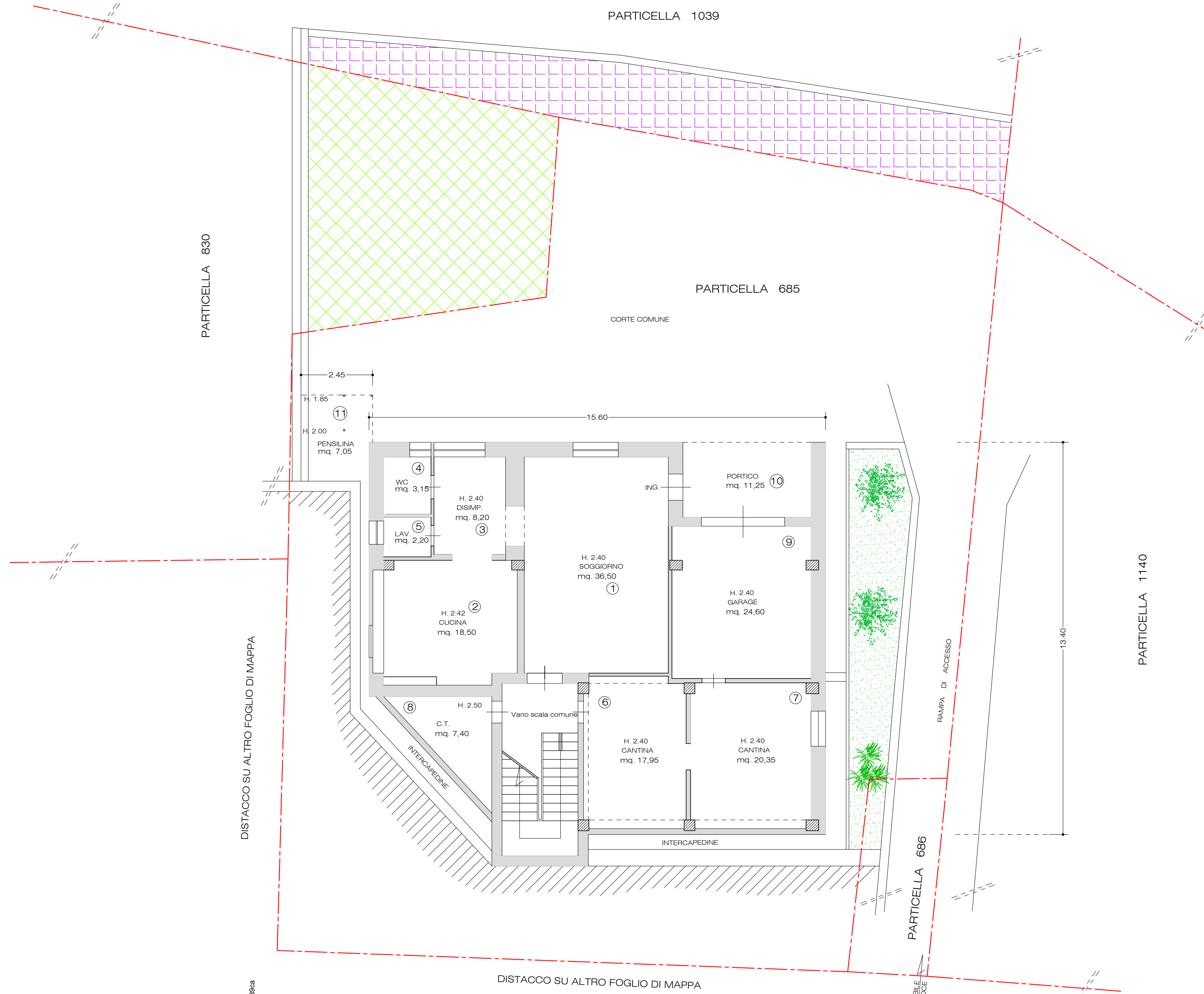
PIANO SECONDO SOTTOSTRADA SCALA 1:100

Come da sopralluogo eseguito in data 22/05/2022