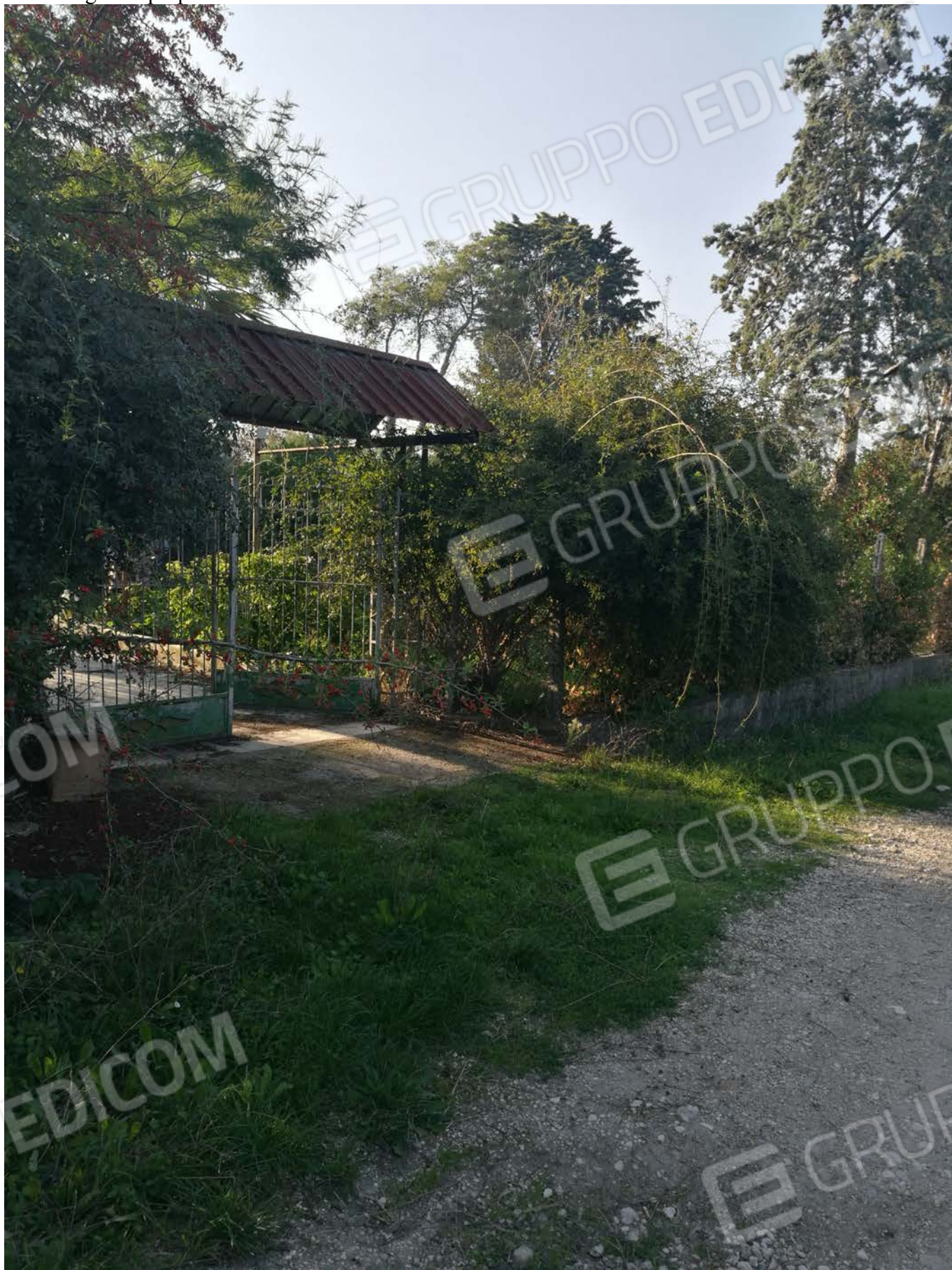
Foto 1 ingresso proprietà