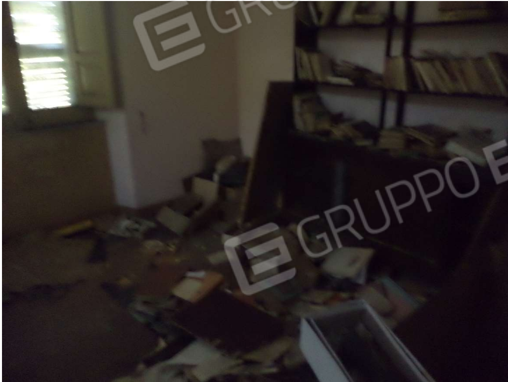
FOTO N° 12 Fabbricato adibito ad Abitazione di Tipo Economico al Piano T-1-S1, con Corte Esclusiva, ubicato in Via Nazionale n. 2 -4 – PARTICOLARE DEPOSITO PIANO S1 -

FOTO N° 11 Fabbricato adibito ad Abitazione di Tipo Economico al Piano T-1-S1, con Corte Esclusiva, ubicato in Via Nazionale n. 2 -4 – PARTICOLARE MAGAZZINO PIANO S1 -