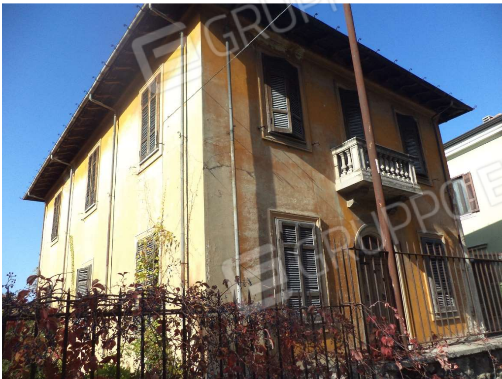
FOTO N° 2 Fabbricato adibito ad Abitazione di Tipo Economico al Piano Terra, al Piano Primo e Seminterrato, con Corte Esclusiva, ubicato in Via Nazionale n. 2 -4 -PROSPETTO EST - NORD

FOTO N° 1 Fabbricato adibito ad Abitazione di Tipo Economico al Piano Terra, al Piano Primo e Seminterrato, con Corte Esclusiva, ubicato in Via Nazionale n. 2 -4 - PROSPETTO EST - SUD