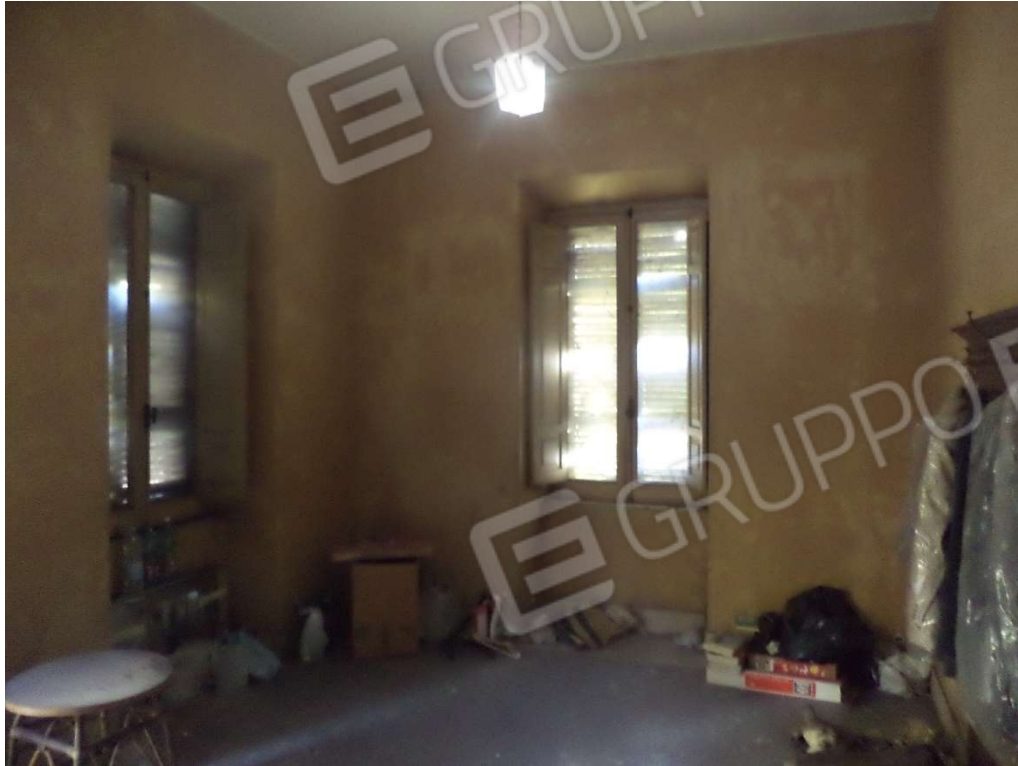
FOTO N° 6 Fabbricato adibito ad Abitazione di Tipo Economico al Piano T-1-S1, con Corte Esclusiva, ubicato in Via Nazionale n. 2 -4 – PARTICOLARE LETTO PIANO TERRA -

FOTO N° 5 Fabbricato adibito ad Abitazione di Tipo Economico al Piano T-1-S1, con Corte Esclusiva, ubicato in Via Nazionale n. 2 -4 – PARTICOLARE INGRESSO PIANO TERRA-