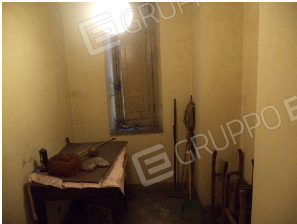
FOTO N° 8 Fabbricato adibito ad Abitazione di Tipo Economico al Piano T-1-S1, con Corte Esclusiva, ubicato in Via Nazionale n. 2 -4 – PARTICOLARE LETTO PIANO PRIMO -

FOTO N° 7 Fabbricato adibito ad Abitazione di Tipo Economico al Piano T-1-S1, con Corte Esclusiva, ubicato in Via Nazionale n. 2 -4 – PARTICOLARE STUDIO PIANO PRIMO -