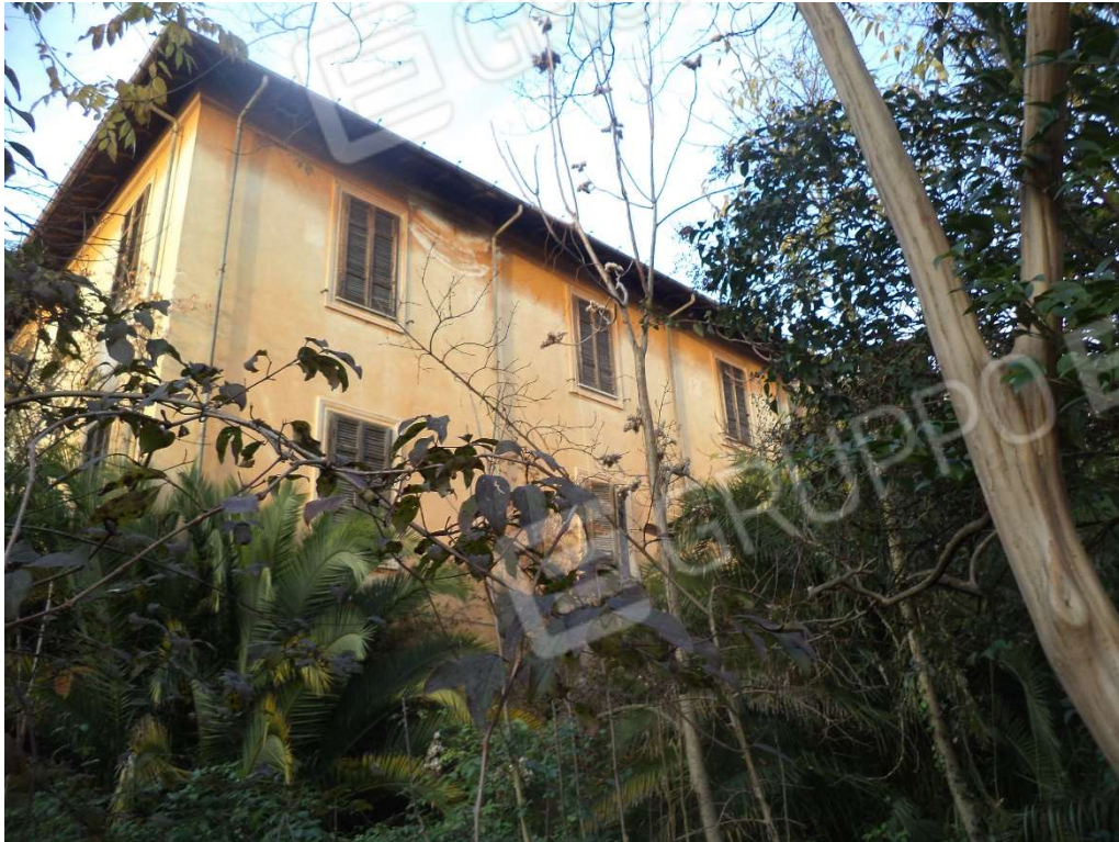
FOTO N° 4 Fabbricato adibito ad Abitazione di Tipo Economico al Piano Terra, al Piano Primo e Seminterrato, con Corte Esclusiva, ubicato in Via Nazionale n. 2 -4 - PROSPETTO SUD

FOTO N° 3 Fabbricato adibito ad Abitazione di Tipo Economico al Piano Terra, al Piano Primo e Seminterrato, con Corte Esclusiva, ubicato in Via Nazionale n. 2 -4 - PROSPETTO SUD