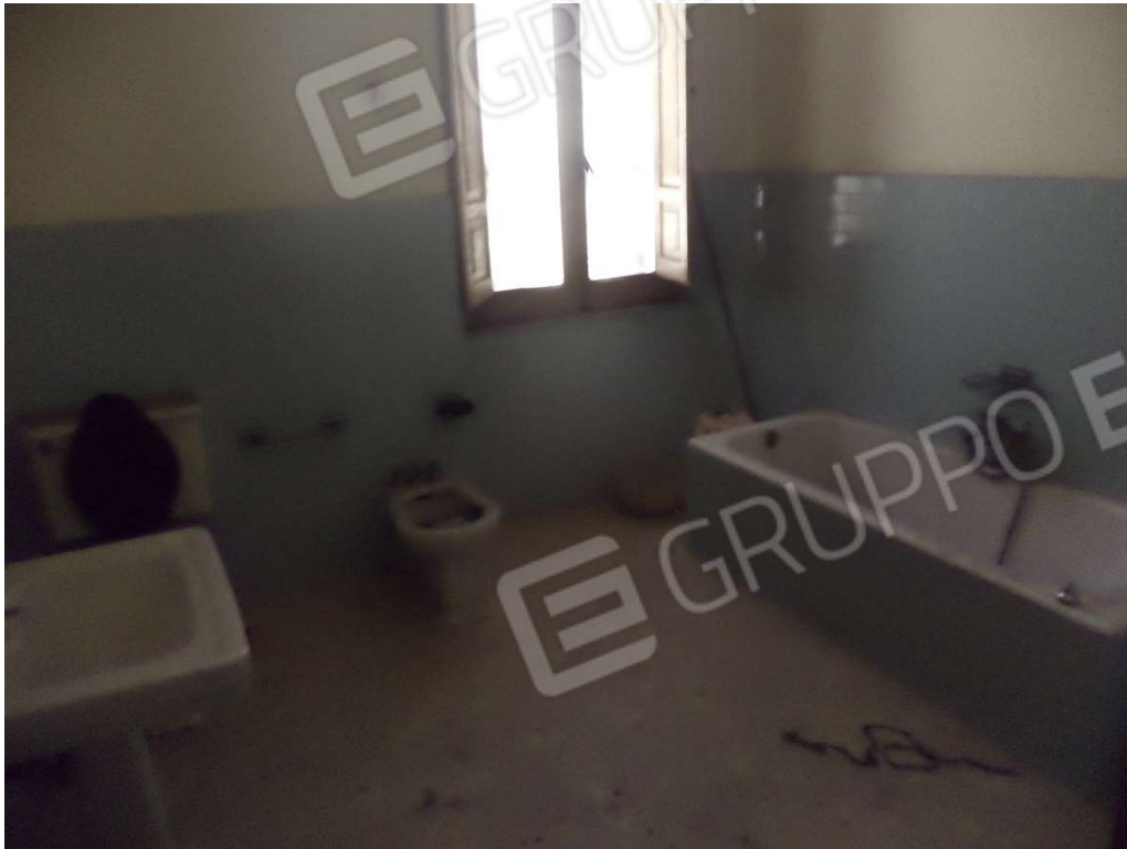
FOTO N° 10 Fabbricato adibito ad Abitazione di Tipo Economico al Piano T-1-S1, con Corte Esclusiva, ubicato in Via Nazionale n. 2 -4 – PARTICOLARE LETTO PIANO PRIMO -

FOTO N° 9 Fabbricato adibito ad Abitazione di Tipo Economico al Piano T-1-S1, con Corte Esclusiva, ubicato in Via Nazionale n. 2 -4 – PARTICOLARE BAGNO PIANO PRIMO -