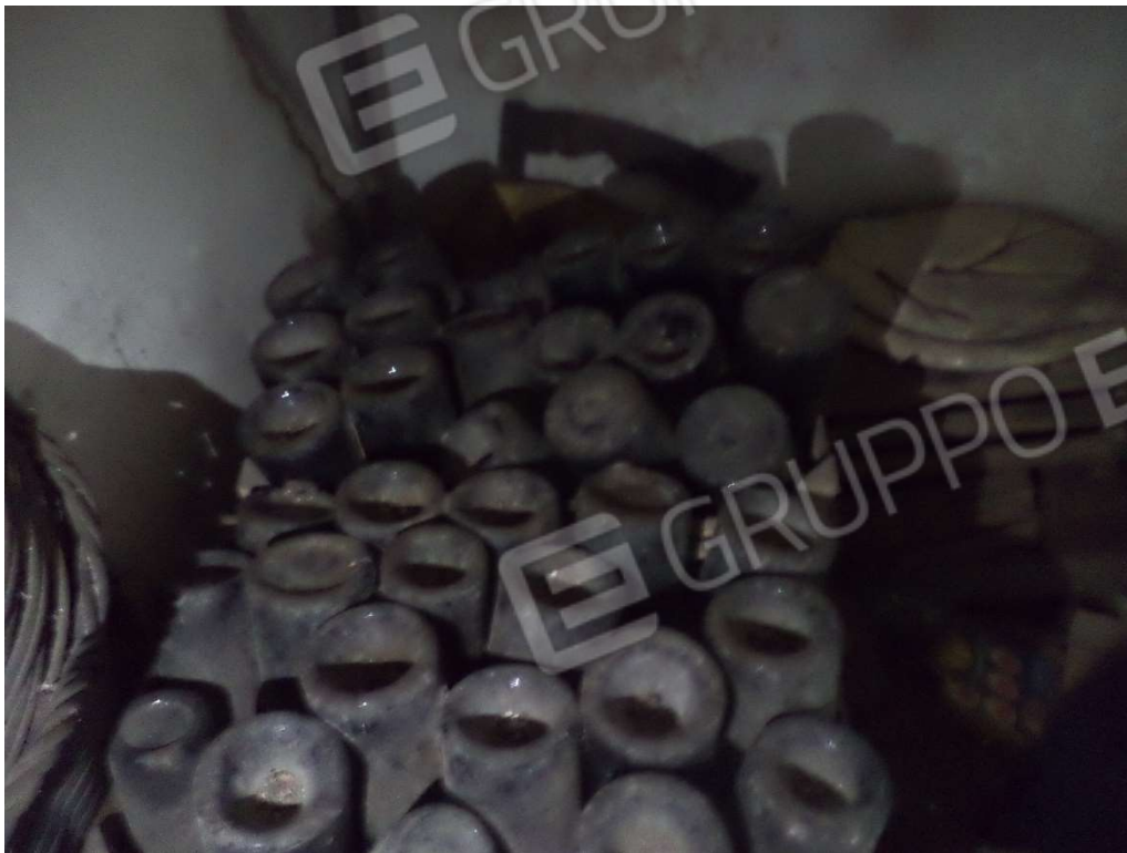
FOTO N° 14 Fabbricato adibito ad Abitazione di Tipo Economico al Piano T-1-S1, con Corte Esclusiva, ubicato in Via Nazionale n. 2 -4 – PARTICOLARE CANTINA PIANO S1 -

FOTO N° 13 Fabbricato adibito ad Abitazione di Tipo Economico al Piano T-1-S1, con Corte Esclusiva, ubicato in Via Nazionale n. 2 -4 – PARTICOLARE CANTINA PIANO S1 -