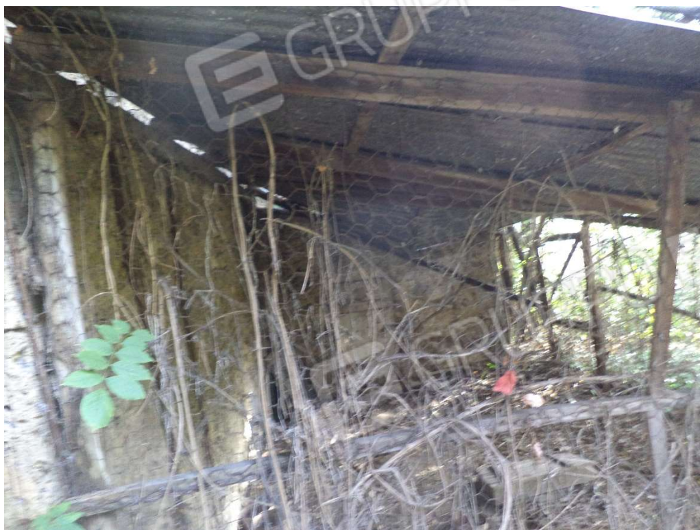
FOTO N° 8 Fabbricato adibito ad Abitazione di Tipo Popolare al Piano Terra e Seminterrato, con Corte Esclusiva, ubicato in Via Nazionale n. 4 - PROSPETTO OVEST