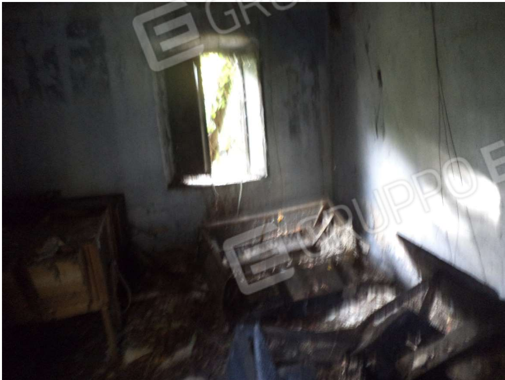
FOTO N° 10 Fabbricato adibito ad Abitazione di Tipo Popolare al Piano Terra e Seminterrato, con Corte Esclusiva, ubicato in Via Nazionale n. 4 - PARTICOLARE CUCINA PIANO TERRA -

FOTO N° 9 Fabbricato adibito ad Abitazione di Tipo Popolare al Piano Terra e Seminterrato, con Corte Esclusiva, ubicato in Via Nazionale n. 4 - PARTICOLARE SOGGIORNO PIANO TERRA -