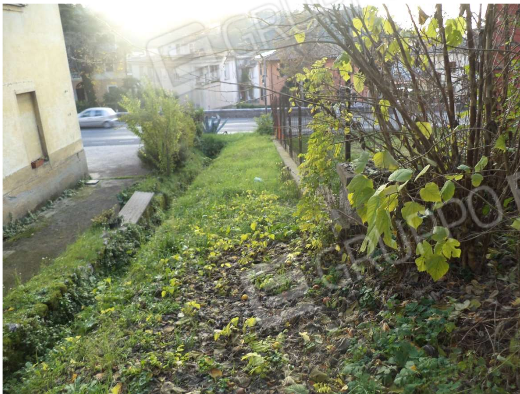
FOTO N° 6 Fabbricato adibito ad Abitazione di Tipo Popolare al Piano Terra e Seminterrato, con Corte Esclusiva, ubicato in Via Nazionale n. 4 - PARTICOLARE DEPOSITO PIANO S1 -