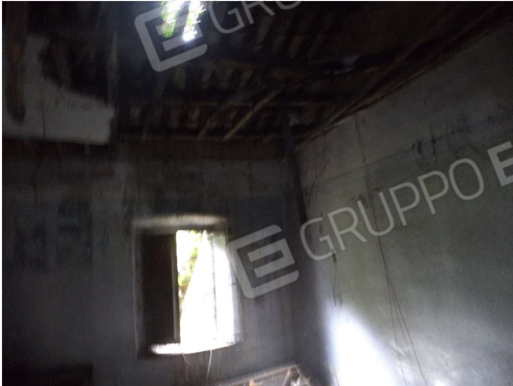
FOTO N° 12 Fabbricato adibito ad Abitazione di Tipo Popolare al Piano Terra e Seminterrato, con Corte Esclusiva, ubicato in Via Nazionale n. 4 - PARTICOLARE SOGGIORNO PIANO TERRA -

FOTO N° 11 Fabbricato adibito ad Abitazione di Tipo Popolare al Piano Terra e Seminterrato, con Corte Esclusiva, ubicato in Via Nazionale n. 4 - PARTICOLARE SOGGIORNO PIANO TERRA -