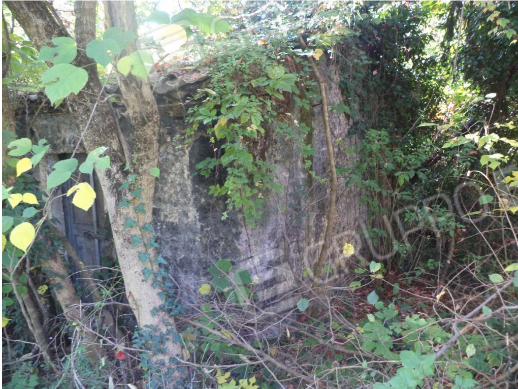
FOTO N° 2 Fabbricato adibito ad Abitazione di Tipo Popolare al Piano Terra e Seminterrato, con Corte Esclusiva, ubicato in Via Nazionale n. 4 - PROSPETTO EST

FOTO N° 1 Fabbricato adibito ad Abitazione di Tipo Popolare al Piano Terra e Seminterrato, con Corte Esclusiva, ubicato in Via Nazionale n. 4 - PROSPETTO EST