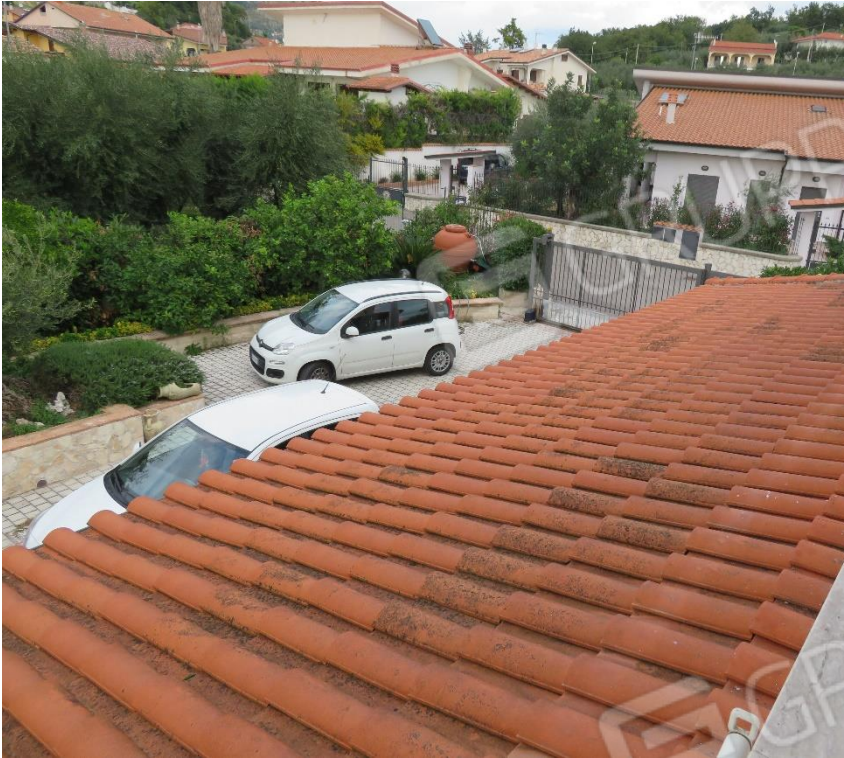
VISTA DEI POSTI AUTO ESTERNI DAL BALCONE DEL PIANO PRIMO