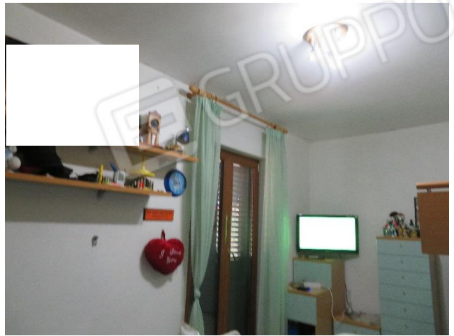
VISTE INTERNE DI DUE DELLE CAMERE AL PRIMO PIANO