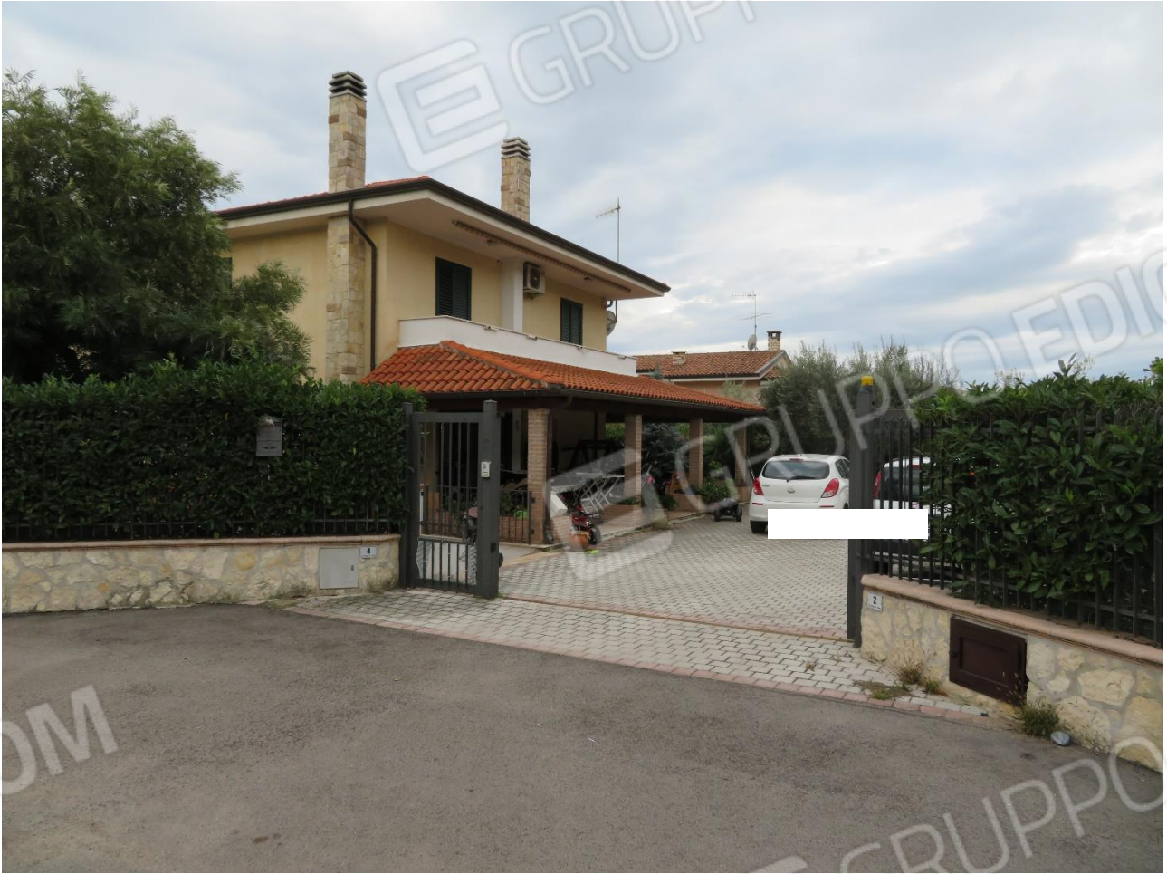
VISTA DELL'INGRESSO ALL'AREA ESTERNA E AL FABBRICATO DALLA STRADA COMUNALE