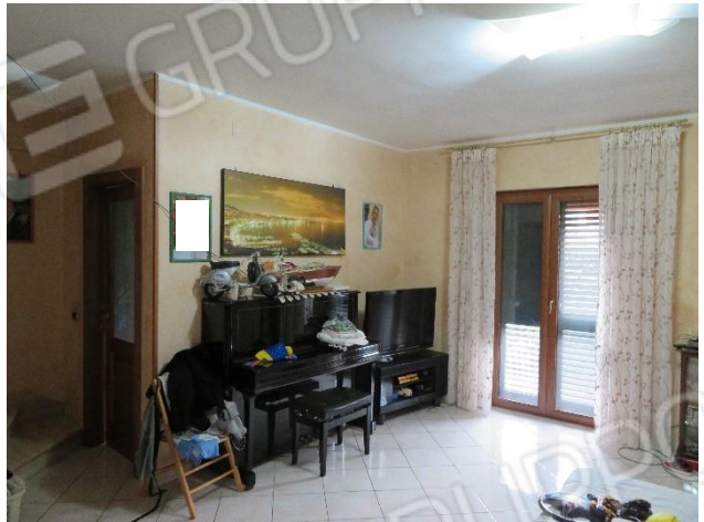
VISTE DELL'INTERNO DEL PIANO TERRA: CUCINA E SOGGIORNO