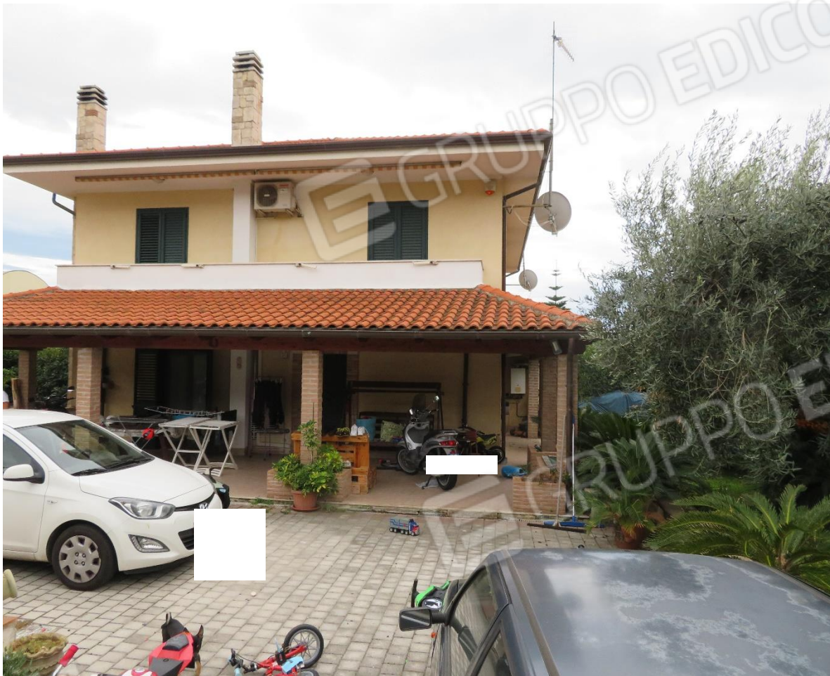
VISTA DELL'INGRESSO ALL'AREA ESTERNA E DEL PROSPETTO PRINCIPALE CON PORTA DI INGRESSO SOTTO IL PORTICO