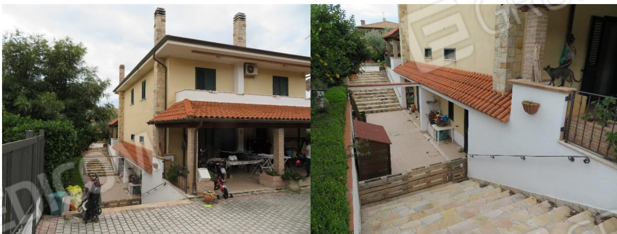
VISTE DELL'AREA ESTERNA E DELL'ACCESSO AL PIANO SEMINTERRATO