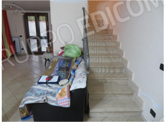
VISTE DELL'INTERNO DEL PIANO SEMINTERRATO E DELLA SCALA INTERNA DI ACCESSO ALLO STESSO