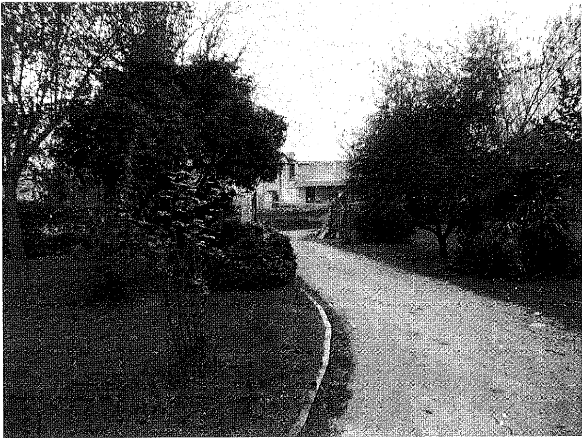
Foto n.3 – Le zone a giardino (a destra verso il Lotto n.2, a sinistra verso il Lotto 1)