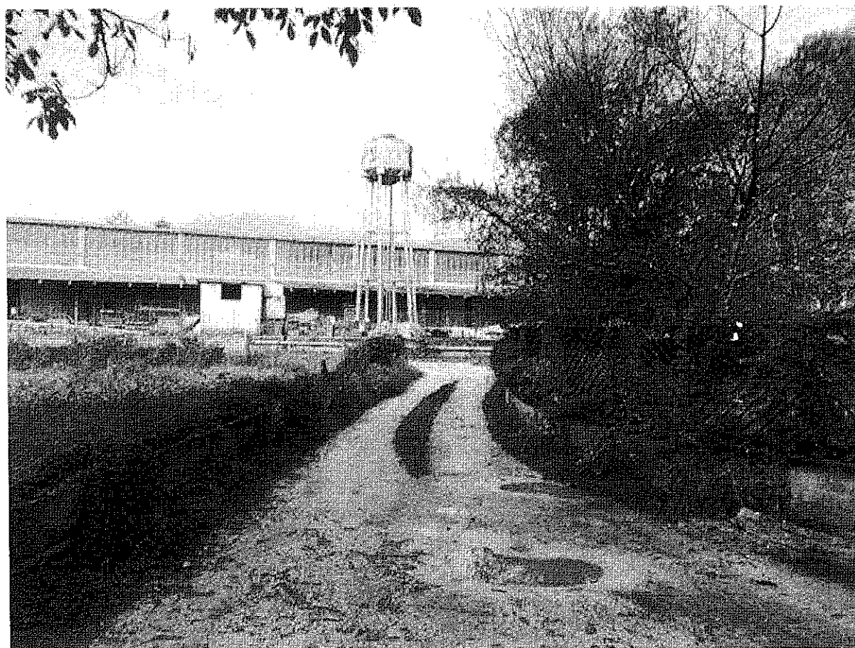
Foto n.8 – Vista dello stradello di accesso al fabbricato verso la strada vicinale Pantano. Sulla destra è il Lotto n.2