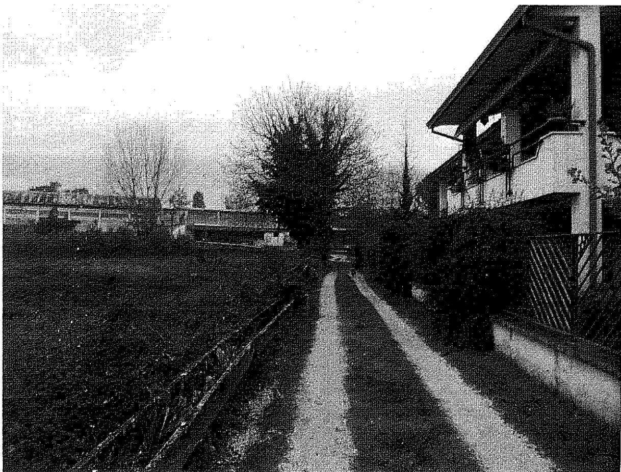
Foto n.6 – Vista dello stradello privato di accesso. Sulla sinistra è visibile il canaletto di irrigazione del Consorzio di bonifica (Lotto n.1).